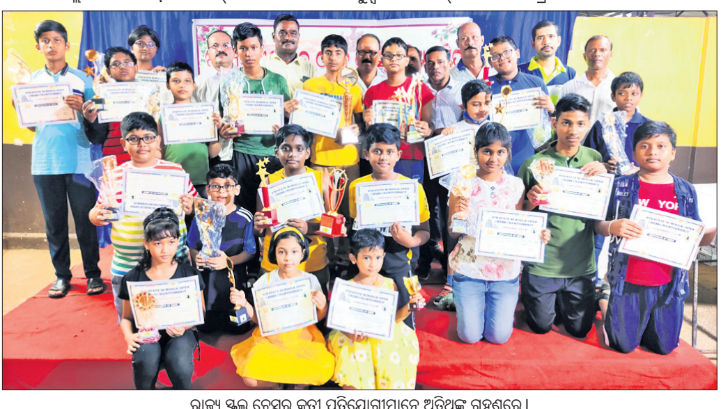
ରାଜ୍ୟ ସ୍କୁଲ୍ ଚେସ୍‌ରେ କୃତୀ ପ୍ରତିଯୋଗୀମାନେ ଅତିଥିଙ୍କୁ ଗହଣରେ ।

ଭୁବନେଶ୍ୱର, ୧୦୧୯ (କ୍ରୀଡ଼ା ପ୍ରତିନିଧି) ଆସୋସିଏଟସ ଆନୁକୁଲ୍ୟରେ ଭୁବନେଶ୍ୱର କେନ୍ଦ୍ରୀୟ ବିଦ୍ୟାଳୟ-ଲିଙ୍ଗରାଜ କ୍ଲବ ଏବଂ ଓଡ଼ିଶା ଚେସ୍ ଆୟୋଜିତ ରାଜ୍ୟ ସ୍କୁଲ୍ ଓପନ ଚେସ୍‌ରେ ୧୨ ତ୍ରିଦେବ ଚାମ୍ପିୟନ ଚାମ୍ପିୟନ