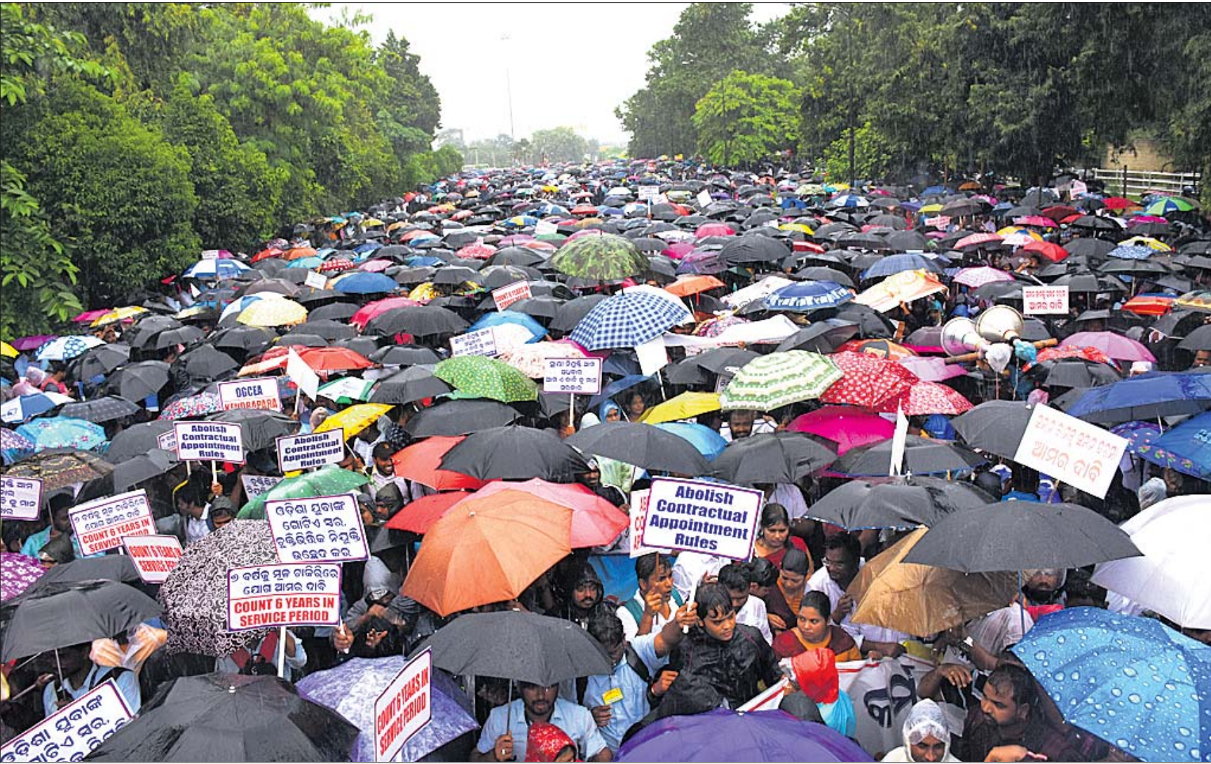
ଦାବି ଆଗରେ ବର୍ଷା ଫିକା: ବୃତ୍ତିଗତ ନିୟନ୍ତ୍ରଣ ଉଚ୍ଛେଦ ଓ ଧର୍ତ୍ତ୍ରି ଚଳାଚଳନ ପ୍ରମାଣିତ ହେବା ପାଇଁ ଗୋଟିଏ ଉପସ୍ଥାପନା ଦେଖାଯାଇଛି । ସମ୍ବଲପୁରରେ ପ୍ରମାଣିତ ହେବା ପାଇଁ ଧର୍ତ୍ତ୍ରି ଚଳାଚଳନ ପ୍ରମାଣିତ ହେବା ପାଇଁ ଗୋଟିଏ ଉପସ୍ଥାପନା ଦେଖାଯାଇଛି ।