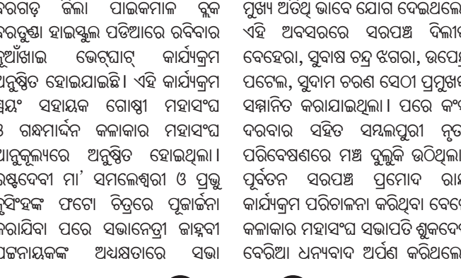
କାର୍ଯ୍ୟକ୍ରମରେ କୃତା ପ୍ରତିଭାଧାରୀଙ୍କୁ ସମ୍ମାନିତ କରାଯାଇଛି।

ହୋଇଥିଲା। ଏଥିରେ ନୂଆପଡ଼ା ଜିଲ୍ଲା ଡେପୁଟି କଲେକ୍ଟର ମହେନ୍ଦ୍ର ବଡ଼େଇ ମୁଖ୍ୟ ଅତିଥି ଭାବେ ଯୋଗ ଦେଇଥିଲେ।