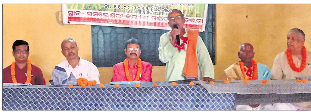
ଭେଟସାତ କାର୍ଯ୍ୟକ୍ରମରେ ମଞ୍ଚାଧୀନ ଅତିଥିବୃନ୍ଦ।

ବରଗଡ଼ ଜିଲ୍ଲା ଅତୀତରା ବ୍ଲକ ଅଧୀନ ଗୋଡ଼ଭଗା ସମାଜେଶ୍ୱରୀ ମନ୍ଦିର କଲ୍ୟାଣ ମଣ୍ଡପରେ ରବିବାର ଗୋଡ଼ଭଗା ନାଗରିକ କମିଟିର ନୂଆଁଖାଇ ଭେଟସାତ କାର୍ଯ୍ୟକ୍ରମ ଅନୁଷ୍ଠିତ ହୋଇଯାଇଛି।