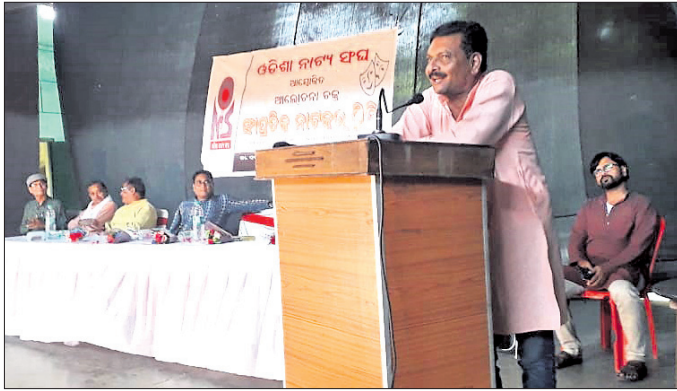
ନାଟକ ଆଲୋଚନାଚକ୍ରରେ ଉପସ୍ଥିତ ଆଲୋଚକବୃନ୍ଦ।

ଓଡ଼ିଶା ନାଟ୍ୟ ସଂଘ ପଶ୍ଚିମ ଓଡ଼ିଶା ଶାଖା ଓ ସୌଖିନ କଳାକାର ସଂଘର ମିଳିତ ସହଯୋଗରେ ସୌଖିନ ରଙ୍ଗମଞ୍ଚରେ ରବିବାର 'ସାମ୍ପ୍ରତିକ ନାଟକର ସ୍ଥିତି' ଉପରେ ଏକ ଆଲୋଚନାଚକ୍ର ଅନୁଷ୍ଠିତ ହୋଇଛି।