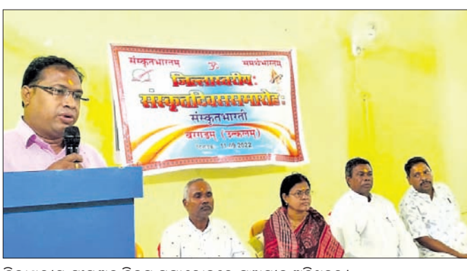
ଜିଲ୍ଲାପ୍ରତାପ ସଂସ୍କୃତ ଦିବସ ସମାବେଶରେ ମଞ୍ଚାଧୀନ ଅତିଥିବୃନ୍ଦ।

ବରଗଡ଼ ଅଫିସ, ୧୧।୯: ସଂସ୍କୃତ ଭାଷା ଭାରତୀୟ ସଂସ୍କୃତିର ଅନ୍ତରାତ୍ମା। ସଂସ୍କୃତ ଦିନା ଭାରତୀୟ ସଂସ୍କୃତି ଅସମ୍ପୂର୍ଣ୍ଣ। ସାମାଜିକ, ସାଂସ୍କୃତିକ ସଂସ୍କାର ପାଇଁ ଏହି ଭାଷାର ଗୁରୁତ୍ୱପୂର୍ଣ୍ଣ ଭୂମିକା ରହିଛି ବୋଲି ସ୍ଥାନୀୟ ରାଜ୍ୟପ୍ରତାପ ହାଇସ୍କୁଲରେ ଆୟୋଜିତ ସଂସ୍କୃତ ଦିବସ ପାଳନ ଅବସରରେ ବିଶିଷ୍ଟ ବ୍ୟକ୍ତିମାନେ ମତବ୍ୟକ୍ତ କରିଛନ୍ତି।