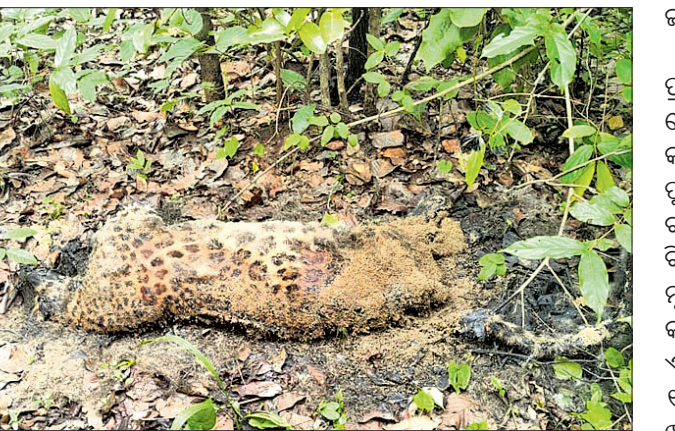
ମାଲ କଲରାପଡ଼ିଆ ବାଘର ମୃତଦେହ।

ନିଶ, ଗୋଡ଼ ଓ ନିଖା କାଟି ନେଇଛନ୍ତି ଦୁର୍ଭିକ୍ଷ ସୋନପୁର/ଉଲୁଆ, ୧୩।୯ (ନି.ପ୍ର./ଡି.ଏନ୍.ଏ.)