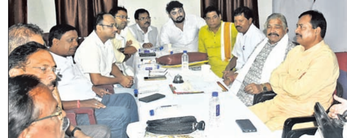
ବୈଠକରେ ଉପସ୍ଥିତ କଂଗ୍ରେସ ନେତୃତ୍ୱ। ଭୁବନେଶ୍ୱର, ୧୩।୯ (ଭୁଏସଏନଏ)

ଅଧିକ ଭାରତ କଂଗ୍ରେସ କମିଟି (ଏଆଇସିସି) ପକ୍ଷରୁ ରାଜ୍ୟ ଗାନ୍ଧୀ ନେତୃତ୍ୱରେ ଭାରତ ଯୋଡ଼ା ଯାତ୍ରା ଆରମ୍ଭ ହୋଇଛି। ଗୁଣ୍ଡା ଓ ବିତ୍ତସ୍ୱର ଆନ୍ଦୋଳନ ପରାହତ ସହ ଆକାଶକୁ ଆଦେଶ ଦେଇ ବିକ୍ରି କରାଯାଇଥିବା ପ୍ରସ୍ତୁତ ରାଜି ଏ. ରାଜୁଲ ଗାନ୍ଧୀ ଆକ୍ଷେପ କରୁଥିବା ଦଳ ପକ୍ଷରୁ କୁହାଯାଇଛି। ଅଧିକ ଅଧିକ ସଂଖ୍ୟାରେ ଲୋକ ଏହି ଯାତ୍ରାକୁ ସମର୍ଥନ ଜଣାଇଛନ୍ତି। ଏହି ଅବସରରେ ଓଡ଼ିଶା ପ୍ରଦେଶ କଂଗ୍ରେସ କମିଟି (ଓସିସିସି) ପକ୍ଷରୁ ପ୍ରଦେଶ କଂଗ୍ରେସ ନେତୃତ୍ୱରେ ବୈଠକରେ ଓ ପ୍ରକାଶ୍ୱର ନେତୃତ୍ୱରେ ବୈଠକରେ ରାଜୁଲ ଗାନ୍ଧୀ ଏହି ଯାତ୍ରାକୁ ସମର୍ଥନ