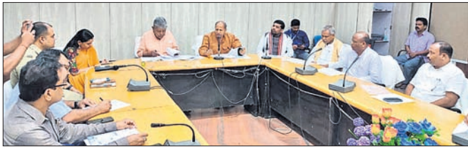
ବିଧାନସଭା ସଦାଗର କମିଟି ସଦସ୍ୟ, ରାୟଗଡ଼ା ଜିଲ୍ଲା ପ୍ରଶାସନିକ ଅଧିକାରୀ ଓ ଲୋକ ପ୍ରତିନିଧିମାନେ ବୈଠକରେ ଆଲୋଚନା କରୁଛନ୍ତି।

ରାଜ୍ୟ ବିଧାନସଭା ସଦାଗର କମିଟି ସଦସ୍ୟମାନେ ଦିନିକିଆ ରାୟଗଡ଼ା ଜିଲ୍ଲା ଗସ୍ତରେ ଆସିଛନ୍ତି। ଜନପ୍ରତିନିଧିଙ୍କ ଅଭିଯୋଗ ଉପରେ ବିଭିନ୍ନ କାର୍ଯ୍ୟାନୁଷ୍ଠାନ ଗ୍ରହଣ କରାଯାଇଛି ଯେ ସମ୍ପର୍କରେ ସେମାନେ ସମୀକ୍ଷା କରିଥିଲେ।