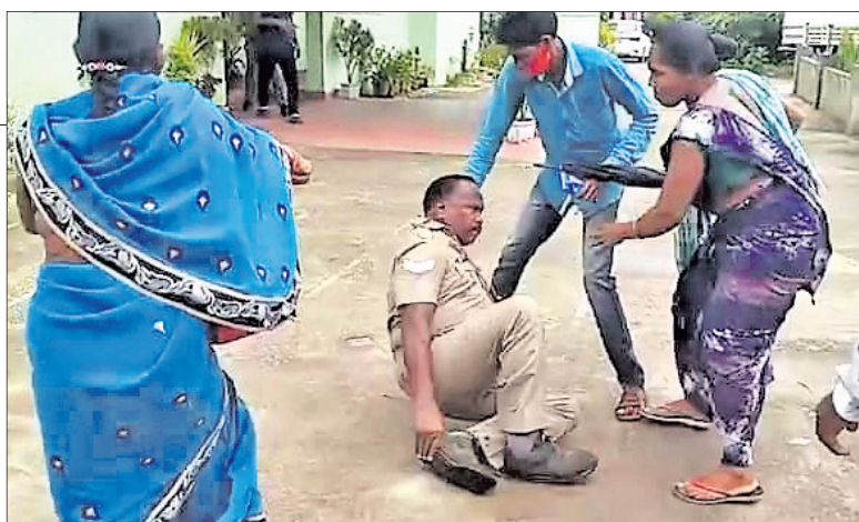
ଅଡ଼ବା ଆନାରେ ଗଞ୍ଜେଇ ପୋଲିସ କର୍ମଚାରୀଙ୍କୁ ପିଟୁଛନ୍ତି ଗ୍ରାମବାସୀ।

■ ଗଞ୍ଜେଇ ଚାଲାଣ ମାମଲାରେ ଯୁବକ ଗିରଫ ■ ଆନାରେ ଆଦିବାସୀଙ୍କ ଉଦ୍ଧାର