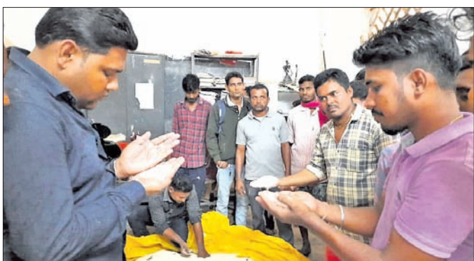
ଏକିକଠି ସ୍କୁଲରେ ଯାଞ୍ଚ କରୁଛନ୍ତି।

ନବରଙ୍ଗପୁର ଜିଲ୍ଲା ଉତ୍ତରକୋଟ ବ୍ଲକ ଅଧୀନ ବନ୍ଦୀୟ ମୂର୍ତ୍ତୀ ଗ୍ରାମରେ ଥିବା ୫ଟି ନୋଡାଲ ସରକାରୀ ସ୍କୁଲରେ ମଧ୍ୟାହ୍ନ ଭୋଜନରେ ପୋକରା ଚାଉଳ ରନ୍ଧା ହେବାକୁ ନେଇ ଉତ୍ତେଜନା ଦେଖାଦେଇଛି।