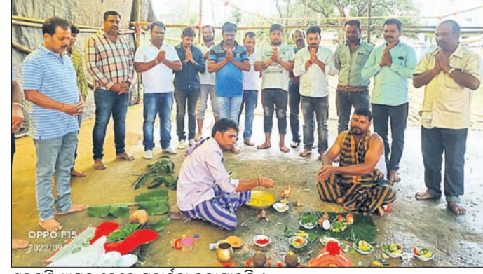
ଶୁଭଖୁଣ୍ଟି ସ୍ଥାପନ ବେଳେ ପୂଜାକର୍ମା କରାଯାଇଛି।