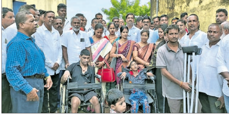
ଶିବିରରେ ଭିନ୍ନକ୍ଷମଙ୍କୁ ସହାୟତା ପ୍ରଦାନ କରାଯାଇଛି।

ପାଣିକୋଇଲିରୁ ମା' ଚାରିଶା ମହାବିଦ୍ୟାଳୟ ପରିସରରେ ମଙ୍ଗଳବାର ଭୀମଭୋଇ ଭିନ୍ନକ୍ଷମ ସାମର୍ଥ୍ୟ ଶିବିର ଅନୁଷ୍ଠିତ ହୋଇଯାଇଛି। ଏଥିରେ ୭୫୩ ଭିନ୍ନକ୍ଷମ ନାମ ପଞ୍ଜୀକରଣ କରିଥିବାବେଳେ ୧୨୫୫ଟି ବୁଲ୍ଡା ଚେୟାର, ୩୫୫ଟି ଟ୍ରାଲ୍ ସାଇକେଲ, ୩୫୫ଟି ଆଣ୍ଡା ବାଡି ପ୍ରଦାନ କରାଯାଇଥିଲା।