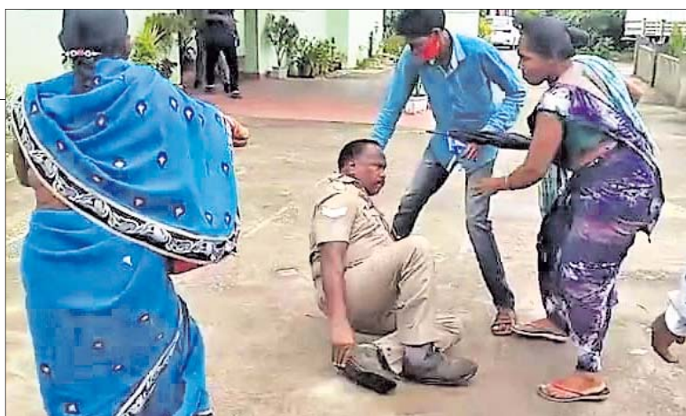
ଅନ୍ତର୍ଗତ ଆନାରେ ଜଣେ ପୋଲିସ କର୍ମଚାରୀଙ୍କୁ ପିଟୁଛନ୍ତି ଗ୍ରାମବାସୀ।

ପାରଳାଖେମୁଣ୍ଡି/ଆର୍.ଉଦୟଗିରି, ୧୩୯ (ଡି.ଏନ୍.ଏ.) ଗଜପତି ଜିଲ୍ଲା ଅନ୍ତର୍ଗତ ଆନାରେ ମଙ୍ଗଳବାର ସକାଳେ ଏକ ଅଭାବନୀୟ ଘଟଣା ଘଟିଛି। ଜଣେ ବ୍ୟକ୍ତିଙ୍କୁ ବେଆଇନ ଭାବେ ଗିରଫକାରୀ ପ୍ରତିବାଦରେ ୫୦୦ରୁ ଊର୍ଦ୍ଧ୍ୱ ଲୋକ ଆନାରେ ପଶି ପୋଲିସକୁ ଅତୀକ୍ରମ ଆକ୍ରମଣ କରିଛନ୍ତି। ଏଥିରେ ୮ ପୋଲିସ କର୍ମଚାରୀ ଆହତ ହୋଇଛନ୍ତି। କେବଳ ଏତିକି ନୁହେଁ, ଉଭୟ ଲୋକେ ଆନାରେ ଉଦ୍ଧାର କରିବା ସହ ନ୍ୟାୟ ଦାବିରେ ଧାରଣା ଦେଇଛନ୍ତି। ଅନ୍ତର୍ଗତ ଖରଣାପୁର ଗ୍ରାମରେ ସୋମବାର ବଳିଷ୍ଠ ଟ୍ରାକ୍ଟର-୪