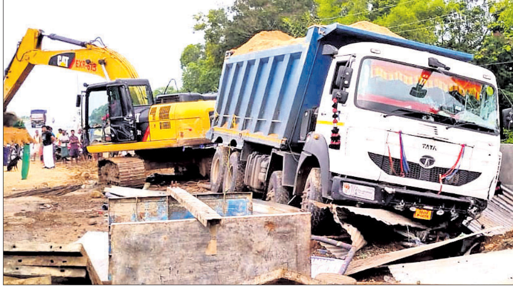
କ୍ୟାମ୍ପ ଉପରେ ମାଡ଼ିଯାଇଥିବା ହାଇଡ୍ରା।