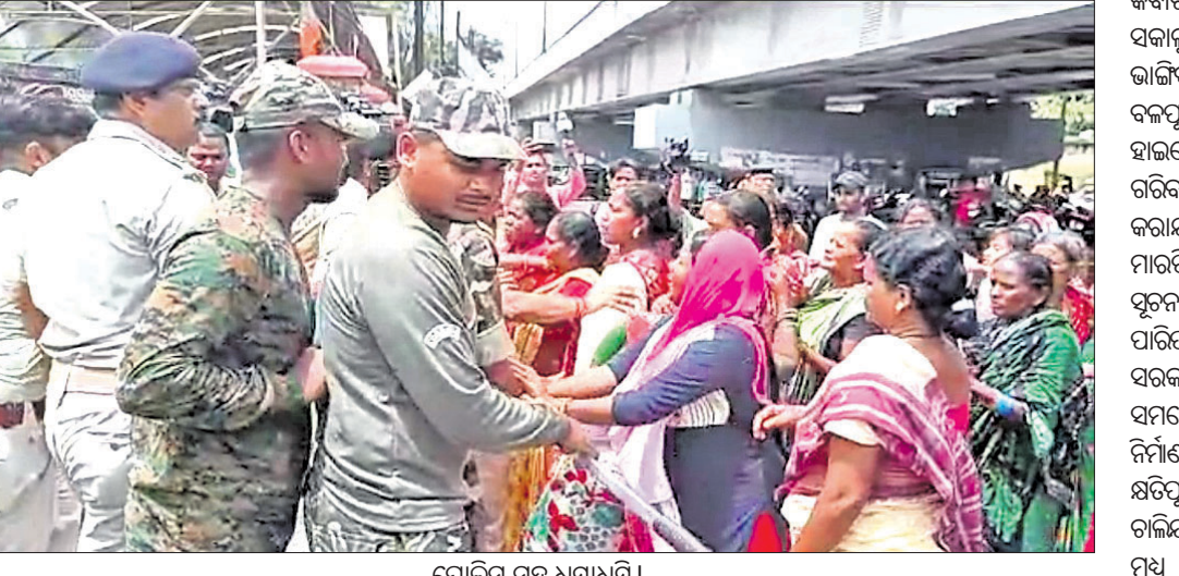
ପୋଲିସ୍ ସହ ଧସ୍ତାଧସ୍ତି।

ପ୍ରକାଶ ଯେ, ସମଲେଇ ଯୋଜନାରେ ଭୁନୁଟିପଡା ଉଚ୍ଛେଦ ହେଉଛି। ପୂର୍ବରୁ ଅନେକ ଘର ଭାଙ୍ଗିଥିବାବେଳେ କେତେକ ଘର ରହିଯାଇଛି। ଅବଶିଷ୍ଟ ଘରର ଲୋକେ ଅଭିଯୋଗ କରୁଛନ୍ତି, ସୋମବାର ବିଳମ୍ବିତ ରାତିରେ ପୋଲିସ୍ କର୍ମଚାରୀ ଘରକୁ ଆସି କବାଟ ବାଡେଇ ଉଠାଇଥିଲେ। ପରେ ସକାଳୁ ପ୍ରଶାସନ ପୋଲିସ୍ ଲାଗାଇ ଘର ଭାଙ୍ଗିବାକୁ ଆସିଥିଲେ। ୩କୋଟି ଘର ବକପୂର୍ବକ ଭାଙ୍ଗିଦେଇଛନ୍ତି। ଏହି ମାମଲା ହାଇକୋର୍ଟରେ ବିଚାରାଧୀନ ଥିବାବେଳେ ଗରିବ ପରିବାର ଉପରେ କ୍ଲାନି କରାଯାଉଛି। ବିରୋଧ କରିବା ପରେ ମାରପିଟ କରି ଥାନାକୁ ନେଇଯାଇଥିଲେ। ସୂଚନାଯୋଗ୍ୟ, ସମଲେଇ ମନ୍ଦିର ପାରିପାଶ୍ୱିକ ଉନ୍ନତି ପାଇଁ ରାଜ୍ୟ ସରକାର ପ୍ରାୟ ୨୫୦ କୋଟି ଟଙ୍କାର ସମଲେଇ ଯୋଜନା କରିଛନ୍ତି। ପ୍ରକୃତ ନିର୍ମାଣାଧୀନ ରହିଛି। ଅନେକ ପରିବାର କ୍ଷତିପୂରଣ ନେଇ ନିଜିଆଡ଼ ଘର ଛାଡ଼ି ଚାଲିଯାଇଛନ୍ତି। ଅନ୍ୟ ଦିସ୍ତାପିତଙ୍କ ପାଇଁ ମଧ୍ୟ ସ୍ୱତନ୍ତ୍ର ଧ୍ୟାକେନ୍ଦ୍ର କରାଯାଇଛି।