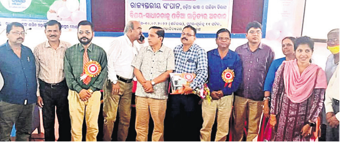
ଆଲୋଚନାଚକ୍ରରେ ଉପସ୍ଥିତ ଅତିଥି।