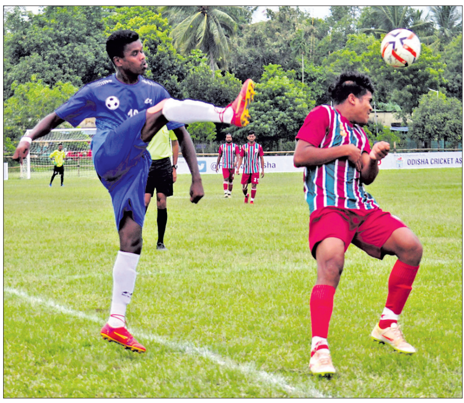
ରାଇଜିଂ ଷ୍ଟାର କ୍ଲବ୍ ଓ ଷ୍ଟୋର୍ସ୍ ହଷ୍ଟେଲ ମଧ୍ୟରେ ଅନୁଷ୍ଠିତ ମ୍ୟାଚ।

ଭୁବନେଶ୍ୱର, ୧୩୯ (କ୍ରୀଡ଼ା ପ୍ରତିନିଧି) ଯୁଟିଏଲ୍ ଆସୋସିଏଟସ୍ ଅଫ୍ ଓଡ଼ିଶା (ଫାଓ) ଆନୁକୂଲ୍ୟରେ କଟକରେ ଚାଲିଥିବା ସୁପର କପ୍ ଯୁଟିଏଲ୍ ଟୁର୍ନାମେଣ୍ଟର ମଙ୍ଗଳବାର ଅନୁଷ୍ଠିତ ଚତୁର୍ଥାୟ କ୍ୱାର୍ଟର ଫାଇନାଲରେ ରାଇଜିଂ ଷ୍ଟାର କ୍ଲବ୍ ୩-୧ ଗୋଲରେ ଷ୍ଟୋର୍ସ୍ ହଷ୍ଟେଲକୁ ପରାସ୍ତ କରିଛି। ଏଥିପାଇଁ ରାଇଜିଂ