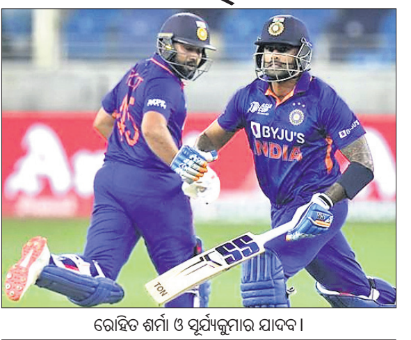
ରୋହିତ ଶର୍ମା ଓ ପୂର୍ଣ୍ଣାକୁମାର ଯାଦବ।

ରୁଆବିକ୍ଷା, ୧୩୯ (ପି.ଟି.) ଏସିଆ କପ ଡି ୨୦ କ୍ରିକେଟ ଟୁର୍ନାମେଣ୍ଟରେ ଭାରତୀୟ ଦଳ ଅତ୍ୟନ୍ତ ଦୟନୀୟ ପ୍ରଦର୍ଶନ ସହିତ ସୁପର-୪ ପର୍ଯ୍ୟାୟକୁ ବିଦାୟ ନେଇଥିଲା। ଭାରତୀୟ ଦଳର ଏହି ବିପକ୍ଷକୁ ନେଇ ବିସିସିଆଇ ପକ୍ଷରୁ ଏକ ସମୀକ୍ଷା କରାଯାଇଥିଲା। ସତ୍ୟାପିତ ସୌର ଗାଲୁଲି, ସମ୍ପାଦକ ଜୟ ଶାହ ଓ କାତାୟ ରୟନ କମିଟିକୁ ନେଇ ଏହି ସମୀକ୍ଷା ଦୈନିକ ଅନୁଷ୍ଠିତ ହୋଇଥିଲା। ଭାରତର ଖରାପ ପ୍ରଦର୍ଶନ ପାଇଁ ମିଡିଲ ଓଭର ବ୍ୟାଟିଂ ଦାୟୀ ବୋଲି ଏହି ଦୈନିକ ପରେ କୁହାଯାଇଛି। ଆସକ୍ଷ ଅକ୍ଟୋବର ୧୬ ତାରିଖରୁ ଅନୁଷ୍ଠିତ ହେବାକୁ ଥିବା ବିଶ୍ୱକପ ଓ ଅଷ୍ଟ୍ରେଲିଆ ଓ ଦକ୍ଷିଣ ଆଫ୍ରିକା ବିପକ୍ଷ ଡି ୨୦ ବିଲି ପାଇଁ ସାମସନଙ୍କ ଦଳ ଘୋଷଣା କରାଯାଇଥିଲା। ଦଳ ଘୋଷଣା ସହିତ ଗାଲୁଲି ଓ ଶାହା ରୟନଙ୍କର ସହିତ ଏସିଆ କପ୍ ବିପକ୍ଷରେ ପୋଷ୍ଟମର୍ଟମ୍ କରିଥିଲେ। ତେବେ କେବଳ ସମସ୍ୟା ସମ୍ପର୍କରେ ଆଲୋଚନା କରିବା ପରିବର୍ତ୍ତେ ଏହାର ସମାଧାନ ବାହାର କରିବା ଉପରେ ଅଧିକ ଗୁରୁତ୍ୱ ଦିଆଯାଇଥିଲା। ଆସକ୍ଷ ଡି ୨୦ ବିଶ୍ୱକପରେ କେଉଁ ଦିଗରେ ଉନ୍ନତି ଆବଶ୍ୟକ