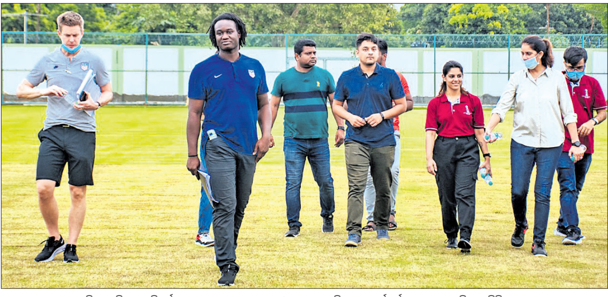
କଳିଙ୍ଗ ଷ୍ଟାଡ଼ିୟମ ପରିଦର୍ଶନ ଅବସରରେ ରାଜ୍ୟ କ୍ରୀଡ଼ା ଓ ଯୁବସେବା ବିଭାଗର କର୍ମଚାରୀଙ୍କ ସହ ଆମେରିକା ପ୍ରତିନିଧିଦଳ।

ଭୁବନେଶ୍ୱର, ୧୩୯ (କ୍ରୀଡ଼ା ପ୍ରତିନିଧି) ଅକ୍ଟୋବର ୧୧ରୁ ୩୦ ପର୍ଯ୍ୟନ୍ତ ଭାରତର ଗତି ଭେଙ୍ଗୁଥିବା ୧୭ ବର୍ଷରୁ କମ୍ ମହିଳା ଫିଟା ବିଶ୍ୱକପ ଅନୁଷ୍ଠିତ ହେବ। ଭାର ନେବାକୁ ଯାଉଥିବା ୧୬ଟି ଦଳ ମଧ୍ୟରୁ ଆମେରିକାର ଏକ ପ୍ରତିନିଧି ମଣ୍ଡଳୀ ସମ୍ପ୍ରତି ଭାରତ