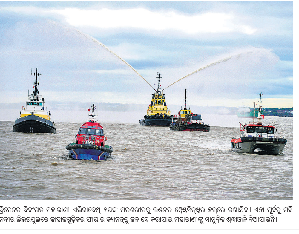
ବ୍ରିଟେନର ଦିବ୍ୟଗତ ମହାରାଣୀ ଏଲିଜାବେଥ ୨ୟଙ୍କ ମରଗରୀରୁ ଲଣ୍ଡନର ଫ୍ରେସ୍ ନିକ୍ଷର ହଲରେ ରଖାଯିବ। ଏହା ପୂର୍ବରୁ ମର୍ଦ୍ଦି ନଦୀର ଲିଭରପୁଲରେ ଜାହାଜଗୁଡ଼ିକର ଫାୟାର କ୍ୟାମ୍ପରୁ ଜଳ ସ୍ତ୍ରୋ କରାଯାଇ ମହାରାଣୀଙ୍କୁ ସାମୁଦ୍ରିକ ଶୁଖାଖଳି ଦିଆଯାଇଛି।

ମୁମ୍ବାଇର ଏକ ପ୍ରାଇଭେଟ ଲକରୁ ପ୍ରବର୍ତ୍ତନ ନିର୍ଦ୍ଦେଶାଳକ (ଇଡି) ୯୧.୫ କୋଟି ସୁନା ଏବଂ ୧୫୨ କୋଟି ଓଜନର ରୁପା ଜବତ କରିଛି। ଜବତ ସୁନା ଓ ରୁପାର ବଜାର ମୂଲ୍ୟ ୪୭ କୋଟି ଟଙ୍କା ରହିଛି। ମନି ଲଣ୍ଡନିଂ ନେଇ ସୁନା ବାର୍ ନିର୍ମାଣକାରୀ କମ୍ପାନୀରେ ଇଡି ଚଳାଉ କରିଥିବାବେଳେ ରୁଧିରା ଏହାର ପ୍ରାଇଭେଟ ଲକର ସର୍ଜି କରାଯାଇଥିଲା। ଆଉ ଏକ ଲକରରୁ ୧୮୮ କୋଟିର ରୁପା ଇଡିର ହସ୍ତଗତ ହୋଇଛି।