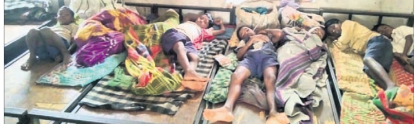
ଡେଣୁଆ ଉଚ୍ଚ ପ୍ରାଥମିକ ବିଦ୍ୟାଳୟ ହଷ୍ଟେଲରେ ଗୋଟିଏ ଖଟରେ ୨୫ଜଣ ଲେଖାଏଁ ଛାତ୍ରଛାତ୍ରୀ ଶୋଇଛନ୍ତି।