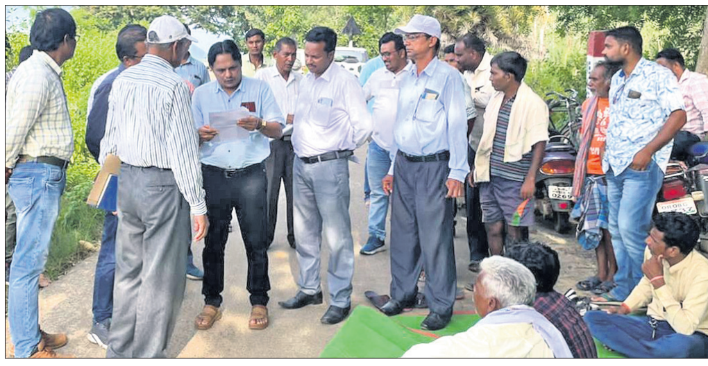
ଆୟୋଜନକାରୀଙ୍କୁ ବୁଝାଣୁଆ କରାଯାଇଛି ।

ପ୍ରକଳ୍ପଗୁଡ଼ିକ ଜନପ୍ରତିନିଧିଙ୍କ ସହମତିରେ ହେବ ବୋଲି ପ୍ରସ୍ତାବ ଗ୍ରହଣ ହେଉଛି । କିନ୍ତୁ ଜନପ୍ରତିନିଧିଙ୍କ ମଧ୍ୟରେ ମତାନ୍ତର ଯୋଗୁଁ ଅନେକ ପଞ୍ଚାୟତରେ ଉନ୍ନୟନ କାର୍ଯ୍ୟ ବାଧ୍ୟ ହେଉଛି । ଫଳରେ ଦୋହଲିରେ ପଡିଯାଇଛି ସରକାରୀ କର୍ମଚାରୀ । ଉନ୍ନୟନ କାର୍ଯ୍ୟ ଆଗେଇ ପାଉନାହିଁ ବୋଲି ବୁଦ୍ଧିଜୀବି ମହଲରେ ଆଲୋଚନା ହେଉଛି । ଏଦିଗରେ ଜିଲାପାଳ ସ୍ୱତନ୍ତ୍ର ଦୃଷ୍ଟି ଦେଇ ଜନସାଧାରଣଙ୍କ ସ୍ୱାର୍ଥ ଦୃଷ୍ଟିରୁ ପାଣି ଦିନିଯୋଗ ଦିଗରେ ପଦକ୍ଷେପ ନେବାକୁ ସାଧାରଣରେ ଦାବି ହେଉଛି ।