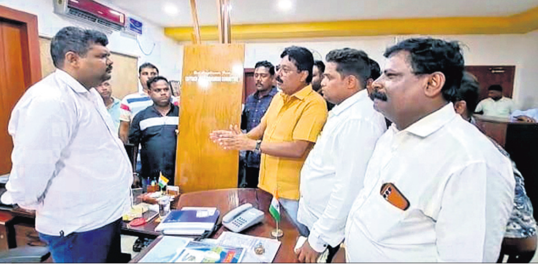
କଟକ ଜିଲ୍ଲା କଂଗ୍ରେସ ପକ୍ଷରୁ ମେୟରଙ୍କ ଉଦ୍ଦେଶ୍ୟରେ ସିଏମ୍ସି କମିଶନରଙ୍କୁ କବୀଚ ପ୍ରଦାନ କରାଯାଇଛି।