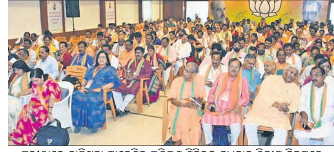
ପୁରୀଠାରେ ଚାଲିଥିବା ପ୍ରାଦେଶିକ ପ୍ରଶିକ୍ଷଣ ଶିବିରର ରୁଧିରୀ ଦିବସରେ ଯୋଗଦେଇଥିବା ଭାଜପା କର୍ମକର୍ତ୍ତା ଓ ନେତୃତ୍ୱ।

ଆଡ଼କୁ ନେବା ପାଇଁ ଭାଜପା ପ୍ରୟାସ କରିଥିଲା। ଦିଲ୍ଲୀରେ ମଧ୍ୟ ସମାନ ଚେଷ୍ଟା କରି ଭାଜପା ବିଫଳ ହୋଇଥିଲା। ସୂଚନାଯୋଗ୍ୟ, ରୁଧିରୀ ଗୋଆରେ ବଡ଼ ରାଜନୈତିକ ଓଲଟପାଲଟ ଦେଖିବାକୁ ମିଳିଥିଲା। ପୂର୍ବତନ ମୁଖ୍ୟମନ୍ତ୍ରୀ ବିରାମ କାମତ, ବିରୋଧୀ ଦଳର ନେତା ମାଇକେଲ ଲୋବୋଙ୍କ ସମେତ କଂଗ୍ରେସର ୮ ବିଧାୟକ କଂଗ୍ରେସ ଛାଡ଼ି ଭାଜପାରେ ଯୋଗଦେଇଥିଲେ।