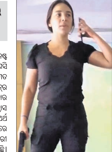
ସାଙ୍ଗରେ ନେଇଥିଲେ ଖେଳଣା ବନ୍ଧୁକ

୫୦ ହଜାର ଡଲାର ଆବଶ୍ୟକ। ତାଙ୍କ ପରିବାର ଡିପେଣ୍ଡେଣ୍ଟ କରିଥିବା ୨୦ ହଜାର ଡଲାରରୁ ପ୍ରାୟ ୧୩ ହଜାର ଡଲାର ସେ ନେଇଥିବା ନିତିଆ ଆଗରେ କହିଛନ୍ତି। ଲୁଟ୍ ବେଳେ ସେ ଖେଳଣା ବନ୍ଧୁକ ଧରିଥିଲେ ବୋଲି ପ୍ରକାଶ କରିଛନ୍ତି। ନାହିଁ କିମ୍ପା ରୁଲି ଚଳାଇବି ନାହିଁ। ମୋ ଅଧିକାର ସାବ୍ୟସ୍ତ କରିବାକୁ ବ୍ୟାଙ୍କରେ ପହଞ୍ଚିଛି ବୋଲି ସେ ଭିଡ଼ିରେ କହୁଥିବା ଶୁଣାଯାଇଛି। କ୍ୟାନ୍ସର ଚିକିତ୍ସା ପାଇଁ