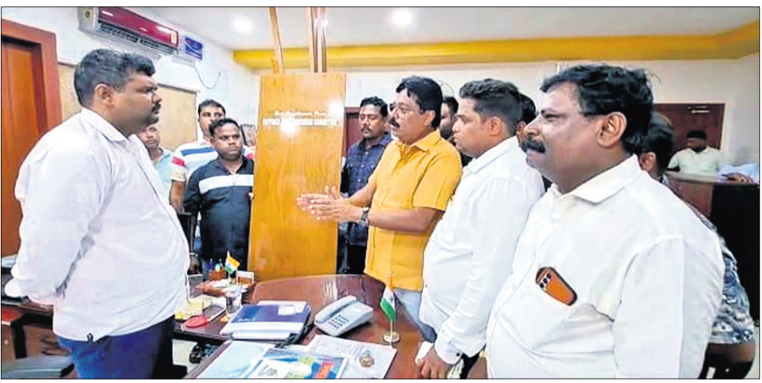
କଟକ ଜିଲ୍ଲା କଂଗ୍ରେସ ପକ୍ଷରୁ ମେୟରଙ୍କ ଉଦ୍ଦେଶ୍ୟରେ ସିଏମ୍‌ସି କର୍ମଚାରୀଙ୍କୁ କବାଟ ପ୍ରଦାନ କରାଯାଇଛି।