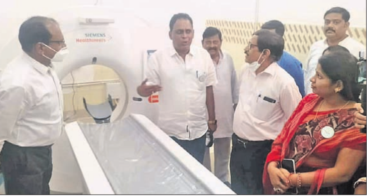
ସିଟି ସ୍କାନ ମେଶିନକୁ ସ୍ୱାଗ୍ଧ୍ୟମନ୍ତ୍ରୀ ନବ ଜିଶୋର ଦାସ ଉଦଘାଟନ କରୁଛନ୍ତି।

ଭୁବନେଶ୍ୱର, (ଭୁସରୋ)/ଝାରସୁଗୁଡ଼ା ଅଫିସ, ୧୪।୯ ନକଲି ଔଷଧ କାରବାର ରୋକିବାକୁ ରାଜ୍ୟରେ ଚଢ଼ାଉ କରାଯାଇଛି। ଆଗକୁ ସବୁ ଜିଲ୍ଲାରେ ଚଢ଼ାଉ ପାଇଁ ନିର୍ଦ୍ଦେଶ ଦିଆଯିବ। ଯଦି କେହି ଭୁଲ୍ କରିଥିବେ ତାଙ୍କୁ ଦଣ୍ଡ ଦିଆଯିବ। କାହାକୁ ଛଡ଼ାଯିବ ନାହିଁ। ସ୍ୱାସ୍ଥ୍ୟ ବିଭାଗ କଦାପି ଏହାକୁ ସହ୍ୟ କରିପାରିବ ନାହିଁ ବୋଲି ସ୍ୱାସ୍ଥ୍ୟ ଓ ପରିବାର କଲ୍ୟାଣ ମନ୍ତ୍ରୀ ନବଜିଶୋର ଦାସ କହିଛନ୍ତି। ଝାରସୁଗୁଡ଼ା ପୁଷ୍ପ ଚିକିତ୍ସାଳୟରେ ରୁଧିରୀର ସେବାକୁ ଉଦଘାଟନ କରିବା ଅବସରରେ ମନ୍ତ୍ରୀ ଦାସ ଏହି ସୂଚନା ଦେଇଛନ୍ତି। ଜିଲ୍ଲା ପୁଷ୍ପ ଚିକିତ୍ସାଳୟରୁ କିପରି ଲୋକେ ପଦକ୍ଷେପ ନିଆଯାଇଛି। ଏଥିସହ ଝାରସୁଗୁଡ଼ା ଜିଲ୍ଲା ସ୍ୱାସ୍ଥ୍ୟସେବା କ୍ଷେତ୍ରରେ ଅଗ୍ରଣୀ କରିବା ପରେ ମନ୍ତ୍ରୀ ରୁଧିରୀରୋପ କରିଛନ୍ତି। ତେବେ ଏହି ସିଟି ସ୍କାନ ସେବା ପଢ଼ିକ ପ୍ରାକ୍ତନ ପାର୍ଟନରସିପି(ପିପିସି) ମାଧ୍ୟମରେ ଆଡ଼୍‌ଆନେକ୍ସ ହେଲେ କେୟାର ପ୍ରା. ଲି. ଦ୍ୱାରା ପରିଚାଳିତ