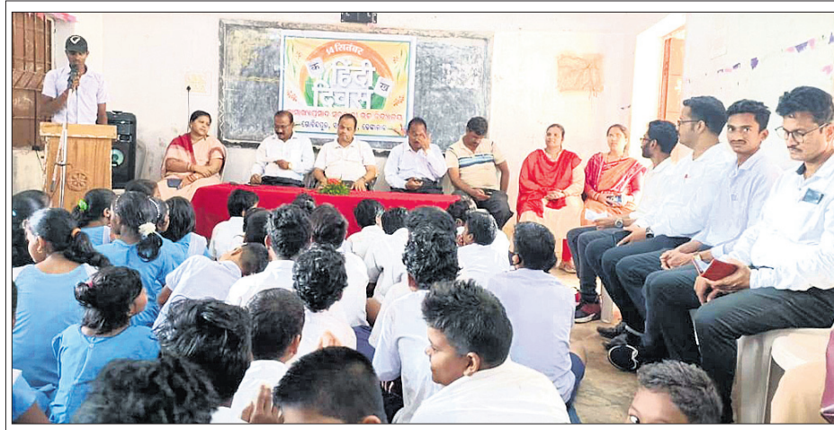
ହିନ୍ଦୀ ଦିବସ ପାଳନ କାର୍ଯ୍ୟକ୍ରମରେ ଛାତ୍ରାଛାତ୍ରୀ ଶିକ୍ଷକ।

ସମ୍ବନ୍ଧରେ ସଭାପତି ବିକ୍ରମପ୍ରସାଦ ତେଜନାଳ ଜିଲ୍ଲା ରାସୋଳ ଅଞ୍ଚଳର ଅଗ୍ରଣୀ ସ୍ୱେଚ୍ଛାସେବୀ ଅନୁଷ୍ଠାନ ଶ୍ରୀକାଶ୍ୟାପତି ସେବା ସଂସ୍ଥାନ (ଜନମଙ୍ଗଳ) ପକ୍ଷରୁ ବୁଦ୍ଧଦିନିଆ କୂଅ ବିଶୋଧନ କାର୍ଯ୍ୟକ୍ରମ ଅନୁଷ୍ଠିତ ହୋଇଯାଇଛି। ଏହି ଅବସରରେ ରାସୋଳ ପଞ୍ଚାୟତର ୪୦ଟି ଏବଂ କୁନ୍ତୁଆ ପଞ୍ଚାୟତର ୨୫ଟି ସର୍ବସାଧାରଣ କୂଅରେ କୂଅ ପାଉଁଶ ପକାଇ ଜଳ ବିଶୋଧନ କରାଯାଇଛି। ଏଥିରେ ସହଯୋଗ କରିଥିଲେ। ଆଗାମୀ ଦିନରେ ଏଭଳି ଜନମଙ୍ଗଳ କାର୍ଯ୍ୟ ଜାରି ରହିବ। ଏଥିପାଇଁ ଅଞ୍ଚଳବାସୀଙ୍କ ସହଯୋଗ ଲୋଡ଼ାଯାଇଛି।