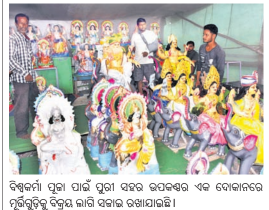
ବିଶ୍ୱକର୍ମା ପୂଜା ପାଇଁ ପୁରୀ ସହର ଉପକଣ୍ଠର ଏକ ବୋକାଳରେ ପୂର୍ଣ୍ଣଚନ୍ଦ୍ର ବିକ୍ରମ ଲାଗି ସଜାର ରଖାଯାଇଛି।

କୌଶଳ କ୍ରମେ ଖସି ଘରକୁ ପଳାଇ ଆସିଥିଲେ। ଏ ନେଇ ପରିବାର ଲୋକେ କାର୍ଯ୍ୟକାରୀ ପଦକ୍ଷେପ ଗ୍ରହଣ କରିବା ପାଇଁ ଅଭିଯୋଗ କରିଛନ୍ତି।