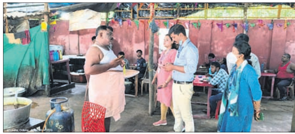
ଭୁବନେଶ୍ୱର, ୧୪।୯ (ବୁଧବେଳା)