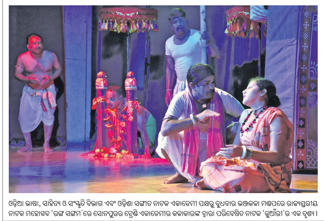
ଓଡ଼ିଆ ଭାଷା, ସାହିତ୍ୟ ଓ ସଂସ୍କୃତି ବିଭାଗ ଏବଂ ଓଡ଼ିଶା ସଙ୍ଗୀତ ନାଟକ ଏକାଡେମୀ ପକ୍ଷରୁ ରୂପବାର ଭଞ୍ଜକଳା ମଣ୍ଡପରେ ରାଜ୍ୟସ୍ତରୀୟ ନାଟକ ମହୋତ୍ସବ 'ରଞ୍ଜ ସଙ୍ଗମ'ରେ ସୋନପୁରର ଟ୍ରେଣି ଏକାଡେମୀର କଳାକାରଙ୍କ ଦ୍ୱାରା ପରିବେଷିତ ନାଟକ 'ରୁଆରୀ'ର ଏକ ଦୃଶ୍ୟ।