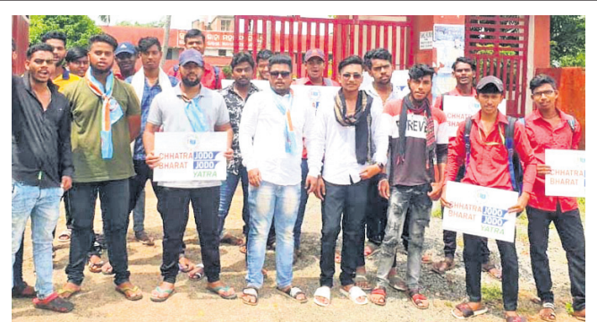
ପୂରୀ ଜିଲ୍ଲା ଛାତ୍ର କଂଗ୍ରେସ କମିଟି ପକ୍ଷରୁ ବୁଧବାର ସୁରକ୍ଷା ଶାସ୍ତ୍ର ମହାବିଦ୍ୟାଳୟ, ସମ୍ବଲପୁର ଅନୁଷ୍ଠିତ 'ଛାତ୍ର ଯୋଡ଼ା- ଭାଗତ ଯୋଡ଼ା' କାର୍ଯ୍ୟକ୍ରମ।