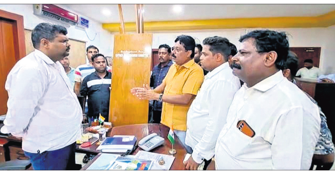
କଟକ ଜିଲା କଂଗ୍ରେସ ପକ୍ଷରୁ ମେୟରଙ୍କୁ ଭେଟିବା ପାଇଁ ସିଏମ୍‌ସି କମିଶନରଙ୍କୁ କବାଟ ପ୍ରଦାନ କରାଯାଇଛି।

ପୂର୍ବତନ କଂସ ଅଭିନେତା ଶ୍ରୀ ରମେଶ ଚନ୍ଦ୍ର ମହାପାତ୍ରଙ୍କ ପରଲୋକ ହୋଇଛି। କଂସ ଅଭିନେତା ଶ୍ରୀ ରମେଶ ଚନ୍ଦ୍ର ମହାପାତ୍ରଙ୍କ ପରଲୋକ ହୋଇଛି।