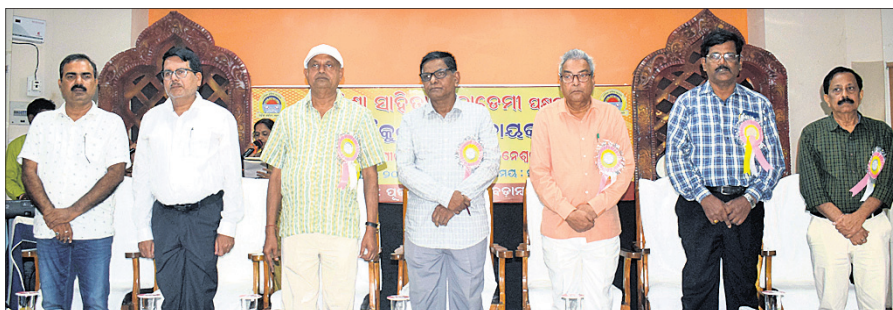
ଭୁବନେଶ୍ୱର, ୧୪।୯ (ବୁଧବେଳା)