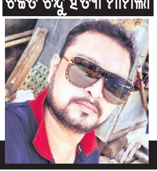
ଛୁରାମାଡ଼ କରିବାରୁ କାଠ