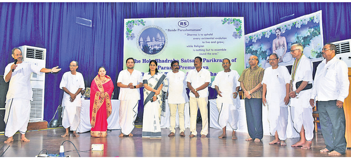
ଶ୍ରୀଶ୍ରୀଠାରୁ ଅନୁକ୍ରମକ୍ରମକ ଭାବେ ସମ୍ବନ୍ଧ ପରିକ୍ରମା ଅବସରରେ ରୂପବାର ସୂଚନାଭବନଠାରେ ଆୟୋଜିତ କାର୍ଯ୍ୟକ୍ରମରେ ଉପସ୍ଥିତ ଅତିଥିଙ୍କ ସହ ସମ୍ବନ୍ଧର ବରିଷ୍ଠ କର୍ମୀମାନେ।