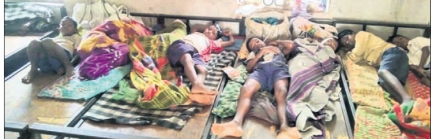
ଡେଣ୍ଟା ଆଉ ପ୍ରାଥମିକ ବିଦ୍ୟାଳୟ ହଷ୍ପିଟାଲରେ ଗୋଟିଏ ଖଟରେ ୨୭ଜଣ ଲେଖାଏଁ ଛାତ୍ରଛାତ୍ରୀ ଶୋଇଛନ୍ତି।

କେନ୍ଦୁଝର ଜିଲା ପାଟଣା ବ୍ଲକ୍ ଡେଣ୍ଟା ଆଉ ପ୍ରାଥମିକ ବିଦ୍ୟାଳୟ ହଷ୍ପିଟାଲରେ ଗୋଟିଏ ଖଟରେ ୨୭ଜଣ ଲେଖାଏଁ ଛାତ୍ରଛାତ୍ରୀ ଶୋଇଛନ୍ତି।