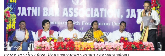
ଜଗଣା କୋର୍ଟ ପ୍ରତିଷ୍ଠା ଦିବସ ଅବସରରେ ଯୋଗ ଦେଇଥିବା ଅତିଥି