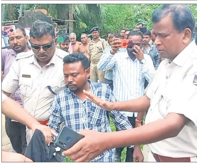
ପୋଲିସ୍ ଅଭିଯୁକ୍ତଙ୍କୁ ଗିରଫ କରି ନେଉଛି।