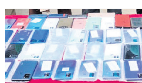
ଜବତ ମୋବାଇଲ, ଗିରଫ ଅଭିଯୁକ୍ତ।