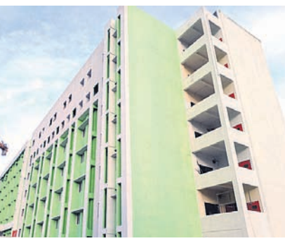
ସରକାରଙ୍କ ରେକର୍ଡ ଅନୁଯାୟୀ ଶିଶୁଭବନରେ ୨୦୦ ଶଯ୍ୟା ପାଇଁ ଆବଶ୍ୟକ ତାଲୁକ ଏବଂ କର୍ମଚାରୀ ରହିଛନ୍ତି। ହେଲେ ଦୈନିକ ଚିକିତ୍ସିତ ୧୧୦୦ ପୁଷ୍ପା-୪