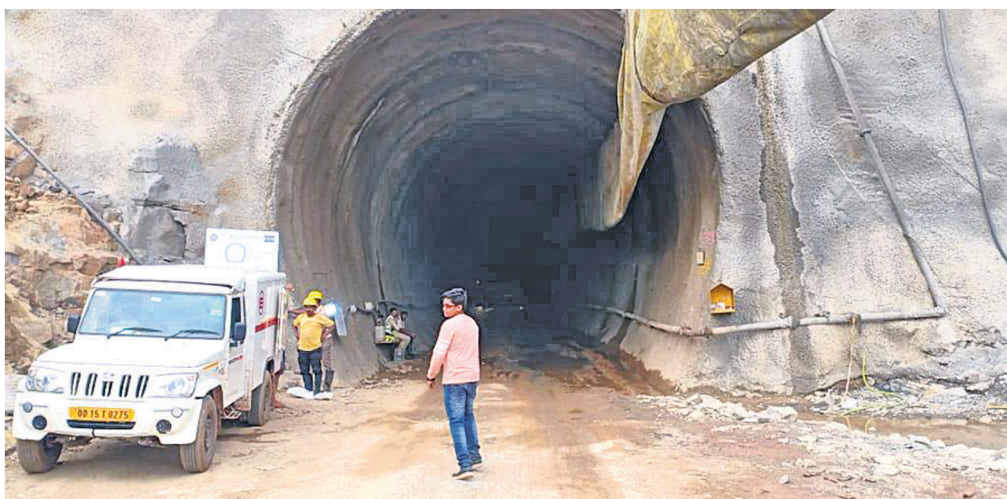
କୋରାପୁଟ-ରାଜଗଡ଼ା ରେଳ ଲାଇନ୍ର ନିର୍ମାଣଧୀନ ଚଳେଇ-୨

ବଲିଉଡ୍ ଚଳଚ୍ଚିତ୍ର 'ଅଧୀକ୍ ଗଢ' ହିନ୍ଦୁ ଧର୍ମୀୟ ଭାବନାକୁ ଆଘାତ ଦେଉଥିବା ନେଇ ଅଭିନେତା ଅଜୟ ଦେବଗନ୍ଙ୍କ ନାମରେ କୋର୍ଟରେ ଅଭିଯୋଗ ହୋଇଛି।