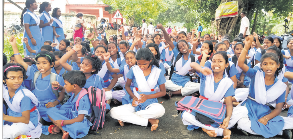
ଛାତ୍ରାମାନେ ବନ୍ଦଳି ସରକାରୀ ସ୍କୁଲର ପାଠକ ସମ୍ମୁଖରେ ଧାରଣା ଦେଇଛନ୍ତି।

ଗୋପ ବ୍ଲକ ଅନ୍ତର୍ଗତ ବନ୍ଦଳି ପଞ୍ଚାୟତ ସରକାରୀ ସ୍କୁଲର ପ୍ରଧାନ ଶିକ୍ଷକଙ୍କ ନିକଟରେ ବଦଳି ହୋଇଯାଇଛି।