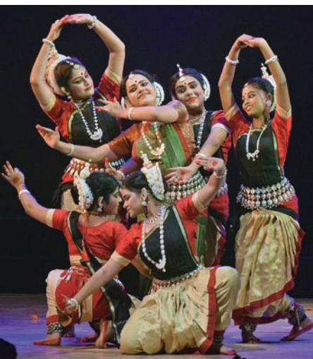
ନୃତ୍ୟାଞ୍ଜଳି ପକ୍ଷରୁ ଭୁବନେଶ୍ୱର ରବାନ୍ଦ୍ର ମଣ୍ଡପରେ ରୂପବାର ଅନୁଷ୍ଠିତ ଦେବଦାସୀ ୧୭ତମ ବାର୍ଷିକ ଉତ୍ସବରେ ଶିଳ୍ପୀମାନେ ଓଡ଼ିଶା ନୃତ୍ୟ ପରିବେଷଣ କରୁଛନ୍ତି।