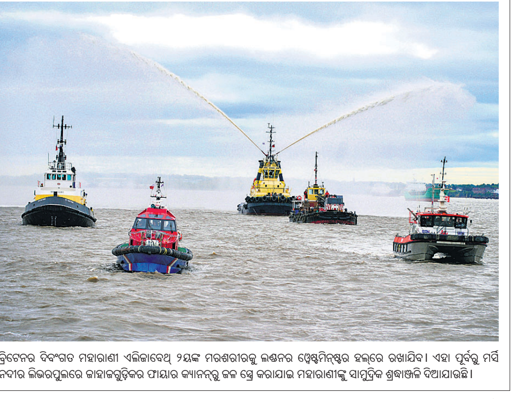
ବ୍ରିଟେନର ଦିବ୍ୟଗତ ମହାରାଣୀ ଏଲିଜାବେଥ ୨ୟଙ୍କ ମରଗୋରକକୁ ଲଣ୍ଡନର ଫ୍ରେସିନିନିଷ୍ଟର ହଲରେ ରଖାଯିବ। ଏହା ପୂର୍ବରୁ ମସି ନଦୀର ଲିଭରପୁଲରେ ଜାହାଜଗୁଡ଼ିକର ଫାୟାର କ୍ୟାମ୍ପରୁ ଜଳ ସ୍ତ୍ରୋ କରାଯାଇ ମହାରାଣୀଙ୍କୁ ସାମୁଦ୍ରିକ ଶ୍ରଦ୍ଧାଞ୍ଜଳି ଦିଆଯାଇଛି।

କରୁଛନ୍ତି। ଦୁର୍ବଳ ସାଇବର ସୁରକ୍ଷା ଯୋଗୁ ଅନେକ ନିର୍ଯାତକାର ଶିକାର ହୋଇଛନ୍ତି କିମ୍ପା ହେବା ଆଶଙ୍କା ରହିଛି। ସେମାନଙ୍କ ପ୍ରଭେଦ(ଅନ୍ତରାଳ ତଥ୍ୟ) ପ୍ରତି ବିପଦ ରହିଛି। ରୁଇଟର ନେତୃତ୍ୱ ଏହାର ଇଞ୍ଜିନିୟରଙ୍କୁ ଅବହେଳା କରିଆସିଛନ୍ତି। ସେମାନେ ସୁରକ୍ଷା ଅପେକ୍ଷା କମ୍ପାନୀର ଲାଭକୁ ପ୍ରାଧାନ୍ୟ