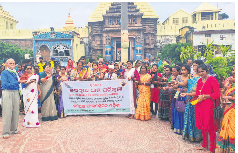
ମଦ୍ୟୁକ୍ତ ଓଡ଼ିଶା ପାଇଁ ମହାପ୍ରଭୁଙ୍କ ନିକଟରେ ପ୍ରାର୍ଥନା କରାଯାଇ ସାମାଜିକ ଅନୁଷ୍ଠାନ 'ମ' ଘର ପକ୍ଷରୁ ରୂପବାର ଶ୍ରୀମନ୍ଦିର ସିଂହଦ୍ୱାର ସମ୍ମୁଖରେ ସମୂହ ଦୀପପାଦନ କରାଯାଇଛି।