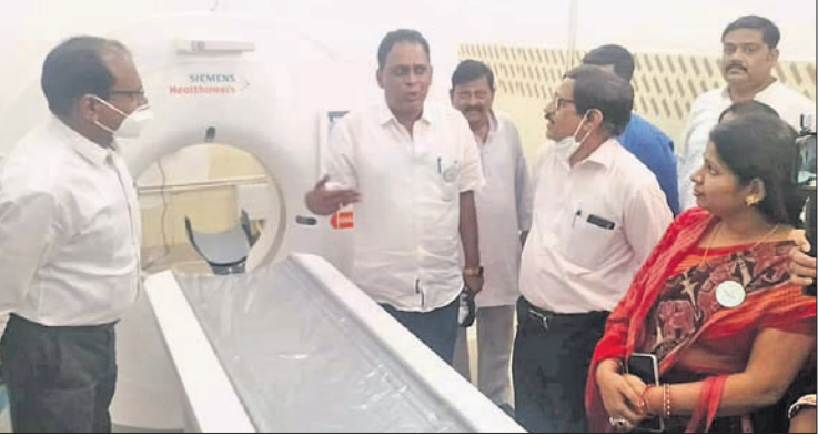
ସିଟି ସ୍କାନ ମେଶିନକୁ ସ୍ୱାଗତ୍ୟମନ୍ତ୍ରୀ ନବ କିଶୋର ଦାସ ଉଦ୍ଘାଟନ କରୁଛନ୍ତି।

ଭୁବନେଶ୍ୱର, (ବୁଧବେଳା)/ ଝାରସୁଗୁଡ଼ା ଅଫିସ, ୧୪।୯ ନକଲି ଔଷଧ କାରବାର ରୋକିବାକୁ ରାଜ୍ୟରେ ଚଢ଼ାଉ କରାଯାଇଛି। ଆଗକୁ ସବୁ ଜିଲ୍ଲାରେ ଚଢ଼ାଉ ପାଇଁ ନିର୍ଦ୍ଦେଶ ଦିଆଯିବ।