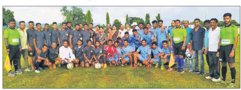
'ରେୟାରମ୍ୟାନ୍' ଯୁବକ ଚୂର୍ଣ୍ଣାମେଣ୍ଟରେ ଅତିଥି ସହ ଖେଳାଳି ।

ଦେବଗଡ଼ ପୌର ପରିଷଦ ପକ୍ଷରୁ ଜିଲ୍ଲା କ୍ରୀଡା ସଂସଦ ସହାୟତାରେ ସ୍ଥାନୀୟ ଲାଲିଗାଠା ଖ୍ରୀଷ୍ଟିୟନ ଚର୍ଚ୍ଚାଳନା ଠାରୁ ଆରମ୍ଭ ହୋଇଥିବା 'ରେୟାରମ୍ୟାନ୍' ଯୁବକ ଚୂର୍ଣ୍ଣାମେଣ୍ଟର ତୃତୀୟ ଦିବସରେ ଗୁରୁବାର ଝାଡ଼ି ନମ୍ବର-୩ ଓ ଝାଡ଼ି ନମ୍ବର-୧୦ ବିଜୟୀ ହୋଇଛି । ପ୍ରଥମ ମ୍ୟାଚ ଝାଡ଼ି ନମ୍ବର-୧ ଓ ଝାଡ଼ି ନମ୍ବର-୩ ମଧ୍ୟରେ ଅନୁଷ୍ଠିତ ହୋଇଥିବା ବେଳେ ନିର୍ଦ୍ଧାରିତ ସମୟ ଶେଷ ହେବା ପର୍ଯ୍ୟନ୍ତ ମ୍ୟାଚଟି ଅମାମ୍ୟାନ୍ସିତ ରହିବାକୁ ଚାଲିଥିଲା । ଝାଡ଼ି ନମ୍ବର-୧ ପକ୍ଷରୁ ଝାଡ଼ି ନମ୍ବର-୩ ଝାଡ଼ି ନମ୍ବର-୧୧୩-୨ ଗୋଲରେ ପରାସ୍ତ କରି ବିଜୟୀ ହୋଇଥିଲା । ଅନୁରୂପ ଭାବେ