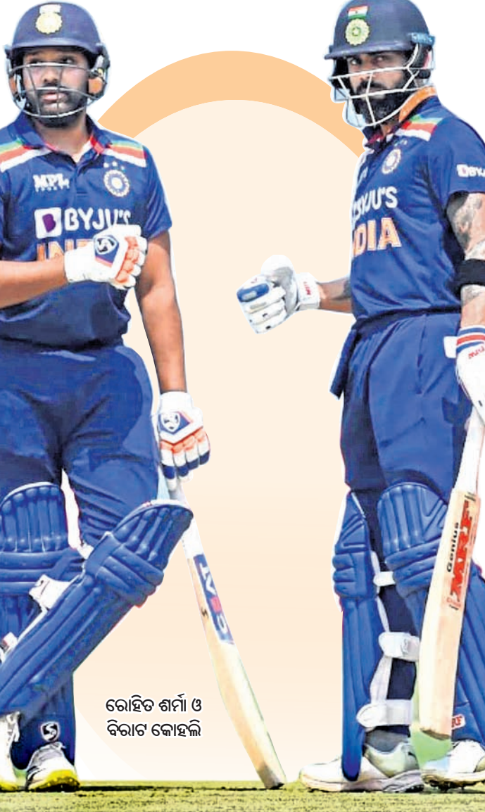
ରୋହିତ ଶର୍ମା ଓ ବିରାଟ କୋହଲି

ମୋହାଲିଠାରେ ପ୍ରଥମ, ସେପ୍ଟେମ୍ବର ୨୩ରେ ନାଗପୁରଠାରେ ଦ୍ୱିତୀୟ ଏବଂ ସେପ୍ଟେମ୍ବର ୨୫ରେ ହାଇଦ୍ରାବାଦଠାରେ ୩ୟ ଟି୨୦ ମ୍ୟାଚ୍ ଖେଳିବ। ଏହାପରେ ଦକ୍ଷିଣ ଆଫ୍ରିକା ବିପକ୍ଷରେ ସେପ୍ଟେମ୍ବର ୨୮ରେ ଥୁଲୁଆନକପୁରଠାରେ ପ୍ରଥମ ଟି୨୦ ଖେଳି ଅଭିଯାନ ଆରମ୍ଭ କରିବ। ଅକ୍ଟୋବର ୨ରେ ଗୁଆହାଟୀ ଏବଂ ୪ରେ ଇନ୍ଦୋରଠାରେ ଯଥାକ୍ରମେ ୨ୟ ଏବଂ ୩ୟ ଟି୨୦ ମ୍ୟାଚ୍ ଖେଳିବ। ଆଇସିସି ଟି୨୦ ବିଶ୍ୱକପ ଅକ୍ଟୋବର ୧୬ରୁ ଅଷ୍ଟ୍ରେଲିଆଠାରେ ଆରମ୍ଭ ହେବ। ଭାରତ ଏହାର ପ୍ରଥମ ମ୍ୟାଚ୍ ପାରମ୍ପରିକ ପ୍ରତିଦ୍ୱନ୍ଦ୍ୱୀ ପାକିସ୍ତାନ ବିପକ୍ଷରେ ଅକ୍ଟୋବର ୨୩ରେ ମେଲବୋର୍ନ କ୍ରିକେଟ ଗ୍ରାଉଣ୍ଡରେ ଖେଳିବ। ଟି୨୦ ବିଶ୍ୱକପକୁ ଦୃଷ୍ଟିରେ ରଖି ଉଭୟ ଅଷ୍ଟ୍ରେଲିଆ ଓ ଦକ୍ଷିଣ ଆଫ୍ରିକା ଆଗାମୀ ୨ ସିରିଜ୍କୁ ଗୁରୁତ୍ୱ ସହ ନେବା ସ୍ୱାଭାବିକ। ଅଷ୍ଟ୍ରେଲିଆ ଏବଂ ଭାରତ ମଧ୍ୟରେ ଏପର୍ଯ୍ୟନ୍ତ ୨୩ଟି ଟି୨୦ ମ୍ୟାଚ୍ ଅନୁଷ୍ଠିତ ହୋଇଛି। ଏଥିରୁ ଭାରତ ୧୩ଟି ମ୍ୟାଚ୍ରେ ବିଜୟୀ ହୋଇଥିବା ବେଳେ ଅଷ୍ଟ୍ରେଲିଆ ୯ଟି ଲିଟିଛି ଏବଂ ଗୋଟିଏ ମ୍ୟାଚ୍ରେ ଫଳାଫଳ ମିଳିନାହିଁ। ଟିମ୍ ଇଣ୍ଡିଆ ୪ଟି ମ୍ୟାଚ୍ ଘରୋଇ ସିରିଜ୍ରେ ବିଜୟୀ ହୋଇଥିବା ବେଳେ ୭ଟି ମ୍ୟାଚ୍ ବିଦେଶ ମାଟିରେ ଲିଟିଛି। ଅନ୍ୟ ୨ଟି ମ୍ୟାଚ୍ ନିରପେକ୍ଷ ଭେତ୍ସରେ ବିଜୟୀ ହୋଇଛି। ସେହିପରି ଦକ୍ଷିଣ ଆଫ୍ରିକା ଓ ଭାରତ ମଧ୍ୟରେ ମୋଟ ୨୦ଟି ଟି୨୦ ମ୍ୟାଚ୍ ଅନୁଷ୍ଠିତ ହୋଇଛି। ଏଥିରୁ ଟିମ୍ ଇଣ୍ଡିଆ ୧୧ଟି ମ୍ୟାଚ୍ ଲିଟିଥିବା ବେଳେ ଦକ୍ଷିଣ ଆଫ୍ରିକା ୮ଟିରେ ବିଜୟୀ ହୋଇଛି ଏବଂ ଗୋଟିଏ ମ୍ୟାଚ୍ରେ ଫଳାଫଳ ମିଳି ନାହିଁ।