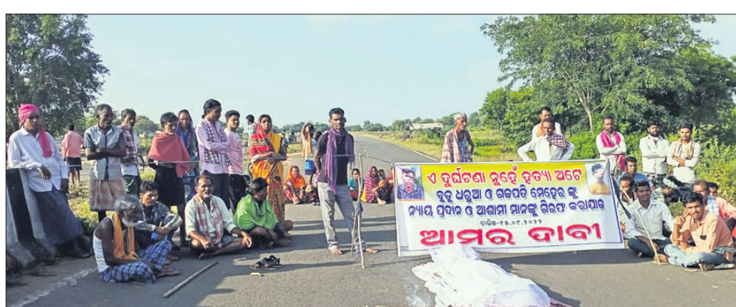
ନ୍ୟାୟ ଦାବିରେ ମୃତଦେହ ରଖି ରାସ୍ତା ଅବରୋଧ କରାଯାଇଛି ।