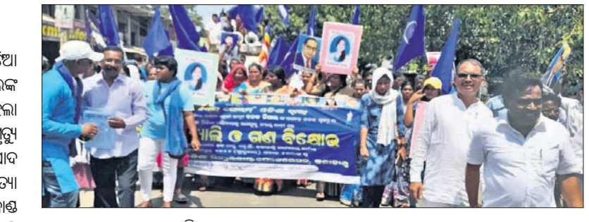
ଭବାନୀପାଟଣାରେ ଆୟୋଜିତ ଶୋଭାଯାତ୍ରା ।