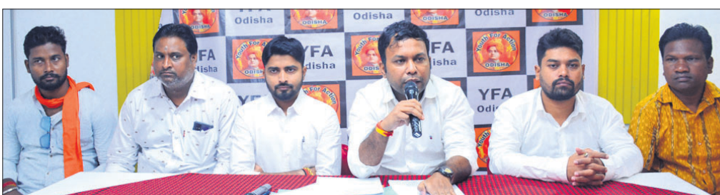
ଖବରଦାତା ସମ୍ମିଳନୀରେ ଖାଇଏଫଏ କର୍ମକର୍ତ୍ତା ସୂଚନା ଦେଉଛନ୍ତି ।