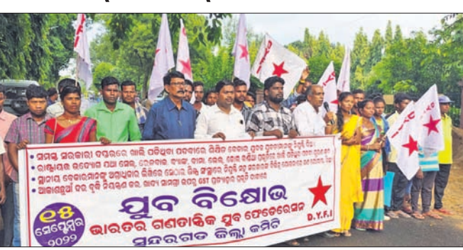
ଫେଡ଼େରେଶନ ପକ୍ଷରୁ ବିଷୋଭ ପ୍ରଦର୍ଶନ କରାଯାଇଛି ।