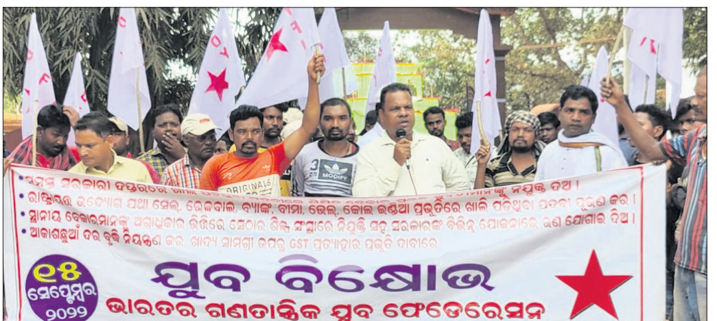
କୋଇଡା ବ୍ଲକ୍ ସମ୍ମୁଖରେ ବିକ୍ଷୋଭ କରାଯାଇଛି ।

ଭାରତର ଗଣତାନ୍ତ୍ରିକ ଯୁବ ଫେଡ଼େରେସନ (ଡିଏଲଏଫଆଇ) କୋଇଡା ଶାଖା ପକ୍ଷରୁ ଗୁରୁବାର କୋଇଡା ବ୍ଲକ୍ ସମ୍ମୁଖରେ ବିକ୍ଷୋଭ କରାଯାଇଛି । ସ୍ଥାନୀୟ ବେକାରୀ ଯୁବକ ଯୁବତୀଙ୍କୁ ନିୟୁତ୍ତିରେ ଅଗ୍ରାଧିକାର, ଶିକ୍ଷାକୁ ଘରୋଇ କରଣ ନ କରିବା ଓ ଖାଲିପଡ଼ିଥିବା ପଦ୍ମା ପୂରଣ କରିବା, ଅତ୍ୟାବଶ୍ୟକ ଜିନିଷ ଉପରେ ଲିଏଫ୍ଟି ଛାଡ଼ି କରିବା, ଜିଲ୍ଲା ଖଣିଜ ପାଣ୍ଠିକୁ ଅପବ୍ୟବହାର ନ କରି ଶିକ୍ଷା ଓ ନିୟୁତ୍ତି କ୍ଷେତ୍ରରେ ବ୍ୟବହାର କରିବା, କୋଇଡାଠାରେ ସରକାରୀ ବିଜ୍ଞାନ