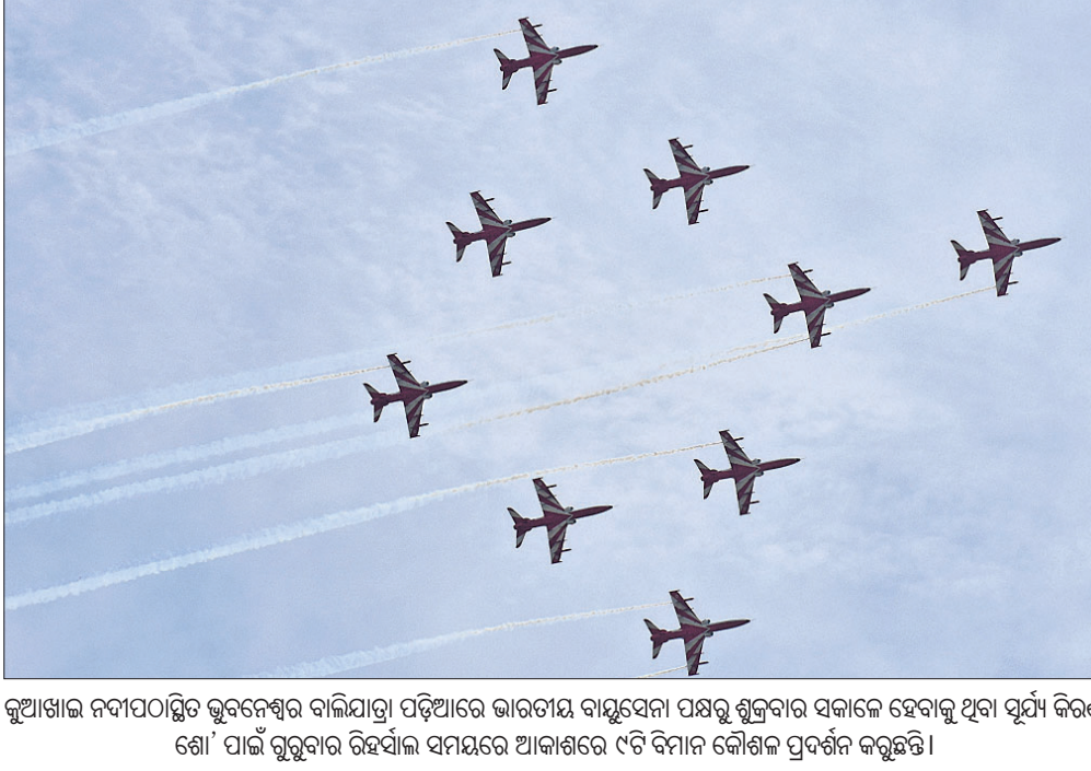
କୃଷାଖଳ ନବୀନପାଠିତ ଭୁବନେଶ୍ୱର ବାଲିପାତ୍ରା ପଡ଼ିଆରେ ଭାରତୀୟ ବାୟୁସେନା ପକ୍ଷରୁ ଶୁକ୍ରବାର ସକାଳେ ହେବାକୁ ଥିବା ପୂର୍ବ୍ୟ କିରଣ ଶୋ' ପାଇଁ ଗୁରୁବାର ରିହସ୍ୟାଳ ସମୟରେ ଆକାଶରେ ୯ଟି ବିମାନ କୌଶଳ ପ୍ରଦର୍ଶନ କରୁଛନ୍ତି ।