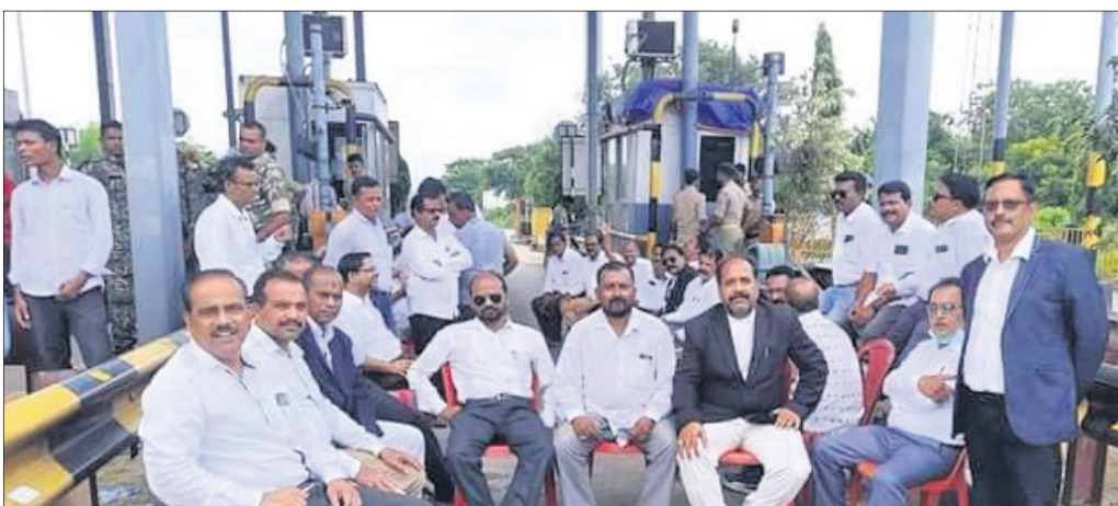
ବରାହଗୋଡ଼ା ଟୋଲ୍ ପ୍ଲାଜାରେ ବରଗଡ଼ ଜିଲ୍ଲା ଓକିଲ ସଂଘର କର୍ମକର୍ତ୍ତା, ସଭ୍ୟବୃନ୍ଦ ।

ବରଗଡ଼ ସହର ଉପକଣ୍ଠ ବରାହଗୋଡ଼ାରେ ଥିବା ଟୋଲ୍ ପ୍ଲାଜାରେ ପୁଣି ଆନ୍ଦୋଳନ ଚଳିଛି। ରାସ୍ତା ନିର୍ମାଣରେ ତ୍ରୁଟି ସୂଚାରିବା ବଦଳରେ ଟୋଲ୍ ପ୍ଲାଜା କର୍ତ୍ତୃପକ୍ଷ ଦେଖାଇ ଦାବି ଦେଇଛନ୍ତି। ଏହାର ପ୍ରତିବାଦରେ ଗୁରୁବାରଠାରୁ ବରଗଡ଼ ଜିଲ୍ଲା ଓକିଲ ସଂଘ ଆନ୍ଦୋଳନକୁ ଓହ୍ଲାଇଛି। ସଂଘର କର୍ମକର୍ତ୍ତା, ସଭ୍ୟମାନେ ପୂର୍ବରୁ ପ୍ରାୟ ସାତେ ୧୦ଟାରେ ଟୋଲ୍ ପ୍ଲାଜାକୁ ଯାଇ ଦେଖାଇ ଟୋଲ୍ ଟ୍ୟାକ୍ସ ଅସୁଲିର ଦୃଢ଼ ପ୍ରତିବାଦ କରିଥିଲେ। ଫଳରେ ସେଠାରେ ଉଦ୍ଦେଶ୍ୟ ପ୍ରକାଶ ପାଇଥିଲା। ଟୋଲ୍ ଅସୁଲିକୁ ବନ୍ଦ କରିଦେବା ସହିତ ଉଦ୍ଦେଶ୍ୟ ହୋଇଥିଲା। ରାସ୍ତା ନିର୍ମାଣରେ ହୋଇଥିବା ତ୍ରୁଟି ନ ସୁଧାରିବା ପର୍ଯ୍ୟନ୍ତ ଟୋଲ୍ ଆଦାୟ କରିବାକୁ ଦିଆଯିବ ନାହିଁ ବୋଲି ଓକିଲମାନେ ଚେତାବନା ଦେଇଥିଲେ। ତେବେ ଟୋଲ୍ ପ୍ଲାଜା କର୍ତ୍ତୃପକ୍ଷ ଏବଂ ଓକିଲ ସଂଘ ମଧ୍ୟରେ ହୋଇଥିବା ବିଫଳ ହୋଇଛି। ଓକିଲ ସଂଘର ଆନ୍ଦୋଳନ ପରେ ଟୋଲ୍ ଆଦାୟ ବନ୍ଦ ରହିଛି। ଅନ୍ୟପକ୍ଷେ ଆନ୍ଦୋଳନର ପରବର୍ତ୍ତୀ ରୂପରେଖ