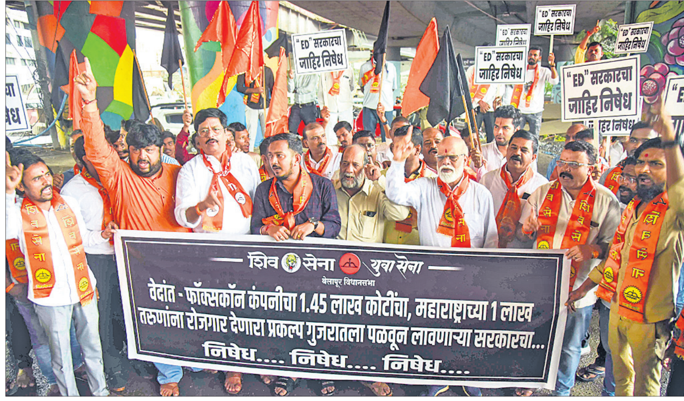
ପଦୋତ୍ତମା ଗୁଜରାଟକୁ ବେଦାନ୍ତ-ଫକ୍ସକଂ ପ୍ରୋଜେକ୍ଟ ଚାଲିଯିବା ପରେ ଶିବସେନାର ଉଦ୍ଦେଶ୍ୟ ଠାକୁରାଣୀ ସମର୍ଥକ ମହାରାଷ୍ଟ୍ର ସରକାରଙ୍କ ବିରୋଧରେ ଗୁଜରାଟ ନିଉ ଯୁଗରେ ବିରୋଧ କରୁଛନ୍ତି।