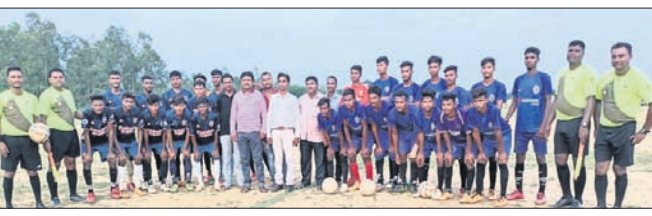
ଅତିଥିଙ୍କ ସହ ଉଭୟ ଦଳର ଖେଳାଳି ।