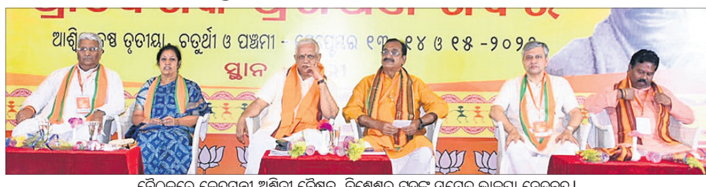
ବୈଠକରେ କେନ୍ଦ୍ରମନ୍ତ୍ରୀ ଅଶ୍ୱିନୀ ବୈଷ୍ଣବ, ବିଶ୍ୱେଶ୍ୱର ରୁଦ୍ରଙ୍କ ସମେତ ଭାଜପା ନେତୃତ୍ୱ।