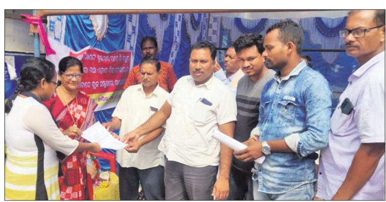
ଧାନଖଣ୍ଡନରେ ବିଭିନ୍ନ ପ୍ରଦାନ କରାଯାଇଛି।

କଳାପୁଣ୍ଡା ଜିଲ୍ଲା କଳାପୁଣ୍ଡା ବ୍ଲକ୍ରେ ୨୦୧୯-୨୦ ଆର୍ଥିକ ବର୍ଷରେ ବିଭିନ୍ନ ପଞ୍ଚାୟତରେ ଧାନ ଖଳା ନିର୍ମାଣ ଶେଷ ହୋଇଥିଲେ ହେଁ ବର୍ତ୍ତମାନ ସୁଦ୍ଧା ଟଙ୍କା ମିଳି ନ ଥିବାରୁ ଗୁରୁବାର ସକାଳୁ କାମରେ ନିୟୋଜିତ ମୋଟ ୭ ଶ୍ରମିକମାନେ ବ୍ଲକ୍ ସମ୍ମୁଖରେ ଗଣଧାରଣା ଦେଇଛନ୍ତି।