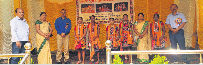
ଲୋକନୃତ୍ୟ ପ୍ରତିଯୋଗିତାରେ ଅଂଶଗ୍ରହଣ କରିଥିବା ନୃତ୍ୟକ ସହ ଅଭିଯୁକ୍ତ।