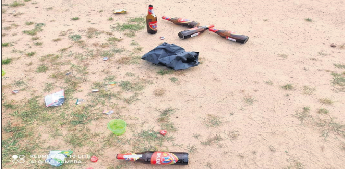
ରୟାଲ ପଡିଆରେ ମଦ ବୋତଲ ପଡିରହିଛି ।

ସୁବର୍ଣ୍ଣପୁର ସହରରେ ଏବେ ବିଦେଶୀ, ଦେଶୀ ମଦ ଏବଂ କଫ୍ ସିରପ୍ କାରବାର ବୃଦ୍ଧି ପାଇଛି। ରାସ୍ତାପାର୍ଶ୍ୱରେ ଖୁଲିଖୁଲି ମଦ ବିକ୍ରି କରାଯାଉଛି। ଲୋକେ ସକ୍ଷେପ ନ କରି ବେଆଇନଭାବେ ସର୍ବସାଧାରଣ ସ୍ଥାନରେ ନିଶା ସେବନ କରୁଛନ୍ତି। ମଦ୍ୟପକ୍ଷ ଉତ୍ପାଦ ବୃଦ୍ଧି ପାଇବାରେ ଲାଗିଛି। ପୋଲିସ୍ ଓ ଅବକାରୀ ବିଭାଗ ସବୁ ଜାଣି ନୀରବପୁଷ୍ପା ସାଜିଥିବା ଅଭିଯୋଗ ହେଉଛି।