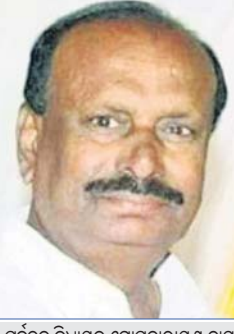
ପୂର୍ବତନ ବିଧାୟକ ଗୋପନାରାୟଣ ଦାସ