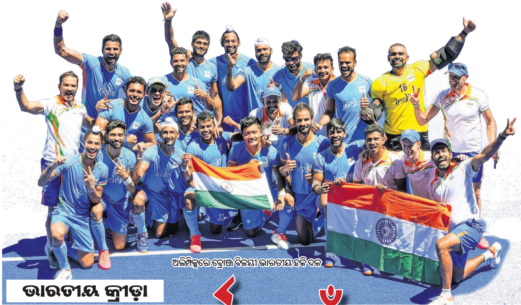
ଅଲିମ୍ପିକ୍ସରେ ଗ୍ରୀଷ୍ମ ବିଜୟୀ ଭାରତୀୟ ହକି ଦଳ