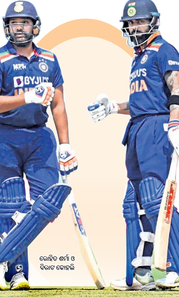
ରୋହିତ ଶର୍ମା ଓ ବିରାଟ କୋହଲି

ମୋହାଲୀରେ ପ୍ରଥମ, ସେପ୍ଟେମ୍ବର ୨୩ରେ ନାଗପୁରରେ ଦ୍ୱିତୀୟ ଏବଂ ସେପ୍ଟେମ୍ବର ୨୫ରେ ହାଇଦ୍ରାବାଦଠାରେ ୩ୟ ଟି୨୦ ମ୍ୟାଚ୍ ଖେଳିବ। ଏହାପରେ ଦକ୍ଷିଣ ଆଫ୍ରିକା ବିପକ୍ଷରେ ସେପ୍ଟେମ୍ବର ୨୮ରେ ଥୁଲୁଆନକପୁରଠାରେ ପ୍ରଥମ ଟି୨୦ ଖେଳି ଅଭିଯାନ ଆରମ୍ଭ କରିବ। ଅକ୍ଟୋବର ୨ରେ ଗୁଆହାଟୀ ଏବଂ ୪ରେ ଇନ୍ଦୋରଠାରେ ଯଥାକ୍ରମେ ୨ୟ ଏବଂ ୩ୟ ଟି୨୦ ମ୍ୟାଚ୍ ଖେଳିବ। ଆଇସିସି ଟି୨୦ ବିଶ୍ୱକପ ଅକ୍ଟୋବର ୧୬ରୁ ଅଷ୍ଟ୍ରେଲିଆଠାରେ ଆରମ୍ଭ ହେବ। ଭାରତ ଏହାର ପ୍ରଥମ ମ୍ୟାଚ୍ ପାରମ୍ପରିକ ପ୍ରତିଦ୍ୱନ୍ଦ୍ୱୀ ପାକିସ୍ତାନ ବିପକ୍ଷରେ ଅକ୍ଟୋବର ୨୩ରେ ମେଲବୋର୍ନ କ୍ରିକେଟ ଗ୍ରାଉଣ୍ଡରେ ଖେଳିବ। ଟି୨୦ ବିଶ୍ୱକପକୁ ଦୃଷ୍ଟିରେ ରଖି ଉଭୟ ଅଷ୍ଟ୍ରେଲିଆ ଓ ଦକ୍ଷିଣ ଆଫ୍ରିକା ଆଗାମୀ ୨ ସିରିଜ୍କୁ ଗୁରୁତ୍ୱ ସହ ନେବା ସ୍ୱାଭାବିକ। ଅଷ୍ଟ୍ରେଲିଆ ଏବଂ ଭାରତ ମଧ୍ୟରେ ଏପର୍ଯ୍ୟନ୍ତ ୨୩ଟି ଟି୨୦ ମ୍ୟାଚ୍ ଅନୁଷ୍ଠିତ ହୋଇଛି। ଏଥିରୁ ଭାରତ ୧୩ଟି ମ୍ୟାଚ୍ରେ ବିଜୟୀ ହୋଇଥିବା ବେଳେ ଅଷ୍ଟ୍ରେଲିଆ ୯ଟି ଜିତିଛି ଏବଂ ଗୋଟିଏ ମ୍ୟାଚ୍ରେ ଫଳାଫଳ ମିଳିନାହିଁ। ଟିମ୍ ଇଣ୍ଡିଆ ୪ଟି ମ୍ୟାଚ୍ ଘରୋଇ ସିରିଜ୍ରେ ବିଜୟୀ ହୋଇଥିବା ବେଳେ ୭ଟି ମ୍ୟାଚ୍ ବିଦେଶ ମାଟିରେ ଜିତିଛି। ଅନ୍ୟ ୨ଟି ମ୍ୟାଚ୍ ନିରପେକ୍ଷ ଭେତ୍ସରେ ବିଜୟୀ ହୋଇଛି। ସେହିପରି ଦକ୍ଷିଣ ଆଫ୍ରିକା ଓ ଭାରତ ମଧ୍ୟରେ ମୋଟ ୨୦ଟି ଟି୨୦ ମ୍ୟାଚ୍ ଅନୁଷ୍ଠିତ ହୋଇଛି। ଏଥିରୁ ଟିମ୍ ଇଣ୍ଡିଆ ୧୧ଟି ମ୍ୟାଚ୍ ଜିତିଥିବା ବେଳେ ଦକ୍ଷିଣ ଆଫ୍ରିକା ୮ଟିରେ ବିଜୟୀ ହୋଇଛି ଏବଂ ଗୋଟିଏ ମ୍ୟାଚ୍ରେ ଫଳାଫଳ ମିଳି ନାହିଁ।