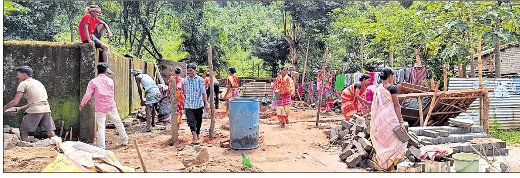
ସ୍ୱୟଂ ସହାୟକା ଗୋଷ୍ଠୀ ସଭାମାନେ ଜବରଦଖଲ ହଟାଇଛନ୍ତି।

ଦାରିଙ୍ଗବାଡ଼ି ଥାନା ସିନାବାଡ଼ି ପଞ୍ଚାୟତ କୋହନପଲ ସାହିର ୫୯୯ ନାଟ୍ୟ ରାଜପଥ କଡ଼ରେ ଥିବା ଏକ ସରକାରୀ ଜମିକୁ ନେଇ ବିବାଦ ଦେଖାଦେଇଛି। ପ୍ରଶାସନ ଅଭିଯୋଗ ନ ଶୁଣିବାରୁ ମାତୃଶକ୍ତି ସ୍ୱୟଂ ସହାୟକ ଗୋଷ୍ଠୀ ଜବରଦଖଲ ଉଚ୍ଛେଦ କରିଛନ୍ତି।