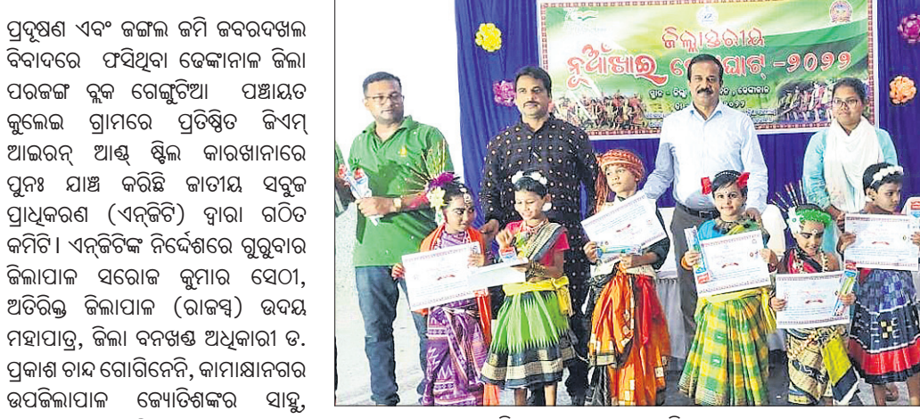
ଅତିଥିକ ଗହଣରେ କୃତା ପ୍ରତିଯୋଗୀମାନେ।

ଦେଈାନାଳ ଅଫିସ, ୧୫ (ଡି.ଏନ୍.ଏ.): ଓଡ଼ିଆ ଭାଷା, ସାହିତ୍ୟ ଓ ସଂସ୍କୃତି ବିଭାଗ, ଦେଈାନାଳ ଜିଲ୍ଲା ପ୍ରଶାସନ ଏବଂ ସଂସ୍କୃତି ପରିଷଦ ପକ୍ଷରୁ ଗ୍ରାମୀଣ ଆର୍ଟ୍ ଆଣ୍ଡ୍ ଟ୍ରାଫି ସେକ୍ସର ପରିସରରେ 'ନୂଆଁଖାଇ ଭେଟପାଟ୍-୨୦୨୨' ପାଳିତ ହୋଇଯାଇଛି।