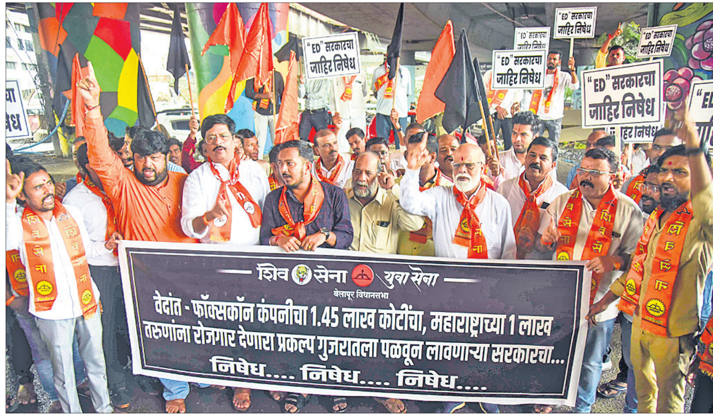
ପଦୋତ୍ତମା ଗୁଜରାଟକୁ ବେଦାନ୍ତ-ଫାକ୍ସକॉन ପ୍ରୋଜେକ୍ଟ ଗଢ଼ାଉଥିବା ପରେ ଶିବସେନାର ଉଦ୍ଦେଶ୍ୟ ଠିକ୍ ଭାବରେ ଗୋଷ୍ଠୀ ସମର୍ଥକ ମହାରାଷ୍ଟ୍ର ସରକାରଙ୍କ ବିରୋଧରେ ଗୁଜରାଟ ନିଉ ଯୁଗରେ ବିକ୍ଷୋଭ କରୁଛନ୍ତି।