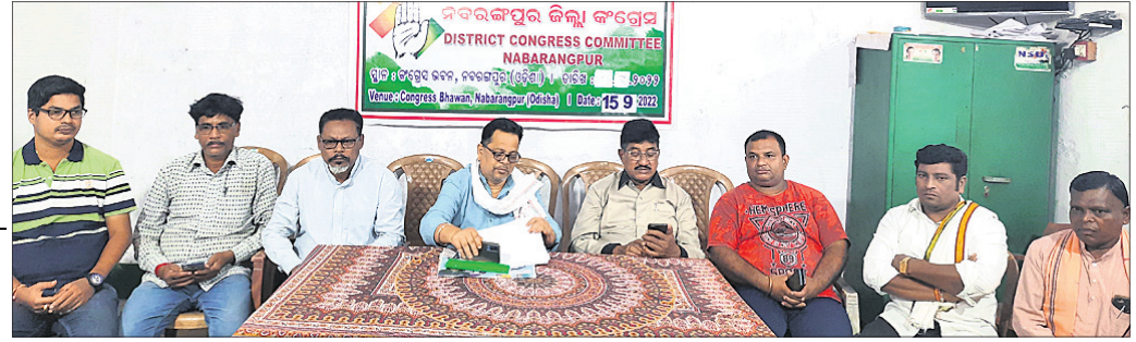
ଝରଦାତା ସମ୍ମିଳନୀରେ କଂଗ୍ରେସ ନେତୃତ୍ଵ।

ଝରଦାତା ସମ୍ମିଳନୀରେ କଂଗ୍ରେସ ନେତୃତ୍ଵ ଝରଦାତା ସମ୍ମିଳନୀରେ କଂଗ୍ରେସ ନେତୃତ୍ଵ ଝରଦାତା ସମ୍ମିଳନୀରେ କଂଗ୍ରେସ ନେତୃତ୍ଵ