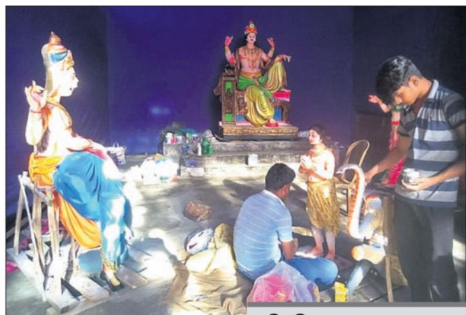
ବର୍ଷପାଳ, ୧୫୮୯ (ଡି.ଏନ.ଏ.)

ସରିଆସୁଛି ମଣ୍ଡପ ସାକ୍ଷରତା। ଅନ୍ତିମ ପର୍ଯ୍ୟାୟରେ ପହଞ୍ଚିଲାଣି ଚୋରା ନିର୍ମାଣ। ମୂର୍ତ୍ତିରେ ଶେଷ ସ୍ୱର୍ଣ୍ଣ ଦେଉଛନ୍ତି ଶିଳ୍ପୀ। ଆଉ ମାତ୍ର ଦିନଟିଏ ପରେ ନାଲକୋନଗରବାସୀଙ୍କ ଦୀର୍ଘ ପ୍ରତୀକ୍ଷାର ଅବସାନ ହେବ।