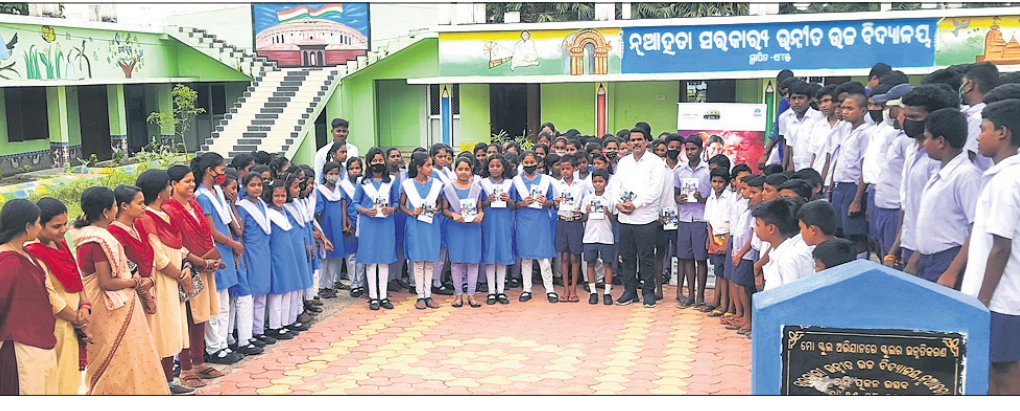
ପ୍ରତିଯୋଗିତାରେ ଅଂଶଗ୍ରହଣ କରିଥିବା ଛାତ୍ରାଛାତ୍ରୀମାନେ।

ଦେଈାନାଳ ଅଫିସ, ୧୫ (ଡି.ଏନ୍.ଏ.): ମହାକାଶ ବିଜ୍ଞାନ କ୍ଷେତ୍ରରେ ଓଡ଼ିଶାର ଛାତ୍ରାଛାତ୍ରୀଙ୍କ ପ୍ରତିଭା ବିକାଶ ଲକ୍ଷ୍ୟରେ ଗାଟା ଷ୍ଟିଲ୍ ଯୁବ ଜ୍ୟୋତିର୍ବିଜ୍ଞାନୀ ପ୍ରତିଭା ଅନୁଷ୍ଠଣ (ଇୟାଟ୍) କାର୍ଯ୍ୟକ୍ରମ।