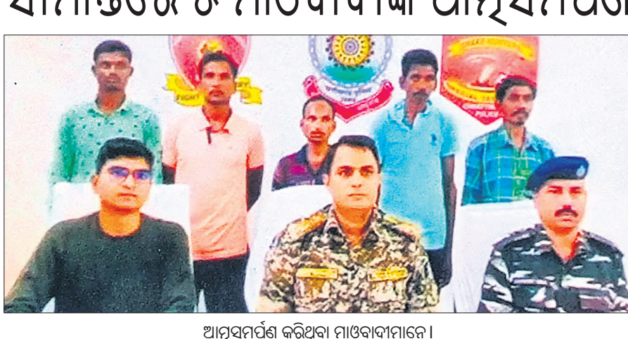
ଆମ୍ବସନା କରିଥିବା ମାଓବାଦୀମାନେ।

ପରିବହନ ଭଙ୍ଗା ବୃଦ୍ଧି ଦାବି ଏମ୍ପ୍ଲିଏସ୍ କୋଇଲା ଖଣିରୁ ପରିବହନ ବାଧାପ୍ରାପ୍ତ ହେଉଛି।