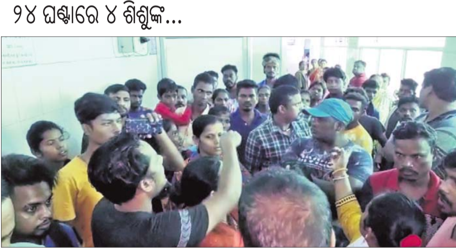
ତାନ୍ତ୍ରାଧିକାରୀ ପରିସରରେ ଉତ୍ତମ ଲୋକେ ହେଉଛନ୍ତି କରୁଛନ୍ତି।

ଆପତ୍ତିଜନକ ଭିଡ଼ିଓ ଲିଜ୍ ବିବାଦ ଗ୍ରହଣ କରନ୍ତୁ। ଛାତ୍ରାଧିକାରୀଙ୍କ ଆପତ୍ତିଜନକ ଭିଡ଼ିଓ ଭାଇରାଲ ହୋଇଥିବା ପ୍ରଚାର ପରେ କେତେଜଣ ଛାତ୍ରାଧିକାରୀ ଉଦ୍ୟମ କରିଥିଲେ।