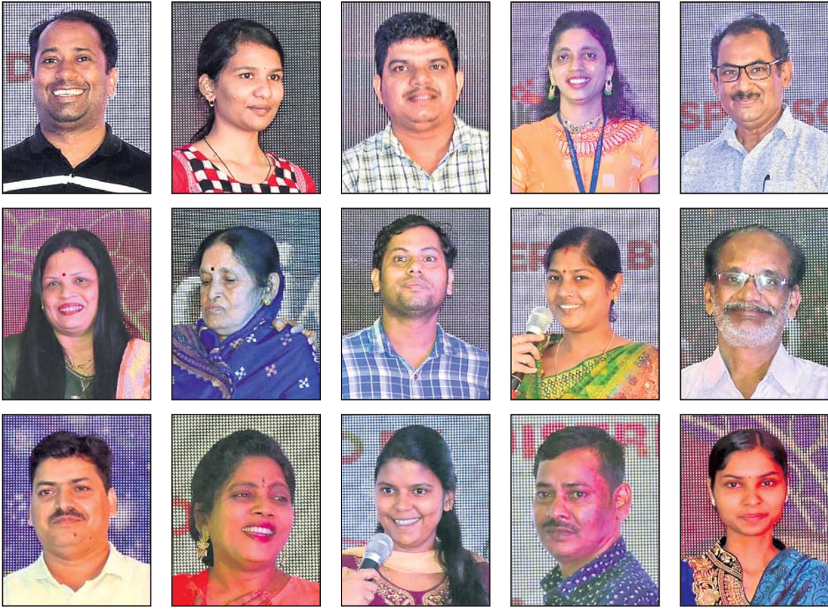
ପୁରସ୍କାର ବିତରଣ ଉତ୍ସବରେ ସ୍ୱର୍ଣ୍ଣ ମୁଦ୍ରା ପାଇଥିବା ବିଜେତାମାନେ ।