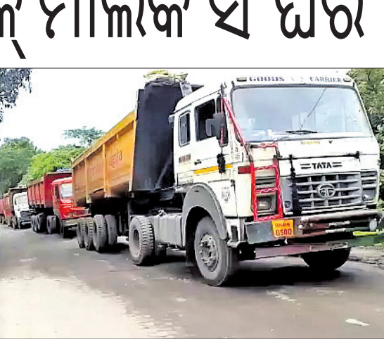
ଚକାଜାମ ଆନ୍ଦୋଳନ ଯୋଗୁଁ ରାସ୍ତାରେ ଶହ ଶହ ଟ୍ରକ୍ ଅଟକି ରହିଛି।

ପରିବହନ ଭଙ୍ଗା ବୃଦ୍ଧି ଦାବି ଏମ୍ପ୍ଲିଏସ୍ କୋଇଲା ଖଣିରୁ ପରିବହନ ବାଧାପ୍ରାପ୍ତ ହେଉଛି।