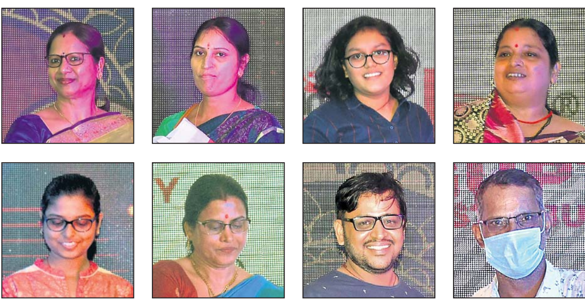
ପୁରସ୍କାର ବିତରଣ ଉତ୍ସବରେ ରୌପ୍ୟ ମୁଦ୍ରା ପାଇଥିବା ବିଜେତାମାନେ ।