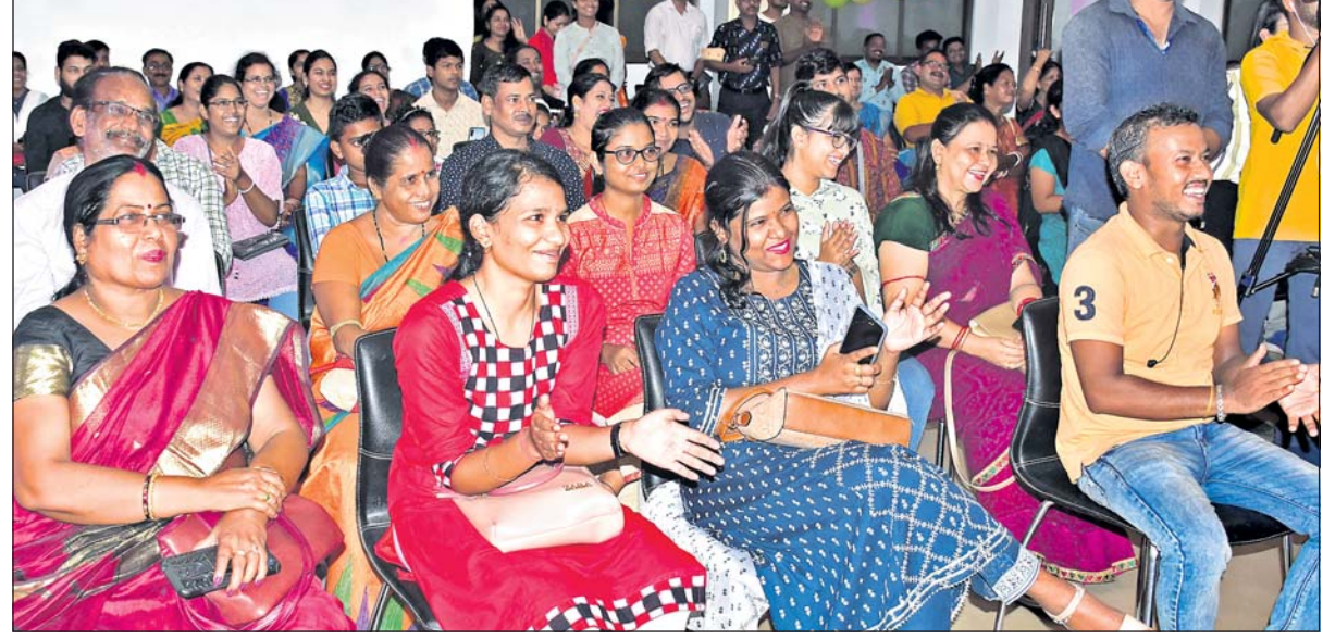
ପୁରସ୍କାର ବିତରଣ ଉତ୍ସବରେ ଉପସ୍ଥିତ ବିଜେତା, ସେମାନଙ୍କ ସମ୍ପର୍କୀୟ ଓ ଅନ୍ୟମାନେ ।