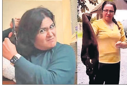
ଆୟୋଜନାକାରୀ ଜରାମାୟ ମହିଳା ମାହ୍ମା ଆମିନି