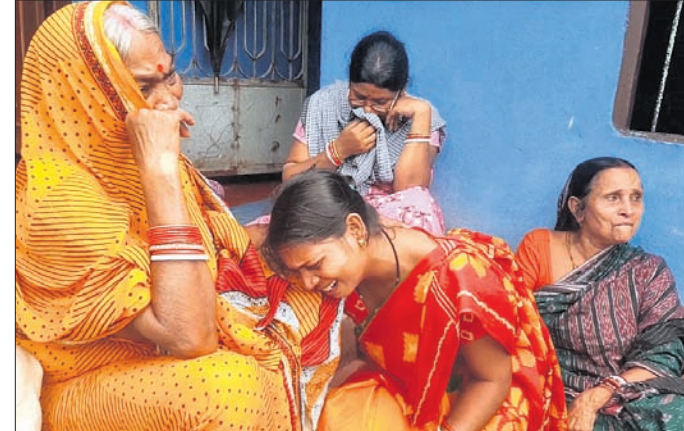
ତିହିଡ଼ି ବୁକ ମଙ୍ଗଳାଜୟ ଗାଁର ଶୋକାଳୁକ ପରିବାର ବର୍ଗ ।