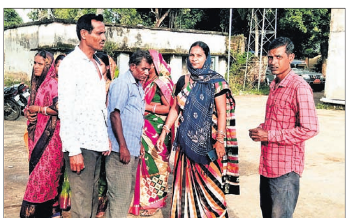
ବିତିଓଙ୍କୁ ଦାବିପତ୍ର ଦେବାକୁ ଯାଇଥିବା କୁରୁତା ସରପଞ୍ଚ ଓ ଖର୍ଚ୍ଚ ସଭାମାନେ ।

ବାହାନଗା ବ୍ଲକ୍ କୁରୁତା ପଞ୍ଚାୟତ ପିଲଓଙ୍କୁ ବାରମ୍ବାର ବଦଳି କରାଯାଉଥିବାରୁ ପଞ୍ଚାୟତର ଉନ୍ନୟନମୂଳକ କାର୍ଯ୍ୟରେ ବାଧା ଉଠୁଛି । ତେଣୁ ପିଲଓ (ପଞ୍ଚାୟତ କାର୍ଯ୍ୟନିର୍ବାହୀ ଅଧିକାରୀ)ମାନଙ୍କୁ ବାରମ୍ବାର ନ ବଦଳାଇବାକୁ ନେଇ ସରପଞ୍ଚ ଓ ଖର୍ଚ୍ଚ ସଭାସଭାମାନେ ବିତିଓଙ୍କୁ ଏକ ଦାବିପତ୍ର ପ୍ରଦାନ କରିଛନ୍ତି । ଯଦି ଅଭିଯୋଗ କରିବା ପରେ ପୁନର୍ବାର ପିଲଓଙ୍କୁ ବଦଳାଯାଏ ତା' ହେଲେ ସମସ୍ତ ଖର୍ଚ୍ଚ ସଭାସଭାମାନେ ସମେତ ନୂତନ ସରପଞ୍ଚ ବିତିଓଙ୍କ କାର୍ଯ୍ୟାଳୟ ସାମ୍ନାରେ ଧାରଣାରେ ବସିବେ ବୋଲି ଚେତାବନା ଦେଇଛନ୍ତି । କୁରୁତା ପଞ୍ଚାୟତରେ ନୂତନ ସରପଞ୍ଚ ଭାବେ ମାନତି ସେଠା ନିର୍ବାଚିତ ହୋଇ ଦୀର୍ଘ ୬ ମାସ ହେଲାଣି ସରପଞ୍ଚ ଭାବେ ଦାୟିତ୍ଵ ନେଇଥିଲେ ମଧ୍ୟ ଏପର୍ଯ୍ୟନ୍ତ କୌଣସି କାର୍ଯ୍ୟ କରିପାରୁନାହାନ୍ତି । ୬ମାସରେ ୩୫୫ ପିଲଓଙ୍କୁ ବଦଳି କରାଗଲାଣି । ତେବେ ଦାୟିତ୍ଵ ନେବାବେଳକୁ ପୂର୍ବରୁ ଯେଉଁ ପିଲଓ ଥିଲେ ତାଙ୍କୁ ବଦଳି ଅନ୍ୟତ୍ର କରାଯାଇଥିଲେ ମଧ୍ୟ ସେ ଏପର୍ଯ୍ୟନ୍ତ