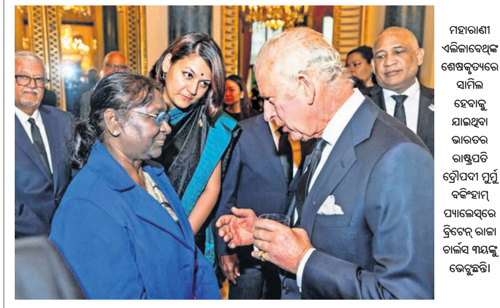
ମହାରାଣୀ ଏଲିଜାବେଥଙ୍କ ଶେଷକୃତ୍ୟରେ ସାମିଲ ହେବାକୁ ଯାଇଥିବା ଭାରତର ରାଷ୍ଟ୍ରପତି ଦ୍ରୌପଦୀ ମୂର୍ଦ୍ଧା

କୌଣସି ମାମଲାର ବିଚାର ବେଳେ କେଉଁ ପରିସ୍ଥିତିରେ ଅଦାଲତକୁ ନିର୍ଦ୍ଦେଶ ଦେବାକୁ ହେବ ସବୁ ମୃତ୍ୟୁ ଦଣ୍ଡଦେଶ ବେଳପାରିବେ, ତାହା ଉପରେ ଗାଇଡ଼ଲାଇନ ପ୍ରସ୍ତୁତି ଲାଗି ସୁପ୍ରିମକୋର୍ଟ ନିଜ ଆଦେଶକୁ ଏକ ମାମଲାକୁ ସାମନାରେ ୫ ଜଣ ଆସିଧାନିକ ପୀଠକୁ ପଠାଇଛନ୍ତି। ଏହି ମାମଲା ବୁହର ପୀଠରେ ଶୁଣାଣି ହେବା ଆବଶ୍ୟକ ବୋଲି ମତ ପ୍ରକାଶ ପାଇଥିବା ପ୍ରଧାନ ବିଚାରପତି ଉଦୟ ଉମେଶ ଲାଲିତଙ୍କ ଅଧିକାରରେ ଗଠିତ ଖଣ୍ଡପୀଠ କହିଛନ୍ତି। ମୃତ୍ୟୁଦଣ୍ଡ ଅଧିକାରୀଙ୍କୁ ହୋଇଥିବା ଏ ସମ୍ପର୍କରେ ବିଚାର କଲାବେଳେ ପରିସ୍ଥିତିକୁ ଚାହିଁ ଏହାକୁ କେତେଦୂର ସହମ କମ୍ କରାଯାଇପାରିବ, ସେଥିପାଇଁ ଅଭିଯୁକ୍ତଙ୍କ ସମସ୍ତ ସୁଯୋଗ ଦିଆଯିବ ଆବଶ୍ୟକ। ଗତ ମାସ ୧୭ରେ ସୁପ୍ରିମକୋର୍ଟ ଏଭଳି ଏକ ରାୟକୁ ଖାରଜ କରିବା ଅବସରରେ ଉପରୋକ୍ତ ଟିପ୍ପଣୀ ଦେଇଥିଲେ। ମୃତ୍ୟୁଦଣ୍ଡ ଦେବା ପୂର୍ବରୁ ସାଧାରଣତା ସମର୍ଥନ ସ୍ଥିତିକୁ ବିଚାରକୁ ନେବା ପାଇଁ ଗାଇଡ଼ଲାଇନ ପ୍ରସ୍ତୁତି ନିମନ୍ତେ ବୁହର ଖଣ୍ଡପୀଠକୁ ମାମଲା ପଠାଯାଇଛି।