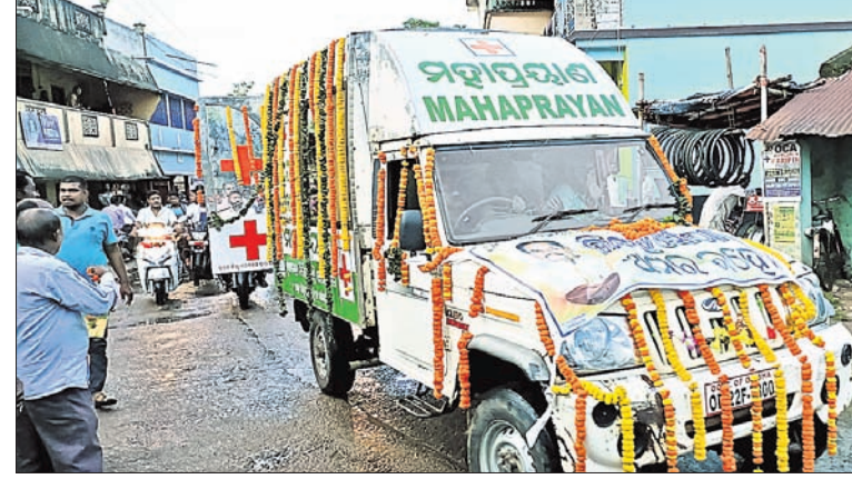
ବିଧାୟକ ବିଷ୍ଣୁ ସେଠୀଙ୍କ ପାର୍ଥିବ ଶରୀରକୁ ଶୋଭାଯାତ୍ରାରେ ନିଆଯାଇଛି ।