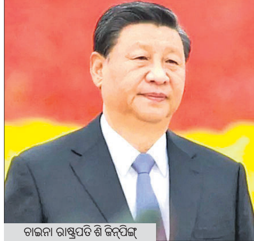
ଚାଇନା ରାଷ୍ଟ୍ରପତି ଶି ଜିନ୍ପିଙ୍ଗ