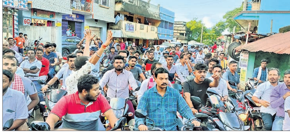
ଶୋଭାଯାତ୍ରାରେ ସାମିଲ ନେତା, କର୍ମୀ ଓ ଜନସାଧାରଣ ।