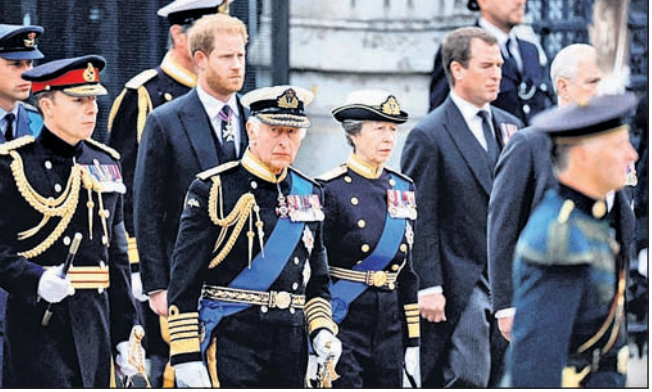
ଶେଷକୃତ୍ୟରେ ରାଜା ଚାର୍ଲସ୍ ୩ୟଙ୍କ ସହ ରାଜପରିବାର ସଦସ୍ୟ ସାମିଲ ହୋଇଛନ୍ତି।

ପରେ ୧୧ ଦିନ ଧରି ବ୍ରିଟେନ୍ରେ ଜାତୀୟ ଶୋକ ପାଳନ କରାଯାଇଥିଲା। ପ୍ରଥମ କରି ବ୍ରିଟେନ୍ ରାଜତନ୍ତ୍ରରେ ଏଲିଜାବେଥ ୨ୟ ୭ ଦଶମି ଧରି ଶାସନ ରହିଥିଲେ। ସୋମବାର ରାଜକାୟ, ଜଙ୍ଗଲେ ମହାରାଣୀଙ୍କ ଶେଷକୃତ୍ୟ ପାଇଁ ଭବ୍ୟ ଆୟୋଜନ କରାଯାଇଥିଲା। ଷ୍ଟେସିନସ୍‌ସ୍ତର ଆବେଦୁ ୪୦ କିମି ରାସ୍ତାରେ ଯାତ୍ରା କରି ମହାରାଣୀଙ୍କ କର୍ପିତ ସମେତ ରାଜ ପରିବାର ସଦସ୍ୟ ଏଲିଜାବେଥଙ୍କୁ ବିଦାୟ ଜଣାଇଥିଲେ। ଷ୍ଟେସିନସ୍‌ସ୍ତର ଥିବାବେଳେ ୯୬ ବର୍ଷୀୟ ଏଲିଜାବେଥ ୨ୟଙ୍କ ସେପ୍ଟେମ୍ବର ୮ ତାରିଖରେ ପରଲୋକ ହୋଇଥିଲା।