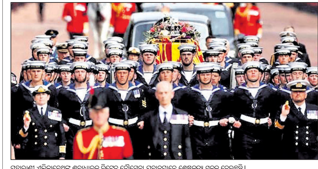
ମହାରାଣୀ ଏଲିଜାବେଥଙ୍କ ଶବାଧାରକୁ ବ୍ରିଟେନ୍ ନୌସେନା ସଦନମାନେ ଶେଷକୃତ୍ୟ ସ୍ଥଳକୁ ନେଇଛନ୍ତି।

ଲଣ୍ଡନ, ୧୯।୯: ବ୍ରିଟେନ୍ ମହାରାଣୀ ଏଲିଜାବେଥ ୨ୟଙ୍କୁ ସୋମବାର ଅନ୍ତିମ ବିଦାୟ ଦିଆଯାଇଛି। ରାଜ ପରିବାର ରାତିନାତି ଅନୁସାରେ ମହାରାଣୀଙ୍କ ଶେଷକୃତ୍ୟ ସମ୍ପର୍କ ହୋଇଛି। ଓଷ୍ଟସର କାସ୍‌ଲେର କୋରା ପାର୍ଟି ଭିତ୍ତି କଂଗ୍ରେସ୍ ନେତାଙ୍କୁ ସମନ ଦାବି କରିଥିଲା। ଏହା ଉପରେ ଜେରା ପାଇଁ ଭିତ୍ତି କଂଗ୍ରେସ୍ ନେତାଙ୍କୁ ସମନ ଦାବି କରିଥିଲା।