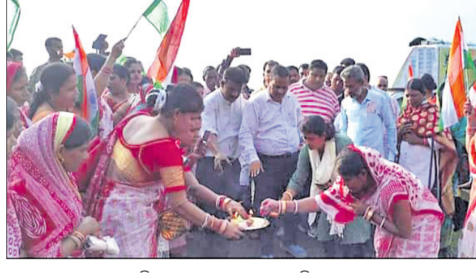
କନ୍ଦୋପୋଖରୀରେ ଅହିଂସା ରଥକୁ ସ୍ଵାଗତ କରାଯାଇଛି ।