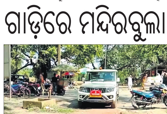
ବକ୍ତେଶ୍ୱର ପାଠ ସମ୍ମୁଖରେ ସିମ୍ଲିଆ ତହସିଲ ଗାଡ଼ି ।

ପାଟଣା, ୧୯/୯ (ସ.ପ୍ର.) ଏକ ବୋଇତ ବନ୍ଦଣା କାର୍ଯ୍ୟକ୍ରମ କେନ୍ଦୁଝର ଜିଲ୍ଲା ପାଟଣା ବୁକ୍ କର୍ମାଣ୍ଡାଳୟ ଅନୁଷ୍ଠିତ ହୋଇଥିଲା । କାର୍ଯ୍ୟକ୍ରମରେ ପଞ୍ଚାୟତ ଭଗପଣି ଗ୍ରାମରେ ସୋମବାର ପୁଣ୍ୟ ଅତିଥିଭାବେ ପାଟଣା ବିଧାୟକ ଖୁଦୁରୁକୁଣୀ ଓଷା ଉଦ୍‌ଯାପିତ ହୋଇଯାଇଛି । ଏହି ଅବସରରେ ଗାଁ ପୁଷ୍କରଣୀରେ