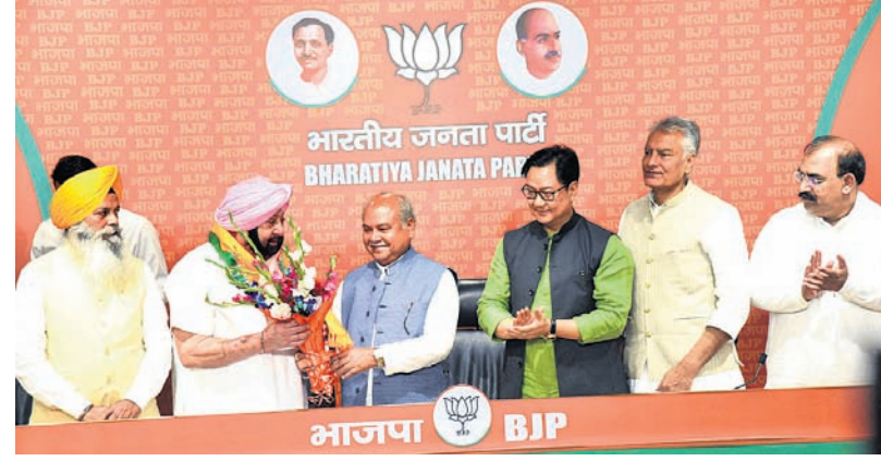
ଅମରିନ୍ଦର ସିଂ ଭାଜପାରେ ଯୋଗଦେବା ଅବସରରେ କେନ୍ଦ୍ରମନ୍ତ୍ରୀ ନରେନ୍ଦ୍ର ସିଂ ଟୋମାର ତାଙ୍କୁ ସ୍ୱାଗତ କରୁଛନ୍ତି ।

କଂଗ୍ରେସ ଛାଡ଼ି ନୂଆ ଦଳ ଗଠିଥିବା ପଞ୍ଜାବର ପୂର୍ବତନ ମୁଖ୍ୟମନ୍ତ୍ରୀ କ୍ୟାପ୍ଟେନ ଅମରିନ୍ଦର ସିଂ ଯୋମାବାର ଭାଜପାରେ ସାମିଲ ହୋଇଛନ୍ତି । ଏଥିପ୍ରତି ସେ ନିଜ ଦଳ ପଞ୍ଜାବ ଲୋକ କଂଗ୍ରେସ (ପିଏଲ୍‌ସି)କୁ ଭାଜପାରେ ମିଶାଇ ଦେଇଛନ୍ତି । ଏହି ମିଶ୍ରଣ ପରେ କେନ୍ଦ୍ର ଆଇନମନ୍ତ୍ରୀ କିରେନ୍ ରିଜିକୁ ଏବଂ କୃଷିମନ୍ତ୍ରୀ ନରେନ୍ଦ୍ର ସିଂ ଟୋମାର ଉପସ୍ଥିତ ଥିଲେ । ପୂର୍ତ୍ତନାୟୋଗ୍ୟ, ପଞ୍ଜାବ ବିଧାନସଭା ନିର୍ବାଚନ ପୂର୍ବରୁ କଂଗ୍ରେସ କେନ୍ଦ୍ରୀୟ ନେତୃତ୍ୱ ସହ ଅମରିନ୍ଦରଙ୍କ ମତପାର୍ଥକ୍ୟ ପରେ ସେ ପୁଣ୍ୟମନ୍ତ୍ରୀ ପଦ ଛାଡ଼ିଥିଲେ । ଏହା ପରେ ସେ ଦଳକୁ ବାହାରିଯାଇ ନୂଆ ଦଳ ପିଏଲ୍‌ସି ଗଠନ କରିଥିଲେ । ଭାଜପାରେ ପଞ୍ଜାବର ହେଉଥିବା ନେତାଙ୍କୁ ସ୍ୱାଗତ କରିବା ଅବସରରେ ଟୋମାର କହିଛନ୍ତି । କ୍ୟାପ୍ଟେନ ସର୍ବଦା ଦଳ ଅପେକ୍ଷା