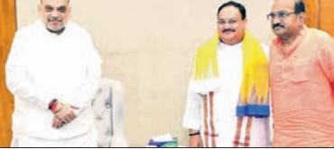
ବିରୋଧୀ ଦଳ ନେତାଙ୍କ ସହ କେନ୍ଦ୍ର ଗୃହମନ୍ତ୍ରୀ ଅମିତ ସାହା ଓ ଭାଜପା ରାଷ୍ଟ୍ରୀୟ ଅଧ୍ୟକ୍ଷ କେପି ନନ୍ଦା ।