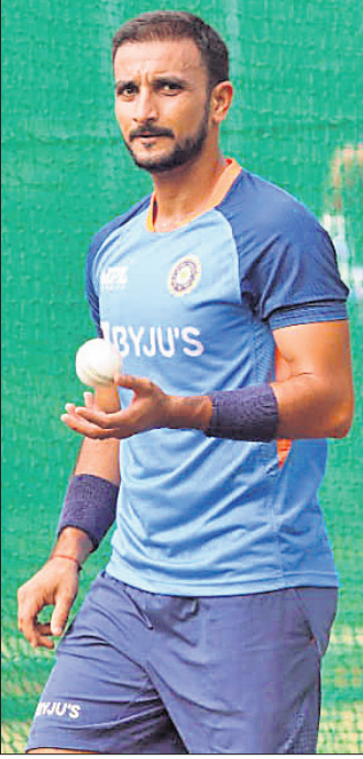
ସୋମବାର ନେତୃ ସଭାରେ ଭାରତ ଓ ହର୍ଷଲ ପଟେଲ।

ରହିଛି। ଏଥିଆ କପ୍ରେ କୋହଲି କ୍ୟାରିୟରର ପ୍ରଥମ ଅନ୍ତର୍ଜାତୀୟ ପଟେଲଙ୍କ ପ୍ରତ୍ୟାବର୍ତ୍ତନ ଫଳରେ ଦଳର ବୋଲିଂ ଆକ୍ରମଣ ମଜବୁତ ହୋଇଛି। ଲୋକେଶ ରାହୁଲ ଡାକ୍ ଓଫିସ୍ ପାର୍ଟନର ରହିବେ ବୋଲି ରୋହିତ ଶର୍ମା ଯଦିଓ ସ୍ୱସ୍ତ କରିଛନ୍ତି ତେବେ ବିରାଟ କୋହଲି ଜନିତ୍ ଓପର୍ କରିବା ସମ୍ଭାବନା ମଧ୍ୟ