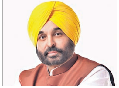
ପଞ୍ଜାବ ମୁଖ୍ୟମନ୍ତ୍ରୀ ଭଗସ୍କୃତ ମାନ୍

ପଞ୍ଜାବରେ ସରକାର ଭାଜପା ପାଇଁ ଭାଜପା ପକ୍ଷରୁ 'ଅପରେଶନ କମଳ' ଅଭିଯାନ ଚାଲିଥିବା ଆମ୍ ଆର୍‌ପା ପାର୍ଟି (ଏଏପି) ପକ୍ଷରୁ ଅଭିଯୋଗ ହୋଇଥିଲା । ଏଏପିର ୧୦ ଜଣ ବିଧାୟକଙ୍କୁ ଭାଜପା କିଶିନେବା ପାଇଁ ୨୫ କୋଟି ଲୋଟ୍ଟରୀ ଟଙ୍କା ଯାଚିଥିବା ଅଭିଯୋଗ ଉଠିଥିଲା । ବିଧାନସଭାରେ ସରକାରର ସଂଖ୍ୟାଗରିଷ୍ଠତା ପ୍ରମାଣ ଦେବା ଲାଗି ମୁଖ୍ୟମନ୍ତ୍ରୀ ଭଗସ୍କୃତ ମାନ୍ ସେପ୍ଟେମ୍ବର ୨୨କୁ ଏକ ସ୍ୱତନ୍ତ୍ର ଅଧିବେଶନ ଡାକିଛନ୍ତି । ଜନସାଧାରଣଙ୍କ ବିଶ୍ୱାସକୁ ବିଶ୍ୱାସ କୌଣସି ମୁଦ୍ରାରେ ମୂଲ୍ୟାୟନ କରାଯାଇପାରିବ ନାହିଁ । ସରକାରଙ୍କ ପକ୍ଷରେ ସଂଖ୍ୟାଗରିଷ୍ଠତା ରହିଛି କି ନାହିଁ, ତାହାର ପ୍ରମାଣ ଦେବା ନିମନ୍ତେ ୨୨ରେ ସ୍ୱତନ୍ତ୍ର ଅଧିବେଶନ ଡାକାଯାଇଥିବା ମାନ୍ ଟୁଇଟ୍ କରିଛନ୍ତି । ପୂର୍ତ୍ତନାୟୋଗ୍ୟ, ଭାଜପା ପକ୍ଷରୁ ଶାସକ