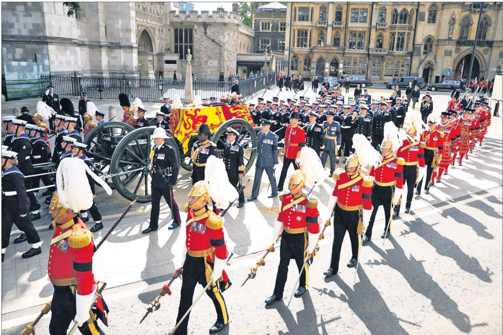
ତ୍ରିତେନ୍ ମହାରାଣୀ ଏଲିଜାବେଥ୍-୨ ଯକ୍ ଅଫିସ୍ ସଂସ୍କାରଣ ଯୋଗୁଁ ଚାକ୍ ମରଶାଲରୁ ଶୋଭାଯାତ୍ରାରେ ଲଞ୍ଜନ ଫ୍ରେସ୍ ମିନିଷ୍ଟର ଆବେଦୁ ଫ୍ରେସ୍ କାୟଲେ ଅଭିଯୁକ୍ତ ନିଆଯାଇଛି।

ରାଜ୍ୟ ସରକାରୀ କର୍ମଚାରୀଙ୍କ ପାଇଁ ଖୁସି ଖବର। ସରକାରୀ କର୍ମଚାରୀଙ୍କ ମହଙ୍ଗା ଭଡାରେ ୩ ପ୍ରତିଶତ ବୃଦ୍ଧି କରିଛନ୍ତି। ଏ ସଂକ୍ରାନ୍ତ ପ୍ରସ୍ତାବକୁ ପୂର୍ଣ୍ଣାଙ୍ଗୀନ ନବୀନ ପଞ୍ଚନାୟକ ଯୋଗଦାନ ଅନୁମୋଦନ କରିଛନ୍ତି। ଏଥିରେ ଉପସ୍ଥାପନା ସରକାରୀ କର୍ମଚାରୀମାନଙ୍କ ମହଙ୍ଗା ଭଡା ୩୧ରୁ ୩୪ ପ୍ରତିଶତକୁ ବୃଦ୍ଧି ପାଇଛି। ଏହି ବର୍ଦ୍ଧିତ ମହଙ୍ଗା ଭଡା ପିଛା ଭାବେ ୨୦୨୨ ଜାନୁୟାରୀ ପହିଲାକୁ ଲାଗୁ କରାଯାଇଛି। ଏଥିସହିତ ସଂଶୋଧିତ ହାରରେ ପେନ୍ସନ ପାଉଥିବା ଅବସରପ୍ରାପ୍ତ କର୍ମଚାରୀମାନେ ମଧ୍ୟ ଉପକୃତ ହେବେ। କର୍ମଚାରୀ ଓ ପେନ୍ସନଭୋଗୀମାନେ ଚଳିତ ମାସର ଦରମା ସହିତ ଏହି ବର୍ଦ୍ଧିତ ଭଡା ପାଇବେ। ୨୦୨୨ ଜାନୁୟାରୀରୁ ଅଗଷ୍ଟ ପର୍ଯ୍ୟନ୍ତ ବକେୟା ଭଡା ଅଳଗା ପ୍ରଦାନ କରାଯିବ। ଏହାଦ୍ୱାରା ରାଜ୍ୟ ସରକାରଙ୍କ ୪ ଲକ୍ଷ କର୍ମଚାରୀ ଓ ୩.୫ ଲକ୍ଷ ପେନ୍ସନଭୋଗୀ ଉପକୃତ ହେବେ।