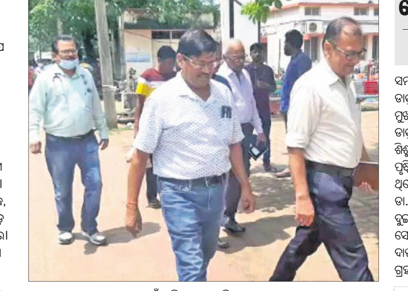
ତଦନ୍ତ ପାଇଁ ଆସିଥିବା ସ୍ୱାସ୍ଥ୍ୟ ବିଭାଗ ଅଧିକାରୀ।

ଭୁବନେଶ୍ୱର, ୧୯୯୯ (ବୁଧବାର): ଭାରତ ଏବଂ କେନ୍ଦ୍ରୀୟ ବଙ୍ଗୋପସାଗରରେ ସୃଷ୍ଟି ହୋଇଥିବା ସୂକ୍ଷ୍ମବଳୟ ସୋମବାର ଲକ୍ଷ୍ମୀପାପ କ୍ଷେତ୍ରରେ ପରିଣତ ହୋଇଛି।