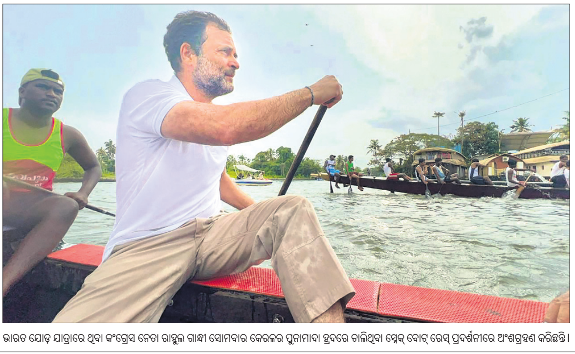
ଭାରତ ଯୋଡ଼ା ଯାତ୍ରାରେ ଥିବା କଂଗ୍ରେସ ନେତା ରାହୁଲ ଗାନ୍ଧୀ ଯୋମାବାର କେରଳର ପୁନାମାଦା ହ୍ରଦରେ ଚାଲିଥିବା ସ୍ପେକ୍ଟାକୁଲାର୍ ସ୍ପୋର୍ଟସ୍ ପ୍ରଦର୍ଶନୀରେ ଅଂଶଗ୍ରହଣ କରିଛନ୍ତି ।