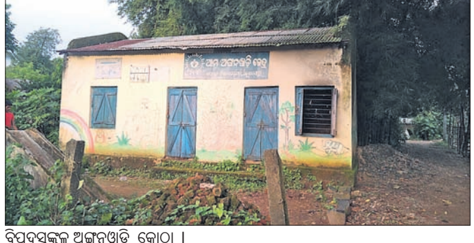
ବିପଦସଙ୍କୁଳ ଅଜ୍ଞାନଘାତି କୋଠା।

୫ ବର୍ଷ ହେବ ଅଜ୍ଞାନଘାତି କୋଠାକୁ ବିପଦସଙ୍କୁଳ ଘୋଷଣା କଲା ପ୍ରଶାସନ।