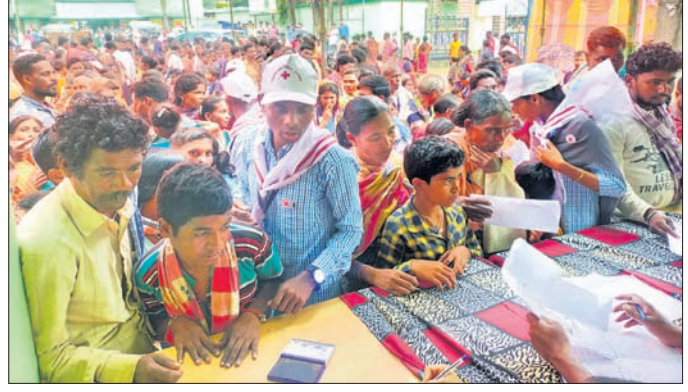
ଶିବିରକୁ ଆସିଥିବା ଦିବ୍ୟାଙ୍ଗ ଓ ତାଙ୍କ ସହଯୋଗୀମାନେ।