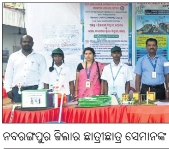
ନବରଙ୍ଗପୁର ଜିଲ୍ଲାର ଛାତ୍ରାଛାତ୍ରୀ ସେମାନଙ୍କ ପ୍ରକଳ୍ପ ପ୍ରଦର୍ଶନ କରୁଛନ୍ତି।

ପରେ ଶାସ୍ତ୍ରୀ ଭବନରେ ଏକ ସଭା କରାଯାଇଛି। ଉକ୍ତ ସଭାରେ ଅଧିକ