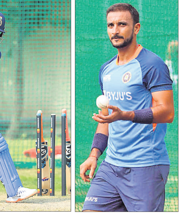
ସୋମବାର ନେତୃ ସଭାରେ ଭାରତର ରିଷଭ ପଟ୍ଟ ଓ ହର୍ଷଲ ପଟେଲ।

ଭାରତ-ଅଷ୍ଟ୍ରେଲିଆ ଟି୨୦ ସିରିଜ ଆଜିଠାରୁ ମ୍ୟାଚ ଆରମ୍ଭ: ରାତି ୭ଟା ୩୦। ଭାରତୀୟ ଦଳର ଅଧିନାୟକ ରିଷଭ ପଟ୍ଟ ଏବଂ ଅଷ୍ଟ୍ରେଲିଆ ଦଳର ଅଧିନାୟକ ହର୍ଷଲ ପଟେଲ ମ୍ୟାଚ ଆରମ୍ଭ କରିବେ। ଭାରତୀୟ ଦଳର ଅଧିନାୟକ ରିଷଭ ପଟ୍ଟ ଏବଂ ଅଷ୍ଟ୍ରେଲିଆ ଦଳର ଅଧିନାୟକ ହର୍ଷଲ ପଟେଲ ମ୍ୟାଚ ଆରମ୍ଭ କରିବେ।