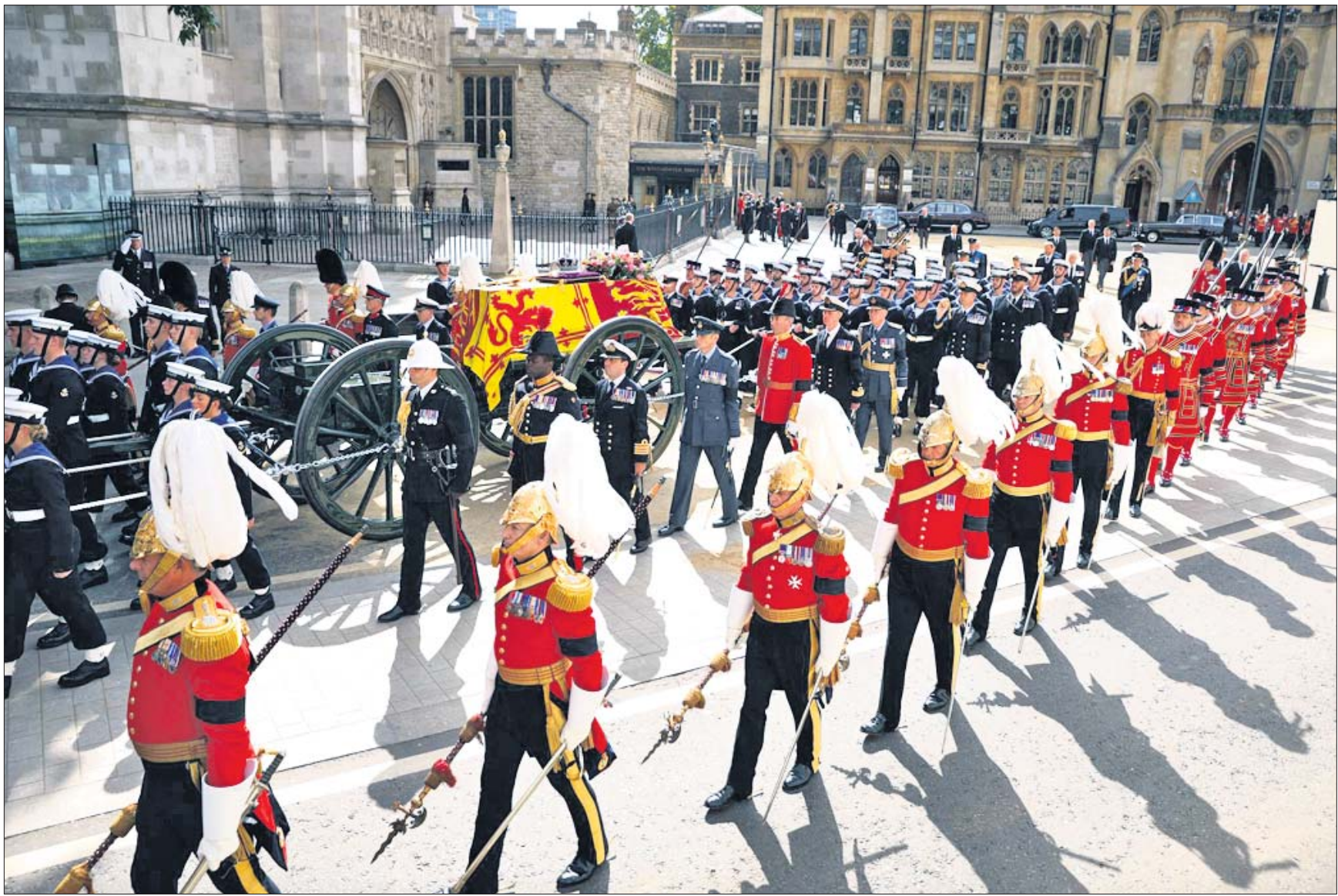
ତ୍ରିତେନ ମହାରାଣୀ ଏଲିଜାବେଥ-୨ ଯକ୍ ଅଫିସ ସଂସ୍କାରଣ ଯୋଗ୍ୟ ଚାକ୍ ମରଶାଲରୁ ଶୋଭାଯାତ୍ରାରେ ଲଞ୍ଜନ ଫ୍ରେସ୍ ମିନିଷ୍ଟର ଆବେଦୁ ଡ୍ରିଏର କାଏଲେ ଅଭିଯୁକ୍ତ ନିଆଯାଇଛି।

ରାଜ୍ୟ ସରକାରୀ କର୍ମଚାରୀଙ୍କ ପାଇଁ ଖୁସି ଖବର। ସରକାରୀ କର୍ମଚାରୀଙ୍କ ମହଙ୍ଗା ଭଡାରେ ୩ ପ୍ରତିଶତ ବୃଦ୍ଧି କରିଛନ୍ତି। ଏ ସଂକ୍ରାନ୍ତ ପ୍ରସ୍ତାବକୁ ପୂର୍ଣ୍ଣାଙ୍ଗୀନ ନବୀନ ପଟ୍ଟନାୟକ ଯୋଗଦାନ ଅନୁମୋଦନ କରିଛନ୍ତି। ଏଥିରେ ଉପସାଧାରଣ ସରକାରୀ କର୍ମଚାରୀମାନଙ୍କ ମହଙ୍ଗା ଭଡା ୩୧ରୁ ୩୪ ପ୍ରତିଶତକୁ ବୃଦ୍ଧି ପାଇଛି। ଏହି ବର୍ଦ୍ଧିତ ମହଙ୍ଗା ଭଡା ପିଛା ଭାବେ ୨୦୨୨ ଜାନୁୟାରୀ ପହିଲାକୁ ଲାଗୁ କରାଯାଇଛି। ଏଥିସହିତ ସଂଶୋଧିତ ହାରରେ ପେନ୍ସନ ପାଉଥିବା ଅବସରପ୍ରାପ୍ତ କର୍ମଚାରୀମାନେ ମଧ୍ୟ ଉପକୃତ ହେବେ। କର୍ମଚାରୀ ଓ ପେନ୍ସନଭୋଗୀମାନେ ଚଳିତ ମାସର ଦରମା ସହିତ ଏହି ବର୍ଦ୍ଧିତ ଭଡା ପାଇବେ। ୨୦୨୨ ଜାନୁୟାରୀରୁ ଅଗଷ୍ଟ ପର୍ଯ୍ୟନ୍ତ ବକେୟା ଭଡା ଅଲଗା ପ୍ରଦାନ କରାଯିବ। ଏହାଦ୍ୱାରା ରାଜ୍ୟ ସରକାରଙ୍କ ୪ ଲକ୍ଷ କର୍ମଚାରୀ ଓ ୩.୫ ଲକ୍ଷ ପେନ୍ସନଭୋଗୀ ଉପକୃତ ହେବେ।