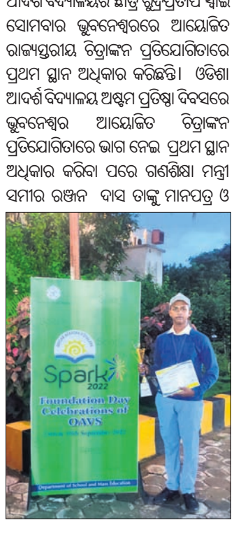
ପାପଡ଼ାହାଣ୍ଡିର ରୁଦ୍ର ପ୍ରଥମ ଦିନରେ

୪ ବର୍ଷ ହେବ ଅଜ୍ଞାନଘାତି କୋଠାକୁ ବିପଦସଙ୍କୁଳ ଘୋଷଣା କଲା ପ୍ରଶାସନ।