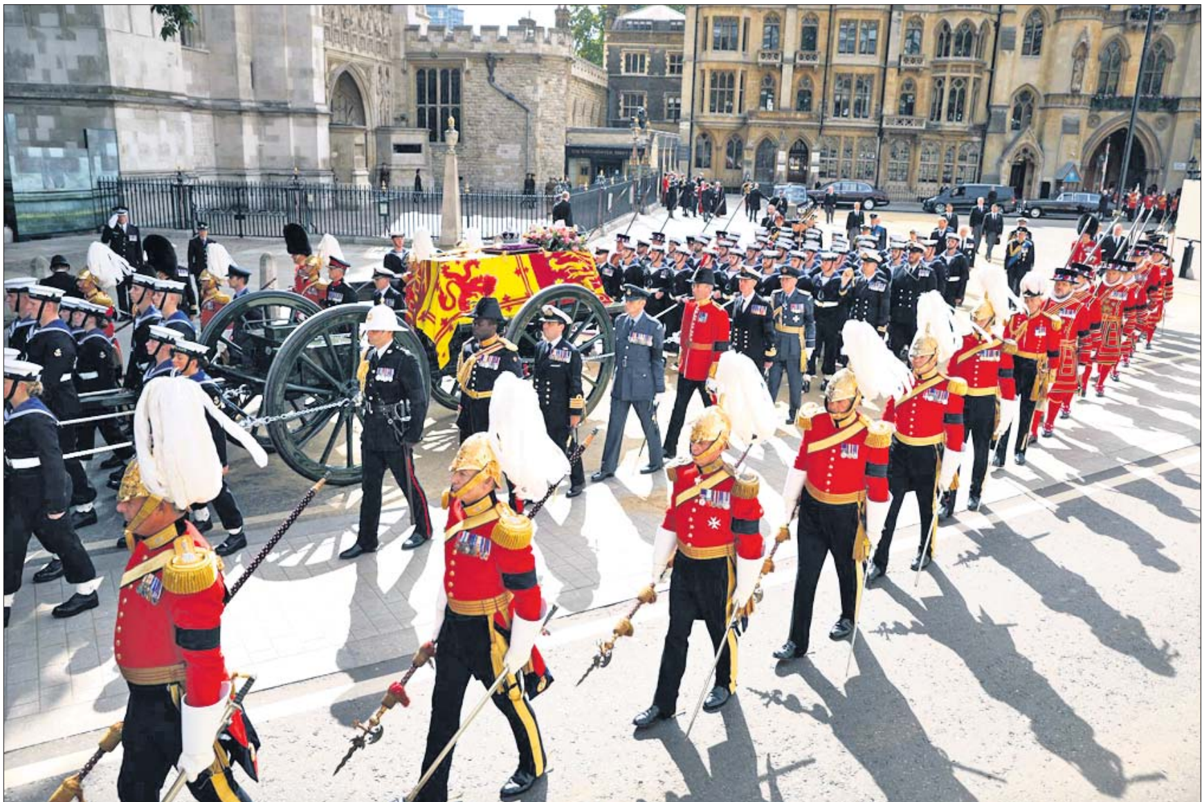
ତ୍ରିତେନ୍ ମହାରାଣୀ ଏଲିଜାବେଥ୍-୨ ଯକ୍ ଅତିଥି ସଂସ୍କାରଣାଗି ସୋମବାର ତାଙ୍କ ମରଣୋତ୍ସବ ଶୋଭାଯାତ୍ରାରେ ଲଞ୍ଜନର ଫ୍ରେଣ୍ଡ୍‌ସ୍ ଫୁଟ୍ବଲ ଆବେଦୁ ଫ୍ରେଣ୍ଡ୍‌ସ୍ କାମ୍ବଲେ ଅଭିଯୁକ୍ତ ନିଆଯାଇଛି।

ରାଜ୍ୟ ସରକାରୀ କର୍ମଚାରୀଙ୍କ ପାଇଁ ଖୁସି ଖବର। ସରକାରୀ କର୍ମଚାରୀଙ୍କ ମହଙ୍ଗା ଭଡାରେ ୩ ପ୍ରତିଶତ ବୃଦ୍ଧି କରିଛନ୍ତି। ଏ ସଂକ୍ରାନ୍ତ ପ୍ରସ୍ତାବକୁ ପୂର୍ଣ୍ଣାଙ୍ଗୀନ ନବୀନ ପଞ୍ଚନାୟକ ସୋମବାର ଅନୁମୋଦନ କରିଛନ୍ତି। ଏଥିରେ ଉପସ୍ଥାପନା ସରକାରୀ କର୍ମଚାରୀମାନଙ୍କ ମହଙ୍ଗା ଭଡା ୩୧ରୁ ୩୪ ପ୍ରତିଶତକୁ ବୃଦ୍ଧି ପାଇଛି। ଏହି ବର୍ଦ୍ଧିତ ମହଙ୍ଗା ଭଡା ପିଛା ଭାବେ ୨୦୨୨ ଜାନୁୟାରୀ ପହିଲାକୁ ଲାଗୁ କରାଯାଇଛି। ଏଥିସହିତ ସଂଶୋଧିତ ହାରରେ ପେନ୍ସନ ପାଉଥିବା ଅବସରପ୍ରାପ୍ତ କର୍ମଚାରୀମାନେ ମଧ୍ୟ ଉପକୃତ ହେବେ। କର୍ମଚାରୀ ଓ ପେନ୍ସନଭୋଗୀମାନେ ଚଳିତ ମାସର ଦରମା ସହିତ ଏହି ବର୍ଦ୍ଧିତ ଭଡା ପାଇବେ। ୨୦୨୨ ଜାନୁୟାରୀରୁ ଅଗଷ୍ଟ ପର୍ଯ୍ୟନ୍ତ ବକେୟା ଭଡା ଅଲଗା ପ୍ରଦାନ କରାଯିବ। ଏହାଦ୍ୱାରା ରାଜ୍ୟ ସରକାରଙ୍କ ୪ ଲକ୍ଷ କର୍ମଚାରୀ ଓ ୩.୫ ଲକ୍ଷ ପେନ୍ସନଭୋଗୀ ଉପକୃତ ହେବେ।