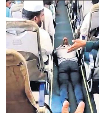
ପାଖରେ ବସିଥିବା ଯାତ୍ରୀଙ୍କୁ ହଟାଇ ବିମାନ ଫ୍ଲୋରରେ ଗଡ଼ିପଡ଼ିଥିଲେ। ଯୁବକଙ୍କ ଏ ପ୍ରକାର ବ୍ୟବହାରରେ ଅନ୍ୟ

ଯାତ୍ରୀ ବିଚିତ୍ର ହୋଇ ଏହାର ସୂଚନା ପୁଲିସ୍ କର୍ତ୍ତୃପକ୍ଷକୁ ଦେଇଥିଲେ। କ୍ରମ ମେଧରେ ସେଠାରେ ପହଞ୍ଚି ଯୁବକଙ୍କୁ ଯେତେ