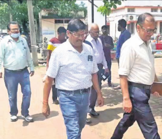
ତଦନ୍ତ ପାଇଁ ଆସିଥିବା ସ୍ଵାସ୍ଥ୍ୟ ବିଭାଗ ଅଧିକାରୀ।