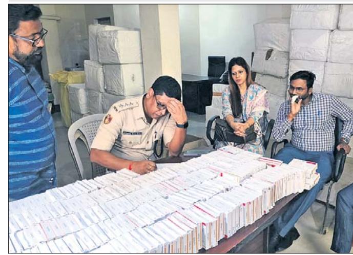
କଟକ ମାଲଗୋଷ୍ଠୀପୁର ଏକ ଗ୍ରାନ୍ତପୋର୍ଟ ଏକ୍ସକ୍ସିଜୁରେ ସୋମବାର ପୋଲିସ୍ ଦ୍ୱାରା ଜବତ ଟେକ୍ସ-୪୦। ପରେ ଗ୍ରାନ୍ତପୋର୍ଟରୁ ଉଦ୍ଧୃତ କରାଯାଇଥିଲା।