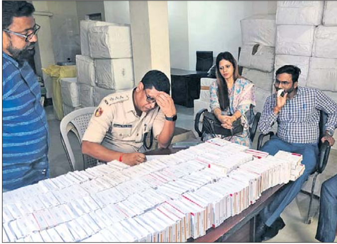
କଟକ ମାଲଗୋଦାମସ୍ଥିତ ଏକ ଗ୍ରାହକପୂର୍ବକ ଷ୍ଟିପ୍ରେ ଯୋଗାଣ ଚାକ୍ ଜବତ ଚେକ୍‌ମା-୪୦। ପରେ ଗ୍ରହଣୀତ ମାମଲା ରୁକ୍ତ କରାଯାଇଥିଲା।