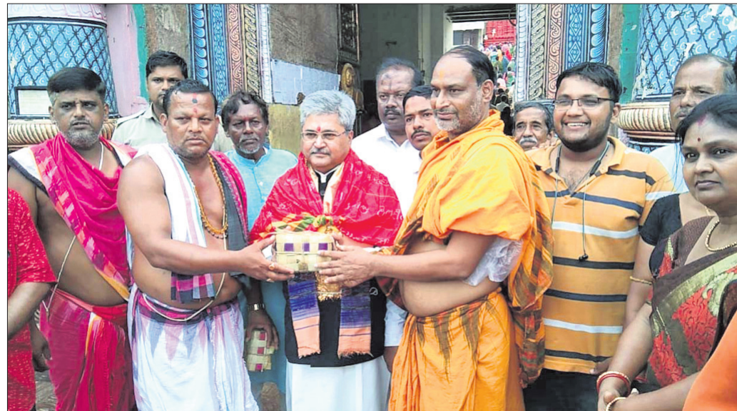
ଶ୍ରୀମନ୍ଦିରରେ ଯୋଗବାର ମହାପ୍ରଭୁଙ୍କୁ ଦର୍ଶନ ସାରି ଭାଜପା ରାଷ୍ଟ୍ରୀୟ ସାଧାରଣ ସମ୍ପାଦକ ଦୁଷ୍ମନ୍ତ କୁମାର ଗୌତମ ଫେରୁଛନ୍ତି।