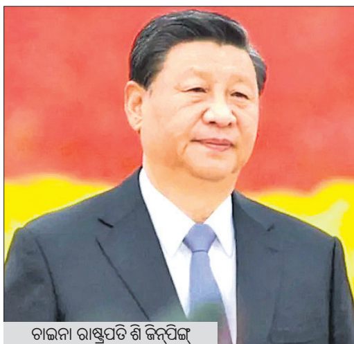
ଚାଇନା ରାଷ୍ଟ୍ରପତି ଶି ଜିନ୍‌ପିଙ୍ଗ