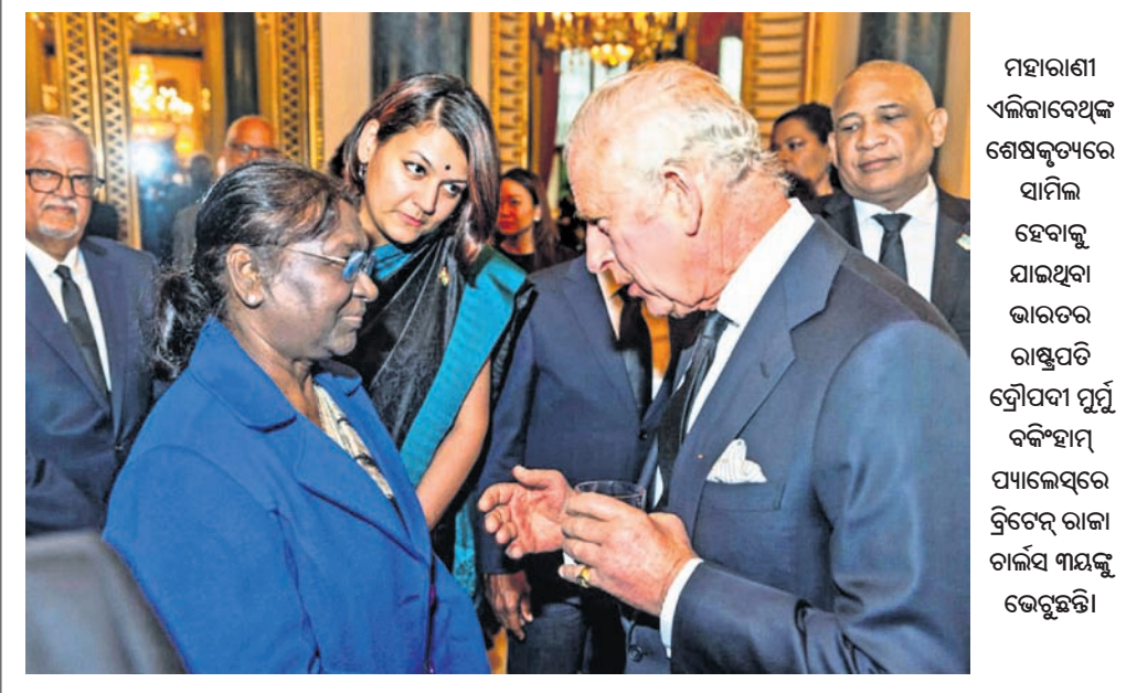
ମହାରାଜା ଏଲିଜାବେଥଙ୍କ ଶେଷକୃତ୍ୟରେ ସାମାଜିକ ହେବାକୁ ଯାଇଥିବା ଭାରତର ରାଷ୍ଟ୍ରପତି ଦ୍ରୌପଦୀ ମୁର୍ମୁ

ପ୍ରତି ଫ୍ରେନ୍‌ସ ଓ ତାଙ୍କ ପୁଅ ପ୍ରିନ୍ସ ଚାର୍ଲ୍ସ, ପ୍ରିନ୍ସେସ୍ ଚାର୍ଲୋଟ୍, ପ୍ରିନ୍ସ ହ୍ୟାରି, ପ୍ରିନ୍ସେସ୍ ଲୋଡ଼ି, ପ୍ରିନ୍ସ ଏଡ୍ୱାର୍ଡ୍‌ଙ୍କ ସମେତ ରାଜ ପରିବାର ସଦସ୍ୟ ଏଲିଜାବେଥଙ୍କୁ ବିଦାୟ ଜଣାଇଥିଲେ।