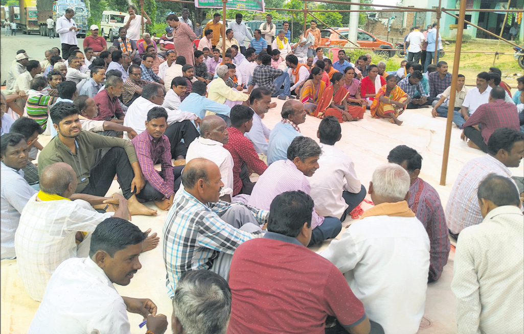
ରାଜପଥ ଉପରେ ବସିରହିଛନ୍ତି ଗାଷୀ।

କମଳକିରୀ, ୧୯୮୯(ଡି.ଏନ.ଏ.): ରାଜପଥରେ ବସିରହିଛନ୍ତି ଗାଷୀ। କମଳକିରୀ, ୧୯୮୯(ଡି.ଏନ.ଏ.): ରାଜପଥରେ ବସିରହିଛନ୍ତି ଗାଷୀ। କମଳକିରୀ, ୧୯୮୯(ଡି.ଏନ.ଏ.): ରାଜପଥରେ ବସିରହିଛନ୍ତି ଗାଷୀ।