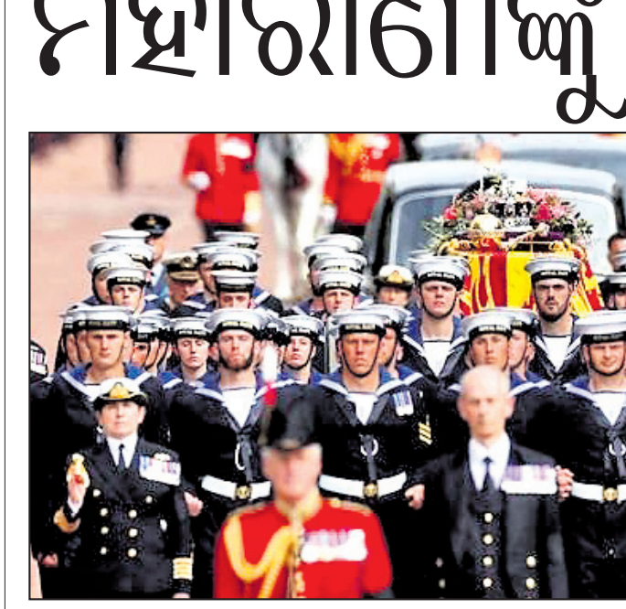
ମହାରାଜା ଏଲିଜାବେଥଙ୍କ ଶବାଧାରକୁ ବ୍ରିଟେନ୍ ନୌସେନା ସଦନମାନେ ଶେଷକୃତ୍ୟ ସ୍ଥଳକୁ ନେଇଛନ୍ତି।

ଲଣ୍ଡନ, ୧୯୯୯: ବ୍ରିଟେନ୍ ମହାରାଜା ଏଲିଜାବେଥଙ୍କୁ ସୋମବାର ଅଭିମାନ ବିଦାୟ ଦିଆଯାଇଛି। ରାଜ ପରିବାର ଗତିନୀତି ଅନୁସାରେ ମହାରାଜାଙ୍କ ଶେଷକୃତ୍ୟ ସମ୍ପନ୍ନ ହୋଇଛି।