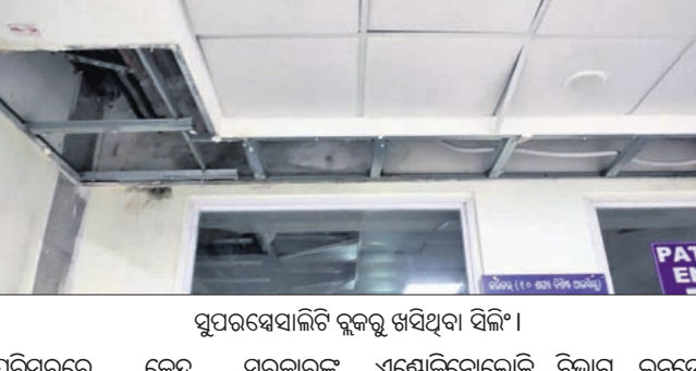
ସିଲିଂ ଖସିବା ପରେ ପୁଣି ଖସିଲା ସିଲିଂ।

ଏମ୍‌କେସିଜିରୁ ପୁଣି ଖସିଲା ସିଲିଂ। ଏମ୍‌କେସିଜିରୁ ପୁଣି ଖସିଲା ସିଲିଂ। ଏମ୍‌କେସିଜିରୁ ପୁଣି ଖସିଲା ସିଲିଂ।