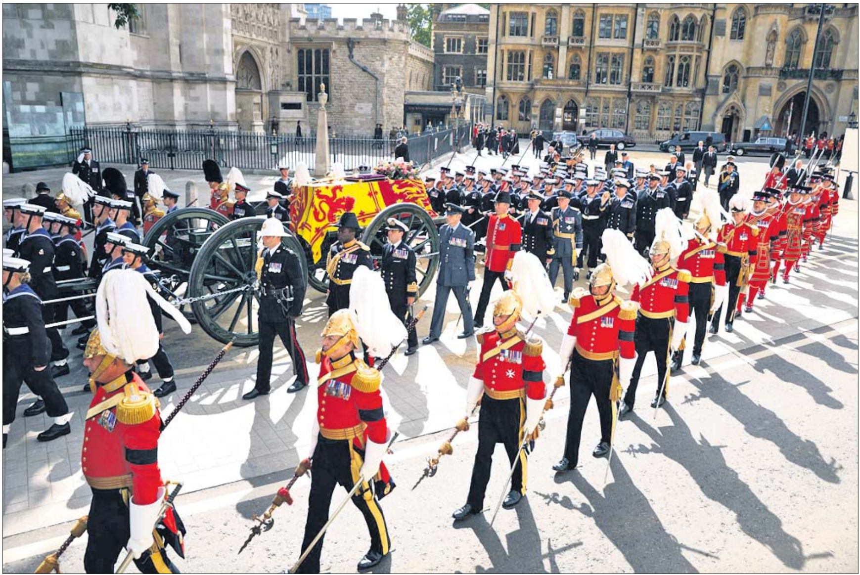
ତ୍ରିତେନ୍ ମହାରାଣୀ ଏଲିଜାବେଥ୍-୨ୟଙ୍କ ଅଭିମୁଖ୍ୟରେ ଯୋଗାଣ ଚାକ୍ ମରଶାରରୁ ଶୋଭାଯାତ୍ରାରେ ଲଞ୍ଜନର ଫ୍ରେସ୍‌ମିନ୍‌ସ୍ ଆବେଦୁ ଡ୍ରେସ୍ କାନ୍ଦେ ଅଭିମୁଖ୍ୟ ନିଆଯାଉଛି।

ରାଜ୍ୟ ସରକାରୀ କର୍ମଚାରୀଙ୍କ ପାଇଁ ଖୁସି ଖବର। ସରକାରୀ କର୍ମଚାରୀଙ୍କ ମହଙ୍ଗା ଭରାରେ ୩ ପ୍ରତିଶତ ବୃଦ୍ଧି କରିଛନ୍ତି। ଏ ସଂକ୍ରାନ୍ତ ପ୍ରସ୍ତାବକୁ ପୂର୍ଣ୍ଣାଙ୍ଗୀନ ନବୀନ ପଞ୍ଜନାୟକ ସୋମବାର ଅନୁମୋଦନ କରିଛନ୍ତି। ଏଥିରେ ଉପସ୍ଥାପନା କରିଛନ୍ତି କର୍ମଚାରୀମାନଙ୍କ ମହଙ୍ଗା ଭରା ୩୧ରୁ ୩୪ ପ୍ରତିଶତକୁ ବୃଦ୍ଧି ପାଇଛି। ଏହି ବର୍ଦ୍ଧିତ ମହଙ୍ଗା ଭରା ପାଇଁ ୨୦୨୨ ଜାନୁୟାରୀ ପହିଲାକୁ ଲାଗୁ କରାଯାଇଛି। ଏଥିପ୍ରତି ସଂଶୋଧିତ ହାରରେ ପେନ୍‌ସନ ପାଉଥିବା ଅବସରପ୍ରାପ୍ତ କର୍ମଚାରୀମାନେ ମଧ୍ୟ ଉପକୃତ ହେବେ। କର୍ମଚାରୀ ଓ ପେନ୍‌ସନଭୋଗୀମାନେ ଚଳିତ ମାସର ଦରମା ସହିତ ଏହି ବର୍ଦ୍ଧିତ ଭରା ପାଇବେ। ୨୦୨୨ ଜାନୁୟାରୀରୁ ଅଗଷ୍ଟ ପର୍ଯ୍ୟନ୍ତ ବକେୟା ଭରା ଅଲଗା ପ୍ରଦାନ କରାଯିବ। ଏହାଦ୍ୱାରା ରାଜ୍ୟ ସରକାରଙ୍କ ୪ ଲକ୍ଷ କର୍ମଚାରୀ ଓ ୩.୫ ଲକ୍ଷ ପେନ୍‌ସନଭୋଗୀ ଉପକୃତ ହେବେ।