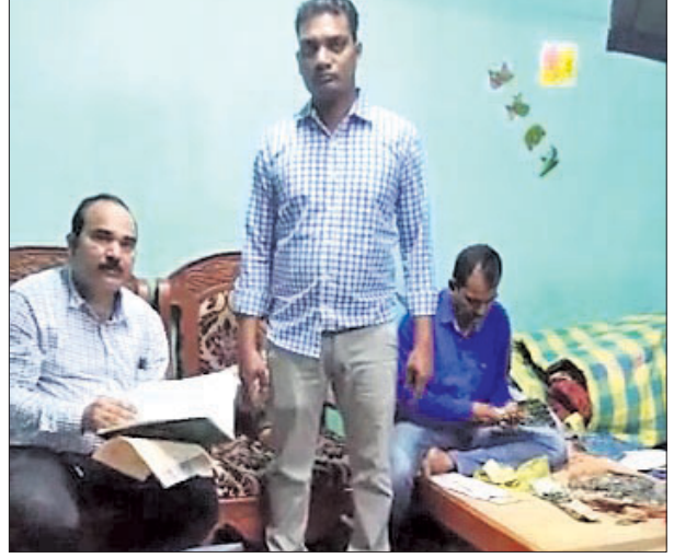
ଭିଜିଲାଟ୍ ବିଭାଗ ଅଧିକାରୀମାନେ ଅତିରିକ୍ତ ତହସିଲଦାରଙ୍କ ବାସଭବନରେ ଖାନଡ଼ଳା କରିଥିଲେ।