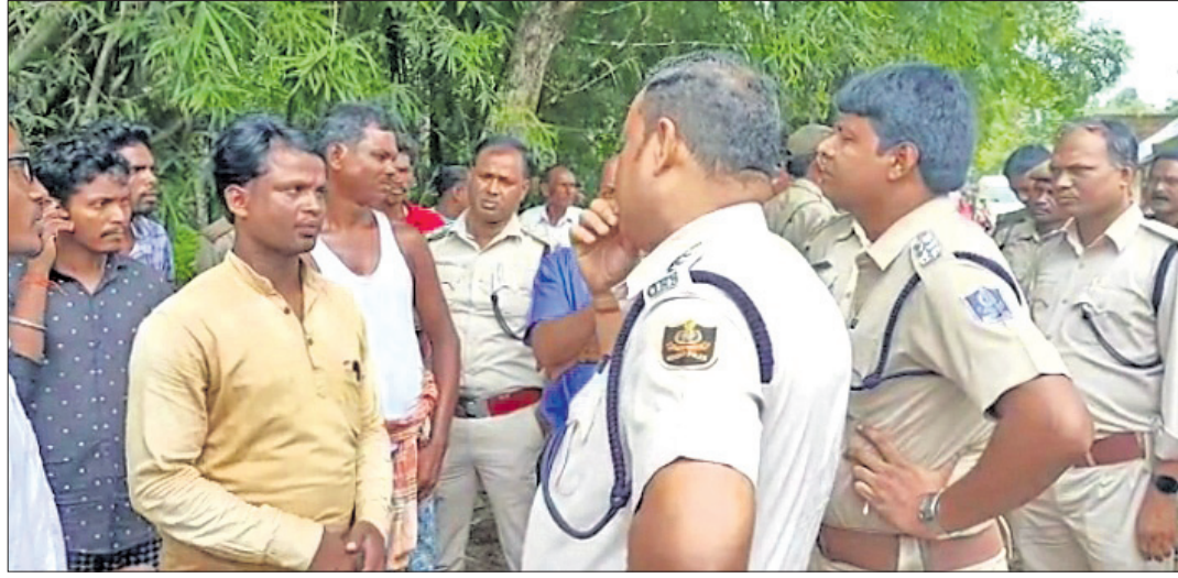
ଉତ୍ତମ ଲୋକଙ୍କ ସହ ବନ ବିଭାଗ ଅଧିକାରୀ ଆଲୋଚନା କରୁଛନ୍ତି

କରିବାରୁ ମଙ୍ଗଳବାର ରାତିରୁ ଅଟକ ଥିବା ବନ କର୍ମଚାରୀମାନଙ୍କୁ ୧୪ ଯମ୍ବ ପରେ ମୁକ୍ତିଲାଭ ହେବ ବୋଲି କୁହାଯାଇଛି।