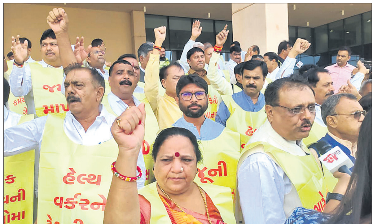
ବିଧାନସଭା ବାହାର କରିବା ପାଇଁ ଗାନ୍ଧିଜୀ ଓ ନିଲମ୍ବିତ କଂଗ୍ରେସ ବିଧାୟକମାନେ ହୋଇଛନ୍ତି।

ଗାନ୍ଧିଜୀ, ୨୧୯ ବିଧାୟକଙ୍କ ସହ ସ୍ଵାଧୀନ ବିଧାୟକ ଜିଲ୍ଲାରେ ବିଧାନସଭା ବାହାର କରିଦିଆଯାଇଛି।