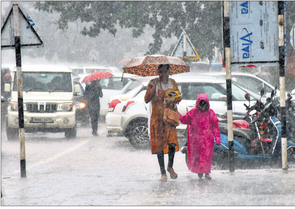
ଭୁବନେଶ୍ୱରରେ ଗୁରୁବାର ମଧ୍ୟାହ୍ନରେ ହୋଇଥିବା ପ୍ରବଳ ବର୍ଷା ।