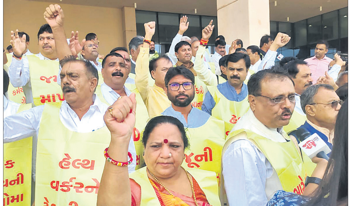
ବିଧାନସଭା ବାହାର କରିବା ପାଇଁ ଲଢ଼େଇ ଓ ନିଲମ୍ବିତ କଂଗ୍ରେସ ବିଧାୟକମାନେ ହୋଇଛନ୍ତି।

ଗାନ୍ଧିଜୀ, ୨୧୯ ବିଧାୟକଙ୍କ ସହ ସ୍ଵାଧୀନ ବିଧାୟକ ଜିଲ୍ଲାରେ ବିଧାନସଭାକୁ ବାହାର କରିଦିଆଯାଇଛି।