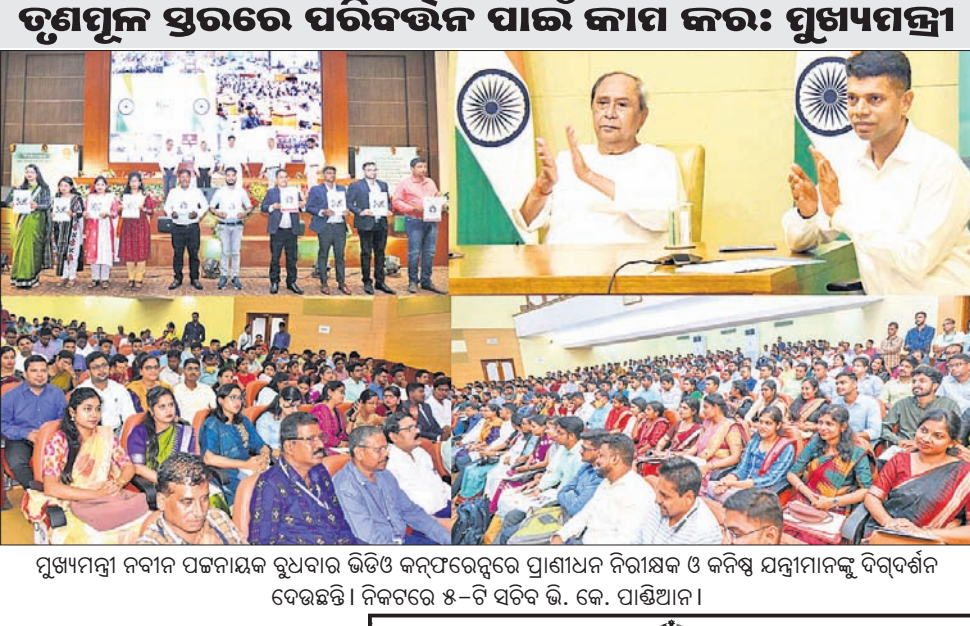
ମୁଖ୍ୟମନ୍ତ୍ରୀ ନବୀନ ପଟ୍ଟନାୟକ ରୁଧିଆଣାରେ କନଫରେନ୍ସରେ ପ୍ରାଣୀଧନ ନିରୀକ୍ଷକ ଓ କନିଷ୍ଠ ଯନ୍ତ୍ରୀମାନଙ୍କୁ ଦିବସଗତ ଦେଖିଛନ୍ତି। ନିକଟରେ ୫-ଟି ସଚିବ ଭି.କେ. ପାଣିଆନ।

ନବନିଯୁକ୍ତ ପ୍ରାଣୀ ଚିକିତ୍ସକ, ପ୍ରାଣୀଧନ ନିରୀକ୍ଷକ, କନିଷ୍ଠ ମହ୍ୟ ବିଶେଷଜ୍ଞ ସହାୟକ ଓ କନିଷ୍ଠ ଯନ୍ତ୍ରୀଙ୍କ ପାଇଁ ଆୟୋଜିତ ଦିବସଗତ କାର୍ଯ୍ୟକ୍ରମ ରୁଧିଆଣା ଅନୁଷ୍ଠିତ ହୋଇଯାଇଛି। ମୁଖ୍ୟମନ୍ତ୍ରୀ ନବୀନ ପଟ୍ଟନାୟକ ଭିଡ଼ି କନଫରେନ୍ସରେ ମୁଖ୍ୟ ଅତିଥି ଭାବେ ଯୋଗଦେଇ ମହ୍ୟ ଓ ପ୍ରାଣୀ ସମ୍ପଦ କ୍ଷେତ୍ରକୁ ଦୃଶ୍ୟମୂଳକ ସ୍ତରରେ ଅଭିବୃଦ୍ଧି ଏକ ଲକ୍ଷ୍ୟ ରଖି ବୋଲି ମତ ଦେଇଛନ୍ତି। ଦୃଶ୍ୟମୂଳକ ସ୍ତରରେ ପରିବର୍ତ୍ତନ ପାଇଁ କାର୍ଯ୍ୟ କର। ଏହି କାର୍ଯ୍ୟକ୍ରମ ଏକାଧାରରେ ଭୁବନେଶ୍ଵର ଲୋକସେବା ଭବନ ସମ୍ମିଳନୀ କକ୍ଷ ଏବଂ ଜୟଦେବ ଭବନ ଠାରେ ଆୟୋଜିତ ହୋଇଯାଇଛି। ସବୁ ଜିଲ୍ଲାର ବିଭାଗୀୟ ଅଧିକାରୀମାନେ ଭିଡ଼ି କନଫରେନ୍ସରେ ଏହି କାର୍ଯ୍ୟକ୍ରମରେ ଯୋଗଦେଇଥିଲେ। ରାଜ୍ୟ ସରକାରଙ୍କ ଦ୍ଵାରା ନେତୃତ୍ଵ ୧୪୭ ପ୍ରାଣୀ ଚିକିତ୍ସକ, ୫୮୮ ପ୍ରାଣୀଧନ ନିରୀକ୍ଷକ, ୬୭ କନିଷ୍ଠ ମହ୍ୟ ବିଶେଷଜ୍ଞ ସହାୟକ ଓ ୩୩ କନିଷ୍ଠ ଯନ୍ତ୍ରୀ ନୂତନ ଭାବରେ ନିଯୁକ୍ତ ହୋଇଛନ୍ତି। ନବନିଯୁକ୍ତ ଅଧିକାରୀ ଓ କର୍ମଚାରୀଙ୍କ ସହିତ ମତ ବିନିମୟ କରି ମୁଖ୍ୟମନ୍ତ୍ରୀଙ୍କ ସଚିବ (୫-ଟି) ଭି.କେ. ପାଣିଆନ