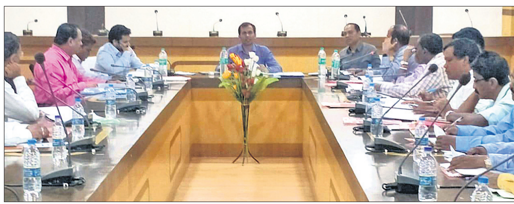
ବୈଠକରେ ତିଆରିତ ପିଡି, ବିଭିନ୍ନ ବ୍ୟାଙ୍କର ପରିଚାଳକ ଓ ଅନ୍ୟମାନେ।