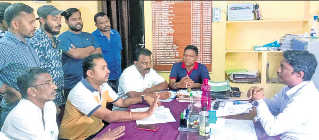
କଂଗ୍ରେସ ଓ ଭାଜପା କର୍ମୀ ପୌର ନିର୍ବାହୀ ଅଧିକାରୀଙ୍କ ସହ ଆଲୋଚନା କରୁଛନ୍ତି।