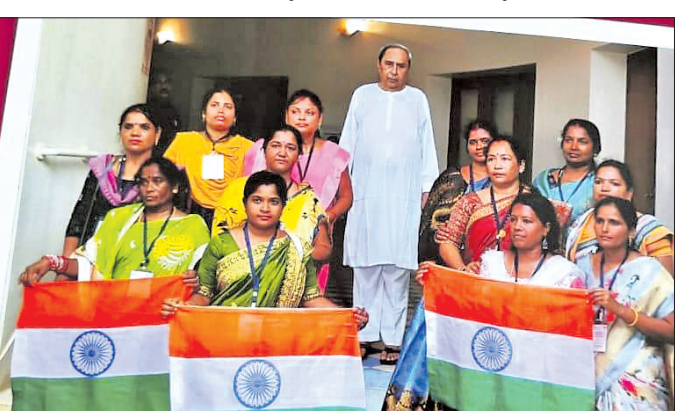
ମୁଖ୍ୟମନ୍ତ୍ରୀଙ୍କ ସହ ମାଲକାନଗିରି ଜିଲ୍ଲାର ଏସ୍‌ଏସ୍‌ଇ ମହିଳାମାନେ।