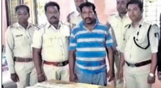
ଗିରଫ ଅଭିଯୁକ୍ତ ଅବକାରୀ କର୍ମଚାରୀ ହାଜର କରିଛନ୍ତି ।

ବରଗଡ଼ ଅଫିସ୍, ୨୧।୯ ବରଗଡ଼ ଜିଲ୍ଲାରେ ନିଶା କାରବାର ବଢ଼ିବାରେ ଲାଗିଛି । ବରଗଡ଼ ଦେଇ ପଡ଼ୋଶୀ ଛତିଶଗଡ଼ ପକ୍ଷକୁ ରଞ୍ଜେଇ ଚାଲାଇ ନିବିନ୍ଦିଆ ଘଟଣା ହୋଇଗଲାଣି । ତେବେ ଜିଲ୍ଲାରେ ବ୍ରାଉନ ସୁଗାର ଭଳି ନିଶାପ୍ରବ୍ୟ କାରବାର ବ୍ୟାପିବାକୁ ଆରମ୍ଭ କଲାଣି । ରୁଧିରା