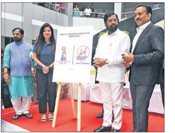
ଲୋଗୋ ଉନ୍ମୋଚନ ଅବସରରେ ମୁଖ୍ୟମନ୍ତ୍ରୀ ନବୀନ ପଟ୍ଟନାୟକ ଏବଂ ଅନ୍ୟମାନେ ।

ପୁଣେ, ୨୧।୯ ୧୬ ବର୍ଷରୁ କମ୍ ମହିଳା ଫିଫା ବିଶ୍ୱକପ ପାଇଁ କୁସାବାର ମହାରାଷ୍ଟ୍ର ଆୟୋଜକ ସହର ଭେନ୍ୟୁ ଲୋଗୋ ଉନ୍ମୋଚନ କରିଛନ୍ତି ମୁଖ୍ୟମନ୍ତ୍ରୀ ନବୀନ ପଟ୍ଟନାୟକ ଏବଂ ଏହି ଅବସରରେ ଅନ୍ୟମାନଙ୍କ ମଧ୍ୟରେ ମହାରାଷ୍ଟ୍ର କ୍ରୀଡ଼ା ଓ