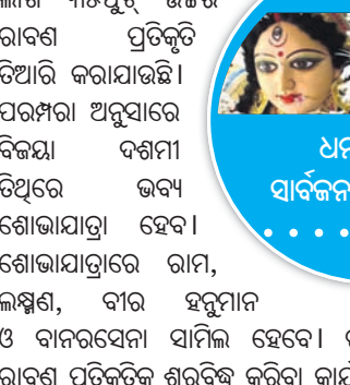
ଧନକଉଡ଼ା ଚୂର୍ଣ୍ଣାପୂଜା ଲାଗି ମୂର୍ତ୍ତି ତିଆରି କରାଯାଇଛି।