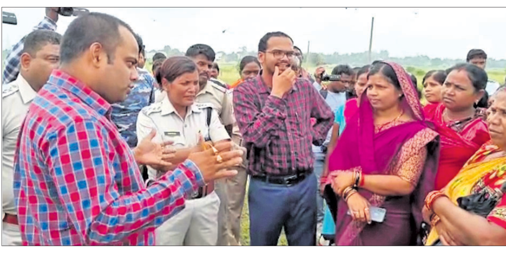
ଗ୍ରାମବାସୀଙ୍କ ସହ ଆଲୋଚନା କରୁଛନ୍ତି ଉପକରଣାଧିକାରୀ।

ଝାରସୁଗୁଡ଼ା ସରକାରୀ ଉଚ୍ଚମାଧ୍ୟମିକ ବିଦ୍ୟାଳୟରେ ଉପସ୍ଥାପନ କରାଯାଇଥିବା ଉପକରଣ ଓ ଉପକରଣ ଉପରେ ଗୁରୁତର ଦିବିଙ୍କୁ ଗିରଫ କରାଯାଇଛି।