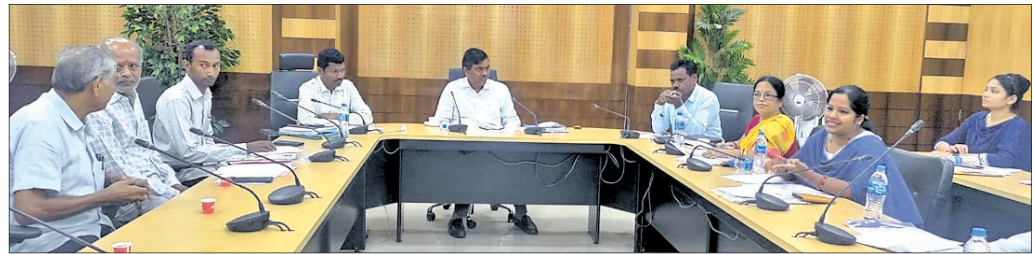
କାର୍ଯ୍ୟକ୍ରମରେ ଯୋଗଦେଇଥିବା ଅଧିକାରୀ ଓ ବିଭିନ୍ନ ଅନୁଷ୍ଠାନର କର୍ମଚାରୀ।