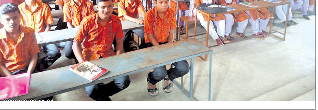
କାର୍ଯ୍ୟକ୍ରମରେ ଯୋଗଦେଇଥିବା ଛାତ୍ରଛାତ୍ରୀ।