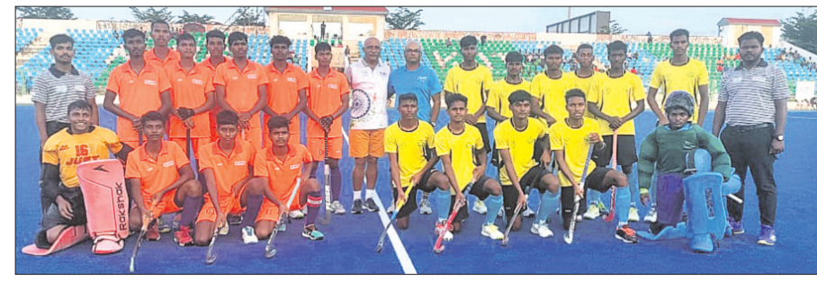
ସେନିଫାଇନାଲ ପୂର୍ବରୁ ଅର୍ପିଆଇଙ୍କ ସହ ଦେବଗଡ଼ ଓ କିଟ୍ ବନର ଖେଳାଳି।