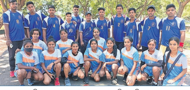
ଜାତୀୟ କ୍ରୀଡ଼ାରେ ଷ୍ଟ୍ରୋ ବଲ୍ରେ ଭାଗ ନେଇଥିବା ଓଡ଼ିଶା ବାଲିକା ଓ ବାଳକ ଦଳ।

ସମାନ ସଂଖ୍ୟକ ମ୍ୟାଚ ଖେଳିଥିବା ହରଭଜନ ସିଂଙ୍କ ମଣିପାଲ ଟାଇଗର୍ସ୍ ଏଯାଏଁ ଗୋଟିଏ ବି ବିଜୟ ହାସଲ କରିପାରିନାହିଁ। ଇଣ୍ଡିଆ କ୍ୟାପିଟାଲ୍ସ୍ ପ୍ରଥମ ବିଜୟ ଲିଜେଣ୍ଡ୍ ଲିଗ୍ କ୍ରିକେଟ୍ ଟି୨୦ ଟୁର୍ନାମେଣ୍ଟରେ ରୁଧିର ପ୍ରଥମ ବିଜୟ ହାସଲ କରିଛି ଗୋଟିଏ ଗମ୍ଭୀରକ ଇଣ୍ଡିଆ କ୍ୟାପିଟାଲ୍ସ୍। ଇରଫାନ ପଠାନଙ୍କ ନେତୃତ୍ୱାଧୀନ ଭିଲ୍ଡ଼ିରା କିଙ୍ଗ୍ସ୍ ୬୮ ରନରେ ପରାସ୍ତ କରି ଦଳ ପଏଣ୍ଟ୍ ଟେବଲ୍ରେ ତୃତୀୟ ସ୍ଥାନକୁ ଉନ୍ନତ ହୋଇଛି।