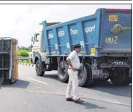
ଭଞ୍ଜାରିପୋଖରୀ ଛତାବର ନିକଟରେ ଛେଳି ବୋହେଇ ଟ୍ରକ୍ ଓଲଟି ପଡ଼ିଛି।