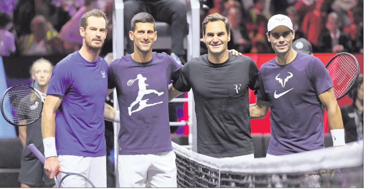
ଲଣ୍ଡନରେ ଖେଳାଯିବାକୁଥିବା ଲାଭର କପ୍ ଟେନିସ ଟୁର୍ନାମେଣ୍ଟ ପୂର୍ବରୁ ଏକ ଟ୍ରେନିଂ ସେସନ ଅବସରରେ (ବାମରୁ) ତ୍ରିଟେନର ଆଣ୍ଡି ମୁରେ, ସର୍ବିୟାର ନୋଭାକ ଜୋକୋଭିଚ୍, ସୁଇଜରଲ୍ୟାଣ୍ଡର ରୋଜର ଫେଡରର ଓ ସ୍ପେନର ରାଫାଲ ନାଡାଲ।