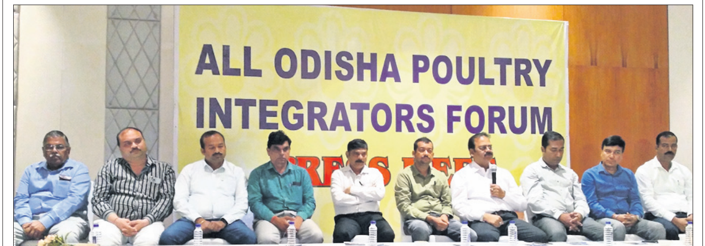
ଭୁବନେଶ୍ୱରର ପାହାଚଠାରେ ଗୁରୁବାର ଅଲ୍ ଓଡ଼ିଶା ପୋଲ୍ଟ୍ରି ଇଣ୍ଟିଗ୍ରେଟର୍ସ ଫୋରମ ପକ୍ଷରୁ ଆୟୋଜିତ ଖବରଦାତା ସମ୍ମିଳନୀରେ ଓଡ଼ିଶାର କୁକୁଡ଼ା ଚାଷୀଙ୍କ ପ୍ରତି ହେଉଥିବା ଅବିଚାର ବିରୋଧରେ ଫୋରମ ପକ୍ଷରୁ ବିସ୍ତୃତ ସୂଚନା ସହ ସମ୍ପୂର୍ଣ୍ଣ ଘଟଣାର ଆଭିମୁଖ୍ୟ ସମ୍ପର୍କରେ ମତ ଉପସ୍ଥାପନ କରାଯାଇଥିଲା । ଏହି ଅବସରରେ ଫୋରମର ବରିଷ୍ଠ ସଭ୍ୟଙ୍କ ସମେତ କମ୍ପାନୀ କର୍ତ୍ତୃପକ୍ଷ ଏବଂ ଚାଷୀମାନେ ଉପସ୍ଥିତ ଅଛନ୍ତି ।

ଦେଶର ପରିବହନ (ଆମଦାନୀ ଓ ରପ୍ତାନି) କ୍ଷେତ୍ରରେ ଦୈନିକ ପରିବର୍ତ୍ତନ ଆଣିବା ଉଦ୍ଦେଶ୍ୟରେ କେନ୍ଦ୍ର ସରକାର ତଳିତ ବର୍ଷ ସେପ୍ଟେମ୍ବର ୧୭ ତାରିଖରେ ଜାତୀୟ ଲକ୍ଷିଷ୍ଟ ନୀତି ସମ୍ପର୍କରେ ଘୋଷଣା କରିଥିଲେ । ଏପରିକି ପ୍ରଧାନମନ୍ତ୍ରୀ ନରେନ୍ଦ୍ର ମୋଦି ଉଦ୍ଘୋଷନ କରିଥିବା ଜାତୀୟ ଲକ୍ଷିଷ୍ଟ ନୀତିକୁ ନିକଟରେ କେନ୍ଦ୍ର କ୍ୟାବିନେଟ୍ କମିଟି ମଞ୍ଜୁରୀ ପ୍ରଦାନ କରିଛି । ବର୍ତ୍ତମାନ ପୁଞ୍ଜା ଦେଶର ୧୪ଟି ରାଜ୍ୟ ନିଜସ୍ୱ ଲକ୍ଷିଷ୍ଟ ନୀତି ପ୍ରସ୍ତୁତ କରିସାରିଥିଲେବେଳେ ଅନ୍ୟ ୧୩ଟି ରାଜ୍ୟର ନୀତି ଚୁଡ଼ାନ୍ତ ପର୍ଯ୍ୟନ୍ତ ରହିଛି ବୋଲି ସୂଚନା ମିଳିଛି ।