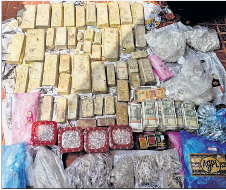
ଜବତ ଇଟା ରୁପା, ଅଳଙ୍କାର ଏବଂ ଟଙ୍କା ।

ଗଞ୍ଜେଇ ଧରିବାକୁ ଯାଇ ଧରିଲେ ୧ କୁଇଣ୍ଟାଲ ରୁପା ଇଟା । ତା ଯାଜକୁ ୧୧.୯୦ ଲକ୍ଷ ଟଙ୍କା ମଧ୍ୟ ଜବତ ହୋଇଛି । ଏକ କାର୍ ସିକ୍ରେଟ ଚାନ୍ଦରକୁ ବିଦ୍ରୁପ ପରିମାଣର ରୁପା ଇଟା ଧରିବା ପରେ ଅବକାରୀ ବିଭାଗ ମାମଲାକୁ ଜିଏସ୍ଟି ବିଭାଗକୁ ହସ୍ତାନ୍ତର କରିଛି । ଗୁରୁବାର ସକାଳ ପ୍ରାୟ ୯ଟାରେ କଟକ-ଚାନ୍ଦୀ ଟୋଲ ଗେଟ ନିକଟରୁ ଏକ ପରିମାଣର ରୁପା ଇଟା ଜବତ ହୋଇଥିବାକୁ ଚିକିତ୍ସା ଫାଇଁ ସନ୍ଦେହ କରାଯାଇ ତଦନ୍ତ ଚାଲୁରହିଥିବା ଜଣାଯାଇଛି ।