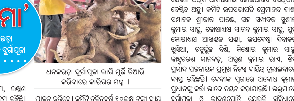
ଧନକଉଡ଼ା ଚୂର୍ଣ୍ଣାପୂଜା ଲାଗି ମୂର୍ତ୍ତି ତିଆରି କରାଯାଇଛି।