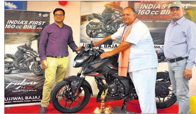
ଶୋରୁମଠାରେ ପୁଷ୍ପାଅତିଥି ନୂତନ ପଲ୍‌ସର୍ ବାଇକ୍‌ର ପ୍ରବେଶ କରୁଛନ୍ତି।

ବଜାର କମ୍ପାନୀର ନୂତନ ବାଇକ୍ ପଲ୍‌ସର୍ ଏନ୍-୧୬୦ ରୁଆଲ ବ୍ୟାନେଲ୍ ଏବିଏସ୍ ଗୁରୁବାର ସମ୍ବଲପୁର ବଜାର ପ୍ରବେଶ କରିଛି।