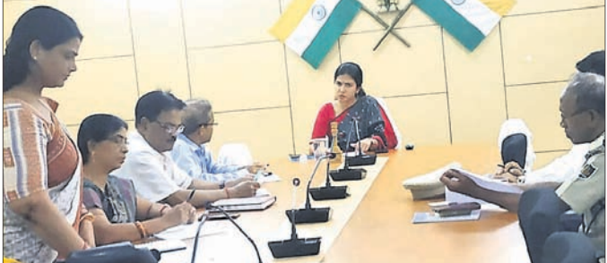
ଜିଲ୍ଲାପାଳଙ୍କ ଅଧ୍ୟକ୍ଷତାରେ ଅନୁଷ୍ଠିତ ବୈଦିକ।

ସମ୍ବଲପୁର ଜିଲ୍ଲାପାଳଙ୍କ ସମ୍ମିଳନୀ କକ୍ଷରେ ଗୁରୁତର ଲିଙ୍ଗ ନିଷିଦ୍ଧ ଆଇନ ୧୯୯୪ ଅନ୍ତର୍ଗତ ଜିଲ୍ଲା ପରାମର୍ଶଦାତା ଓ ଟାକ୍ସିଫୋର୍ସ ବୈଦିକ ଅନୁଷ୍ଠିତ ହୋଇଥିଲା।