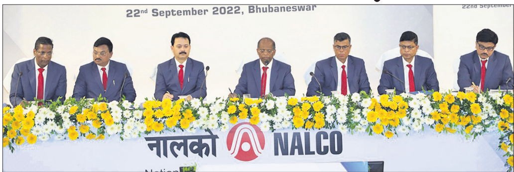
ନାଲକୋର ୪୧ତମ ବାର୍ଷିକ ସାଧାରଣ ବୈଠକ ଅବସରରେ ଉପସ୍ଥିତ ଦରିଶ୍ଚ ଅଧିକାରୀ ଓ ଅନ୍ୟମାନେ ।

କରିଛନ୍ତି । ଫଳରେ ଏହାର ଲକ୍ଷିତ ଶେୟାର ପିଛା ୧.୫୦ଟଙ୍କା ହିସାବରେ ଚୁଡ଼ାନ୍ତ ଲାଭାଂଶ ୩୦% ମଧ୍ୟ ପରିଷଦ ଅନୁମୋଦନ କରିଥିଲା । ଏଠାରେ ଘୋଷିତ ଓ ପୈଠକ ହୋଇଥିବା ଅନ୍ତରାଳ ଲାଭାଂଶ ଏବଂ ଏକିଏମ୍‌ଏମ୍ ଅନୁମୋଦିତ ଚୁଡ଼ାନ୍ତ ଲାଭାଂଶ ସହ ମୋଟ ଲକ୍ଷିତ ଶେୟାର କ୍ୟାପିଟାଲର ୧୩୦% ଯାହା ଅଦ୍ୟାବଧି ସର୍ବାଧିକ ରହିଛି । ୨୦୨୧-୨୨ ଆର୍ଥିକ ବର୍ଷରେ ନାଲକୋ ପ୍ରଥମ ଥର ପାଇଁ ନିଜର ସ୍ନେଲ୍‌ସ୍ ଟ୍ରେଜରୀ ୧୨୦ଟି ପଦ୍ମ କାର୍ଯ୍ୟକ୍ରମ କରି ୧୦୦% କ୍ଷମତାର ଉପଯୋଗରେ ସର୍ବୋଚ୍ଚ ୪,୨୦,୦୦୦ ଟଙ୍କା ଆଲୁମିନିୟମ ଉତ୍ପାଦନ କରିଛି । ସେହିପରି କମ୍ପାନୀର