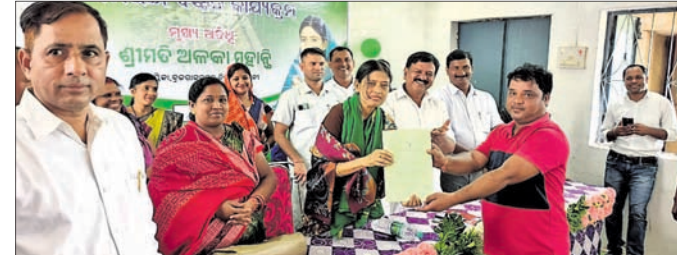
ବିଧାୟକ ଅଳକା ମହାନ୍ତି ଘରଡ଼ିହ ପକ୍ଷ ବାଣ୍ଟୁଛନ୍ତି।

ଦୀର୍ଘ ୬୬ବର୍ଷ ପରେ ହୀରାକୁଦ ନଦୀବନ୍ଧ ଦ୍ୱାରା ବିସ୍ଥାପିତ ଲକ୍ଷ୍ମଣପୁର ତହସିଲର ୧୪୯ ପରିବାରକୁ ରାଜ୍ୟ ସରକାର ୧୦ତହସିଲ ଲେଖାଏଁ ଘରଡ଼ିହ ପକ୍ଷ ଯୋଗାଇ ଦେଇଛନ୍ତି।