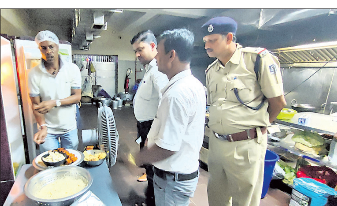
ସହରର ଏକ ବ୍ୟବସାୟିକ ପ୍ରତିଷ୍ଠାନରେ ଯାଞ୍ଚ ହେଉଛି।

ଅନୁଗୋଳ ଅଧିକ, ୨୨।୯ ଅନୁଗୋଳ ଉପଖଣ୍ଡ ବହୁମୁଖୀ ଶୁଖିଲା ଚିମ୍ବର ଗତି ସ୍ୱାଦ୍ ଗୁରୁବାର ସହରର ବିଭିନ୍ନ ବ୍ୟବସାୟିକ ପ୍ରତିଷ୍ଠାନରେ ଯାଞ୍ଚ କରିଛି।