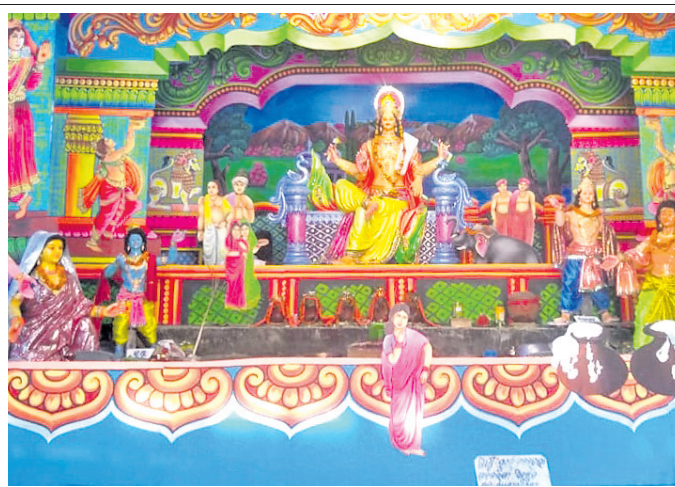
ନାଲକୋ ଠିକାଦାର ସଂଘ।