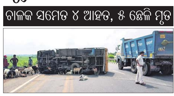
ଭଣ୍ଡାରିପୋଖରୀ ଛତାବର ନିକଟରେ ଛେଳି ବୋହେଇ ଟ୍ରକ୍ ଓଲଟି ପଡ଼ିଛି।

ଭଦ୍ରକ ଅଫିସ/ଭଣ୍ଡାରିପୋଖରୀ (ସ୍ୱ.ପ୍ର.), ୨୨।୯ ୧୬ ନଂ. ଗାଡ଼ିର ରାଜପଥର ଭଦ୍ରକ ଜିଲ୍ଲା ଭଣ୍ଡାରିପୋଖରୀ ଥାନା ଅଧୀନ ଛତାବର ନିକଟରେ ଗୁରୁବାର ମଧ୍ୟାହ୍ନରେ ଏକ ଛେଳି ବୋହେଇ ଟ୍ରକ୍ ଦୁର୍ଘଟଣାଗ୍ରସ୍ତ ହୋଇଛି। ଯାନିନିକ୍ଷାସ୍ଥିତ ଆସାମ ଅଧିକାରୀଙ୍କ ପକ୍ଷରୁ ଟ୍ରକ୍ ଓଲଟି ପଡ଼ିଥିଲା। ଏହି ଦୁର୍ଘଟଣାରେ ଛେଳି ବୋହେଇ ଟ୍ରକ୍ ଆହତ ହୋଇଥିଲା। ସେମାନଙ୍କ ମଧ୍ୟରୁ ୨ ଗୁରୁତରଙ୍କୁ ଭଦ୍ରକ ଜିଲ୍ଲା ମୁଖ୍ୟ ଚିକିତ୍ସାଳୟ ଓ ପରେ କଟକ ବଡ଼ ଡାକ୍ତରଖାନାକୁ ସ୍ଥାନାନ୍ତର କରାଯାଇଛି। ସେମାନେ ହେଲେ ଗାଡ଼ି ଚାଳକ ଖଡ଼ଗପୁର ସିଦ୍ଧି ଅକ୍ଷୟ ଶେଖ୍ ରାଠୁ(୧୮) ଓ ଶେଖ୍ ଶବ୍ଦନ(୧୮)। ଦୁର୍ଘଟଣାରେ ୫ ଛେଳି ମରିଯାଇଥିବା ଜଣାଯାଇଛି। ତେବେ ସମସ୍ତ ଗାଡ଼ି କର୍ମଚାରୀ ଆହତ ହୋଇ ମୋଡେମ୍ ଯାତ୍ରୀଙ୍କୁ ବେଳେ ଗାଡ଼ିର ସୁଯୋଗ ନେଇ କେତେକେ ୨୦ରୁ ଊର୍ଦ୍ଧ୍ୱ ଛେଳି ଲୁଚି ନେଇଛନ୍ତି। ସୂଚନା ଅନୁଯାୟୀ, ବାଲେଶ୍ୱରର ବିଭିନ୍ନ ସ୍ଥାନରୁ ୨୫ହଜୁ ଊର୍ଦ୍ଧ୍ୱ ଛେଳି ସଂଗ୍ରହ କରାଯାଇ ଟ୍ରକ୍ (ନଂ. ଡି.ଏ. ୯୫୩)ରେ ଭୁବନେଶ୍ୱରକୁ ନିଆଯାଇଥିଲା। ଉକ୍ତ ଯୋଗେଇ ପକ୍ଷ ନିକଟରେ ଚକ ପକ୍ଷର ଯୋଗୁ ଭାରସାମ୍ୟ ହରାଇ ଗାଡ଼ିଟି ଗାଡ଼ିରେ ଓଲଟି ପଡ଼ିଥିଲା। ପୋଲିସ୍ ଓ ସ୍ଥାନୀୟ ଲୋକଙ୍କ ସହାୟତାରେ ଆହତମାନଙ୍କୁ ଉଦ୍ଧାର କରାଯାଇ ପୁଷ୍ପା-୪