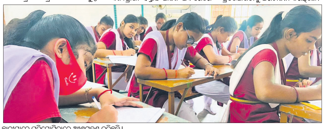
ଛାତ୍ରମାନେ ପ୍ରତିଯୋଗିତାରେ ଅଂଶଗ୍ରହଣ କରିଛନ୍ତି।

ଅନୁଗୋଳ ଅଧିକ, ୨୨।୯ ଆସକ୍ତା ୬୮ତମ ବନ୍ୟପ୍ରାଣୀ ସଂରକ୍ଷଣ ପାଳନ ପୂର୍ବରୁ ଅନୁଗୋଳର ସାମାଜିକ ଅନୁଷ୍ଠାନ ସାଥୀ ପରିବାର ପକ୍ଷରୁ ଗୁରୁବାର ବନ୍ଦଳା ବାଳିକା ଉଚ୍ଚ ବିଦ୍ୟାଳୟରେ ପ୍ରବନ୍ଧ ଏବଂ ଚିତ୍ରାଙ୍କନ ପ୍ରତିଯୋଗିତା ଅନୁଷ୍ଠିତ ହୋଇଯାଇଛି।