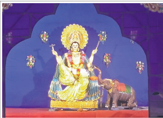
ନାଲକୋଣ୍ଡିତ ଗ୍ରାମ୍ ଆନନ୍ଦ ପୁଣ୍ଡର ବିଶ୍ୱକର୍ମା ମେଳ।

ମାଧପୁର, ୨୨।୯: ଆଠମଲିକ ନିର୍ବାଚନ ମଣ୍ଡଳୀ ଅନ୍ତର୍ଗତ ମାଧପୁର ନିକଟ ମାନସୋର ସେବ ପ୍ରକଳ୍ପ ବଙ୍ଗଳାଠାରେ ଗୁରୁବାର ଭାଜପା ମାଧପୁର ମଣ୍ଡଳ ପକ୍ଷରୁ ଏକ ସାଙ୍ଗଠନିକ ବୈଠକ ଅନୁଷ୍ଠିତ ହୋଇଯାଇଛି।