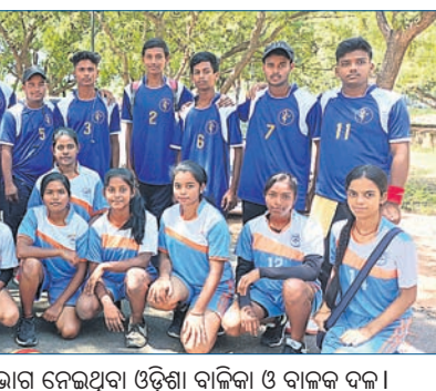
ଜାତୀୟ କୁଟିୟର ଷ୍ଟାଏ ବଲ୍ରେ ଭାଗ ନେଇଥିବା ଓଡ଼ିଶା ବାଳିକା ଓ ବାଳକ ଦଳ।

ଭୁବନେଶ୍ୱର, ୨୨।୯ (ସ୍ପୋର୍ଟ୍ସ ଟ୍ରାଭେଲ୍) ଟିକିରୁଠାରେ ବାଳିକା ଚାମ୍ପିୟା ୩୨ତମ ଜାତୀୟ କୁଟିୟର ଷ୍ଟାଏ ବଲ୍ ଚାମ୍ପିୟନସ୍‌ଟିପ୍ରେ ଓଡ଼ିଶା ବାଳିକା ଓ ବାଳକ ଦଳ ବିଜୟ ସହ ଅଭିଯାନ ଆରମ୍ଭ କରିଛନ୍ତି। ବାଳକ ଦଳ ପୁଲ୍ ସିରେ ଉତ୍ତର ପ୍ରଦେଶରୁ ୨-୧ରେ ହରାଇ ଦେଇଛି। ଏହି ପୁଲରେ ସ୍ଥାନ ପାଇଥିବା ଅନ୍ୟ ଦଳଗୁଡ଼ିକ ହେଲେ ଚାମ୍ପିୟନାଡୁ, ପଶ୍ଚିମବଙ୍ଗ ଓ ପଞ୍ଜାବ। ବାଳିକା ଦଳର ଉପର ଉପର ପ୍ରଦେଶରୁ ଓଡ଼ିଶା ଗୁପ୍ତ ଟିରେ ସ୍ଥାନ ପାଇଛି। ଏଥିରେ ଦଳ ଏହାର ଉପଯୋଗୀ ମ୍ୟାଚରେ ଉତ୍ତର ପ୍ରଦେଶକୁ ହରାଇ ଦେଇଛି। ଗୁପ୍ତ ଟିରେ ସ୍ଥାନ ପାଇଥିବା ଅନ୍ୟ ଦଳଗୁଡ଼ିକ ହେଲେ ଆନ୍ଧ୍ର ପ୍ରଦେଶ, ହରିୟାଣା ଓ ଚାମ୍ପିୟନାଡୁ। ଗୁଜରାଟରେ ହରାଇ ଦେଇଛି। ଏହି ପୁଲରେ ସ୍ଥାନ ପାଇଥିବା ଆସନ୍ତା ୨୫ ତାରିଖରେ ଉଦ୍‌ଯାପିତ ହେବ।