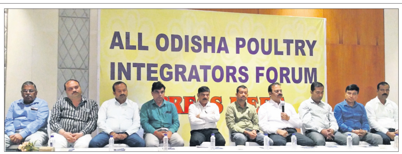
ଭୁବନେଶ୍ୱରର ପାହଳଠାରେ ଗୁରୁବାର ଅଲ୍ ଓଡ଼ିଶା ପୋଲ୍ଟ୍ରି ଇଣ୍ଟିଗ୍ରେଟର୍ସ ଫୋରମ୍ ପକ୍ଷରୁ ଆୟୋଜିତ ଖବରଦାତା ସମ୍ମିଳନୀରେ ଓଡ଼ିଶାର କୁକୁଡ଼ା ଚାଷୀଙ୍କ ପ୍ରତି ହେଉଥିବା ଅବିଚାର ବିରୋଧରେ ଫୋରମ୍ ପକ୍ଷରୁ ବିସ୍ତୃତ ସୂଚନା ସହ ସମ୍ପୂର୍ଣ୍ଣ ଘଟଣାର ଆଭିମୁଖ୍ୟ ସମ୍ପର୍କରେ ମତ ଉପସ୍ଥାପନ କରାଯାଇଥିଲା । ଏହି ଅବସରରେ ଫୋରମ୍‌ର ବରିଷ୍ଠ ସଦସ୍ୟଙ୍କ ସମେତ କମ୍ପାନୀ କର୍ତ୍ତୃପକ୍ଷ ଏବଂ ଚାଷୀମାନେ ଉପସ୍ଥିତ ଅଛନ୍ତି ।

ଦେଶର ପରିବହନ (ଆମଦାନୀ ଓ ରପ୍ତାନି) କ୍ଷେତ୍ରରେ ଦୈନିକ ପରିବର୍ତ୍ତନ ଆଣିବା ଉଦ୍ଦେଶ୍ୟରେ କେନ୍ଦ୍ର ସରକାର ତଳିତ ବର୍ଷ ସେପ୍ଟେମ୍ବର ୧୭ ତାରିଖରେ ଜାତୀୟ ଲକ୍ଷିଷ୍ଟ ନୀତି ସମ୍ପର୍କରେ ଘୋଷଣା କରିଥିଲେ । ଏପରିକି ପ୍ରଧାନମନ୍ତ୍ରୀ ନରେନ୍ଦ୍ର ମୋଦି ଉଦ୍ଘୋଷଣା କରିଥିବା ଜାତୀୟ ଲକ୍ଷିଷ୍ଟ ନୀତିକୁ ନିକଟରେ କେନ୍ଦ୍ର କ୍ୟାବିନେଟ୍ କମିଟି ମଞ୍ଜୁରୀ ପ୍ରଦାନ କରିଛି । ବର୍ତ୍ତମାନ ପୁଞ୍ଜା ଦେଶର ୧୪ଟି ରାଜ୍ୟ ନିଜସ୍ୱ ଲକ୍ଷିଷ୍ଟ ନୀତି ପ୍ରସ୍ତୁତ କରିସାରିଥିଲେବେଳେ ଅନ୍ୟ ୧୩ଟି ରାଜ୍ୟର ନୀତି ଚୁଡ଼ାନ୍ତ ପର୍ଯ୍ୟନ୍ତ ରହିଛି ବୋଲି ସୂଚନା ମିଳିଛି ।