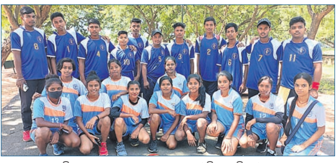
ଜାତୀୟ କ୍ରୀଡ଼ାଳୟ ଡ୍ରୋ ବଲ୍ରେ ଭାଗ ନେଇଥିବା ଓଡ଼ିଶା ବାଲିକା ଓ ବାଳକ ଦଳ।

ସମାନ ସଂଖ୍ୟକ ମ୍ୟାଚ ଖେଳିଥିବା ହରଭଜନ ସିଂଙ୍କ ମଣିପାଲ ଚାଲଗର୍ସ ଏଯାବତ୍ ଗୋଟିଏ ବି ବିଜୟ ହାସଲ କରିପାରିନାହିଁ। ଇଣ୍ଡିଆ କ୍ୟାପିଟାଲ୍ସ ପ୍ରଥମ ବିଜୟ ଲିଜେଣ୍ଡ୍ ଲିଗ୍ କ୍ରିକେଟ ଟି୨୦ ଟୁର୍ନାମେଣ୍ଟରେ ରୁଧିର ପ୍ରଥମ ବିଜୟ ହାସଲ କରିଛି ଗୋଟିଏ ଗମ୍ଭୀରଙ୍କ ଇଣ୍ଡିଆ କ୍ୟାପିଟାଲ୍ସ। ଇରଫାନ ପଠାନଙ୍କ ନେତୃତ୍ଵାଧୀନ ଭିଲଫିରା କିଙ୍ଗ୍ସ୍ ୬୮ ରନରେ ପରାସ୍ତ କରି ଦଳ ପଏଣ୍ଟ୍ ଟେବଲ୍ରେ ତୃତୀୟ ସ୍ଥାନକୁ ଉନ୍ନୀତ ହୋଇଛି।