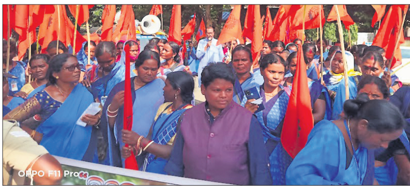
ଆଶାକର୍ମୀମାନେ ବିକ୍ଷୋଭ ପ୍ରଦର୍ଶନ କରୁଛନ୍ତି।