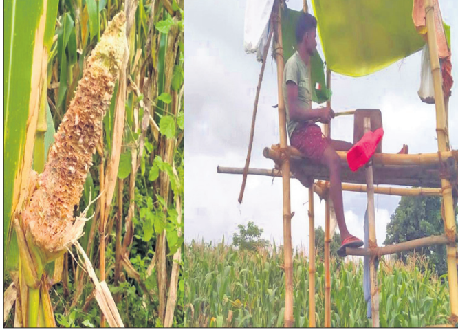
ମଞ୍ଚରେ ବସି ପକ୍ଷୀ ଉଡ଼ାଉଛନ୍ତି ଗଣ୍ଡା

ମକାଗଣକୁ ପ୍ରାଧାନ୍ୟ ଦେଇ ଜାରିକା ନିର୍ବାହ କରୁଥିବା ଗଣ୍ଡାଙ୍କ ପାଇଁ କେନ୍ଦୁଝର ଜିଲ୍ଲା ରଞ୍ଜିତା ଅଞ୍ଚଳରେ ଶୁଆ ପକ୍ଷୀ ଏବେ ବୁଝାବୁଝା କାରଣ ପାଇଁ ଚିନ୍ତିତ। ଶୁଆ ମକା କଷି ଖାଇଯାଉଥିବାରୁ ଅମଳ କମିଯାଉଥିବା ବେଳେ ଅନେକ ମକା ବିକ୍ରି ଉପଯୋଗୀ ହୋଇ ରହିନାହିଁ ବୋଲି ଗଣ୍ଡା କହିଛନ୍ତି। ଶୁଆଙ୍କ ଉପଦ୍ରବରେ ଗଣ୍ଡା ହତାଶ ହୋଇ ପଡ଼ିଥିବା ବେଳେ କେନ୍ଦୁଝର ମଞ୍ଚା ବାଣି ପକ୍ଷୀ ଉଡ଼ାଉଛନ୍ତି।