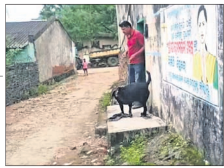
ସନ୍ଧ୍ୟା ନୁହେଁ ସନ୍ଧ୍ୟାରେ ଚଢ଼ି ଚାଲିଛି।