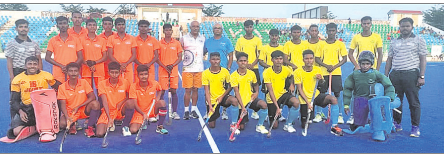
ସେନିଫାଇନାଲ ପୂର୍ବରୁ ଅଫିସିଆଲ ସହ ଦେବଗଡ଼ ଓ କିର୍ ବନର ଖେଳାଳି।