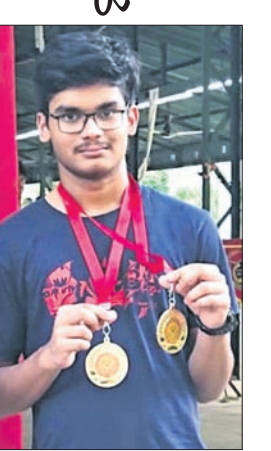
ସର୍ବ ପଦକ ସହ ତ୍ରିଶ ପାଣିଗ୍ରାହୀ।

ଭୁବନେଶ୍ୱର, ୨୨।୯, (ସୋର୍ସ୍ଟୁ ଖୁସିରୋ) ପଶ୍ଚିମବଙ୍ଗର ଆସାନସୋଲରେ ଚାଲିଥିବା ସ୍ୱସ୍ଵ ପୂର୍ବୀକ୍ଷଣ ବହୁକ୍ରମାଳୀ ପ୍ରତିଯୋଗିତାରେ ଓଡ଼ିଶାର ପ୍ରତିଯୋଗୀ ଅଭୁତପୂର୍ବ ସଫଳତା ହାସଲ କରିଛନ୍ତି। ଏହି ପ୍ରତିଯୋଗିତାରେ ଓଡ଼ିଶାର ୫୩ ଜଣ ପ୍ରତିଯୋଗୀ ବିଭିନ୍ନ ବର୍ଗରେ ଭାଗ ନେଇଥିଲେ। ଏହା ମଧ୍ୟରୁ ୧୨ ଜଣ ପୁରୁଷ ଓ ୯ ଜଣ ମହିଳା ଜାତୀୟ ପ୍ରତିଯୋଗିତା ପାଇଁ ଯୋଗ୍ୟତା ଅର୍ଜନ କରିଛନ୍ତି। ପ୍ରତିଯୋଗୀ ମାନଙ୍କ ମଧ୍ୟରୁ ତ୍ରିଶ ପାଣିଗ୍ରାହୀ ଏୟାର ରାଉଫାଲ କୁନିୟର ଓ ସର୍ବ କୁନିୟର ବର୍ଗରେ ବୁକ୍ସି ସର୍ବ ହାସଲ କରିଥିଲେ। ଏୟାର ପିପ୍ପଲ ବର୍ଗରେ ବିଜାପ