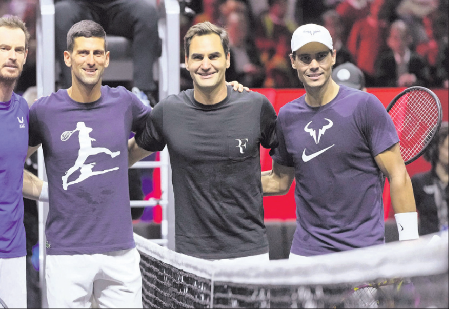
ଇଣ୍ଡନରେ ଖେଳାଯିବାକୁଥିବା ଲାଉର କପ୍ ଟେନିସ ଟୁର୍ନାମେଣ୍ଟ ପୂର୍ବରୁ ଏକ ଟ୍ରେନିଂ ସେସନ ଅବସରରେ (ବାମରୁ) ତ୍ରିଚେନର ଆଣ୍ଡି ମୁରେ, ସର୍ବିୟାର ନୋଭାକ ଜୋକୋଭିଚ୍, ସୁଇଜରଲ୍ୟାଣ୍ଡର ରୋଜର ଫେଡରର ଓ ସ୍ପେନର ରାଫାଲ ନାଡାଲ।