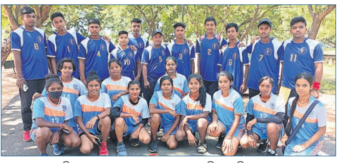
ଜାତୀୟ କୁଚିୟର ଷ୍ଟ୍ରୋ ବଲ୍‌ରେ ଭାଗ ନେଇଥିବା ଓଡ଼ିଶା ବାଳିକା ଓ ବାଳକ ଦଳ।

ସମାନ ସଂଖ୍ୟକ ମ୍ୟାଚ ଖେଳିଥିବା ହରଭଜନ ସିଂଙ୍କ ମଣିପାଲ ଟାଇଗର୍ସ୍ ଏଯାଏଁ ଗୋଟିଏ ବି ବିଜୟ ହାସଲ କରିପାରିନାହିଁ। ଇଣ୍ଡିଆ କ୍ୟାପିଟାଲ୍ସ୍ ପ୍ରଥମ ବିଜୟ ଲିଜେଣ୍ଡ୍ ଲିଗ୍ କ୍ରିକେଟ ଟି୨୦ ଟୁର୍ନାମେଣ୍ଟରେ ରୁଧିରା ପ୍ରଥମ ବିଜୟ ହାସଲ କରିଛି ଗୋଟିଏ ଗମ୍ଭୀରଙ୍କ ଇଣ୍ଡିଆ କ୍ୟାପିଟାଲ୍ସ୍। ଇରଫାନ ପଠାନଙ୍କ ନେତୃତ୍ୱାଧୀନ ଭିଲ୍‌ଫୋରା କିଙ୍ଗ୍ସ୍ ୬୮ ରନରେ ପରାସ୍ତ କରି ଦଳ ପଏଣ୍ଟ୍ ଟେବଲ୍‌ରେ ତୃତୀୟ ସ୍ଥାନକୁ ଉନ୍ନତ ହୋଇଛି।