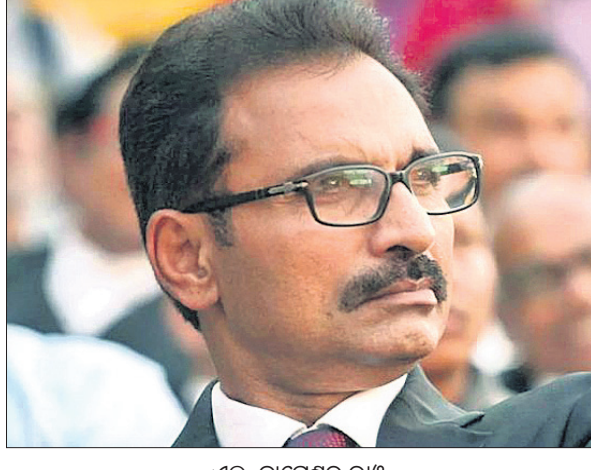
ଏଲ୍. ନାଗେଶ୍ୱର ରାଓ

ନୂଆଦିଲ୍ଲୀ, ୨୨।୯ (ପି.ଟି.) ଭାରତୀୟ ଅଲିମ୍ପିକ ଆସୋସିଏଶନ (ଆଇଓଏ)ର ସମ୍ପାଦକ ସଂଗୋଧନ ଓ ଇଲେକ୍ଟୋରାଲ କଲେଜ ପ୍ରସ୍ତୁତ କରିବା ଲାଗି ସୁପ୍ରିମକୋର୍ଟ ଗୁରୁବାର ସର୍ବୋଚ୍ଚ ନ୍ୟାୟାଳୟର ପୂର୍ବତନ ବିଚାରପତି ଏଲ୍. ନାଗେଶ୍ୱର ରାଓଙ୍କୁ ନିଯୁକ୍ତି ଦେଇଛନ୍ତି। ଜଷ୍ଟିସ୍ ଡି. ଡି. ଲିଙ୍କୋର ଅଧ୍ୟକ୍ଷତାରେ ଗଠିତ ଖଣ୍ଡପୀଠ ଜଷ୍ଟିସ୍ ରାଓଙ୍କୁ