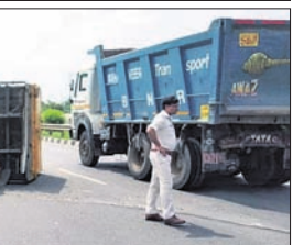
ଭଦ୍ରାପୋଖରୀ ଛତାବର ନିକଟରେ ଛେଳି ବୋହେଇ ଟ୍ରକ୍ ଓଲଟି ପଡ଼ିଛି।