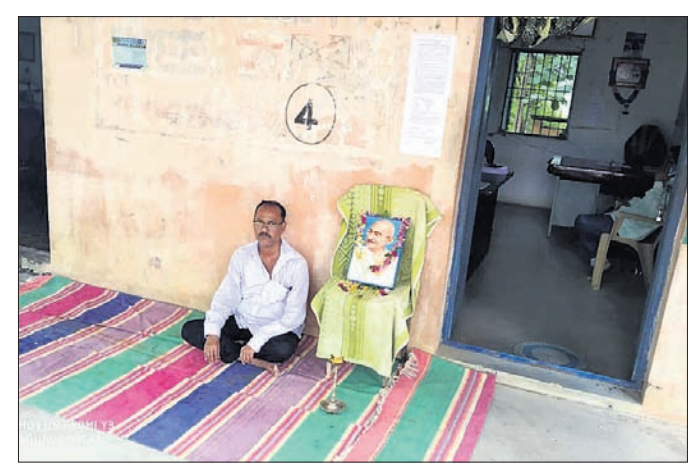
ପ୍ରଧାନ ଶିକ୍ଷକ ଧାରଣାରେ ବସିଛନ୍ତି। ପଦପୁର, ୨୨୯(ଡି.ଏନ୍.ଏ.)

ଏଥିରେ ବାକିଥିବା ଓଭର ଟାଇମ୍, ଟିଏ, ମାଲକୋକ ପେନେଣ୍ଟ ଡୁରନ୍ତ ପ୍ରଦାନ ନିମନ୍ତେ ଦାବି ହୋଇଛି। ସେହିପରି ପାଟ୍ରୋଲିଂ ଡିଭିଜନ୍ ସମ୍ପର୍କରେ ପ୍ରତ୍ୟେକ ପଦବୀ ପୂରଣ ସମୟରେ ୨୦% ଶ୍ରମିକଙ୍କ ପାଇଁ ଡିଭିଜନ୍, ଦୁଇ ବର୍ଷରେ ଏମିତିକେ ଲାଗୁ ଏବଂ ସିଭିଲ ଇଞ୍ଜିନିୟରଙ୍କୁ ମାନସିକ ଯତ୍ନସାମୁଦ୍ର ଦାବି କରାଯାଇଥିବା ଦାବି ଶ୍ରମିକ ସଂଘ ସମ୍ପାଦକ ଜଣାଇଛନ୍ତି।