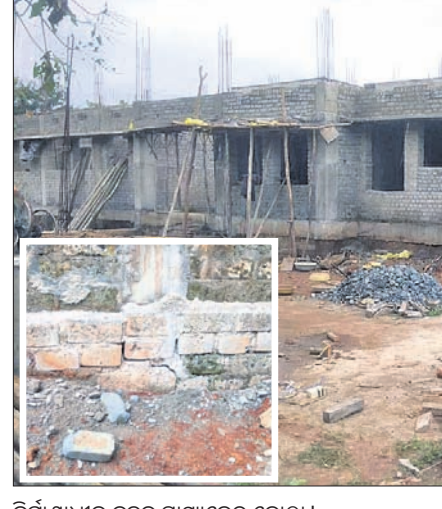
ନିର୍ମାଣଧୀନ ନୂତନ ସ୍ୱାସ୍ଥ୍ୟକେନ୍ଦ୍ର କୋଠା।

ପଥର ବଦଳରେ ସିମେଣ୍ଟ ଇଟାରେ ହୋଇଛି ଫାଉଣ୍ଡେସନ୍