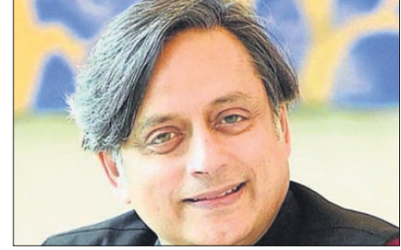
ଜୁଆଦିଲ୍ଲା, ୨୪।୯ (ପି.ଟି.)

କଂଗ୍ରେସ ଅଧକ୍ଷ ନିର୍ବାଚନ ଲାଗି ନାମାଙ୍କନ ଫର୍ମ ନେଲେ ଥରୁର