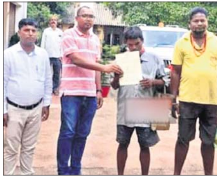
କୋରେଇ, ୨୪ (ସ.ପ୍ର.)