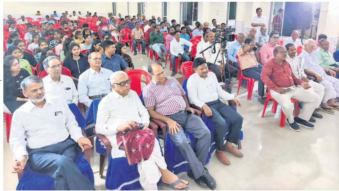
ଆଲୋଚନାଚକ୍ରରେ ଉପସ୍ଥିତ ମାନ୍ୟଗଣ୍ୟ ବ୍ୟକ୍ତି, କଲେଜ ଛାତ୍ରାଛାତ୍ରୀ, ବୁଦ୍ଧିଜୀବୀ।