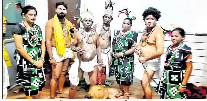
ନୂଆଁଖାଇ ଭେଟ୍‌ଘାଟ୍‌ରେ ଅଂଶଗ୍ରହଣ କରିଥିବା କଳାକାର।