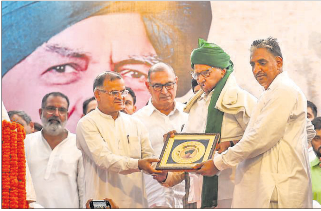
ଆଇଏନଏଲ୍‌ଟି ପକ୍ଷରୁ ଆୟୋଜିତ ରାଲିରେ ଏନ୍‌ସିପି ଅଧ୍ୟକ୍ଷ ଶରଦ ପାଞ୍ଚାରିଙ୍କୁ ସମର୍ଥନ କରାଯାଉଛି।