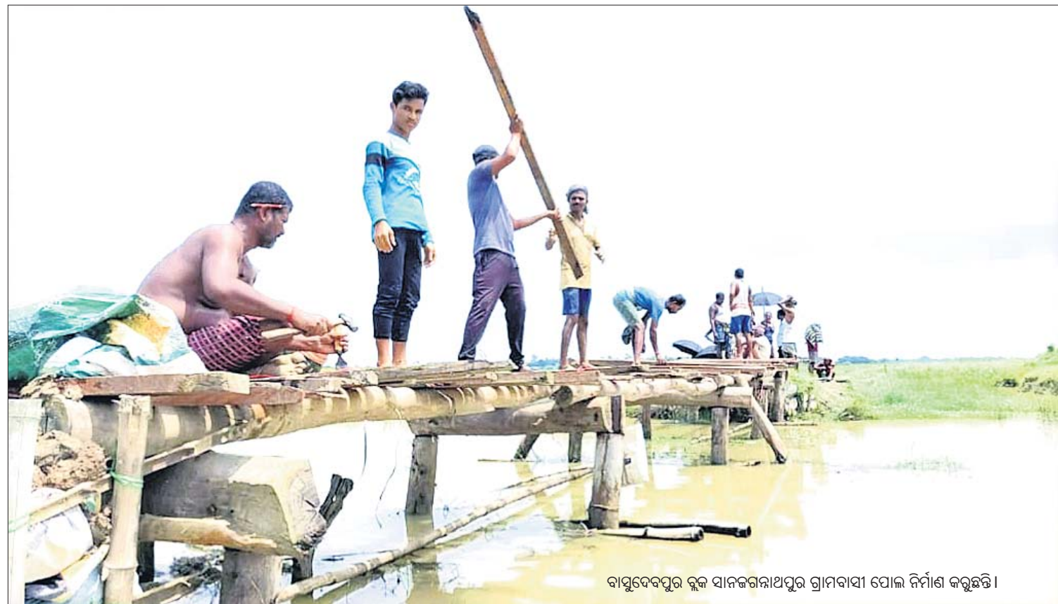
ବାସୁଦେବପୁର ବୁକ ସାମାଜିକଗଣାପପୁର ଗ୍ରାମବାସୀ ପୋଲ ନିର୍ମାଣ କରୁଛନ୍ତି।