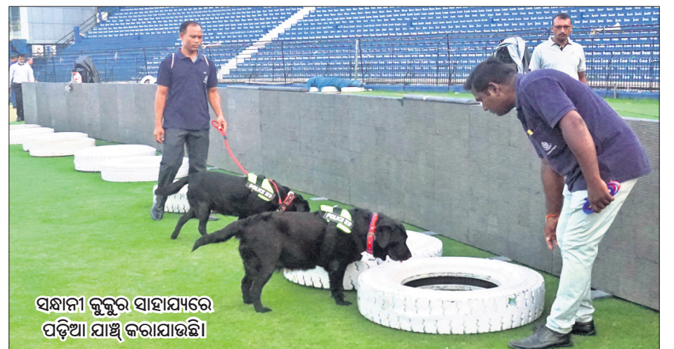
ସଜ୍ଞାନୀ କୁକୁର ସାହାଯ୍ୟରେ ପଢ଼ିଆ ଯାଞ୍ଚ କରାଯାଉଛି ।

ଭୁବନେଶ୍ୱର, ୨୫।୯ (ଗ୍ରାମ୍ୟ ପ୍ରତିନିଧି) ଅନେକ ଜାତୀୟ ଅନ୍ତର୍ଜାତୀୟ କ୍ରିକେଟର ମୂଲ୍ୟାନ୍ତର ପାଇଁ ହେବାକୁ ଯାଉଛି ଲିଜେଣ୍ଡ୍ ଲିଗ୍ କ୍ରିକେଟ୍ । ସୋମବାର ଏହି ଗ୍ରାଉଣ୍ଡରେ ଲିଜେଣ୍ଡ୍ ଲିଗ୍ ଓ ମଣିପାଲ ଚାଉଁଚାର୍ସ ମଧ୍ୟରେ ମ୍ୟାଚ୍ ଆରମ୍ଭ ହେବ । ଏହା ବ୍ୟତୀତ ୨୭ରେ ଗୁଜରାଟ ଜାୟଣ୍ଟ୍-କିଙ୍ଗ୍ ଏବଂ ୨୯ରେ ଇଣ୍ଡିଆ କ୍ୟାପିଟାଲ୍-ମଣିପାଲ ଚାଉଁଚାର୍ସ ମ୍ୟାଚ୍ ମଧ୍ୟ ଏଠାରେ ଖେଳାଯିବ । ଏହାପରେ ୨ଟି ଲିଗ୍ ମ୍ୟାଚ୍ ଏବଂ ଦୁଇ-ଅଫ୍ ଯୋଜନାରେ ଆରମ୍ଭ ହେବାପରେ ଅନ୍ତର୍ଜାତୀୟ ଚାଉଁଚାର୍ସ ମଧ୍ୟରେ ପ୍ରଥମ ଖେଳା ପାଇଁ ଲିଜେଣ୍ଡ୍ ଲିଗ୍ ଓ ମଣିପାଲ ଚାଉଁଚାର୍ସ ଦଳ ରବିବାର ଭୁବନେଶ୍ୱରରେ ପହଞ୍ଚିବ । ଅଭ୍ୟାସ ପାଇଁ ସମୟ ନ ଥିବାରୁ ଏହିଦୁଇ ଦଳ ସିଧାସଳଖ ମ୍ୟାଚ୍ ଖେଳିବାକୁ ବାରବାଟୀ ଯିବେ । ପୂର୍ବତନ ଭାରତୀୟ ଅଲ୍ରାଉଣ୍ଡର ଇରଫାନ ପଠାନ ଲିଜେଣ୍ଡ୍ ଦଳର ନେତୃତ୍ୱ ନେଉଛନ୍ତି । ସେହିପରି ମଣିପାଲ ଚାଉଁଚାର୍ସ ଦଳର ଅଧିନାୟକ ହେଉଛନ୍ତି ପୂର୍ବତନ ତାରକା ସିନା ହରଭଜନ ସିଂ ।