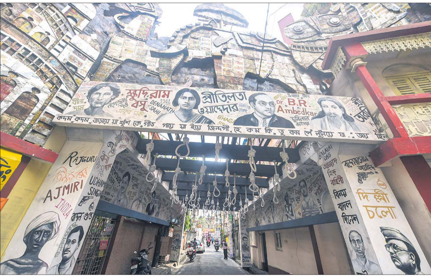
ସାଧାରଣ ପାଇଁ ସଂଗ୍ରାମ: ଦୁର୍ଗାପୂଜା ପୂର୍ବରୁ ସାଧାରଣ ସଂଗ୍ରାମର ୭୫ ବର୍ଷ ପୂର୍ତ୍ତି ଥିବାରୁ ନେଇ କୋଲକାତାର ଏକ ମଞ୍ଚପୂର୍ଣ୍ଣ ସଜିତ କରାଯାଇଛି।