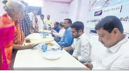
ଜିଲାପାଳ ଅଭିଯୋଗର ଶୁଣାଣି କରୁଛନ୍ତି। କାମାକ୍ଷାନଗର, ୨୭/୯ (ଡି.ଏନ.ଏ.)

କାମାକ୍ଷାନଗର ଉପଜିଲାପାଳଙ୍କ ସଭାଗୃହ ପ୍ରକଳ୍ପରେ ସୋମବାର ଜିଲା ପ୍ରଶାସନ ପକ୍ଷରୁ ନିର୍ମିତ କନ ଅଭିଯୋଗ ଶୁଣାଣି ଶିବିର ଅନୁଷ୍ଠିତ ହୋଇଯାଇଛି।