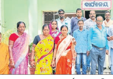
ରାସ୍ତା ସମସ୍ୟା ନେଇ ରୁକ୍ମ କାର୍ଯ୍ୟାଳୟ ଆସିଥିବା ଗ୍ରାମବାସୀ।

ରାସ୍ତା ନିର୍ମାଣରେ ବିଲମ୍ବ ନେଇ ସୋମବାର କଟିହାଁ ରୁକ୍ମ ପବିତ୍ରନଗର ଅଞ୍ଚଳ ବୁଢ଼ୁକୁନା ପଞ୍ଚାୟତ ଶରଧାପୁର ଗ୍ରାମବାସୀ ରୁକ୍ମ କାର୍ଯ୍ୟାଳୟ ସମ୍ମୁଖରେ ପ୍ରତିବାଦ କରିଛନ୍ତି।