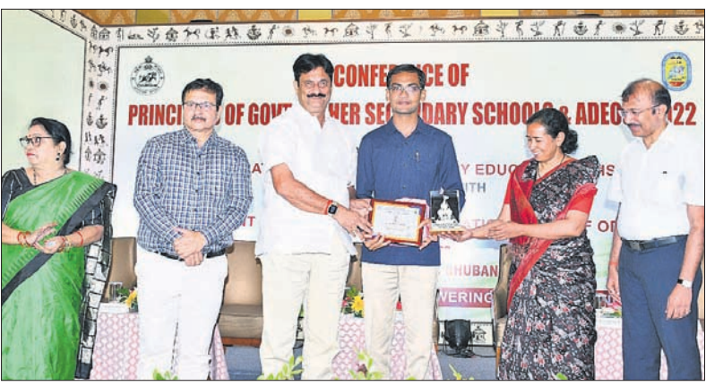
ମନ୍ତ୍ରୀ ସମୀର ରଞ୍ଜନ ଦାଶ ମୁଖ୍ୟ ପରୀକ୍ଷାରେ ଶ୍ରେଷ୍ଠ ପ୍ରଦର୍ଶନ କରିଥିବା ଚଣ୍ଡେଇ ଛାତ୍ରଙ୍କୁ ପୁରସ୍କାର ପ୍ରଦାନ କରୁଛନ୍ତି।

ଭୁବନେଶ୍ୱର, ୨୬/୧ (ସ୍ଥଳ) ରାଜ୍ୟର ସମସ୍ତ ସରକାରୀ ଉଚ୍ଚ ମାଧ୍ୟମିକ ବିଦ୍ୟାଳୟ ଅଧିକ ଶିକ୍ଷାଧିକାରୀ (ଏଡିଇଓ)ଙ୍କ ଦୁଇଦିନିଆ ସମ୍ମିଳନୀ ସୋମବାରଠାରୁ ଆରମ୍ଭ ହୋଇଛି।