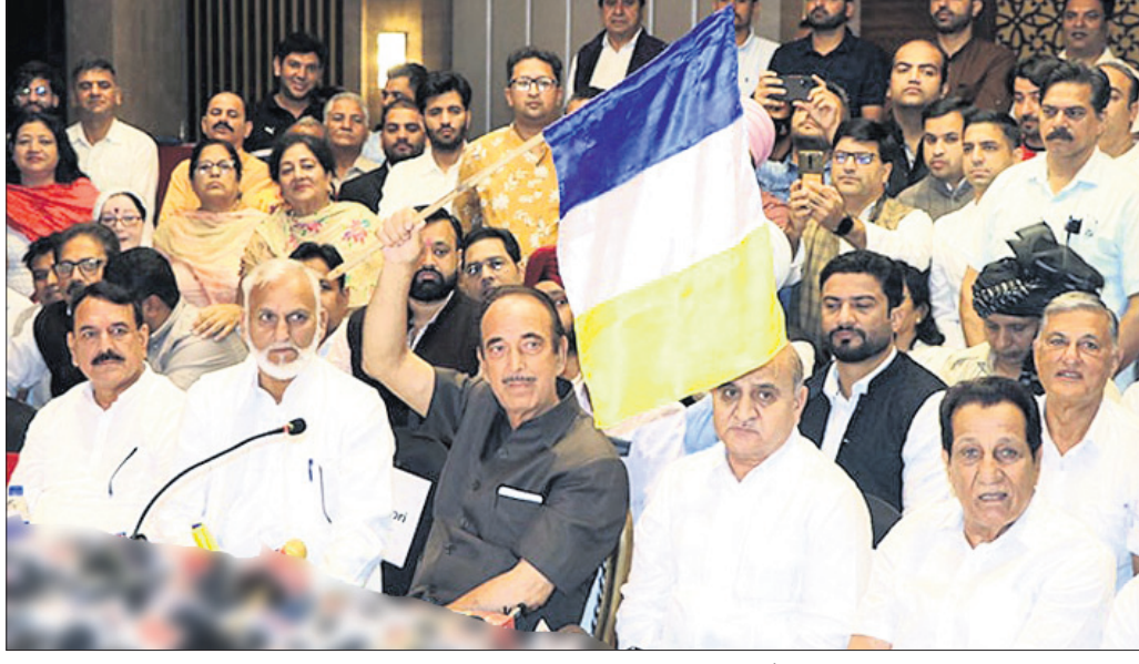
କଟକରେ ଏକ ଖବରଦାତା ସମ୍ମିଳନୀରେ ଗୁଲାନ ନବା ଆଜାଦ୍ ଦଳର ନାଁ ଘୋଷଣା କରୁଛନ୍ତି।

ପୂର୍ବତନ କଂଗ୍ରେସ ନେତା ଗୁଲାନ ନବା ଆଜାଦ୍ ସୋମବାର ନିଜର ନୂଆ ଦଳ 'ଡେମୋକ୍ରାଟିକ୍ ଆଜାଦ୍ ପାର୍ଟି' (ଡିଏପି)ର ଘୋଷଣା କରିଛନ୍ତି। ଏହା ଗଣତନ୍ତ୍ର ଏବଂ ଅଭିବ୍ୟକ୍ତି ଓ ଚିନ୍ତାଧାରା ସ୍ୱାଧୀନତାର ପ୍ରତୀକ। ତାଙ୍କ ଦଳର ନୀତି ମହାତ୍ମା ଗାନ୍ଧୀଙ୍କ ନୀତି ଆଦର୍ଶ ଆଧାରରେ ହେବ ବୋଲି ଗୁଲାନ ନବା କହିଛନ୍ତି। ତେବେ ସମ୍ଭାଷଣ ଅନୁଷ୍ଠାନ ୩୭୦ ଫେରାକିଆଣ୍ଡିବାକୁ ସେ ନିର୍ବାଚନ ପ୍ରସଙ୍ଗ କରିବେ ନାହିଁ ବୋଲି ଏହି ଅବସରରେ ସ୍ପଷ୍ଟ କରିଛନ୍ତି। ରାଷ୍ଟ୍ରପତି, ଜଳଯୋଗାଣ ଏବଂ ମୂଲ୍ୟବୃଦ୍ଧି ରୋକିବା ଆଦି ତାଙ୍କ ଦଳର ମୁଖ୍ୟ ପ୍ରସଙ୍ଗ ରହିବ। ଡିଏପି ଅନ୍ୟ କୌଣସି ଦଳ ସହ ପ୍ରତିଦ୍ୱନ୍ଦ୍ୱିତା ନ କରି ରାଜ୍ୟରେ ଶାନ୍ତି ଓ ସ୍ୱାଭାବିକତାକୁ ସୁଦୃଢ଼ କରିବା ଉପରେ ଗୁରୁତ୍ୱ ଦେବ ବୋଲି ପୂର୍ବତନ ମୁଖ୍ୟମନ୍ତ୍ରୀ କହିଛନ୍ତି। କଂଗ୍ରେସ ସହ ୫ ଦଶନ୍ଧିର ସମ୍ପର୍କ ରୁଟାଇ ଗୁଲାନ ନବା ଗତ ଅଗଷ୍ଟ ୨୬ରେ ଦଳକୁ ଉପସ୍ଥାପନ କରିବା ସହ ନୂଆ ଦଳ ଗଠନ କରିବାକୁ ସେ ନିର୍ବାଚନ ପ୍ରସଙ୍ଗ କରିବେ ବୋଲି ଘୋଷଣା କରିଥିଲେ। ଦଳର ନାଁ 'କ' ଶାବ୍ଦ ରହିବ ଏଥିପାଇଁ ସେ