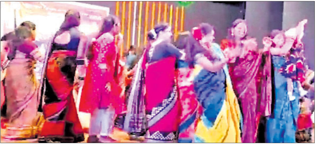
ନୂଆଁଖାଇ ଭେଟ୍‌ସାଫ୍ କାର୍ଯ୍ୟକ୍ରମରେ ସୁନ୍ଦରଗଡ଼ ନୃତ୍ୟ ପରିବେଷଣ କରୁଛନ୍ତି।

ପଶ୍ଚିମ ଓଡ଼ିଶାର ଗଣପର୍ବ ନୂଆଁଖାଇ ଆସିଲେ ଯିଏ ଯେଉଁଠି ଥାଉ ନା କାହିଁକି ମନେପଡ଼େ ଗାଁ ପରିବେଶ ଓ ପରିବାର ପରିଚଳନା କଥା। ଆଉ ଏହି ପର୍ବକୁ ଧୁମଧାମରେ ପାଳନ ପାଇଁ ଆଗେଇ ଆସନ୍ତି ବାହାରେ ରହୁଥିବା ଓଡ଼ିଆମାନେ। ଗତ ୨୫ ତାରିଖ ଦିନ ପୁଣେସ୍ଥିତ କଲକତ୍ତା ଆସୋସିଏସନ ପକ୍ଷରୁ ସେଠାରେ ରହୁଥିବା ପଶ୍ଚିମ ଓଡ଼ିଶାର ପରିବାରକୁ ନେଇ ନୂଆଁଖାଇ ଭେଟ୍‌ସାଫ୍ କାର୍ଯ୍ୟକ୍ରମ ଅନୁଷ୍ଠିତ ହୋଇଯାଇଛି। ଏହି କାର୍ଯ୍ୟକ୍ରମରେ ସୁନ୍ଦରଗଡ଼ ଜିଲ୍ଲା ବଡ଼ଗାଁ ବ୍ଲକ ସମେତ ପଶ୍ଚିଓଡ଼ିଶାର ବିଭିନ୍ନ ଜିଲାର ୫୦୦ରୁ ଊର୍ଦ୍ଧ୍ୱ ମହିଳା ପୁରୁଷ ଯୋଗ ଦେଇଥିଲେ। ଚଳିତବର୍ଷ ନୂଆଁଖାଇର ଉଦ୍‌ଦେଶ୍ୟ। ପ୍ରଥମ ପରବ ଆମର ଗରବ। ମହାରାଷ୍ଟ୍ରର ପୁନଃଗଠନ ଥିବା ଅଳ୍ପଶୀ ଋଷି ଲଙ୍ଗଡେ ନାଟ୍ୟଗୁହରେ ୨୦୦୫ ମସିହାରୁ ଓଡ଼ିଆମାନେ ପାଳନ କରିଆସୁଛନ୍ତି ନୂଆଁଖାଇ ଭେଟ୍‌ସାଫ୍। ଏବର୍ଷ ଏହି କାର୍ଯ୍ୟକ୍ରମ ଅଧିକ ଆକର୍ଷଣୀୟ ହୋଇଥିଲା। ସକାଳ ୮ ଘଣ୍ଟା ପାଠ ଆରମ୍ଭ କରି ସ୍ୱାଦିଷ୍ଟ ବ୍ୟଞ୍ଜନ ଭାତ, ଡାଲି, କରଡ଼ି ଆଦି, ଘାଣ୍ଟି ତରକାରୀ, କ୍ଷୀରି ଆଦି