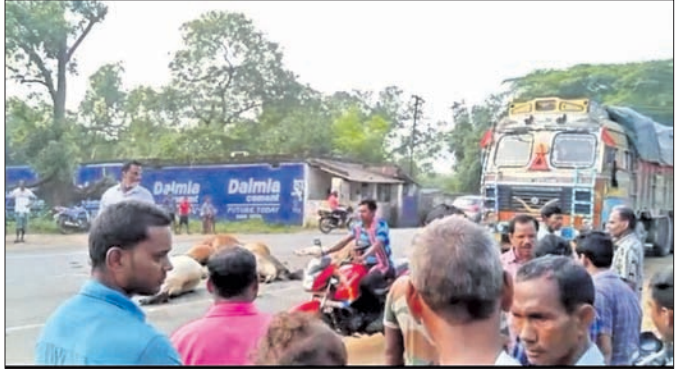
ଗୋରୁଙ୍କ ମୃତଦେହ ପଡ଼ିରହିଥିବାରୁ ଯାନାବାହନ ଅଟକି ରହିଛି ।

ସୋମବାର ରାତିରେ ୪୯୯ ନଂ ଜାତୀୟ ରାଜପଥରେ ପୃଥକ୍ ଦୁର୍ଘଟଣା ଘଟି ୧୮ ଗୋରୁଙ୍କ ମୃତ୍ୟୁ ହୋଇଛି । ଲଖନପୁର ଥାନା କୁଡ଼ାଲୋଇ ଗ୍ରାମ ନିକଟ ଜାତୀୟ ରାଜପଥ ଉପରେ ଗୋରୁପଲ ଶୋଇଥିବାବେଳେ କୌଣସି ଏକ ଗାଡି ସେମାନଙ୍କ ଉପରେ ଚଳିଯାଇଛି । ଫଳରେ ୧୨ଗୋରୁଙ୍କ ମୃତ୍ୟୁ ଘଟିଛି । ସେହିପରି ଝରସୁଗୁଡ଼ା ସଦର ଥାନା କୁଡ଼ିପଦର ଇଟ୍ଟିକି ନିକଟ ରାଜପଥରେ ଗୋରୁ ଶୋଇଥିବାବେଳେ କୌଣସି ଗାଡି ମାଟିଯିବା ଫଳରେ ୬ ଗୋରୁ ମୃତ୍ୟୁବରଣ କରିଛନ୍ତି । ରାସ୍ତା ଉପରେ ଗୋରୁଙ୍କ ମୃତଦେହ ଏଣେତେଣେ ପଡ଼ିରହିଥିବାରୁ ଯାନବାହନ ଚଳାଚଳ ବାଧାପ୍ରାପ୍ତ ହୋଇଥିଲା । ମଙ୍ଗଳବାର ସକାଳେ ଖବର ଜଣାପଡିବା ପରେ ଲୋକଙ୍କ ମଧ୍ୟରେ ଡାକ୍ତରୀ ଅଭିଯୋଗ ଦେଖାଦେଇଥିଲା । ବଜରଙ୍ଗ ଦଳ ଓ ସ୍ଥାନୀୟ ଲୋକେ