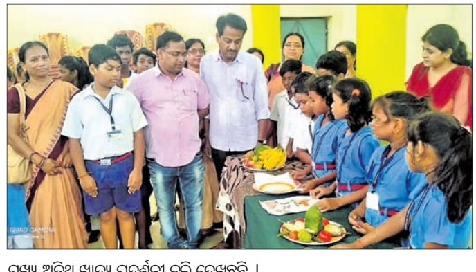
ପୁଖ୍ୟ ଅତିଥି ଖାଦ୍ୟ ପ୍ରଦର୍ଶନୀ ବୁଲି ଦେଖୁଛନ୍ତି।

ବରଗଡ଼ ଅର୍ଚ୍ଚିୟ, ୨୭।୯: ବରଗଡ଼ ସହରରେ ଲୁଚେଇବା ଶୈଳୀରେ ବର୍ତ୍ତମାନ ମଙ୍ଗଳବାର ଦିନ ପ୍ରସ୍ତୁତରେ ୨୭ଜଣ ଚିତ୍ର ଗ୍ରାହଣ ଶୀର୍ଷକ ନଂ-୧ ଅଧୀନ କେଶବ ନଗରରେ ଲୁଚେଇବା କରିଛନ୍ତି। ଗ୍ରାହଣ ସମ୍ପର୍କରେ ବେହେରାଙ୍କ ଘରକୁ ଲୁଚେଇବା ନେଇ ପତ୍ନୀ ଭୁବନେଶ୍ଵରରେ ସୁନା ବେଶା, ନଗଦ ୧୫୦୦ ଆଦି ଲୁଚି ନେଇଥିବା ଅଭିଯୋଗ ହୋଇଛି। ଲୁଚି ସାମଗ୍ରୀର ପରିମାଣ ୨୩୫ ୨୦ ହଜାର ଟଙ୍କା ହେବ ବୋଲି ପରିବାର ଲୋକେ କହିଛନ୍ତି। ଏ ନେଇ ବରଗଡ଼ ଗାନ୍ଧୀ ଥାନାରେ ଏକାକୀ ହେବା ପରେ ପୋଲିସ୍ ଘଟଣାସ୍ଥଳ ପରିବର୍ତ୍ତନ କରିବା ସହିତ ଅଭିଯୁକ୍ତଙ୍କୁ ଧରିବା ପାଇଁ ତନାୟନା ଚଳାଇଛି।