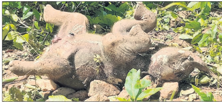
ମୃତ ହାତୀ ଶାବକ।

ମୟୂରଭଞ୍ଜ ଜିଲ୍ଲା କସ୍ତିପଦା ବନାଞ୍ଚଳର ନଗରୀ ସଂରକ୍ଷିତ ଜଙ୍ଗଲରୁ ୩ଦିନ ତଳେ ଏକ ଛୁଆ ହାତୀର ମୃତଦେହ ମିଳିଥିବା ବେଳେ ମଙ୍ଗଳବାର ବାଲିଗିପୋଷି ରେଞ୍ଜି ନାମ୍ନି ଗ୍ରାମ୍ୟ ଜଙ୍ଗଲରୁ ପୁଣି ହାତୀ ଶାବକର ମୃତଦେହକୁ ବନବିଭାଗ ଜବତ କରିଛି। ବାରିପଦା ଡିଏଫ୍‌ଓ ସରୋଷ କୁମାର ଯୋଗୀଙ୍କ ସମେତ ବନ କର୍ମଚାରୀ ଓ ପ୍ରାଣୀ ଚିକିତ୍ସକ ଘଟଣାସ୍ଥଳରେ ପହଞ୍ଚି ମୃତ୍ୟୁର ତଦନ୍ତ କରି ରଖିଛନ୍ତି। ମୃତ୍ୟୁର କାରଣ ଅସ୍ପଷ୍ଟ ରହିଥିବା ବେଳେ ହାତୀପଲରେ ଲଢ଼େଇ କିମ୍ବା ଆକ୍ରମଣ ରୋଗ ଯୋଗୁ ଉକ୍ତ ଶାବକର ମୃତ୍ୟୁ ହୋଇଥିବା ଓ ବ୍ୟବଚ୍ଛେଦ ରିପୋର୍ଟ