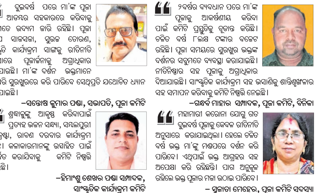
କର୍ମିତ କର୍ମକର୍ତ୍ତା ଯାତ୍ରା କୁହୁଡ଼ି...

ଦୁଇବର୍ଷ ପରେ ମା'ଙ୍କ ପୂଜା ଆଡ଼ମ୍ବର ସହକାରରେ କରିବାକୁ ସବୁମତେ ଉଦ୍ୟମ ଜାରି ରହିଛି। ପୂଜା ମଞ୍ଚ ସାଜସଜ୍ଜା, ପୁରୁଷ ଚୋରଣ, ସାଂସ୍କୃତିକ କାର୍ଯ୍ୟକ୍ରମ ସାଙ୍ଗକୁ ରାତିକାଟି ଅନୁସାରେ ପୂଜାର୍ଚ୍ଚନାକୁ ଅଗ୍ରାଧିକାର ଦିଆଯାଇଛି। ମା'ଙ୍କ ଦର୍ଶନ ଭକ୍ତମାନେ ଯେପରି ପୁରୁଷୁରରେ କରି ପାରିବେ ସେଥିପ୍ରତି ଯଥୋଚିତ ଧ୍ୟାନ ଦିଆଯାଇଛି।