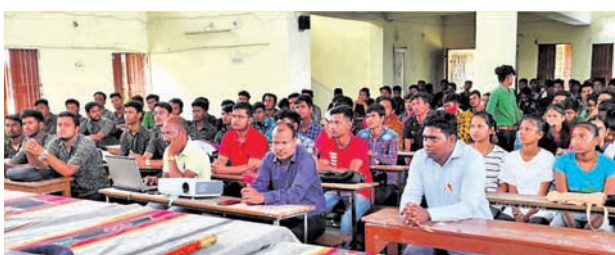
କାର୍ଯ୍ୟକ୍ରମରେ ଯୋଗଦେଇଥିବା ଛାତ୍ରାଛାତ୍ରୀ ଓ ଅଧ୍ୟାପକମାନେ ।