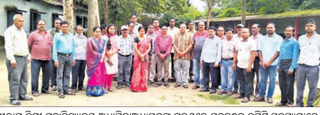
ଶ୍ରୀରାମ ତ୍ରିପ୍ତା ମହାବିଦ୍ୟାଳୟ ଅଧ୍ୟାପିକା ଅଧ୍ୟାପକଙ୍କ ଗହଣରେ ସହକର୍ମକର୍ମି ଅବସ୍ଥାମାନେ। ଭୁବନେଶ୍ଵର, ୨୭।୯ (ଡି.ଏନ.ଏ.)