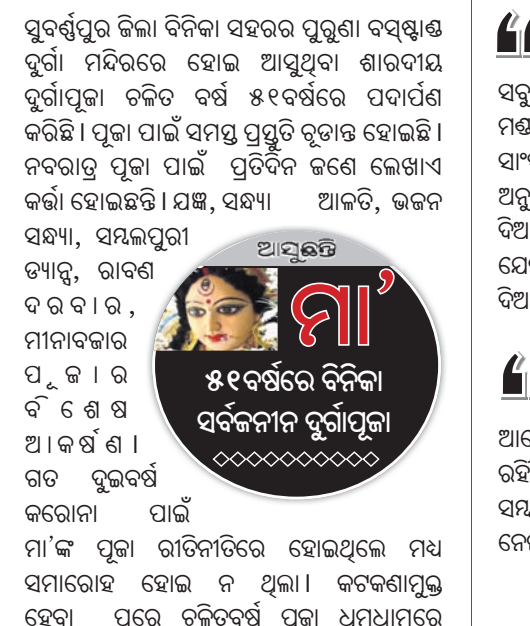
ଅଧିକାରୀ ମା'ଙ୍କ ୫୧ବର୍ଷରେ ବିନିକା ସର୍ବଜନୀନ ଦୁର୍ଗାପୂଜା

ପୁରୁଷପୁତ୍ର ଜିଲ୍ଲା ବିନିକା ସହରର ପୁରୁଣା ବସ୍ଷ୍ଟାଣ୍ଡ ଦୁର୍ଗା ମନ୍ଦିରରେ ହୋଇ ଆସୁଥିବା ଶାରଦୀୟ ଦୁର୍ଗାପୂଜା ବର୍ଷ ୫୧ବର୍ଷରେ ପଦାର୍ପଣ କରିଛି। ପୂଜା ପାଇଁ ସମସ୍ତ ପ୍ରସ୍ତୁତି ରୂପାନ୍ତ ହୋଇଛି। ନବରାତ୍ର ପୂଜା ପାଇଁ ପ୍ରତିଦିନ ଜଣେ ଲେଖାଏଁ କର୍ମୀ ହୋଇଛନ୍ତି। ଯଜ୍ଞ, ସନ୍ଧ୍ୟା ଆଳତି, ଭଜନ ସନ୍ଧ୍ୟା, ସମ୍ବଲପୁରା ତ୍ୟାଗ୍, ରାବଣ ଦରବାର, ମାନାବକାର ପୂଜା, ରବିଶେଷ ଆକର୍ଷଣ। ଗତ ଦୁଇବର୍ଷ କରୋନା ପାଇଁ ମା'ଙ୍କ ପୂଜା ରୀତିନୀତିରେ ହୋଇଥିଲେ ମଧ୍ୟ ସମାରୋହ ହୋଇ ନ ଥିଲା। କଟକଣାପୁତ୍ର ହେବା ପରେ ଚଳିତବର୍ଷ ପୂଜା ଧୁମ୍‌ଧାମ୍‌ରେ ପାକନ କରିବାକୁ କର୍ମିତ ନିଷ୍ପତ୍ତି ନେଇଛି।