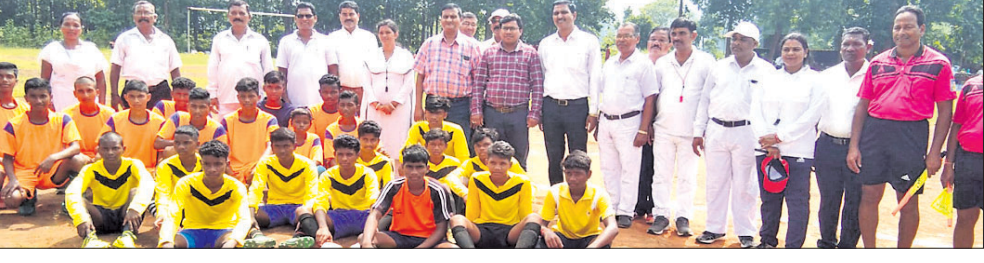
ଅତିଥିମାନଙ୍କ ଗହଣରେ ଉପସ୍ଥିତ ଖେଳାଳିବୃନ୍ଦ ।

ଦେବଗଡ଼ ଜିଲ୍ଲା ଶିକ୍ଷା ବିଭାଗ ଆନୁକୂଲ୍ୟରେ ତିଲୋଇବଣି ବ୍ଲକ୍ ଗାଇଁସର ହାଇସ୍କୁଲ ଖେଳ ପଡ଼ିଆରେ ମଙ୍ଗଳବାର ରୁକ୍ମପୁରୀୟ ଚାନ୍ଦ୍ର ବିଦ୍ୟାଳୟ ୧୭ ବର୍ଷରୁ କମ୍ ବାଳିକାବାଳକ ପୁଅବଳ ପ୍ରତିଯୋଗିତା ଉଦ୍‌ଯାପିତ ହୋଇଯାଇଛି । ଉଦ୍‌ଯୋଗୀ ଉତ୍ସବରେ ଗାଇଁସର ଉଚ୍ଚ ବିଦ୍ୟାଳୟର ପ୍ରଧାନ ଶିକ୍ଷକ ସଞ୍ଜୟ କୁମାର ବ୍ରହ୍ମା ସଭାପତି କରିଥିଲେ । ଜିଲ୍ଲା ଶିକ୍ଷାଧିକାରୀ ସଚିଦାନନ୍ଦ ବେହେରା ମୁଖ୍ୟ ଅତିଥି, ଆସିଷ୍ଟାଣ୍ଟ କମିଶନର କେବଳ୍ୟ ଶିଖୋର କର, ଅଧ୍ୟକ୍ଷପ୍ରାପ୍ତ ଶାରାଦିକ ଶିକ୍ଷା ନିରୀକ୍ଷକ ବାସଲ୍ୟ