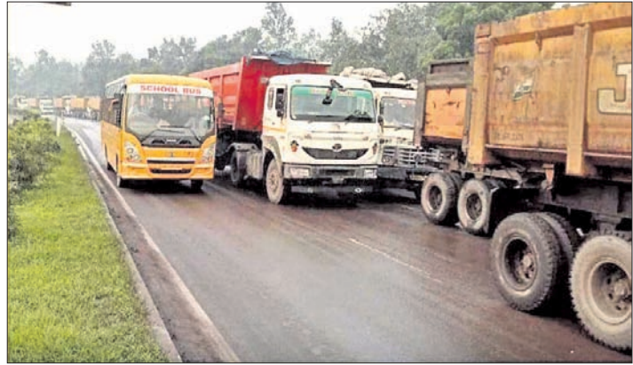
ସମ୍ବଲପୁର ଖଣ୍ଡାରେ ରାସ୍ତା ଜାମ୍ ହୋଇ ରହିଛି । ହଜାର ହଜାର ଟ୍ରକ୍ ଯିବାଆସିବା କରୁଛି । ଫଳରେ ନିୟମିତ ଭାବେ ଏହି ରାସ୍ତାରେ ଟ୍ରାଫିକ୍ ସମସ୍ୟା ଦେଖାଦେଉଛି । ଏପରି କି କୋଇଲା ପରିବହନ ଟ୍ରକ୍ ଚାଳକଙ୍କ ବେପରୁଆ ଗାଡି ଚାଳନା ଯୋଗୁ ଦୁର୍ଘଟଣା ଘଟି ଧନଜୀବନ ନଷ୍ଟ ହେଉଛି । ଏନ୍ଏସ୍‌ସି ପ୍ରାଥମିକ ସମସ୍ୟା ଦେଖାଦେଉଛି । ଏପରି କି କୋଇଲା ପରିବହନ ଟ୍ରକ୍ ଚାଳକଙ୍କ

ସମ୍ବଲପୁର-ରାଉରକେଲା ବିଜୁ ଏକ୍ସପ୍ରେସ୍ ଓ ଟ୍ରକ୍ ଦଖଲରେ ପ୍ରାୟ ୪ ଘଣ୍ଟା ଧରି ଜାମ ରହିଥିଲା। ତଳାବିରା କୋଇଲା ଖଣିରୁ ପରିବହନ ହେଉଥିବା କୋଇଲା ଟ୍ରକ୍ଗୁଡ଼ିକ ଖଣ୍ଡା ଛକରୁ ଲପଟା ଛକ ପ୍ରାୟ ୨ କି.ମି. ରାସ୍ତାକୁ ନିଜ ଦଖଲରେ ରଖିଥିଲେ।