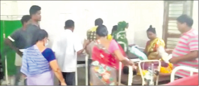
ଗୋଷ୍ଠୀ ସ୍ୱାସ୍ଥ୍ୟକେନ୍ଦ୍ରରେ ଗୁରୁତରମାନେ ଚିକିତ୍ସିତ ହେଉଛନ୍ତି।

ବାଲେଶ୍ୱର ଅଫିସ୍/ବାହାନଗା, ୨୮।୯ (ବି.ଏନ୍.ଏ.) ବାଲେଶ୍ୱର ଜିଲା ଖଜାପଡ଼ା ଥାନା ଅଧୀନ ଚାଲୁଣିଆ ଗ୍ରାମ ନିକଟସ୍ଥ ହାଇଲାଇଟ୍ ଗ୍ରୁପ୍ ଟିକ୍ସ ଯୋଗ୍ୟ ପ୍ଲାଷ୍ଟିକ୍ ଆମୋନିଆ ଗ୍ୟାସ୍ ଲିକ୍ ହୋଇଥିଲା। ପ୍ଲାଷ୍ଟିକ୍ କାର୍ଯ୍ୟକ୍ରମ ଶତାଧିକ ମହିଳାଙ୍କ ମଧ୍ୟରୁ ୪୦ରୁ ଉର୍ଦ୍ଧ୍ୱ ମହିଳା ସଂଖ୍ୟାରେ ହୋଇପଡ଼ିଥିଲା। ପ୍ଲାଷ୍ଟିକ୍ କର୍ମଚାରୀମାନେ ଗୁରୁତର ମହିଳାମାନଙ୍କୁ ପହଞ୍ଚାଇବା ପାଇଁ ପହଞ୍ଚିଛନ୍ତି। ଅନ୍ୟପକ୍ଷରେ କର୍ତ୍ତୃପକ୍ଷ ଏବଂ ପ୍ଲାଷ୍ଟିକ୍ ମାଲିକ ହସ୍ତପିଚାଲରେ ପହଞ୍ଚି ଆହତମାନଙ୍କ ସମସ୍ତ ଚିକିତ୍ସା କାର୍ଯ୍ୟକୁ ତଦାରଖ କରୁଥିବା ଜଣାପଡ଼ିଛି।