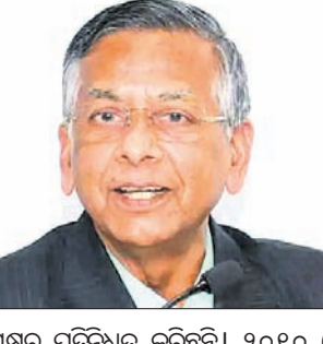
ପୂର୍ବତନ ଆର୍ଡ଼ି ଜେନେରାଲ ମୁକୁଳ ରୋହଟଗାଙ୍କୁ ପୁଣିଥରେ ନିଯୁକ୍ତ କରାଯାଇଛି।