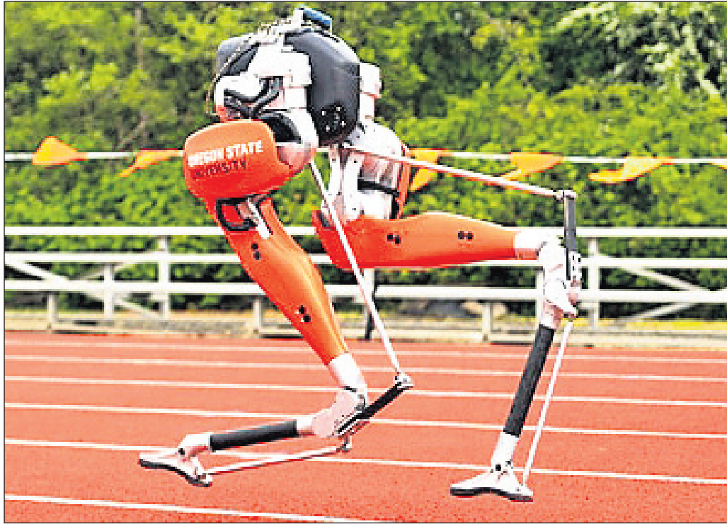
୨୦୧୭ରେ କାସିକୁ ଲକ୍ଷ୍ମ୍ୟଙ୍କୁ ଛାତ୍ରାଛାତ୍ର ମିଳିତ ଭାବେ କାସିକୁ ଭାବେ କାର୍ଯ୍ୟ କରିପାରିବ ସେ ନେଇ ତିଆରି କରିଛନ୍ତି। ଲୋକୋମୋଶନ୍ ଅଧିକ ଅଧ୍ୟୟନ ସକାଶେ ଏହି ବା ଗତି କ୍ଷେତ୍ରରେ ରୋବୋ କପରି ରୋବୋ ତିଆରି କରାଯାଇଛି।