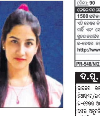
ଡେରାଡୁନ, ୨୮: ଉତ୍ତରାଖଣ୍ଡର ବହୁଚର୍ଚ୍ଚିତ ଅକ୍ତିତା ହତ୍ୟାକାଣ୍ଡ ମାମଲାର ଶୁଣାଣି ଫାଷ୍ଟଟ୍ରାକ୍ଟ କୋର୍ଟରେ କରାଯିବ ବୋଲି କୁଟିବାର ଉଦ୍ଦେଶ୍ୟରେ ମୁଖ୍ୟମନ୍ତ୍ରୀ ପୁଷ୍କର ସିଂଧିଆ କହିଛନ୍ତି।