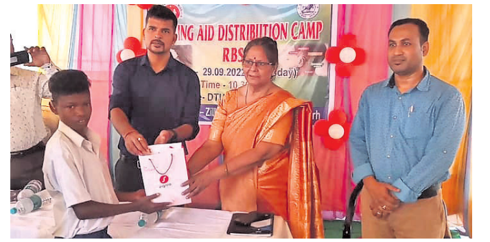
ଶୁଭଶୟନ ପ୍ରଦାନ କରାଯାଇଛି।

ଦେବଗଡ଼ ଜିଲ୍ଲା ପୁଖ୍ୟ ଚିକିତ୍ସାକର ପରିସରରେ ଗୁରୁବାର ଜିଲ୍ଲା ସ୍ଵାସ୍ଥ୍ୟ ସମିତି ପକ୍ଷରୁ ଶୁଭଶୟନ ପ୍ରଦାନ କରାଯାଇଛି। ପୂର୍ବାହରେ ଜିଲ୍ଲାପାଳ ତଥା ଜିଲ୍ଲା ସ୍ଵାସ୍ଥ୍ୟ ସମିତି ଅଧ୍ୟକ୍ଷ ସୋମେଶ ଉପାଧ୍ୟାୟଙ୍କ ଅଧିକାରରେ ଆୟୋଜିତ ଶୁଭଶୟନ ପ୍ରଦାନ କାର୍ଯ୍ୟକ୍ରମରେ ଜିଲ୍ଲାର ବିଭିନ୍ନ ଅଞ୍ଚଳକୁ ଚିହ୍ନଟ ହୋଇଥିବା ୩୩ ଜଣ ଶୁଭଶୟନ ବାଧୁତ ଶିଶୁଙ୍କୁ ଶୁଭଶୟନ ପ୍ରଦାନ କରାଯାଇଛି। ଜିଲ୍ଲାପାଳ ଉପାଧ୍ୟାୟ ଶୁଭଶୟନକୁ ଶିଶୁଙ୍କ କାନରେ ଲଗାଇ କାର୍ଯ୍ୟକ୍ରମର ଶୁଭାରମ୍ଭ କରିଥିଲେ।