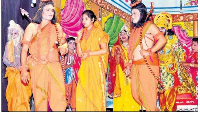
ରାମଲୀଳା ତୃତୀୟ ରଜନୀରେ ରାମ ବନବାସ ଦୃଶ୍ୟାଭିନୟ।

ସୋହେଲା, ୨୯୯୮ (ଡି.ଏନ.ଏ.): ସୋହେଲା ପାଇଁ ବନକୁ ଯାଇଛନ୍ତି। ସେଠାରେ ବୈଦିଆଲକ୍ଷ୍ୟ ମିଳନ ହୋଇଛି। ଭରତ ପ୍ରଭୁଙ୍କ ପାଦୁକା ମୁଣ୍ଡାଇ ଅଯୋଧ୍ୟା ଫେରିଥିବାର ଦୃଶ୍ୟାଭିନୟ ହୋଇଥିଲା। ବିଭିନ୍ନ ଭୂମିକାରେ ପରାଗ, ଶତ୍ରୁ, କୁମାନ୍ଦୁଣୀ କରି ଶ୍ରୀରାମ, ଲକ୍ଷ୍ମଣ ଓ ସୀତାଙ୍କୁ ବନବାସ ପ୍ରେରଣ କରିଛନ୍ତି। ଭରତ ଅଯୋଧ୍ୟାକୁ ଫେରି ବଡ଼ଭାଇ ରାମଙ୍କୁ