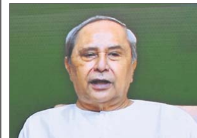
ସବିଶେଷ ରିପୋର୍ଟ: ପୃଷ୍ଠା-୫