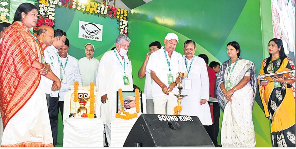
ଭୁବନେଶ୍ୱର ବରମୁଣ୍ଡା ପଢ଼ିଆଠାରେ ଗୁରୁବାର ପଦଯାତ୍ରା ପ୍ରସ୍ତୁତି ଚେତନା ବିଜେଡିର ନେତୃତ୍ୱ ଉଦ୍‌ଘାଟନ କରୁଛନ୍ତି।