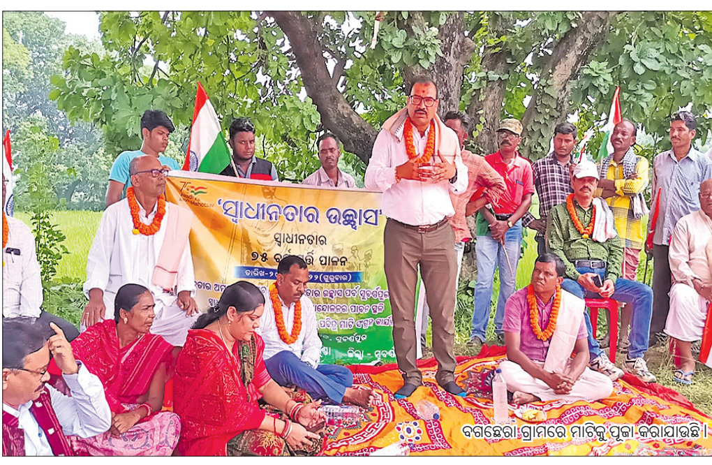
ବଗଇଚୋ ଗ୍ରାମରେ ମାଟିକୁ ପୂଜା କରାଯାଇଛି।

ସ୍ୱାଧୀନତାର ଅନୁତ ମହୋତ୍ସବ ଓ ସ୍ୱାଧୀନତାର ଉତ୍ସାହ ପର୍ବ ପାଇଁ ଓଡ଼ିଶାର ସମସ୍ତ ଜିଲ୍ଲା ପବିତ୍ର ମାଟି ଓ ଜଳ ସଂଗ୍ରହ ହେଉଛି। ସଂଗ୍ରହୀତ ମାଟି ଓ ଜଳ ରାଜ୍ୟ ବିଧାନସଭାରେ ବୃକ୍ଷରୋପଣ ପାଇଁ ବ୍ୟବହାର ହେବ। ଏହି କ୍ରମରେ ସୁବର୍ଣ୍ଣପୁର ଜିଲାର ସ୍ୱାଧୀନତା ସଂଗ୍ରାମ ଓ ପ୍ରଜାମଣ୍ଡଳ ଆନ୍ଦୋଳନର ପାଦନ ସ୍ଥଳୀ କଳାପଥର ପଞ୍ଚାୟତର ବଗଇଚୋ ଗ୍ରାମରୁ ଗୁରୁବାର ପବିତ୍ର ମାଟି ସଂଗ୍ରହ ହୋଇଛି।