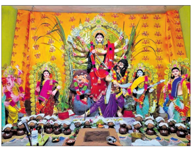
ମା'ଙ୍କ ପୂଜା କରାଯାଉଛି। ନୂଆପଡ଼ା ଅଫିସ୍, ୨୯।୯