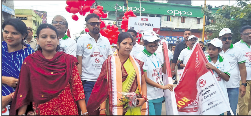
ବିଶ୍ଵ ହୃଦୟ ଦିବସ ଅବସରରେ ବଲାଙ୍ଗୀର ସହରରେ ବାହାରି ଥିବା ରାଲି।