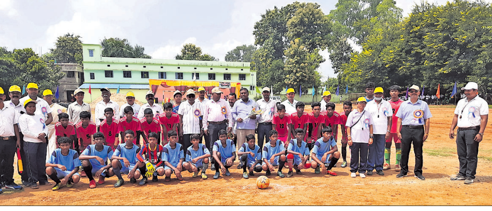
ଆନ୍ତର୍ବିଦ୍ୟାଳୟ ପୁରବଳ ପ୍ରତିଯୋଗିତାରେ ଅଂଶଗ୍ରହଣ କରିଥିବା ଖେଳାଳି।

ସୁନ୍ଦରଗଡ଼ ଜିଲ୍ଲା କୁତ୍ରା ସରକାରୀ ଉଚ୍ଚଶିକ୍ଷା ବିଦ୍ୟାଳୟ ଖେଳପଡ଼ିଆରେ ଗୁରୁବାର ବ୍ଲକସ୍ତରୀୟ ଆନ୍ତର୍ବିଦ୍ୟାଳୟ ପୁରବଳ ପ୍ରତିଯୋଗିତା ଅନୁଷ୍ଠିତ ହୋଇଯାଇଛି। ଏଥିରେ କୁତ୍ରା ବ୍ଲକର ବିଭିନ୍ନ ବିଦ୍ୟାଳୟର ୧୨୭୫ରୁ କମ ବାଳକ ଓ ବାଳିକା ପୁରବଳ ଖେଳାଳି ଭାଗ ନେଇଥିଲେ। ପାଇବାଲ ଖେଳ ବାଳକ ବିଭାଗରେ କୁତ୍ରାପଡ଼ିଆର ଉଚ୍ଚ ବିଦ୍ୟାଳୟ ଓ ଉଚ୍ଚଶିକ୍ଷା ବିଦ୍ୟାଳୟ କୁତ୍ରା ମଧ୍ୟରେ ହୋଇଥିଲା। ଏଥିରେ କୁତ୍ରା ଉଚ୍ଚଶିକ୍ଷା ବିଭାଗରେ କୁତ୍ରାପଡ଼ିଆର ଉଚ୍ଚ ବିଦ୍ୟାଳୟ ରାମ୍ପିୟନ ହୋଇଥିଲା। ଉଦ୍‌ଯୋଗୀ ଉତ୍ସବରେ ପୁଖ୍ୟ ଅତିଥି ଭାବେ କୁତ୍ରା ବିଡିଓ ରବୀନ୍ଦ୍ର କୁମାର ସେଠା, ବିଜୁ ଗୁରୁତରଣ