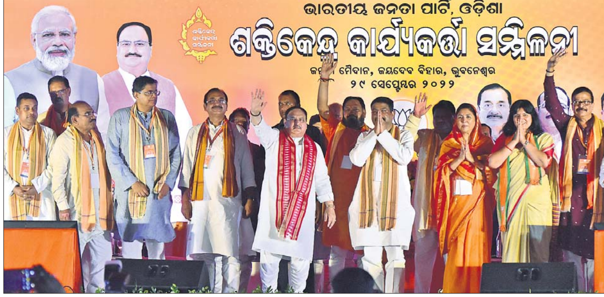
ଭୁବନେଶ୍ୱରର ଜନତା ମଞ୍ଚପାଠାରେ ଭାଜପାର ଶକ୍ତିକେନ୍ଦ୍ର କାର୍ଯ୍ୟକର୍ତ୍ତା ସମ୍ମିଳନୀରେ ରାଷ୍ଟ୍ରୀୟ ଅଧ୍ୟକ୍ଷ ଜେ.ପି.ନନ୍ଦା ଓ ଅନ୍ୟ ନେତୃତ୍ୱ।