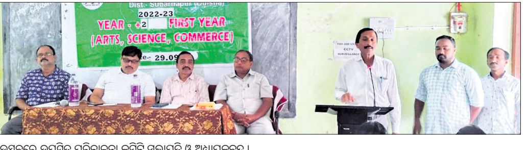
ଉତ୍ସବରେ ଉପସ୍ଥିତ ପରିଚାଳନା କମିଟି ସଭାପତି ଓ ଅଧ୍ୟାପକଙ୍କୁ।