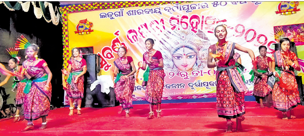
ଲଡୁଗାଁ ସୁବର୍ଣ୍ଣ ଜୟନ୍ତୀ ଶାରଦୀୟ ଦୁର୍ଗାପୂଜାରେ ପରିବେଷଣ ସାଂସ୍କୃତିକ କାର୍ଯ୍ୟକ୍ରମ।