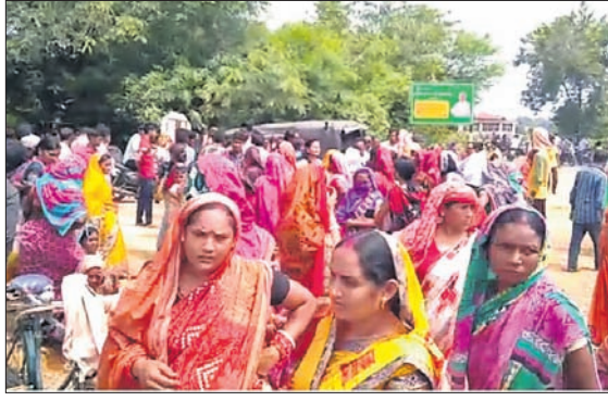
ଦୁର୍ଗାପାଲି ଛକରେ ମହିଳା ମହାସଂଘ ସଦସ୍ୟମାନେ ରାସ୍ତାବରୋଧ କରିଛନ୍ତି।