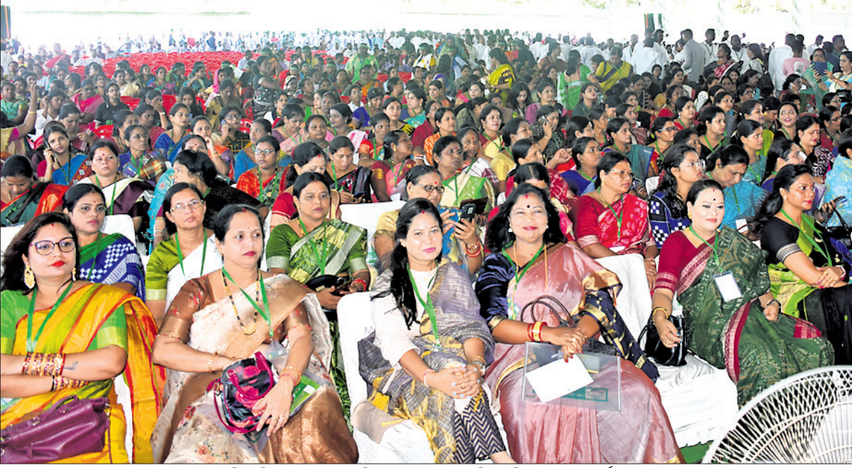
ବିଜେଡିର ପଦଯାତ୍ରା ପ୍ରସ୍ତୁତି ସମାବେଶରେ ଉପସ୍ଥିତ ମହିଳା ନେତ୍ରୀ ଓ କର୍ମୀ ।