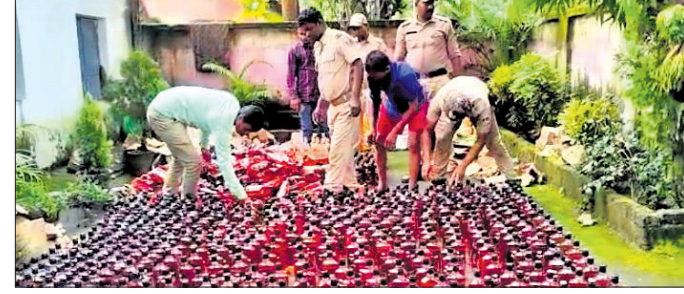
ଜବତ ହୋଇଥିବା ନକଲି ମଦ।