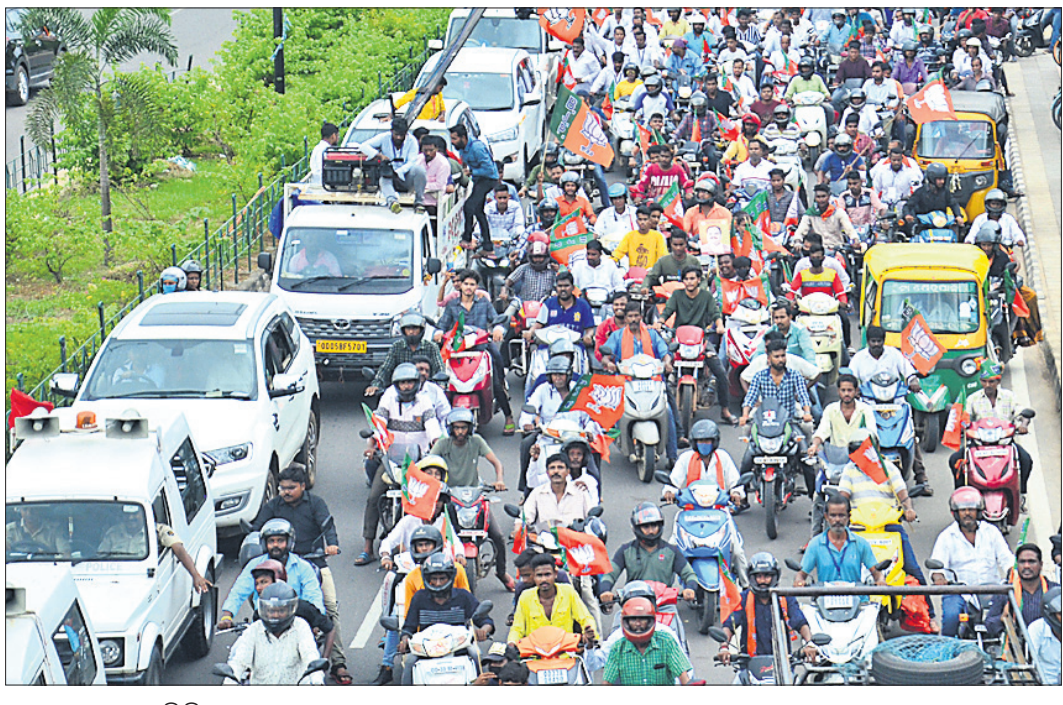
ନନ୍ଦାଙ୍କୁ ସ୍ୱାଗତ କରି ବିମାନବନ୍ଦରୁ ଭାଜପା ରାଜ୍ୟ କାର୍ଯ୍ୟାଳୟ ଯାଏ ବାଉଁଟ ରାଲି ।

ବୋଲି ସେ କହିଛନ୍ତି । ବିଜେଡି ରାଜ୍ୟ ସଭା ସଦସ୍ୟ ସମ୍ମିତ ପାତ୍ର କହିଛନ୍ତି, ୬ ଲକ୍ଷ ଘର ଲୋକଙ୍କୁ ମିଳିବ ଯାହା ଆବାସ ପୋଲିଲ ଖୋଲିଲେ ସମସ୍ତ ସେହି ପ୍ରସଙ୍ଗ ସମପ୍ରକୃ ଆନ୍ଦୋଳିତ କରୁଛି । କେନ୍ଦ୍ରକୁ ବିଜେ ଯୋଜନାରେ ଯେଉଁ ପାଣ୍ଠି ଆସିବା କଥା ତାହା ସମପ୍ରକୃ ଆନ୍ଦୋଳିତ କରୁଛି । ଏପରି ଅନେକ ପ୍ରସଙ୍ଗ ଅଛି ଯେଉଁଥିରେ ଓଡ଼ିଶାକୁ ହକ୍ ମିଳିବାର ଅଛି ସେକଥା ସେମାନେ କୁହୁଛୁ ବୋଲି ସମ୍ମିତ କହିଛନ୍ତି ।