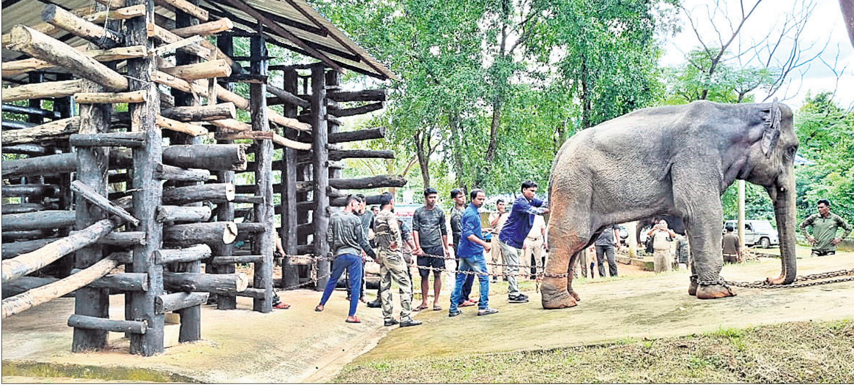
ହାତୀକୁ ଏଲିଫାଣ୍ଟ ସେଣ୍ଟରରେ ଥିବା କ୍ରଲ୍ ଭିତରକୁ ନିଆଯାଇଛି ।

ଜେକାନାଳ ଅଫିସ, ୨୯।୮ କଟକ ଜଗତପୁର ଅଞ୍ଚଳରେ ଆତଙ୍କ ସୃଷ୍ଟି କରି ଦିନକରେ ୩ ଜୀବନ ନେଇଥିବା ନରହତା ମାଛହାତୀକୁ ଗ୍ରାଜୁଲାକର ପରେ ରୁରୁବାର ଜେକାନାଳ କପିଳାସ ପ୍ରାଣୀରଦ୍ୟାନସ୍ଥିତ ଏଲିଫାଣ୍ଟ ରେସ୍‌କୁ ସେଣ୍ଟରକୁ ଅଣାଯାଇଛି । ହିଂସ୍ରହାତୀକୁ ନିୟନ୍ତ୍ରଣକୁ ଆଣିବାକୁ ସ୍ୱତନ୍ତ୍ର ଭାବେ ନିର୍ମାଣ କରାଯାଇଥିବା 'କ୍ରଲ୍' (କାଠ ଘେରାବନ୍ଦୀ ଘର)ରେ ରଖାଯାଇଛି । ହାତୀଟି ତିହାଇଡ୍ରେଶନର ଶିକାର ହୋଇଛି । ଏକ ସ୍ୱତନ୍ତ୍ର ତାଲିମୀ ଦଳ ତାହାର ସ୍ୱାସ୍ଥ୍ୟାବସ୍ଥା ଯାଞ୍ଚ କରୁଥିବା ଜିଲ୍ଲା ବନଖଣ୍ଡ ଅଧିକାରୀ