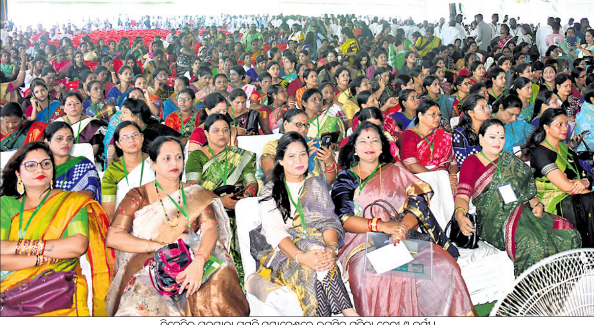
ବିଜେଡିର ପଦଯାତ୍ରା ପ୍ରସ୍ତୁତି ସମାବେଶରେ ଉପସ୍ଥିତ ମହିଳା ନେତ୍ରୀ ଓ କର୍ମୀ ।