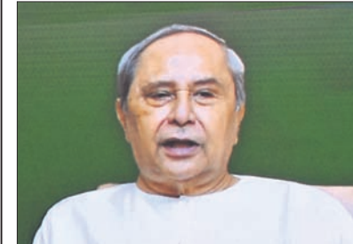
ସବିଶେଷ ରିପୋର୍ଟ: ପୃଷ୍ଠା-୩