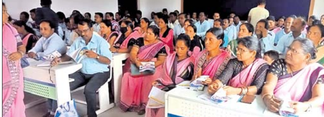
ଶିବିରରେ ଉପସ୍ଥିତ ଶିକ୍ଷୟିତ୍ରୀ, ଶିକ୍ଷକମାନେ।

ଦାରିଙ୍ଗବାଡ଼ି ବ୍ଲକ୍ ଅଞ୍ଚଳରେ ଶିକ୍ଷୟିତ୍ରୀ, ଶିକ୍ଷକଙ୍କ ଦୁଇଦିନିଆ ତାଲିମ ଶିବିର ଅନୁଷ୍ଠିତ ହୋଇଯାଇଛି। ପ୍ରଥମ ଦିନ ସିମ୍ପନବାତି କ୍ଷେତ୍ରରେ ବାଡ଼ବାଜା, କିର୍କୁଟି, ତିଲୋରା, ବୁଢ଼ାଗୁଡ଼ା, ଗୁମ୍ଫାକିଆ ଏବଂ ଶ୍ରୀନିକେତା ଅଞ୍ଚଳରେ ଥିବା ବିଦ୍ୟାଳୟର ଶିକ୍ଷୟିତ୍ରୀଶିକ୍ଷକ ମାନଙ୍କୁ ଶିକ୍ଷଣ ତାଲିମ ଦିଆଯାଇଥିଲା। ସେହିପରି ଦାରିଙ୍ଗବାଡ଼ି କ୍ଷେତ୍ରର ଦାରିଙ୍ଗବାଡ଼ି, ଗ୍ରାମବାଡ଼ି, ପର୍ତ୍ତାହା, ସିଆଙ୍ଗବାଲି, ଭ୍ରାମ୍ୟବାଡ଼ି, ଦନେକବାଡ଼ି, ସିକାବରୀ, ଦାସିଙ୍ଗବାଡ଼ି, ସୋନପୁର ପଞ୍ଚାୟତ ଅଞ୍ଚଳର ସମସ୍ତ ବିଦ୍ୟାଳୟର ଶିକ୍ଷୟିତ୍ରୀ ଶିକ୍ଷକଙ୍କୁ ଓ ଆଦର୍ଶ ବିଦ୍ୟାଳୟ ଠାରେ ତାଲିମ ଦିଆଯାଇଥିଲା। ବାମୁଣାଗାଁ ସରକାରୀ