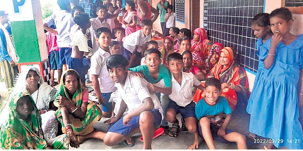
ଭଞ୍ଜନ ଅଭିଭାବକ ଏବଂ ଛାତ୍ରଛାତ୍ରୀ ଆନ୍ଦୋଳନରେ ସଂଯୁକ୍ତ।

ଗୋଟିଏ ପ୍ରଶ୍ନପତ୍ର ଦିଆଯାଇଛି। ଏହାଦ୍ୱାରା ସମୟ ଅପଚୟ ସହ ଛାତ୍ରଛାତ୍ରୀଙ୍କ ମଧ୍ୟରେ ଅସନ୍ତୋଷ ପ୍ରକାଶ ପାଇଛି। ପରୀକ୍ଷା ହେଲେ ଧଳା କାଗଜ କିଣି ଆଣିବା ପାଇଁ କୁହାଯାଇଛି। ଗୋଟିଏ ଶ୍ରେଣୀକୁ