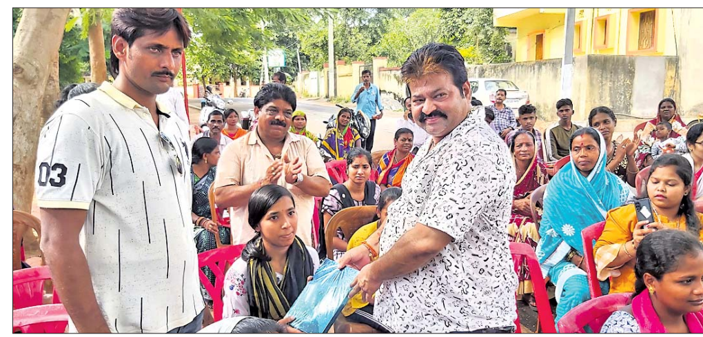
ଏନ୍ଏସି ଅଧ୍ୟକ୍ଷ ଜଣେ ପ୍ରତିଯୋଗୀଙ୍କୁ ପୁରସ୍କୃତ କରୁଛନ୍ତି।