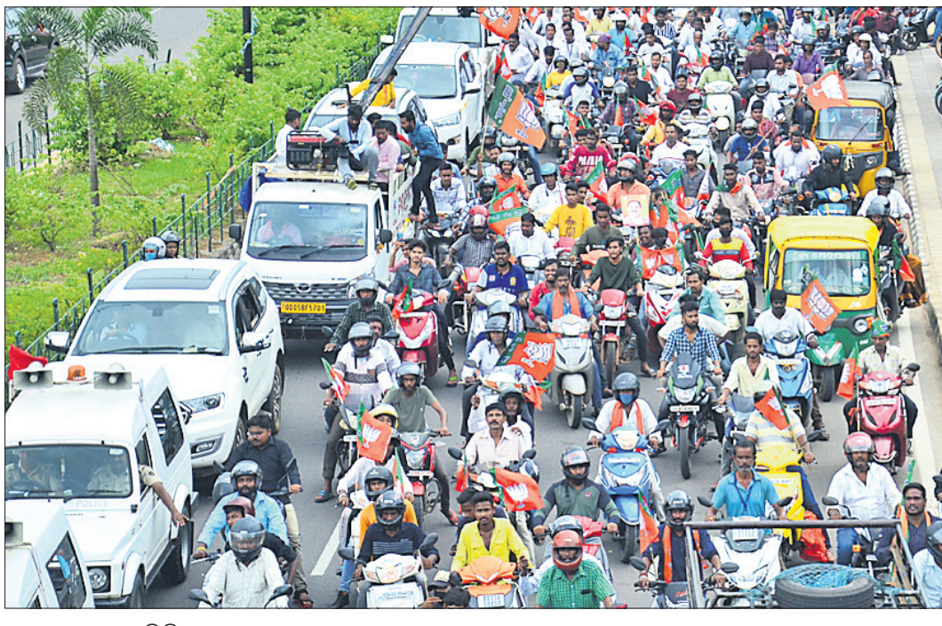
ନନ୍ଦାଙ୍କୁ ସ୍ୱାଗତ କରି ବିମାନବନ୍ଦରୁ ଭାଜପା ରାଜ୍ୟ କାର୍ଯ୍ୟାଳୟ ଯାଏ ବାଉଁଟ ରାଲି ।