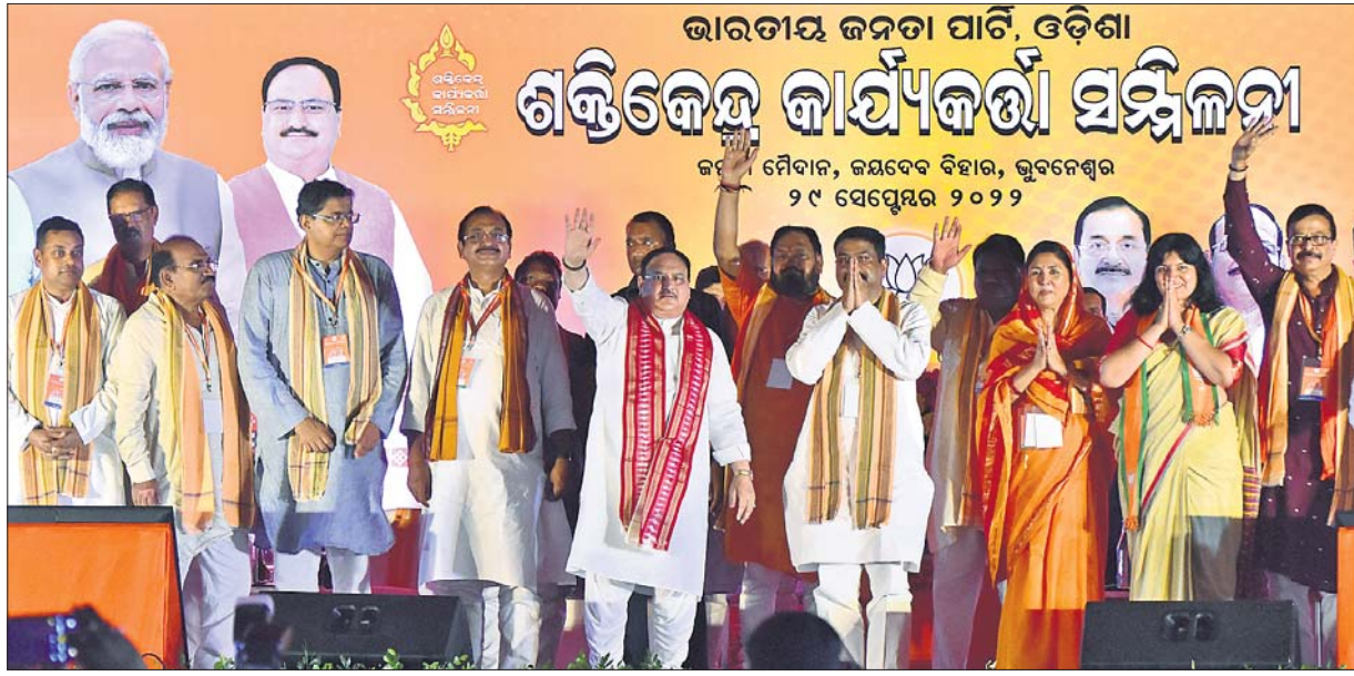
ଭୁବନେଶ୍ଵରର କନତା ମଇଦାନଠାରେ ଭାଜପା ଶକ୍ତିକେନ୍ଦ୍ର କାର୍ଯ୍ୟକର୍ତ୍ତା ସମ୍ମିଳନୀରେ ରାଷ୍ଟ୍ରୀୟ ଅଧ୍ୟକ୍ଷ ଜେ.ପି.ନକ୍ଷା ଓ ଅନ୍ୟ ନେତୃତ୍ଵ।