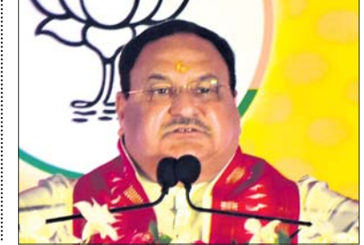
ପୂର୍ବତନ ଆଇଏଏସ୍ ଅଫିସର ବିନୋଦ କୁମାରଙ୍କ ସହ ଆଉ ୨ଜଣଙ୍କୁ ମଧ୍ୟ ଜେଲଦଣ୍ଡ