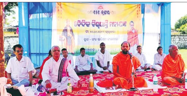
ବୈଦିକ ବିଶ୍ୱଶାନ୍ତି ମହାଯଜ୍ଞରେ ପ୍ରବଚନ ଚାଲିଛି।