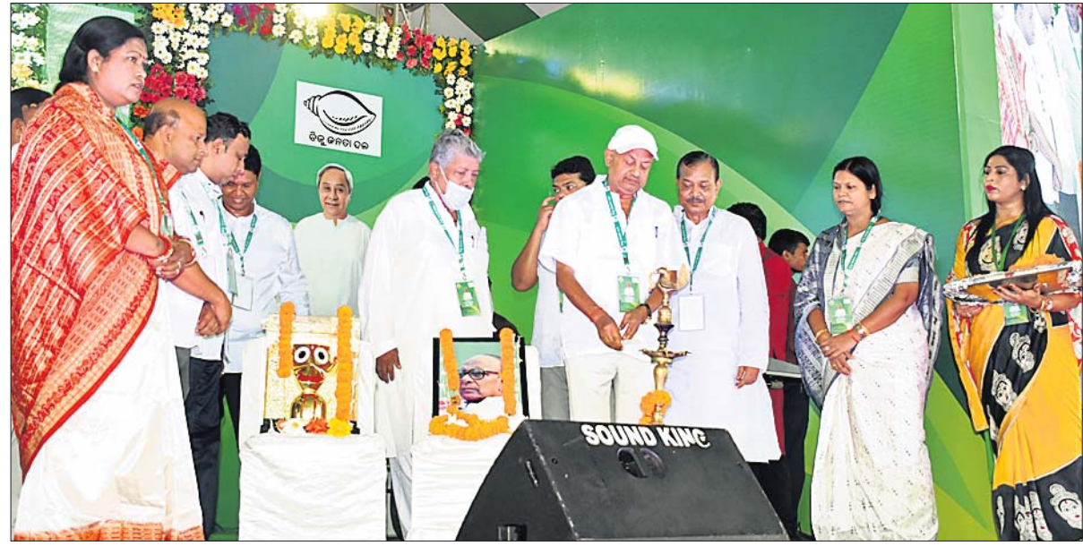
ଭୁବନେଶ୍ଵର ବରମୁଣ୍ଡା ପଢ଼ିଆଠାରେ ଗୁରୁବାର ପଦଯାତ୍ରା ପ୍ରସ୍ତୁତି ଦିେଠକକୁ ବିଜେଡିର ନେତୃତ୍ଵ ଉଦ୍ଘାଟନ କରୁଛନ୍ତି।