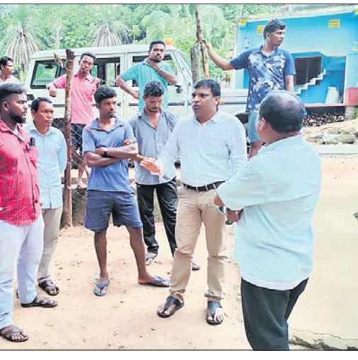
ବିଦ୍ୟାଳୟ ପରିଦର୍ଶନ କରୁଛନ୍ତି ବିଡ଼ିଓ ।