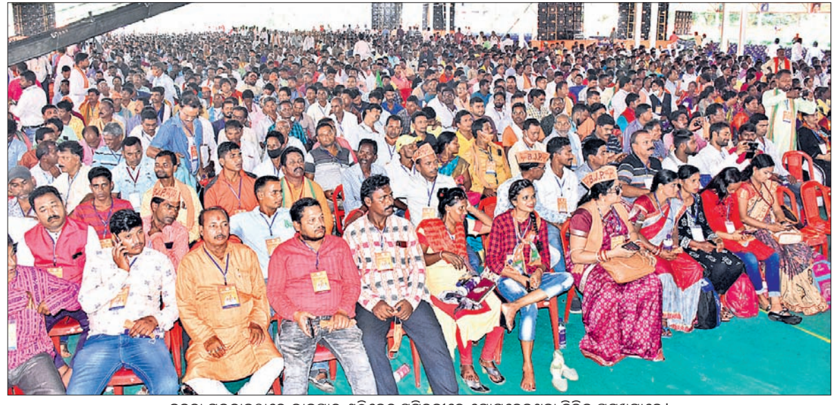
ଜନତା ମଜଦାନଠାରେ ଭାଜପାର ଶକ୍ତିକେନ୍ଦ୍ର ସମ୍ମିଳନୀରେ ଯୋଗଦେଇଥିବା ବିଜେଡି ପ୍ରମୁଖମାନେ ।