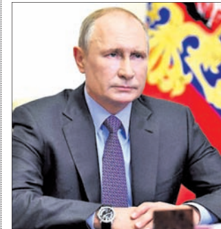
ଅଞ୍ଚଳର ମିଶ୍ରଣ ଦସ୍ତାବିଜରେ ସ୍ୱାକ୍ଷର କରିବେ ପୁଟିନ୍

କାପୋରିଟିଆରେ ୫ ଦିନ ଧରି ଚାଲିଥିବା ଗଣଭୋଟ ମଙ୍ଗଳବାର ଶେଷ ହେବା ପରେ ଯୁକ୍ତେନ୍ଦ୍ର ଏହି ୧୫% ଅଞ୍ଚଳଗୁଡ଼ିକ ଉପରେ ମସ୍କୋ ଆଧିକାରୀ ଦସ୍ତାବିଜ ଉପରେ ସ୍ୱାକ୍ଷର କରିବେ।