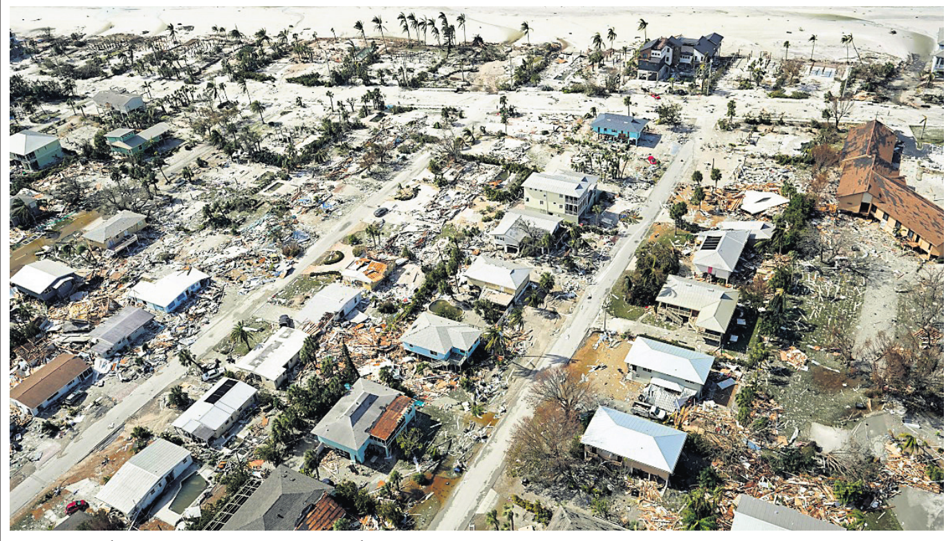
ଭାରତୀୟ ସୁରକ୍ଷା ଦଳ ମାଟି ଆଦି ବିପର୍ଯ୍ୟୟ ଘଟାଇଛି। ଅନେକ ଘରଘାର ମାଟିରେ ନିଶିଯାଇଥିବାବେଳେ ବିଦ୍ୟୁତ୍ ଖୁଣ୍ଟଗୁଡ଼ିକ ଧରାଶାୟୀ ହୋଇଛି।

ନୂଆଦିଲ୍ଲୀ, ୨୯।୯: ଏକଗାର ପରିଷଦ-ମାତ୍ରାଦା ସମ୍ପର୍କ ମାମଲାରେ ଜେଲରେ ଥିବା ସାମାଜିକ କର୍ମୀ ଗୌତମ ନଭଲଖାଳଙ୍କୁ ତିନିହା ପାଇଁ ଦୁଇଟି ମୁଦାୟା ଯୋଗାଇ ଦେବାକୁ ନିର୍ଦ୍ଦେଶ ଦେଇଛନ୍ତି।