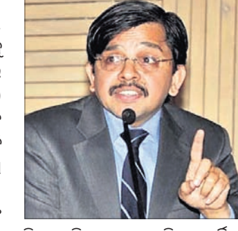
ବିଚାରପତିମାନଙ୍କ ବଦଳି ସମ୍ପର୍କିତ ପ୍ରସଙ୍ଗ ଉପରେ ଆଲୋଚନା ହୋଇଥିଲା।