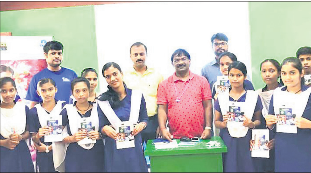
ଅଭିଯୁକ୍ତ ଗହଣରେ ପ୍ରତିଭା ଅନ୍ୱେଷଣ କାର୍ଯ୍ୟକ୍ରମରେ ଭାଗ ନେଇଥିବା ଛାତ୍ରାଛାତ୍ରୀ।