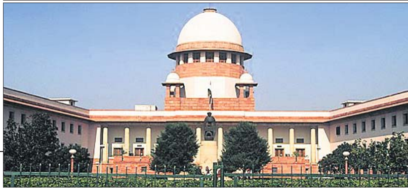
କୁମାରୀ ମା' ବି କରାଇପାରିବେ ସୁରକ୍ଷିତ ଗର୍ଭପାତ

ଖଣ୍ଡପୀଠ କହିଛନ୍ତି। ଗର୍ଭପାତ ଆଇନରେ ବଳାକ୍ରୀର ସଞ୍ଚା ବୈବାହିକ ବଳାକ୍ରୀରେ ସାମିଲ ହେବା ଜରୁରୀ ବୋଲି ଅଦାଲତ କହିଛନ୍ତି। ଗର୍ଭପାତ ଆଇନରେ ବିବାହିତ ଓ ଅବିବାହିତ ମହିଳାଙ୍କ ମଧ୍ୟରେ ପ୍ରାର୍ଥନା ଦେଖିବା କୃତ୍ରିମ ଏବଂ ଏହା ସମ୍ଭାବନାରେ ରୁହେଁ। କେବଳ ବିବାହିତ ମହିଳା ଯୌନକ୍ରିୟାରେ ସକ୍ରିୟ ରହିବେ ବୋଲି ଏକ ଭ୍ରାନ୍ତ ଧାରଣା ଦୀର୍ଘଦିନରୁ ରହିଆସିଥିବା ଖଣ୍ଡପୀଠ କହିଛନ୍ତି। ଅବିବାହିତ ଗର୍ଭଧାରଣର ପରିଣତି ମହିଳାଙ୍କ ଶରୀର ଓ ମନ ଉପରେ ଯେଉଁ ପ୍ରଭାବ ପକାଇଥାଏ, ତାହାକୁ ଅଣବେକ୍ଷା କରାଯାଇପାରିବ ନାହିଁ। ଏମ୍ବ୍ରିଓ