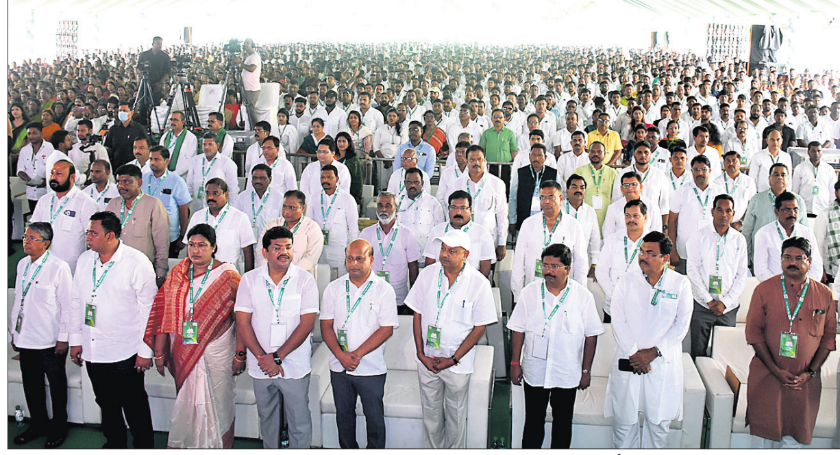
ବିଜେଡି ପଦଯାତ୍ରା ପ୍ରସ୍ତୁତି ସମାବେଶରେ ଯୋଗଦେଇଥିବା ମନ୍ତ୍ରୀ, ନେତା ଓ କର୍ମୀ ।