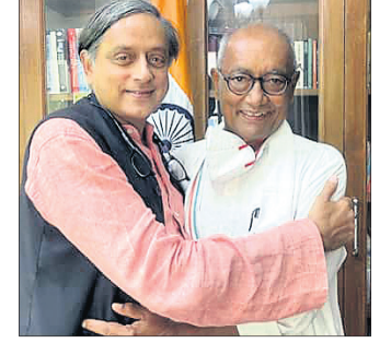
ତାଙ୍କର ଏହି ଗୁଣଗୁଣ ଦିଗ୍‌ବିଜୟ ରିଭୁଲ୍ଟ କରି ସେ ଥରୁରଙ୍କ ସହ ଏକମତ ବୋଲି କହିଛନ୍ତି। ଉଭୟେ ବାମ୍ନା-ନେହେରୁ ଆଦର୍ଶରେ ବିଶ୍ୱାସୀ।

ନୂଆଦିଲ୍ଲୀ, ୨୯।୯: କଂଗ୍ରେସ ଅଧକ୍ଷ ନିର୍ବାଚନରେ ବରିଷ୍ଠ ନେତା ଶଶୀ ଥରୁର ଏବଂ ଦିଗ୍‌ବିଜୟ ସିଂ ପ୍ରାର୍ଥୀ ହେବାକୁ ଯାଉଥିବାବେଳେ ସେମାନେ ଗୁରୁବାର ପରସ୍ପରକୁ ଭେଟି ଆଗାମୀ ନିର୍ବାଚନ ପାଇଁ ଶୁଭେଚ୍ଛା ଜଣାଇଛନ୍ତି।