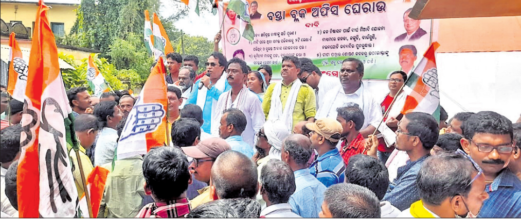
ପ୍ରତିବାଦ ସଭାରେ ଜିଲ୍ଲା ସଭାପତି ଉଦ୍‌ବୋଧନ ଦେଉଛନ୍ତି।