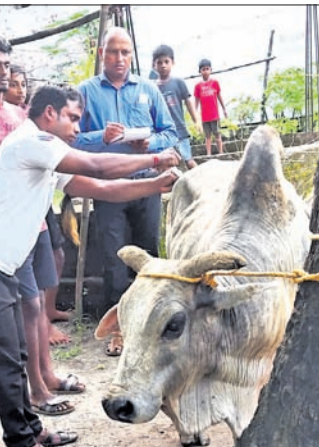
ଏକ ଷଷ୍ଠୀ ଚିକା ଦିଆଯାଉଛି।

ଗ୍ରାମାନ୍ତରରେ ବୁଲୁ ଷଷ୍ଠୀଚିକାକର କେହି ମାଲିକ ନ ଥାନ୍ତି କି ରହିବା ପାଇଁ ଗୃହୀଣ ନ ଥାଏ। ରୋଗର ଚିକାକର ହେଲେ କେହି ଚିକିତ୍ସା ମଧ୍ୟ କରି ନ ଥାନ୍ତି। ଅନେକ ସମୟରେ ସଂକ୍ରାମକ ରୋଗର ଚିକାକର ହୋଇ ଚିକିତ୍ସା ଆଭାବରୁ ଷଷ୍ଠୀଚିକାକର ପଡ଼ିଥାନ୍ତି।