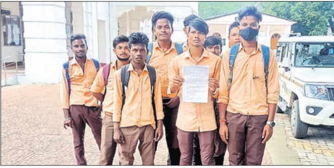
ଜିଲ୍ଲାପାଳଙ୍କୁ ସମସ୍ୟା ସମ୍ପର୍କରେ ଅଭିଯୋଗ କରିବାକୁ ଆସିଥିବା ଛାତ୍ରମାନେ।