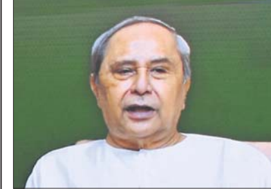
ସବିଶେଷ ରିପୋର୍ଟ: ପୃଷ୍ଠା-୩