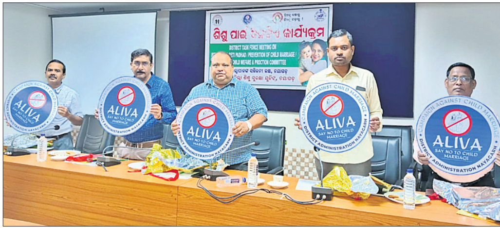
ଶିଶୁଙ୍କ ପାଇଁ ଦିନଟିଏ କାର୍ଯ୍ୟକ୍ରମରେ ଯୋଗ ଦେଇଥିବା ଅତିଥି ।

ନୟାଗଡ଼ ଜିଲ୍ଲା ଶିଶୁ ମଙ୍ଗଳ ଓ ପୁରୁଣା କମିଟି, ମିଶନ ବାସଲ୍ୟ ଓ ଜିଲ୍ଲାପ୍ରଧାନ ଚାଷ ଯୋଗ୍ୟ କମିଟି ପକ୍ଷରୁ ମିଳିତ ଭାବେ ଶିଶୁଙ୍କ ପାଇଁ ଦିନଟିଏ କାର୍ଯ୍ୟକ୍ରମ ନୟାଗଡ଼ ବ୍ଲକ ସମିତି ନିର୍ବାହକ କକ୍ଷରେ ରୁକୁବାର ଅନୁଷ୍ଠିତ ହୋଇଯାଇଛି ।