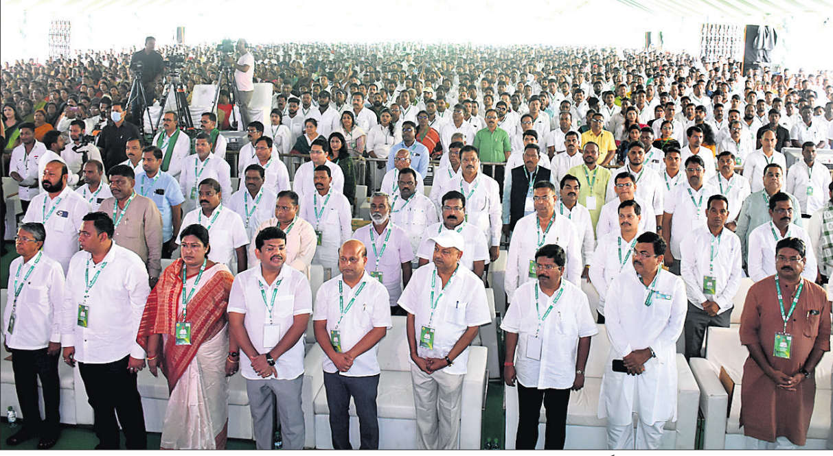
ବିଜେଡି ପଦଯାତ୍ରା ପ୍ରସ୍ତୁତି ସମାବେଶରେ ଯୋଗଦେଇଥିବା ମନ୍ତ୍ରୀ, ନେତା ଓ କର୍ମୀ ।