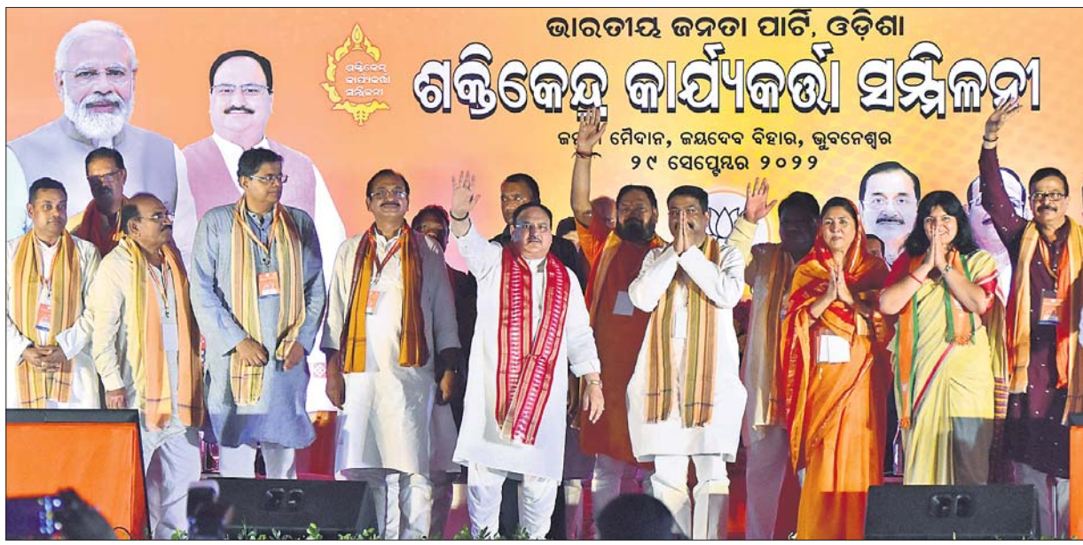
ଭୁବନେଶ୍ୱରର କନତା ମଇଦାନଠାରେ ଭାଜପା ଶକ୍ତିକେନ୍ଦ୍ର କାର୍ଯ୍ୟକର୍ତ୍ତା ସମ୍ମିଳନୀରେ ରାଷ୍ଟ୍ରୀୟ ଅଧ୍ୟକ୍ଷ ଜେ.ପି.ନକ୍ଷା ଓ ଅନ୍ୟ ନେତୃତ୍ୱ।