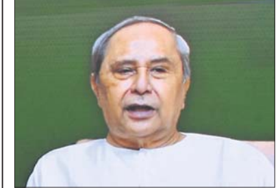
ସବିଶେଷ ରିପୋର୍ଟ: ପୃଷ୍ଠା-୩