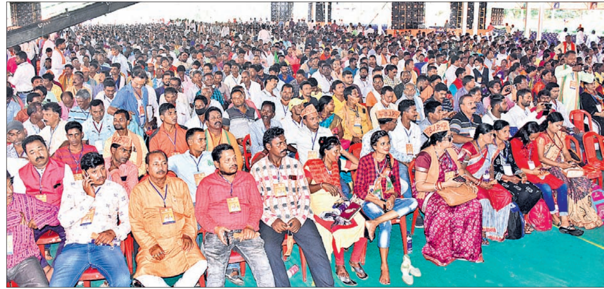
ଜନତା ମଇଦାନଠାରେ ଭାଜପାର ଶକ୍ତିକେନ୍ଦ୍ର ସମ୍ମିଳନୀରେ ଯୋଗଦେଇଥିବା ବିଜେଡି ପ୍ରମୁଖମାନେ ।