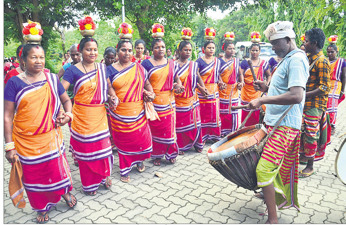
ଭାଜପା ରାଷ୍ଟ୍ରୀୟ ଅଧ୍ୟକ୍ଷ ଜେ.ପି. ନନ୍ଦାଙ୍କୁ ଓଡ଼ିଶାର ଲୋକନୃତ୍ୟ ମାଧ୍ୟମରେ ସ୍ୱାଗତ କରାଯାଇଛି ।