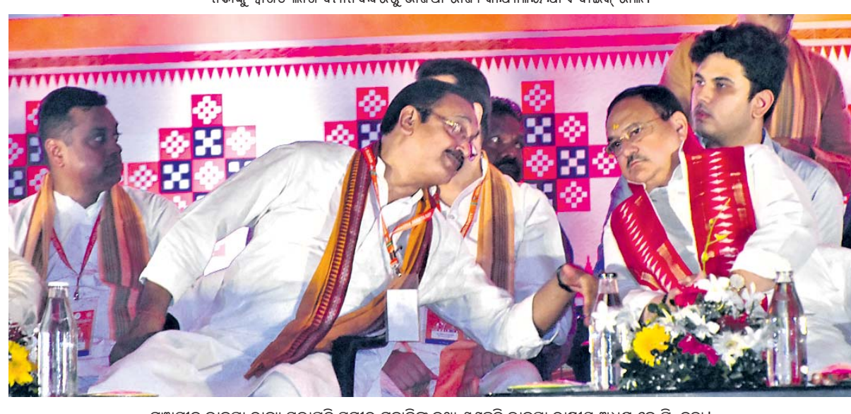
ମହାସାଥୀ ଭାଜପା ରାଜ୍ୟ ସଭାପତି ସମୀର ମହାନ୍ତିଙ୍କ କଥା ଶୁଣୁଛନ୍ତି ଭାଜପା ରାଷ୍ଟ୍ରୀୟ ଅଧ୍ୟକ୍ଷ ଜେ.ପି. ନନ୍ଦା ।