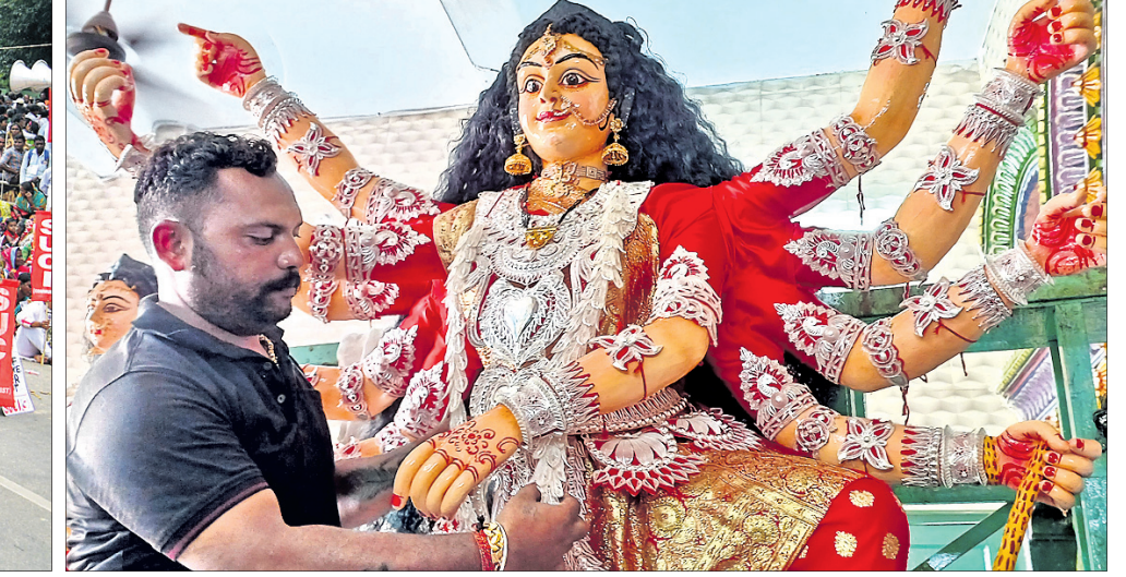
କଟକ ସେଖ୍ ବଜାର ପୂଜାମଣ୍ଡପରେ ଜଣେ ଶିଳ୍ପୀ ମା' ଦୁର୍ଗାଙ୍କ ମୂର୍ତ୍ତୀ ପ୍ରତିମାରେ ହାତ ଓ ସୁନା ଅଳଙ୍କାର ପିନ୍ଧାଉଛନ୍ତି।