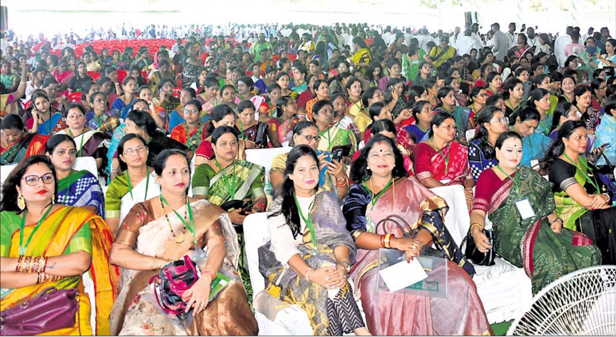
ବିଜେଡିର ପଦଯାତ୍ରା ପ୍ରସ୍ତୁତି ସମାବେଶରେ ଉପସ୍ଥିତ ନହିଲା ନେତ୍ରୀ ଓ କର୍ମୀ ।