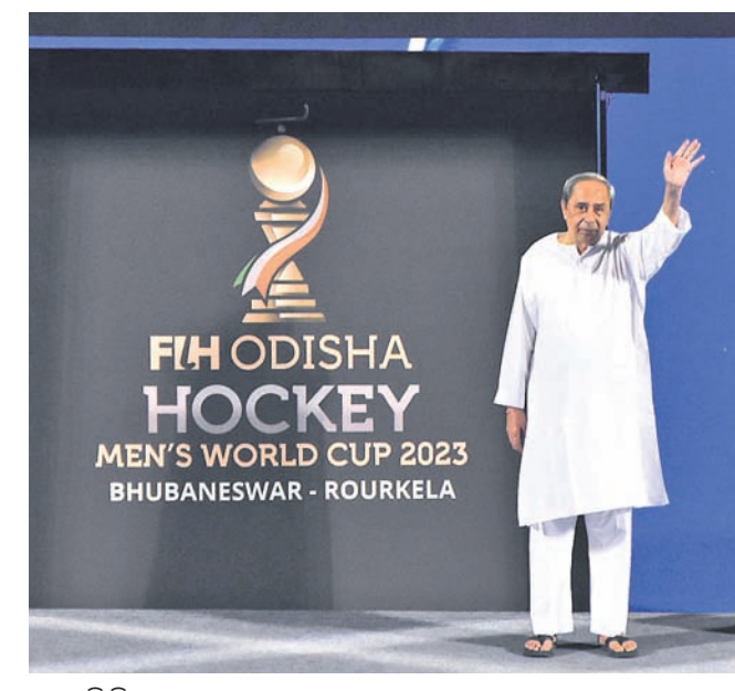
ହକି ବିଶ୍ୱକପ୍ ଲୋଗୋ ଉନ୍ମୋଚନ ଅବସରରେ ପୁଞ୍ଜାମନ୍ତ୍ରୀ ନବୀନ ପଟ୍ଟନାୟକ।

ଦଳ ୪୫ ଥର ଅଧିକାର କରିଥିଲା। ଫଳରେ ଭାରତୀୟ ହକିର ଦୃତଗତିର ବେଗକୁ କହିଲେ ଭୁଲ ହେବନାହିଁ। ଓଡ଼ିଶାରେ ଲାଗାତର ଅନ୍ତର୍ଜାତୀୟ ହକି ପ୍ରତିଯୋଗିତା ଆୟୋଜନ ହେଉଥିବାରୁ ଅନ୍ୟ କେତେକ ରାଜ୍ୟ ଛାଡ଼ି ପୋଷଣ କରୁଛନ୍ତି। ଏପରି କି କେତେକ ଯୁବପିଠା ରାଷ୍ଟ୍ର ଓଡ଼ିଶାରେ କ୍ରୀଡ଼ାଗତ ବୃତ୍ତୀୟ ଥର ବିଶ୍ୱକପ୍ ଆୟୋଜନକୁ ସମାଲୋଚନା କରିଛନ୍ତି। ମାତ୍ର ଅନ୍ତର୍ଜାତୀୟ ହକି ମହାସଂଘ ଏପରି ବିରୋଧକୁ ଚତୁରତାର ସହ ମୁକାବିଲା କରି ପ୍ରତିବନ୍ଧକକୁ ଏତାଇ ଦେଇଛନ୍ତି। ସୁନ୍ଦରଗଡ଼ଠାରେ ବିଶ୍ୱପ୍ରସାରୀ ବିଦ୍ୟା ପୁଣ୍ୟ ହକି ଷ୍ଟାଡିୟମ ନିର୍ମାଣ କାର୍ଯ୍ୟ ଶେଷ ପର୍ଯ୍ୟାୟରେ ପହଞ୍ଚିଛି। ସେଠାରେ ଯେପରି ଅନ୍ତର୍ଜାତୀୟ ସ୍ତରର ସମଗ୍ର ସୁବିଧା ସୁଯୋଗ ଉପଲବ୍ଧ ହେବ ଏବଂ ଓଡ଼ିଶାର ସମ୍ମାନ ଯେପରି ଅସ୍ପଷ୍ଟ ରହିବ ସେଥିପ୍ରତି ସର୍ବଦା ଦୃଷ୍ଟି ରଖା ଯାଉଛି। ଗୁରୁତ୍ୱପୂର୍ଣ୍ଣ କଥା ହେଲା ଭାରତ ଯଦି କୌଣସି ବର୍ଗର ଅନ୍ତର୍ଜାତୀୟ ହକି ଟୁର୍ନାମେଣ୍ଟ ଆୟୋଜନ କରିବାର ସୁଯୋଗ ପାଇଛି ତେବେ ଅନ୍ୟ ସମଗ୍ର ରାଜ୍ୟକୁ ପଛରେ ପକାଇ ଓଡ଼ିଶା ପ୍ରଥମ ପଦ ସ୍ୱତନ୍ତ୍ର ହେଉଛି। ଅନ୍ତର୍ଜାତୀୟ ସ୍ତରର ଭିଜିଭୁମି, ଅତିଥିମାନଙ୍କୁ ଭବ୍ୟ ସ୍ୱାଗତ, ପ୍ରାୟୋଜକଙ୍କ ଆଗ୍ରହ, ଷ୍ଟାଡିୟମରେ ଭରପୂର ଦର୍ଶକ ସମଗ୍ରକୁ ଆକର୍ଷଣ କରିଛି। ଅନେକ ପୂର୍ବତନ ଅନ୍ତର୍ଜାତୀୟ ହକି ଖେଳାଳି ଓଡ଼ିଶାକୁ ଭ୍ରମଣ ପ୍ରଶଂସା କରିଛନ୍ତି। ପ୍ରାୟୋଜକଙ୍କୁ ନେଇ ଆମ ପାରମ୍ପରିକ ଖେଳ ହକି ସକ୍ଷମରେ ପଢ଼ିଥିବାବେଳେ ଓଡ଼ିଶା ସରକାରଙ୍କ ସମର୍ଥନ ଯୋଗୁ ଏବେ ପୁଣି ଉତ୍ତ୍ୱାପାନ