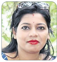
ସୁପ୍ରିମକୋର୍ଟର ଏହି ରାୟକୁ ପ୍ରଗତିଶୀଳ ରାୟ ବୋଲି ଆମେ କହି ପାରିବା। କାରଣ ଆଗରୁ ମହିଳାମାନେ ଆଇନ ଅନୁଯାୟୀ ଗର୍ଭପାତ କରୁଥିଲେ। କିନ୍ତୁ ଏବେ ଏହା ଅବିବାହିତା ଓ ନାବାଳିକା ଏବଂ ବିବାହିତ ମହିଳାଙ୍କ ପାଇଁ ଗର୍ଭପାତକୁ ଆଇନ ଅନୁଯାୟୀ ସ୍ୱୀକୃତି ମିଳିଛି। ଏହାକୁ ଯଦି ଆମେ ଚର୍ଚ୍ଚନା କରିବା ତାହେଲେ ଭଲ ଏବଂ ଖରାପ ଦୁଇଟି ଦିଗ ସାମାନ୍ୟ ଆସୁଛି। ଯେମିତି କି ଭଲ ଦିଗଟି ହେଲା। ବେଳେ ବେଳେ ପରିସ୍ଥିତି ଏମିତି ହୁଏ ଯେ ଅବିବାହିତ ଝିଅଟିଏ ଅସହାୟ ଅବସ୍ଥାରେ ପହଞ୍ଚି ଯାଇଥାଏ। ଗର୍ଭପାତ ବେଆଇନ ଥିବା ଯୋଗୁଁ ତାକୁ ଅନେକ ଶୋଷଣର ଶିକାର ହେବାକୁ ପଡୁଥିଲା। ଏବେ ଆଉ ସେହି ସମସ୍ୟା ସମ୍ମୁଖୀନ କରିବାକୁ ପଡ଼ିବ ନାହିଁ। ଆଉ ଖରାପ ପ୍ରଭାବ ହେଲା। ଯେଉଁମାନେ ଲିଭି ଇନ୍ ସମ୍ପର୍କରେ ରହିଛନ୍ତି ସେ ଝିଅମାନେ ଶାରୀରିକ ସମ୍ପର୍କ ରଖିବାପରେ ବାରମ୍ବାର ଯଦି ଗର୍ଭପାତ କରାଇବେ ତାହେଲେ ସେମାନଙ୍କ ଶରୀର ଉପରେ କୁପ୍ରଭାବ ନିଶ୍ଚିତ ପଡ଼ିବ। ଗୁରୁତ୍ୱପୂର୍ଣ୍ଣ କଥା ହେଉଛି ସ୍ୱାକ୍ଷର ବିନା ଅନୁମତିରେ ଯଦି ସ୍ୱାମୀ ଶାରୀରିକ