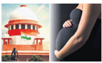
ସୁପ୍ରିମକୋର୍ଟର ରାୟ ବୋଲି ଆମେ କହି ପାରିବା। କାରଣ ଆଗରୁ ମହିଳାମାନେ ଆଇନ ଅନୁଯାୟୀ ଗର୍ଭପାତ କରୁଥିଲେ। କିନ୍ତୁ ଏବେ ଏହା ଅବିବାହିତା ଓ ନାବାଳିକା ଏବଂ ବିବାହିତ ମହିଳାଙ୍କ ପାଇଁ ଗର୍ଭପାତକୁ ଆଇନ ଅନୁଯାୟୀ ସ୍ୱୀକୃତି ମିଳିଛି। ଏହାକୁ ଯଦି ଆମେ ଚର୍ଚ୍ଚନା କରିବା ତାହେଲେ ଭଲ ଏବଂ ଖରାପ ଦୁଇଟି ଦିଗ ସାମାନ୍ୟ ଆସୁଛି। ଯେମିତି କି ଭଲ ଦିଗଟି ହେଲା। ବେଳେ ବେଳେ ପରିସ୍ଥିତି ଏମିତି ହୁଏ ଯେ ଅବିବାହିତ ଝିଅଟିଏ ଅସହାୟ ଅବସ୍ଥାରେ ପହଞ୍ଚି ଯାଇଥାଏ। ଗର୍ଭପାତ ବେଆଇନ ଥିବା ଯୋଗୁଁ ତାକୁ ଅନେକ ଶୋଷଣର ଶିକାର ହେବାକୁ ପଡୁଥିଲା। ଏବେ ଆଉ ସେହି ସମସ୍ୟା ସମ୍ମୁଖୀନ କରିବାକୁ ପଡ଼ିବ ନାହିଁ। ଆଉ ଖରାପ ପ୍ରଭାବ ହେଲା। ଯେଉଁମାନେ ଲିଭି ଇନ୍ ସମ୍ପର୍କରେ ରହିଛନ୍ତି ସେ ଝିଅମାନେ ଶାରୀରିକ ସମ୍ପର୍କ ରଖିବାପରେ ବାରମ୍ବାର ଯଦି ଗର୍ଭପାତ କରାଇବେ ତାହେଲେ ସେମାନଙ୍କ ଶରୀର ଉପରେ କୁପ୍ରଭାବ ନିଶ୍ଚିତ ପଡ଼ିବ। ଗୁରୁତ୍ୱପୂର୍ଣ୍ଣ କଥା ହେଉଛି ସ୍ୱାକ୍ଷର ବିନା ଅନୁମତିରେ ଯଦି ସ୍ୱାମୀ ଶାରୀରିକ

ମେଡିକାଲ ଚର୍ଚ୍ଚନେଶନ ଅଫ୍ ପ୍ରୋଗ୍ରାଫି (ଏମ୍‌ପିଫି) ଆକ୍ଟ-୧୯୭୧ରେ ମହିଳାମାନଙ୍କୁ ଆଇନଗତ ଗର୍ଭପାତ ପାଇଁ ଅଧିକାର ଦିଆଯାଇଛି। ହେଲେ ଏବେ ଦେଶର ସର୍ବୋଚ୍ଚ ଅଧିକାରୀ କେବଳ କହିଛନ୍ତି ବିବାହିତ ଓ ଅବିବାହିତ ମହିଳାଙ୍କ ମଧ୍ୟରେ ପାର୍ଥକ୍ୟ କରିପାରିବା ନାହିଁ। ପୂର୍ବରୁ କେହି ଅବିବାହିତା ଗର୍ଭପାତ କରିବାକୁ ଗଲାବେଳେ ବହୁ ଅସୁବିଧାର ସମ୍ମୁଖୀନ ହେଉଥିଲେ। ନିଜ ପରିଚୟ ଲୁଚାଇବା ସହିତ ବିଭିନ୍ନ ପ୍ରକାର ତଥ୍ୟ ଭୁଲ ଦେବାକୁ ପଡୁଥିଲା। ଏପରିକି ସେମାନେ ଦକ୍ଷ ନ ଥିବା ସ୍ୱାସ୍ଥ୍ୟକର୍ମୀଙ୍କ ପାଖକୁ ଯାଇ ଗର୍ଭପାତ କରୁଥିଲେ। ଫଳରେ ସେମାନଙ୍କ ସ୍ୱାସ୍ଥ୍ୟ ଉପରେ କୁପ୍ରଭାବ ପକାଉଥିଲା। ଏହି ଦିଗକୁ ଦେଖିଲେ ସୁପ୍ରିମକୋର୍ଟ ଦେଖିଥିବା ରାୟ ସ୍ୱାଗତଯୋଗ୍ୟ। କିନ୍ତୁ ସାମାଜିକ ଦୃଷ୍ଟିରେ ଏହାର କୁପ୍ରଭାବ ପଡ଼ିବ, ସାହାଜି ଆଗାମୀ ୫ବର୍ଷ ପରେ ଜଣାପଡ଼ିବ। ସୁପ୍ରିମକୋର୍ଟ ରାୟକୁ ସମ୍ମାନ ଦେବା। କିନ୍ତୁ ସବୁ ରାୟ ଯେ, ସମାଜ ପାଇଁ ଭଲ ହେବ ତାହା ଭାବିବା ଉଚିତ୍ ନୁହେଁ। ବିବାହିତ ଓ ଅବିବାହିତା ମହିଳାଙ୍କ ମଧ୍ୟରେ ପାର୍ଥକ୍ୟ ନାହିଁ କଥାକୁ ମୁଁ ସମ୍ମାନ ଜଣାଉଛି। କିନ୍ତୁ ବିବାହିତ ମହିଳାମାନଙ୍କ ଯେଉଁ ଅଧିକାର ଅଛି ତାହା ସମ୍ପୂର୍ଣ୍ଣତା ହେଉଯାଉଥିବାବେଳେ ଅବିବାହିତ ମହିଳାଙ୍କ ଅଧିକାର ବଢ଼ିବାରେ ଲାଗିଛି। ବର୍ତ୍ତମାନ ଆଇନ ହୋଇଗଲେ ଅବିବାହିତମାନେ ଆଉ ତରିବେ ନାହିଁ। ନିଜ ଅଧିକାର ଅଛି ବୋଲି ଗର୍ଭପାତ କରିବାକୁ ବାରମ୍ବାର ଗର୍ଭପାତ କଲେ ଭବିଷ୍ୟତରେ ତାଙ୍କ ସ୍ୱାସ୍ଥ୍ୟପ୍ରତି ବହୁ କ୍ଷତି ହେବ। କିନ୍ତୁ ନାବାଳିକା ଗର୍ଭବତୀ କିମ୍ବା