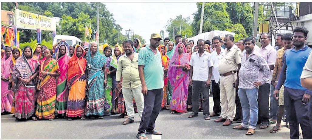
ଜବରଦଖଲ ଉଚ୍ଛେଦ ଦାବିରେ ଗ୍ରାମବାସୀ ପିରୁକୁଳି ବଜାର ସ୍ଥିତ ଜାତୀୟ ରାଜପଥ ଅବରୋଧ କରିଛନ୍ତି।