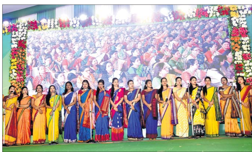
ବିଜେଡି ସମାବେଶରେ ସମବେତ ସଙ୍ଗୀତ ଗାନ ।