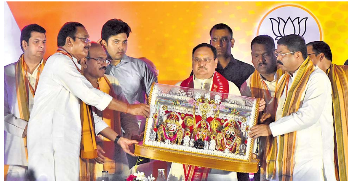
ଭାଜପା ରାଷ୍ଟ୍ରୀୟ ଅଧ୍ୟକ୍ଷ ଜେ.ପି. ନନ୍ଦାଙ୍କୁ ଜଗନ୍ନାଥଙ୍କ ଏକ ପ୍ରତିମୂର୍ତ୍ତି ପ୍ରଦାନ କରାଯାଇଛି ।