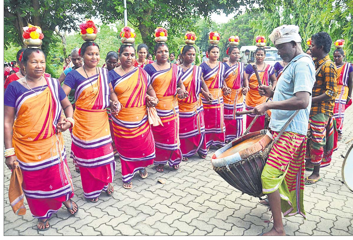
ଭାଜପା ରାଷ୍ଟ୍ରୀୟ ଅଧ୍ୟକ୍ଷ ଜେ.ପି. ନନ୍ଦାଙ୍କୁ ଓଡ଼ିଶାର ଲୋକନୃତ୍ୟ ମାଧ୍ୟମରେ ସ୍ୱାଗତ କରାଯାଇଛି ।