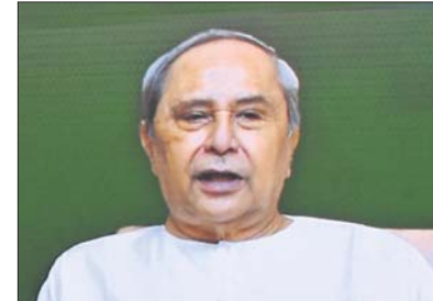
ସବିଶେଷ ରିପୋର୍ଟ: ପୃଷ୍ଠା-୩