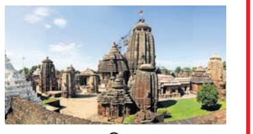
କଟକ ଅଫିସ୍, ୨୯/୯

ସରକାରୀ ଖାତାକୁ ହୋଇଥିବା ମହାପ୍ରଭୁ ଶ୍ରୀଲିଙ୍ଗରାଜଙ୍କ ଜମି ପୁଣି ମହାପ୍ରଭୁ ଖାତାକୁ ଫେରିଲା। ରାଜ୍ୟ ପର୍ଯ୍ୟବର ଗୁରୁବାର ନିର୍ଦ୍ଦେଶନାମା ଅନୁସାରେ ଭୁବନେଶ୍ୱରର ଶ୍ରୀଲିଙ୍ଗରାଜେ ଥିବା ମୋଟ ୧୪୨.୨୩ ଏକର ଜମି ସରକାରୀ ଖାତାକୁ ମୁକ୍ତ ଖାତାକୁ ଫେରିଥିବା ଜଣାଯାଇଛି। ଭୁବନେଶ୍ୱର ଯୁନିଟ୍-୨ରେ ୧୩.୬୯୪ ଏକର, ଭାମପୁର ଯୁନିଟ୍ ୨୨ରେ ୪୬.୯୯୭ ଏକର, କପିଳପ୍ରସାଦରେ ୪୩.୮୭୬ ଏକର, ରାଜାରାଣୀରେ ୬.୧୮୧ ଏକର, ଚୌତମନଗରରେ ୩୦.୬୪୨ ଏକର ଓ ହରିପୁରପାଟଣାରେ ୦.୬୪ ଏକର ଜମି ଅଟୁଥିଲା। ଜମିଦାରୀ ଉତ୍ତେଜ ଆଇନର ଧାରା ୬(କ) ଆଧାରରେ ମହାପ୍ରଭୁ ଶ୍ରୀଲିଙ୍ଗରାଜ ମନ୍ଦିର ପ୍ରଶାସନର ଚରକାଳୀନ ନିର୍ବାହୀ ଅଧିକାରୀ ୧୯୯୧ ଜୁନ୍ ୨୮ରେ ଏ ସଂକ୍ରାନ୍ତରେ ରାଜ୍ୟ ପର୍ଯ୍ୟବର ରେକର୍ଡ୍ ସଂଶୋଧନ ନିମନ୍ତେ ଆବେଦନ କରିଥିଲେ। ଭୁବନେଶ୍ୱର ତହସିଲ ଓ ଶ୍ରୀଲିଙ୍ଗରାଜ ମନ୍ଦିର କର୍ତ୍ତୃପକ୍ଷଙ୍କ ଦ୍ୱାରା ଯୁକ୍ତ ଭାବେ ତଦନ୍ତ ଆବେଦନ କରିଥିଲେ। ଭୁବନେଶ୍ୱର କୋର୍ଟରୁ ରିପୋର୍ଟ ଉପରେ ଖୋର୍ଦ୍ଧା ଜିଲ୍ଲାପାଳ ସଂଶୋଧନ ନିମନ୍ତେ ସରକାରଙ୍କୁ ପ୍ରଦାନ କରିଥିଲେ। ଗୁରୁବାର ମାମଲାର ତୃତୀୟ ରାୟ ପ୍ରକାଶ ପାଇଛି।