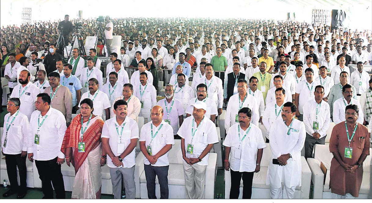
ବିଜେଡି ପଦଯାତ୍ରା ପ୍ରସ୍ତୁତି ସମାବେଶରେ ଯୋଗଦେଇଥିବା ମନ୍ତ୍ରୀ, ନେତା ଓ କର୍ମୀ ।

ଭୁବନେଶ୍ୱର, ଶୁକ୍ରବାର, ୩୦ ସେପ୍ଟେମ୍ବର, ୨୦୨୨