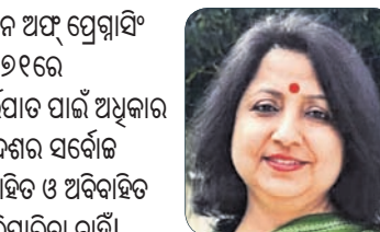
ସୁପ୍ରିମକୋର୍ଟର ଏହି ରାୟକୁ ପ୍ରଗତିଶୀଳ ରାୟ ବୋଲି ଆମେ କହି ପାରିବା। କାରଣ ଆଗରୁ ମହିଳାମାନେ ଆଇନ ଅନୁଯାୟୀ ଗର୍ଭପାତ କରୁଥିଲେ। କିନ୍ତୁ ଏବେ ଏହା ଅବିବାହିତା ଓ ନାବାଳିକା ଏବଂ ବିବାହିତ ମହିଳାଙ୍କ ପାଇଁ ଗର୍ଭପାତକୁ ଆଇନ ଅନୁଯାୟୀ ସ୍ୱୀକୃତି ମିଳିଛି। ଏହାକୁ ଯଦି ଆମେ ଚର୍ଚ୍ଚନା କରିବା ତାହେଲେ ଭଲ ଏବଂ ଖରାପ ଦୁଇଟି ଦିଗ ସାମାନ୍ୟ ଆସୁଛି। ଯେମିତି କି ଭଲ ଦିଗଟି ହେଲା। ବେଳେ ବେଳେ ପରିସ୍ଥିତି ଏମିତି ହୁଏ ଯେ ଅବିବାହିତ ଝିଅଟିଏ ଅସହାୟ ଅବସ୍ଥାରେ ପହଞ୍ଚି ଯାଇଥାଏ। ଗର୍ଭପାତ ବେଆଇନ ଥିବା ଯୋଗୁଁ ତାକୁ ଅନେକ ଶୋଷଣର ଶିକାର ହେବାକୁ ପଡୁଥିଲା। ଏବେ ଆଉ ସେହି ସମସ୍ୟା ସମ୍ମୁଖୀନ କରିବାକୁ ପଡ଼ିବ ନାହିଁ। ଆଉ ଖରାପ ପ୍ରଭାବ ହେଲା। ଯେଉଁମାନେ ଲିଭି ଇନ୍ ସମ୍ପର୍କରେ ରହିଛନ୍ତି ସେ ଝିଅମାନେ ଶାରୀରିକ ସମ୍ପର୍କ ରଖିବାପରେ ବାରମ୍ବାର ଯଦି ଗର୍ଭପାତ କରାଇବେ ତାହେଲେ ସେମାନଙ୍କ ଶରୀର ଉପରେ କୁପ୍ରଭାବ ନିଶ୍ଚିତ ପଡ଼ିବ। ଗୁରୁତ୍ୱପୂର୍ଣ୍ଣ କଥା ହେଉଛି ସ୍ୱାକ୍ଷର ବିନା ଅନୁମତିରେ ଯଦି ସ୍ୱାମୀ ଶାରୀରିକ