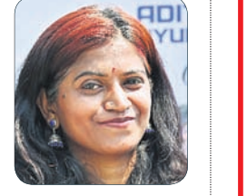
ସୁପ୍ରିମକୋର୍ଟଙ୍କ ରାୟ ସ୍ୱାଗତଯୋଗ୍ୟ। ସ୍ତଳ ବିଶେଷରେ ଏହାର ଆବଶ୍ୟକତା ରହିଛି। କିନ୍ତୁ ଏହାର ଗୁରୁତ୍ୱପୂର୍ଣ୍ଣତା କରା ନ ଯାଉ ଆଇନାଳିର ଯୁବପିଠି ଏହାକୁ ଗୁରୁତ୍ୱପୂର୍ଣ୍ଣତା ନ କରନ୍ତୁ। ନଚେତ୍ ଏହାର ପରିଣାମ ସମାଜ ଉପରେ କୁପ୍ରଭାବ ପକାଇବ। ତେଣୁ ଏହାକୁ ଲାଗୁ କରିବାକୁ ହେଲେ କିଛି ସର୍ତ୍ତାବଳୀ ନିୟମ ରଖାଯାଉ। ତାହା କିଛି କେସ ଷ୍ଟୁଡି ଆଉ କିଛି ତାତ୍ତ୍ୱଳ ନିୟମ ଅନ୍ୟ ବ୍ୟକ୍ତିବିଶେଷଙ୍କ ପରାମର୍ଶ ନେଇ କରାଯାଉ। ତେବେ ଯାଉ ଆମେ ଏହାକୁ ଠିକ୍ ବୋଲି କହିପାରିବା।

ସ୍ୱାଧୀନତା ଓ ସମନ୍ୱୟ କରିବା ଅଧିକାର ଅନୁସାରେ ସୁପ୍ରିମକୋର୍ଟଙ୍କ ଏହି ରାୟ ସ୍ୱାଗତଯୋଗ୍ୟ। ଅନେକ ସମୟରେ ଜଣେ ଝିଅ ବା ନାରୀ ଲଜ୍ଜା ନ ଥାଇ ଗର୍ଭଧାରଣ କରୁଥିଲେ ସୁଦ୍ଧା ଅସହାୟ ହୋଇ ଗର୍ଭପାତ କରିପାରୁ ନ ଥିଲେ। ଏହି ରାୟ ଦ୍ୱାରା ସେମାନଙ୍କୁ ଆଉ ଅସୁବିଧାର ସମ୍ମୁଖୀନ ହେବାକୁ ପଡ଼ିବ ନାହିଁ। ଏଥିପାଇଁ ଏକକ ଓ ଅବିବାହିତ ମହିଳାମାନେ ଏମ୍‌ପିଫି ଆଇନ ଓ ନିୟମ ଅନୁସାରେ ୨୪ ସପ୍ତାହ ମଧ୍ୟରେ ଗର୍ଭପାତ କରିପାରିବେ। କିନ୍ତୁ ଏହି ରାୟର ଖରାପ ପ୍ରଭାବ ମଧ୍ୟ ରହିଛି। ଏହାର ଅପବ୍ୟବହାର ହେଲେ ଅନେକ ନାବାଳିକା ଝିଅ ଏହାର ବେଶି ଶିକାର ହେବେ। ଆଗରୁ ଏହା ଦ୍ୱାରା ବନ୍ଦ କରାଯାଇଥିବା ଅନେକ ଛୋଟ ବଡ଼ କ୍ଲିନିକ ପୁଣି ଖୋଲିବ। ବେଆଇନ ଭାବେ ସେମାନଙ୍କ ପ୍ରାପୂର୍ତ୍ତ ବଡ଼ ଚାଲିବ। ତେଣୁ ଏସବୁକୁ ଦୃଷ୍ଟିରେ ରଖି ଏହାକୁ ଆୟତ୍ତ କରିବା ପାଇଁ ଏକ ପଦକ୍ଷେପ ନିଆଯିବା ଆବଶ୍ୟକ।