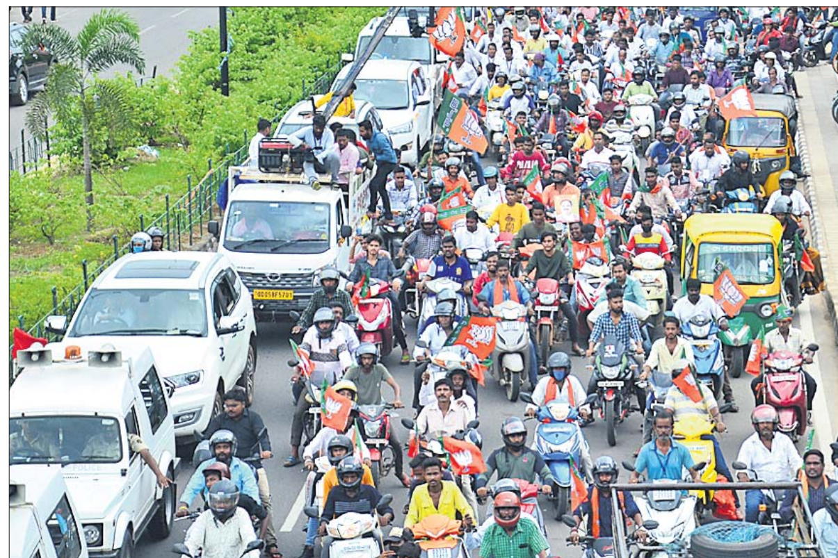
ନନ୍ଦାଙ୍କୁ ସ୍ୱାଗତ କରି ବିମାନବନ୍ଦରୁ ଭାଜପା ରାଜ୍ୟ କାର୍ଯ୍ୟକ୍ରମ ଯାଏ ବାଜଇ ରାଜି ।