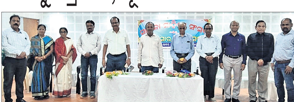
କଟକ ସାରଳା ଭବନରେ ଗୁରୁବାର ଅନୁଷ୍ଠିତ ବର୍ଷା ସାରସ୍ୱତ ଆସରରେ ଉପସ୍ଥିତ ଅତିଥି ଓ ଅନ୍ୟମାନେ।