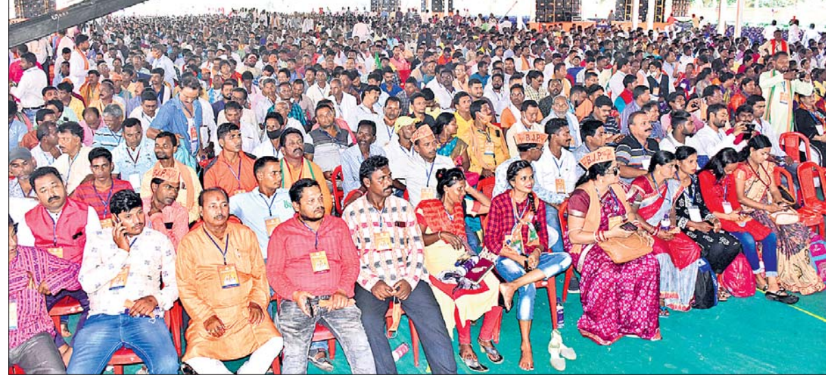
ଜନତା ମଇଦାନଠାରେ ଭାଜପାର ଶକ୍ତିକେନ୍ଦ୍ର ସମିତିଙ୍କଦ୍ୱାରା ଯୋଗଦେଇଥିବା ବିଭିନ୍ନ ପ୍ରସ୍ତୁତୀମାନେ ।