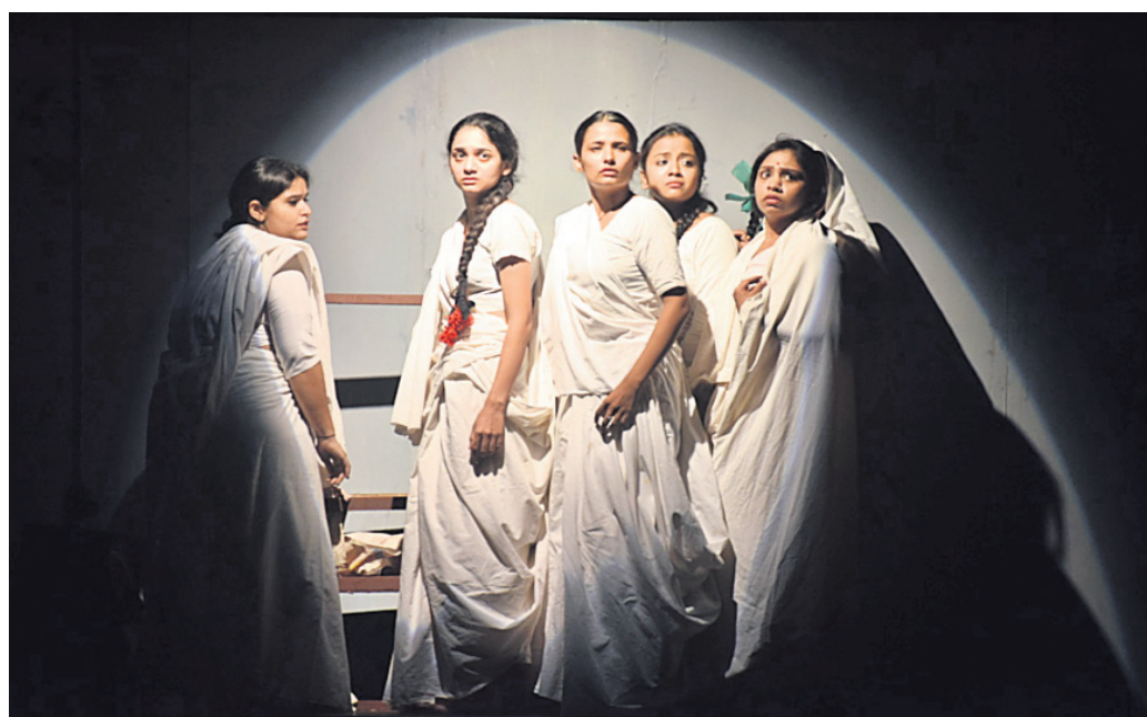
ଓଡ଼ିଶା ନାଟ୍ୟ ସଂଘ ପକ୍ଷରୁ ଭୁବନେଶ୍ୱର ରବୀନ୍ଦ୍ର ମଣ୍ଡପରେ ଚାଲିଥିବା ଜାତୀୟ ନାଟ୍ୟ ଉତ୍ସବରେ ଗୁରୁବାର ସନ୍ଧ୍ୟାରେ ପରିବେଷିତ ନାଟକ 'ଅଗନବତୀ'ର ଏକ ଦୃଶ୍ୟ।