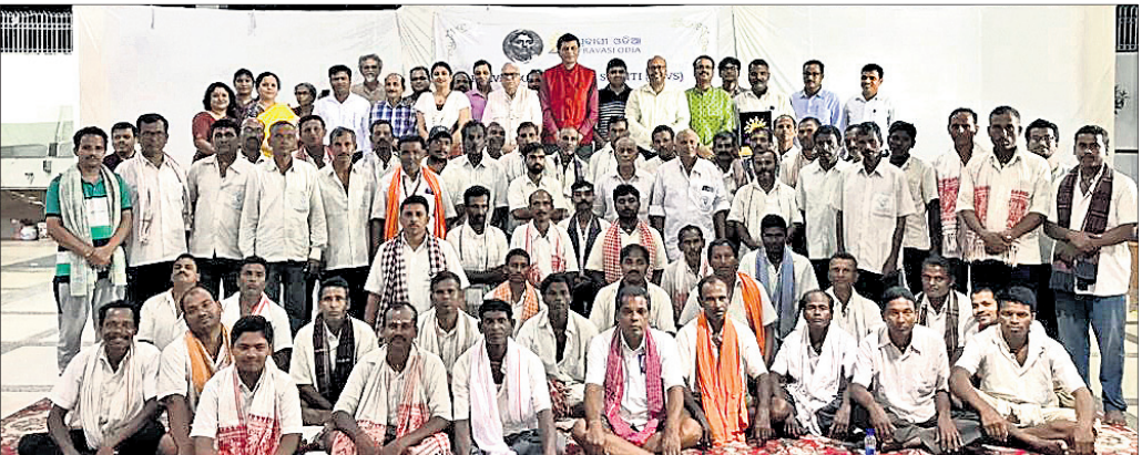
ସମ୍ବର୍ଦ୍ଧନା କାର୍ଯ୍ୟକ୍ରମରେ ଅତିଥିକ ଗହଣରେ ବାଘାଯତୀନ ସାଇକେଲ ଆରୋହୀମାନେ।