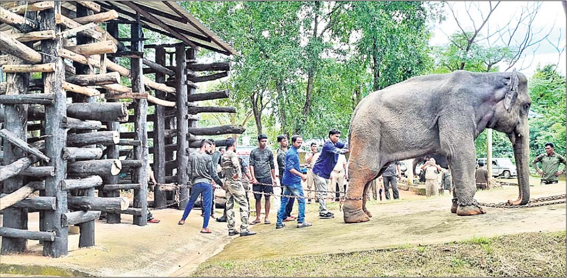
ହାତୀକୁ ଏଲିଫ୍ୟାଣ୍ଟ ରେସ୍‌କ୍ୟୁ ସେଣ୍ଟରରେ ଥିବା କ୍ରଲ ଭିତରକୁ ନିଆଯାଇଛି ।