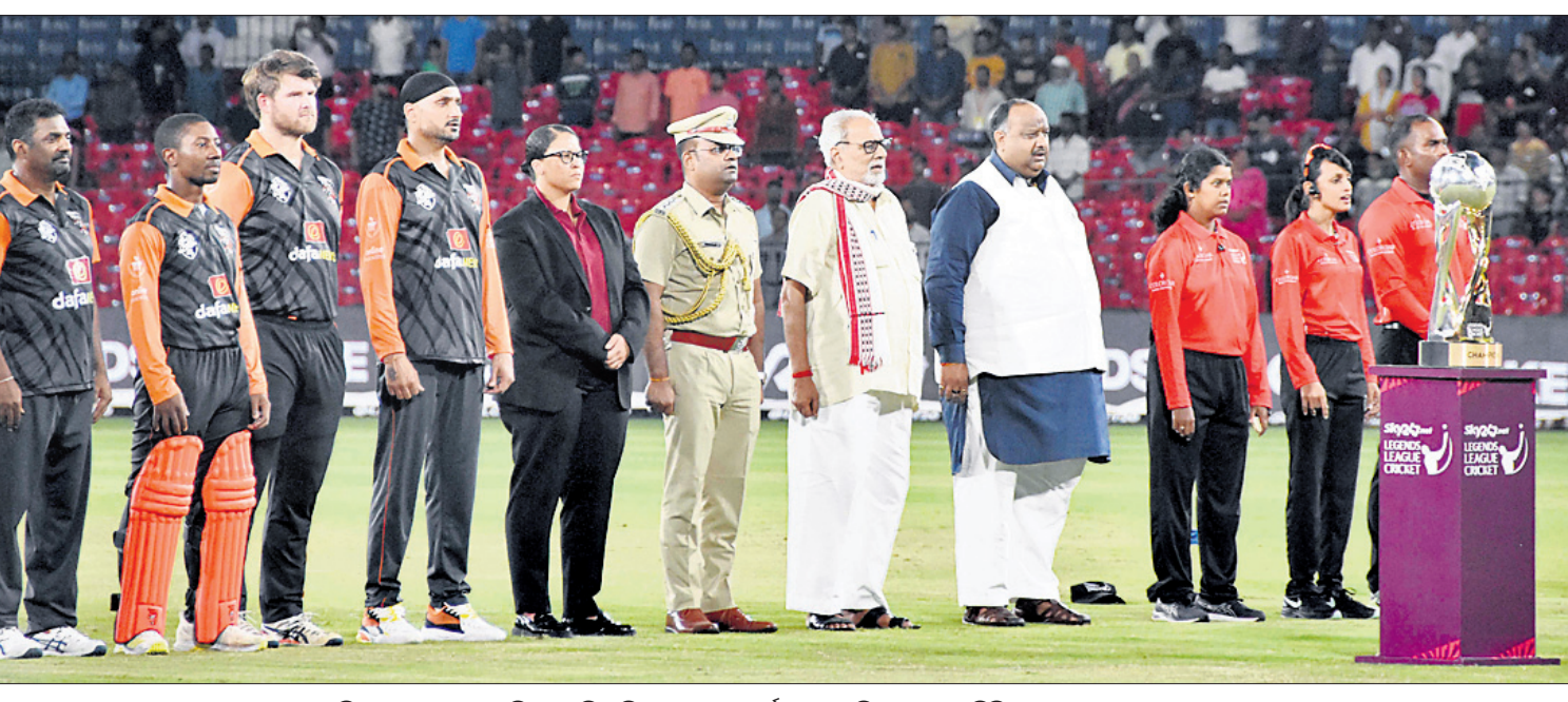
ବାରବାଟୀ ଷ୍ଟାଡ଼ିୟମରେ ଗୁରୁବାର ଲିଜେଣ୍ଡ ଲିଗ୍ ଟ୍ରଫିର ମ୍ୟାଚ ପୂର୍ବରୁ ଖେଳାଳି ଓ ଅନ୍ୟ ଅତିଥିଆଳଙ୍କ ସହ ରାଜ୍ୟପାଳ ଗଣେଶୀ ଲାଲ।