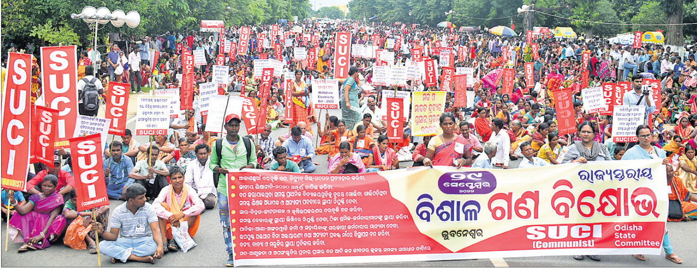
ଆକାଶପୁରା ବରବୁଦ୍ଧି ଓ ବିଦ୍ୟୁତ୍ ବିଲ୍ ପ୍ରତ୍ୟାହାର, ବେକାରଙ୍କୁ ସ୍ଥାୟୀ ନିଯୁକ୍ତି, ବିନା ଅଧିକାରରେ ବିପ୍ଳାବନ ବନ୍ଦ ଆଦି ବିଭିନ୍ନ ଦାବି ନେଇ ଏସ୍‌ସୁସିଆଇ ଓଡ଼ିଶା କମିଟି ପକ୍ଷରୁ ଭୁବନେଶ୍ୱର ଲୋୟର ପିଏମ୍‌ଜିରେ ଗୁରୁବାର ଅନୁଷ୍ଠିତ ଗଣବିକ୍ଷୋଭ।