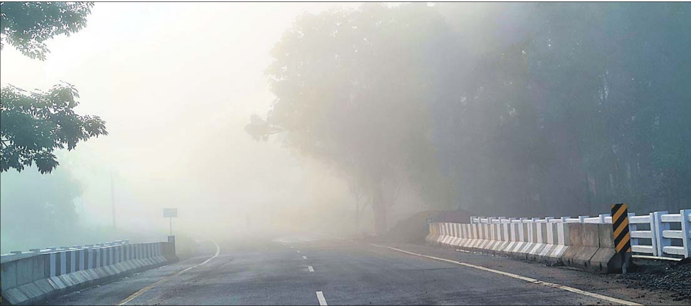
ଦାରିଙ୍ଗବାଡ଼ି ୫୯ନଂ ଜାତୀୟ ରାଜପଥରେ ଶୁକ୍ରବାର ପଡ଼ିଥିବା ଘନକୁହୁଡ଼ି।