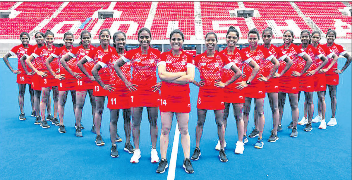
ଗୁଜରାଟରେ ଚାଲିଥିବା ଜାତୀୟ ଖ୍ରୀଡ଼ା ପାଇଁ ମନୋନୀତ ଓଡ଼ିଶା ମହିଳା ହକି ଦଳ।