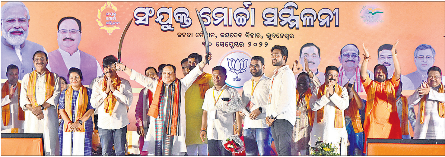
ଭୁବନେଶ୍ୱର ଜନତା ମଇଦାନରେ ଭାଜପା ପକ୍ଷରୁ ଅନୁଷ୍ଠିତ ସଂଯୁକ୍ତ ମୋର୍ଚ୍ଚା ସମ୍ମିଳନୀରେ ରାଷ୍ଟ୍ରୀୟ ଅଧ୍ୟକ୍ଷ ଜେ.ପି. ନନ୍ଦା ଓ ଅନ୍ୟ ନେତୃବୃନ୍ଦ