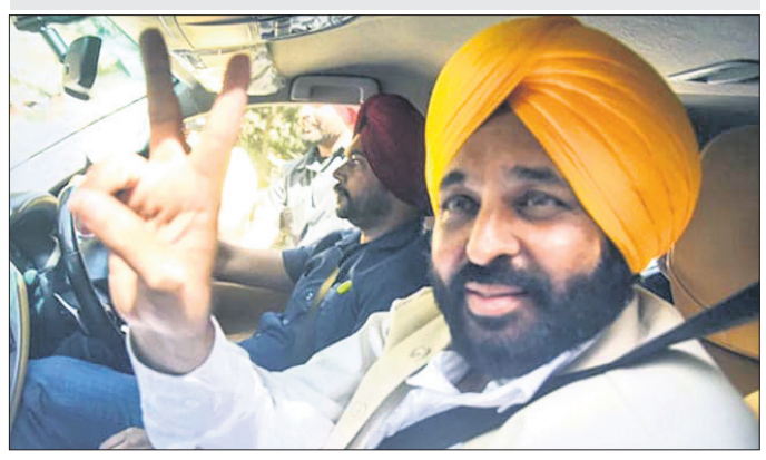
ପୁଣ୍ୟମନ୍ତ୍ରୀ ଭଗତ୍ ସିଂହ