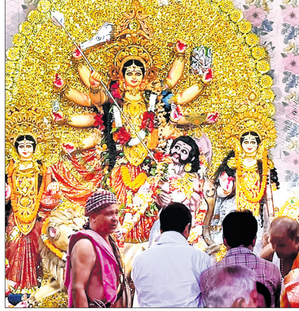
ବାହାନଗା ଗୋପାଳପୁର ବଜାର ।