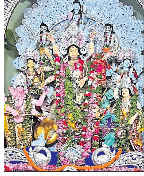
କେଶିକୁଣ୍ଡର ଆଦ୍ୟଦୁର୍ଗା ଦେବୀ ଅନୁଷ୍ଠାନର ଚାନ୍ଦିନେଇ ।