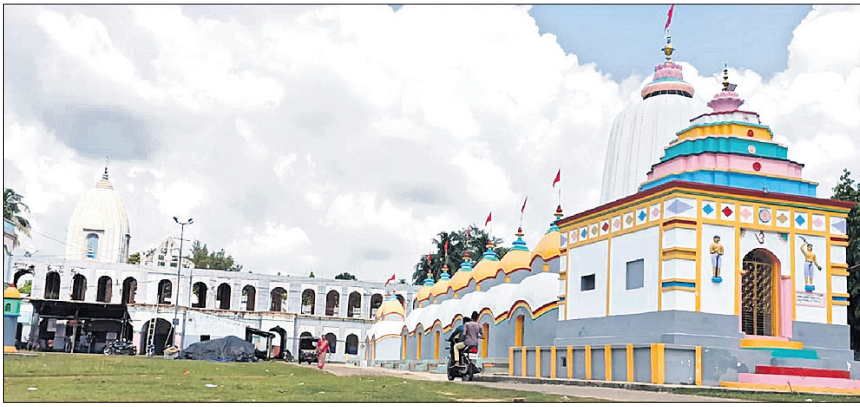
ଲକ୍ଷ୍ମଣନାଥଗଡ଼ ମା' ଦୁର୍ଗା ମନ୍ଦିର ।