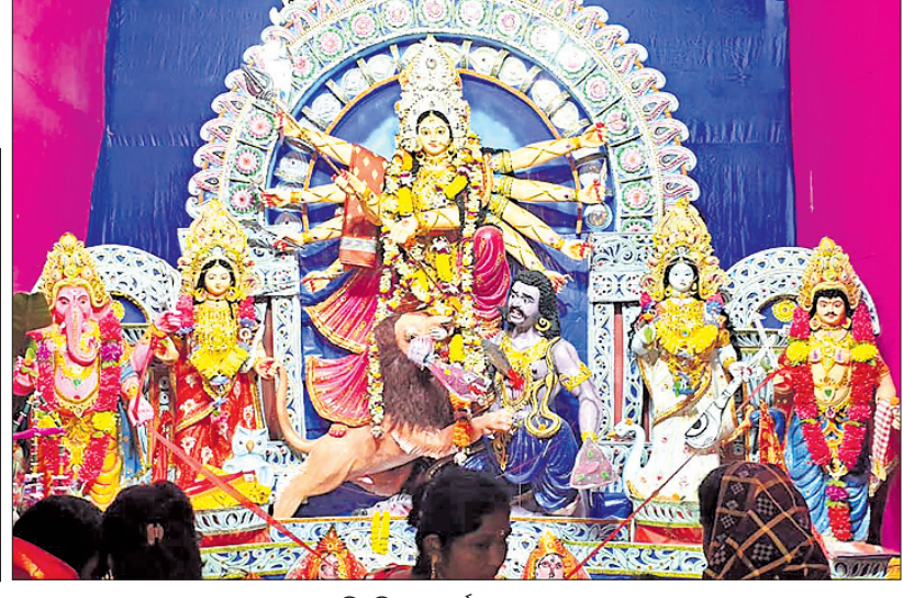
ବିଦୁଳିଆ ମାର୍କୋଣା ।