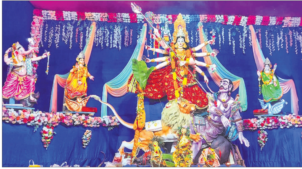
ମୟୂରଭଞ୍ଜ ଜିଲ୍ଲା ବାରିପଦାସ୍ଥିତ ମୟୂରନା ।