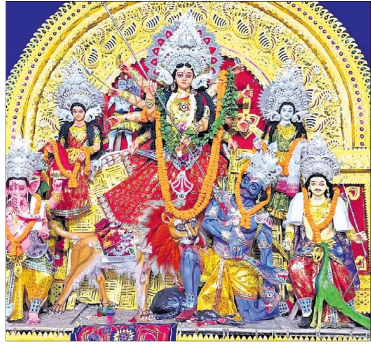
କେଶିକୁଣ୍ଡର ଗାନ୍ଧୀ ହକ ।