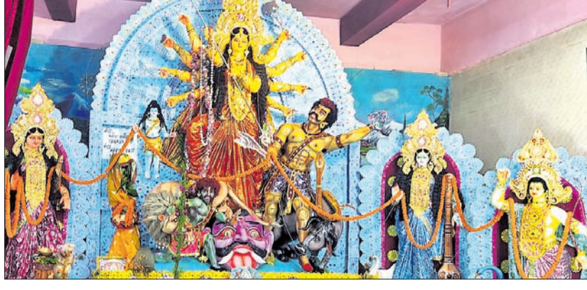
ଖଇରା ବଜାର ।