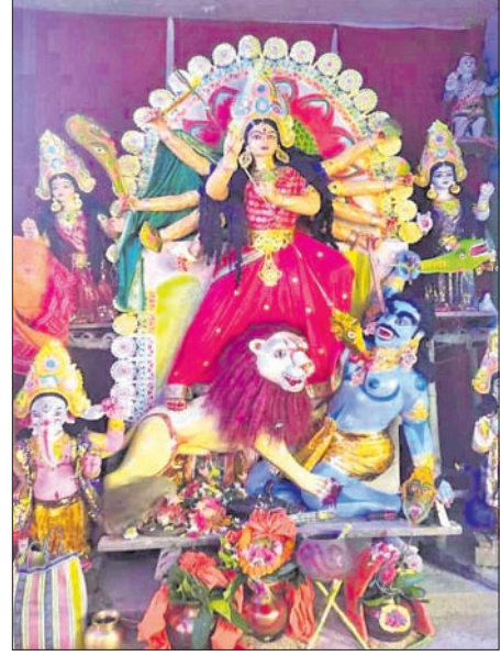
ଉତ୍କଳ ଜିଲ୍ଲା ଆରଡ଼ିର ପୁରରପୁର ।