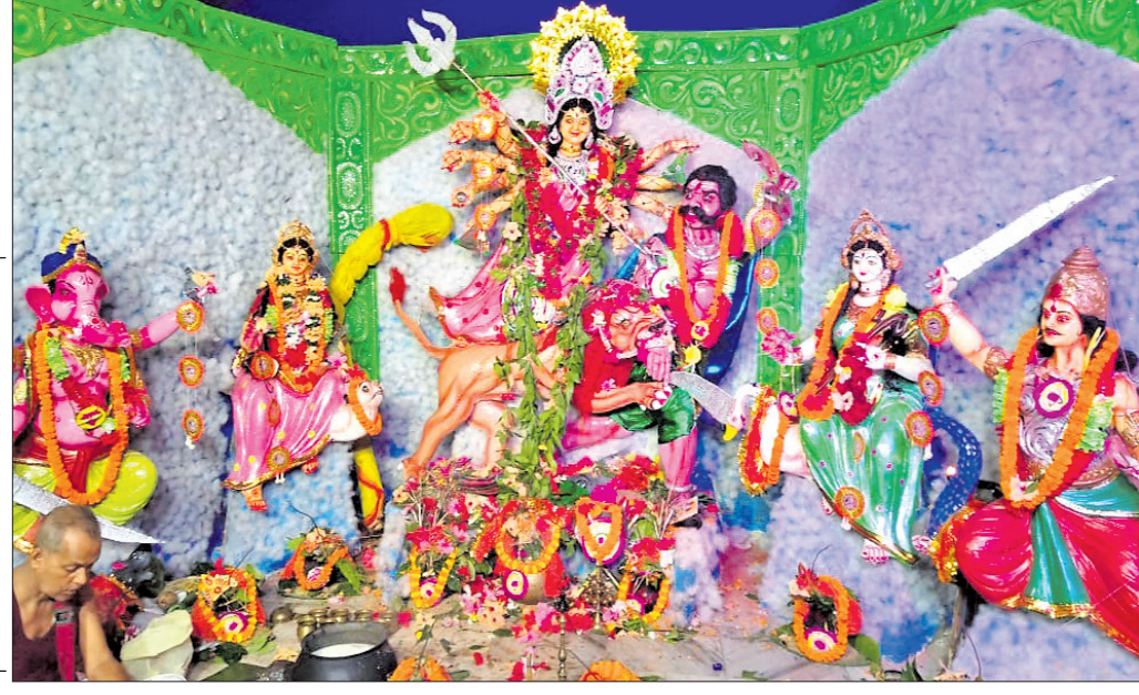
ଉତ୍କଳ ଜିଲ୍ଲା ଭଞ୍ଜାରିପୋଖରୀ ବ୍ଲକର ସରସବା ।