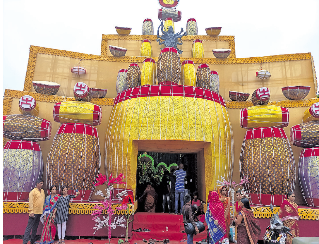
ବାଲେଶ୍ଵର ଜିଲ୍ଲା ଧୋରର ଭଉରେଶ୍ଵର ହକରେ ନିର୍ମିତ ଚୋରଣା ।