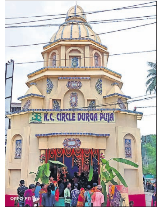
ମୟୂରଭଞ୍ଜ ଜିଲ୍ଲା ବାରିପଦା କେସି ସର୍କଲ ପୂଜା ମଣ୍ଡପ ଚୋରଣା ।