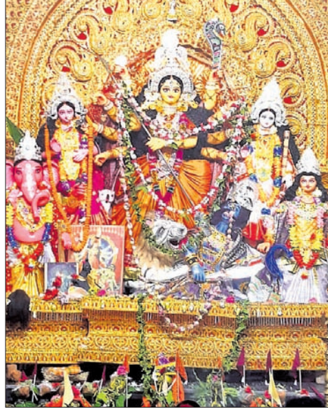
କେଶିକୁଣ୍ଡର ଆନନ୍ଦପୁର ।