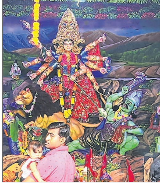
କେଶିକୁଣ୍ଡର ଜିଲାର ଯୋଡ଼ା ।