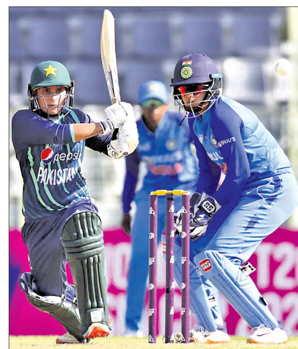
ଶର୍ବ ଖେଳିବା ଅବସରରେ ଚୋୟର ଅର୍ପ ଦି ମ୍ୟାଚ ନାବା ବର୍।

ସିଲହେଟ, ୭୧୧୦ (ପି.ଟି.) ମହିଳା ଟି୨୦ କ୍ରିକେଟ ଏସିଆ କପ ଚୁନାବେଳରେ ଭାରତ ଶୁକ୍ରବାର ପାକିସ୍ତାନଠାରୁ ୧୩ ରନରେ ହାରିଯାଇଛି।