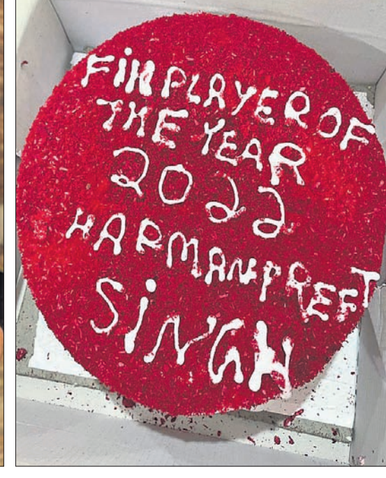
ଏଫଆଇଏର୍ ଚୋୟର ଅର୍ପ ଦି ଇନ୍ଦର ହରମନପ୍ରୀତ ସିଂ ଓ ତାଙ୍କ ପାଇଁ ଉଦ୍ଦିଷ୍ଟ କେକ୍ ।