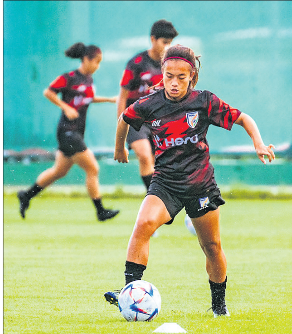
୧୭ ବର୍ଷରୁ କମ୍ ମହିଳା ଫିଫା ବିଶ୍ୱକପ ପୂର୍ବରୁ ଶୁକ୍ରବାର ଭୁବନେଶ୍ୱରରେ ୭ମ ବାଟାଲିୟନ ଗ୍ରାଉଣ୍ଡରେ ଭାରତୀୟ ଖେଳାଳିକ ଅଭ୍ୟାସ ।