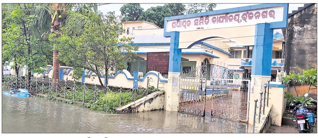
ଭଞ୍ଜନଗର ବ୍ଲକ୍ ସମସ୍ତ ରାସ୍ତାରେ ପାଣି ଭାସୁଛି।

ଗଞ୍ଜାମ ଜିଲ୍ଲା ଭଞ୍ଜନଗର ଏନ୍.ଏସି ୧୯୫୭ ନଭେମ୍ବର ୧୫ ତାରିଖରେ ରାଜ୍ୟ ସରକାରଙ୍କ ଠିକି (ନଂ.୪୦୨୫) ପ୍ରକାରେ ଭେଜିପୁଟ ଏବଂ ଗାମୁଡ଼ି ଗ୍ରାମର କେତୋଟି ରାଜ୍ୟ ଗ୍ରାମକୁ ନେଇ ଗଠିତ ହୋଇଥିଲା। ଏହାପରେ ସହରର ବିକାଶ ପାଇଁ ମାଷ୍ଟର ପ୍ଲାନ ପ୍ରସ୍ତୁତ ହେଲା। ପ୍ରାୟ ୫୦ ପୂର୍ବ ପ୍ଲାନ ପ୍ରସ୍ତୁତ ହୋଇଥିବା ଅନୁମାନ କରାଯାଉଛି। ତେବେ ଏ ପର୍ଯ୍ୟନ୍ତ ସେହି ପୁରୁଣା ପ୍ଲାନରେ ସହରର ବିକାଶ ଚାଲିଥିବା ଦେଖାଯାଉଛି। ଏନ୍.ଏସି ୧୦ନ ସମୟରେ ସହରର ଜନସଂଖ୍ୟା କମ୍ ଥିଲା। ୨୦୧୧ ଜନଗଣନା ଅନୁସାରେ ବର୍ତ୍ତମାନ ସହରର ୧୫ଟି ଖାଡ଼ିରେ ୨୦,୪୮୨ ଜଣ ଲୋକ ବସବାସ କରୁଛନ୍ତି। ବେସରକାରୀ ଭାବେ ଏହା ୨୫ ହଜାରରୁ ଊର୍ଦ୍ଧ୍ୱ ହେବ। ଜନଗଣନା ଅନୁସାରେ ମୋଟ ଜନସଂଖ୍ୟା ମଧ୍ୟରେ ୧୦,୩୦୮ ପୁରୁଷ ଏବଂ ୧୦୧୭୪ ମହିଳା ଅଛନ୍ତି। ୯୬.୨୬ ପ୍ରତିଶତ ହିନ୍ଦୁ, ୧.୧୦ ପ୍ରତିଶତ ଖ୍ରୀଷ୍ଟିଆନ ଅଛନ୍ତି। ୨୦୨୨ ଫେବୃଆରୀ ଭୋଟର ତାଲିକା ଅନୁସାରେ ଏନ୍.ଏସିରେ ୧୮,୪୧୦ ଭୋଟର ଥିବାବେଳେ ସେଥିମଧ୍ୟରେ ୯,୧୬୭ ପୁରୁଷ ଏବଂ ୯,୨୪୩ ମହିଳା। ବୃତ୍ତୀୟ ଲିଙ୍ଗ ଭୋଟର ନାହାନ୍ତି। ଭଞ୍ଜନଗର ସହରରେ ପୁରୁଷ ଶିକ୍ଷିତ ହାର ୯୩.୮୮ ପ୍ରତିଶତ ଥିବାବେଳେ ମହିଳା ଶିକ୍ଷିତ ହାର