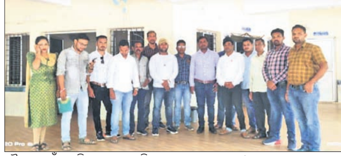
ବୈଠକ ପାଇଁ ଏକାଠି ହୋଇଥିବା ଅମିନ ସଂଘର ସଦସ୍ୟମାନେ।