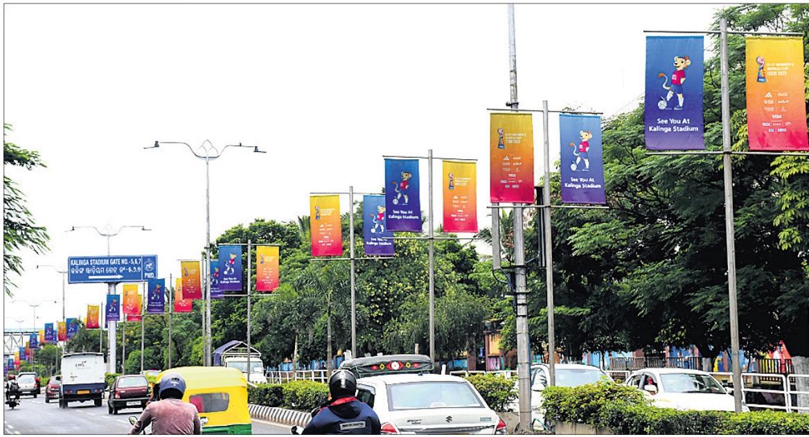
କଳିଙ୍ଗ ଷ୍ଟାଡ଼ିୟମ ପାର୍ଶ୍ୱବର୍ତ୍ତୀ ରାସ୍ତାରେ ୧୭ ବର୍ଷରୁ କମ୍ ମହିଳା ଫିଫା ବିଶ୍ୱକପର ହୋର୍ଡିଂ।

ଭାରତ ସମେତ ଓଡ଼ିଶାରେ ପ୍ରଥମଥର ପାଇଁ ହେବାକୁ ଯାଉଥିବା ୧୭ ବର୍ଷରୁ କମ୍ ମହିଳା ଫିଫା ବିଶ୍ୱକପ୍ ପାଇଁ ଉତ୍ସାହ ବଢ଼ିବାରେ ଲାଗିଛି। ପ୍ରତିଯୋଗିତାର ଅନ୍ୟତମ ଭେଦ୍ୟ କଳିଙ୍ଗ ଷ୍ଟାଡ଼ିୟମ ସମ୍ପୂର୍ଣ୍ଣ ପ୍ରସ୍ତୁତ। ଭୁବନେଶ୍ୱରରେ ଫିଫା ଚାକିରୀ ସମ୍ପାଦନା କରାଯାଇଛି। ସକେଲ ହେଉଛି ସହର। କଳିଙ୍ଗ ଷ୍ଟାଡ଼ିୟମ ପାର୍ଶ୍ୱବର୍ତ୍ତୀ ରାସ୍ତା ସହ ସହରର ବିଭିନ୍ନ ସ୍ଥାନରେ ପ୍ରତିଯୋଗିତାର ଲୋଗୋ ଏବଂ ମାଧ୍ୟମରେ ହୋର୍ଡିଂମାନ ଲାଗିଛି। ପୂର୍ବରୁ ହଳି ବିଶ୍ୱକପ୍ ସମେତ ଡକ୍ଟରରୁ ଉର୍ଦ୍ଧ୍ୱ ଅନ୍ତର୍ଜାତୀୟ ପ୍ରତିଯୋଗିତାକୁ ସଫଳତାର ସହ ସମ୍ପନ୍ନ କରାଯାଇଥିବା ରାଜ୍ୟ ସରକାର ଏଥର ମଧ୍ୟ ଚୁନାମାଣକୁ ସମର୍ଥନ କରିବା ପାଇଁ ସମସ୍ତ ପ୍ରକାର ବ୍ୟବସ୍ଥା ଗ୍ରହଣ କରିଛନ୍ତି। ପୁଞ୍ଜୀମନ୍ତ୍ରୀ ନବୀନ ପଟ୍ଟନାୟକ ୧୧ ତାରିଖରେ କଳିଙ୍ଗ ଷ୍ଟାଡ଼ିୟମରେ ପ୍ରତିଯୋଗିତାକୁ ଉଦ୍ଘାଟନ କରିବାର କାର୍ଯ୍ୟକ୍ରମ ରହିଛି। ଏହି ସମୟରେ ଫିଫା, ସର୍ବଭାରତୀୟ ଫୁଟବଲ ଫେଡେରେଶନର ଅଧିକାରୀମାନେ ଉପସ୍ଥିତ ରହିବାର ସୂଚନା ମିଳିଛି। ଏହା ଏକ ମେଗା ପ୍ରତିଯୋଗିତା ହୋଇଥିବାରୁ ଭେଦ୍ୟୁତ କଳିଙ୍ଗ ଷ୍ଟାଡ଼ିୟମ ସମେତ ୭୮ ବାଟାଲିୟନ ମଧ୍ୟରେ ୨ଟି ଏବଂ ସୁନି-୩ ଅଭ୍ୟାସ ପଡ଼ିଆକୁ ଫିଫା ଷ୍ଟାଡ଼ିୟମ ଭାବରେ ପ୍ରସ୍ତୁତ କରିବାକୁ ଉଦ୍ଦିଷ୍ଟ।