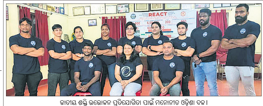
ଜାତୀୟ ଶକ୍ତି ଉତ୍ତୋଳନ ପାଇଁ ମନୋନୀତ ଓଡ଼ିଶା ଦଳ।

ଲାଭ କରିପାରିଛନ୍ତି। ଅବଶିଷ୍ଟ ଚାଉଟଳ ପୂରା ପଏଣ୍ଟ ପ୍ରଦାନ ଫରକ ଆଣିବ ନାହିଁ। ଟ୍ରାଇଭର ରେଡ୍‌ବୁଲରେ ଦ୍ୱିତୀୟ ସ୍ଥାନରେ ରହିଥିବା ପେରେଜଙ୍କ ପଏଣ୍ଟ ସଂଖ୍ୟା ୨୫୩ ଏବଂ ତୃତୀୟ ସ୍ଥାନରେ ଥିବା ଲେକ୍‌ରେକ୍‌ଙ୍କ ପଏଣ୍ଟ ସଂଖ୍ୟା ୨୫୨ ରହିଛି। ରେସ୍‌କୁ ସଂକ୍ଷିପ୍ତ କରାଯିବାର ସେ ଚାଉଟଳ ଛିଡ଼ା ହେବା ବିଷୟ ଭର୍ଷ୍ଟାପେନ୍ ପ୍ରଥମେ ଜାଣିପାରି ନ ଥିଲେ। କିନ୍ତୁ କିଛି ସମୟ ପରେ ଫର୍ମୁଲା ଓ୍ୱାନ୍ ପରିଚାଳନା ପରିଷଦ (ଏଫ୍‌ଆଇଏ) ତାଙ୍କୁ ପୂରା ପଏଣ୍ଟ ପ୍ରଦାନ କରିବା ସହ ବିଜୟୀ ଘୋଷଣା କରିଥିଲା। ରବିବାର ରେସ୍‌ରେ ୪ର୍ଥରୁ ୧୦ମ ସ୍ଥାନରେ ଅଛନ୍ତି ଏଷ୍ଟିବାନ ଓକନ (ଆଲପାଇନ୍), ଲୁଇସ୍ ହାମିଲଟନ (ମର୍ସିଡିସ୍), ସେବାଷ୍ଟିଆନ ଭେଟେଲ(ଆଷ୍ଟିନ ମାର୍ଟିନ), ଫର୍ନାଣ୍ଡୋ ଆଲୋନ୍ସୋ (ଆଲପାଇନ୍), ଜର୍ଜ ରସେଲ (ମର୍ସିଡିସ୍), ନିକୋଲାନ ଲାଟିଫି (ଫ୍ରିୟାୟ) ଓ ଲାଣ୍ଡୋ ନୋରିସ (ମ୍ୟାକଲରେନ)।