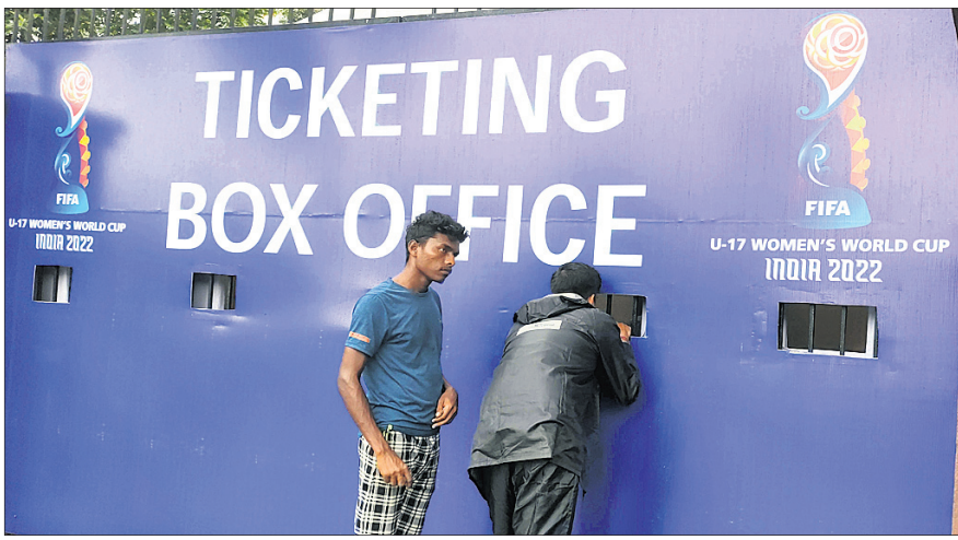
ଫୁଟବଲ ପ୍ରଶଂସକ ଟିକେଟ କିଣୁଛନ୍ତି।

କରାଯାଇଛି। ଭାରତୀୟ ଦଳ ପୂର୍ବରୁ ଏଠାରେ ଟ୍ରେନିଂ କରି ରଖୁଥିବାବେଳେ ଇତିମଧ୍ୟରେ ବ୍ରାଜିଲ, ମରୋକ୍କୋ ଏବଂ ଆମେରିକା ଦଳ ଭୁବନେଶ୍ୱରରେ ପହଞ୍ଚି ନିଜ ପ୍ରସ୍ତୁତିକୁ ଅଧିକ ରୂପ ଦେଉଛନ୍ତି। ଭାରତ ସମେତ ଏହି ୩ଟି ଦଳ ଗ୍ରୁପ୍ 'ଏ'ରେ ସ୍ଥାନ ପାଇଛନ୍ତି। ପ୍ରତି ଗ୍ରୁପ୍‌ରୁ ୨ଟି ଦଳ କ୍ୱାର୍ଟର ଫାଇନାଲକୁ ଉନ୍ନତ ହେବାର ନିୟମ ରହିଛି। ତେଣୁ ଭାରତ ପୁଞ୍ଜୀମନ୍ତ୍ରୀ ଉତ୍ତରାଧିକାରୀଙ୍କୁ ପ୍ରଥମଥର ପାଇଁ ଅଂଗ୍ରହଣ କରୁଥିବା ମରୋକ୍କୋ ଦଳ ମଧ୍ୟ ପ୍ରସ୍ତୁତ ହେବାର ସମ୍ଭାବନା ରହିଛି। ଭୁବନେଶ୍ୱରରେ ପ୍ରତିଯୋଗିତାର ମ୍ୟାଚଗୁଡ଼ିକ ଆୟୋଜନ କରାଯାଉଛି।