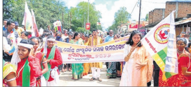
ଗଣ ସମାଜ ପକ୍ଷରୁ ବାହାରିଥିବା ଶୋଭାଯାତ୍ରା।