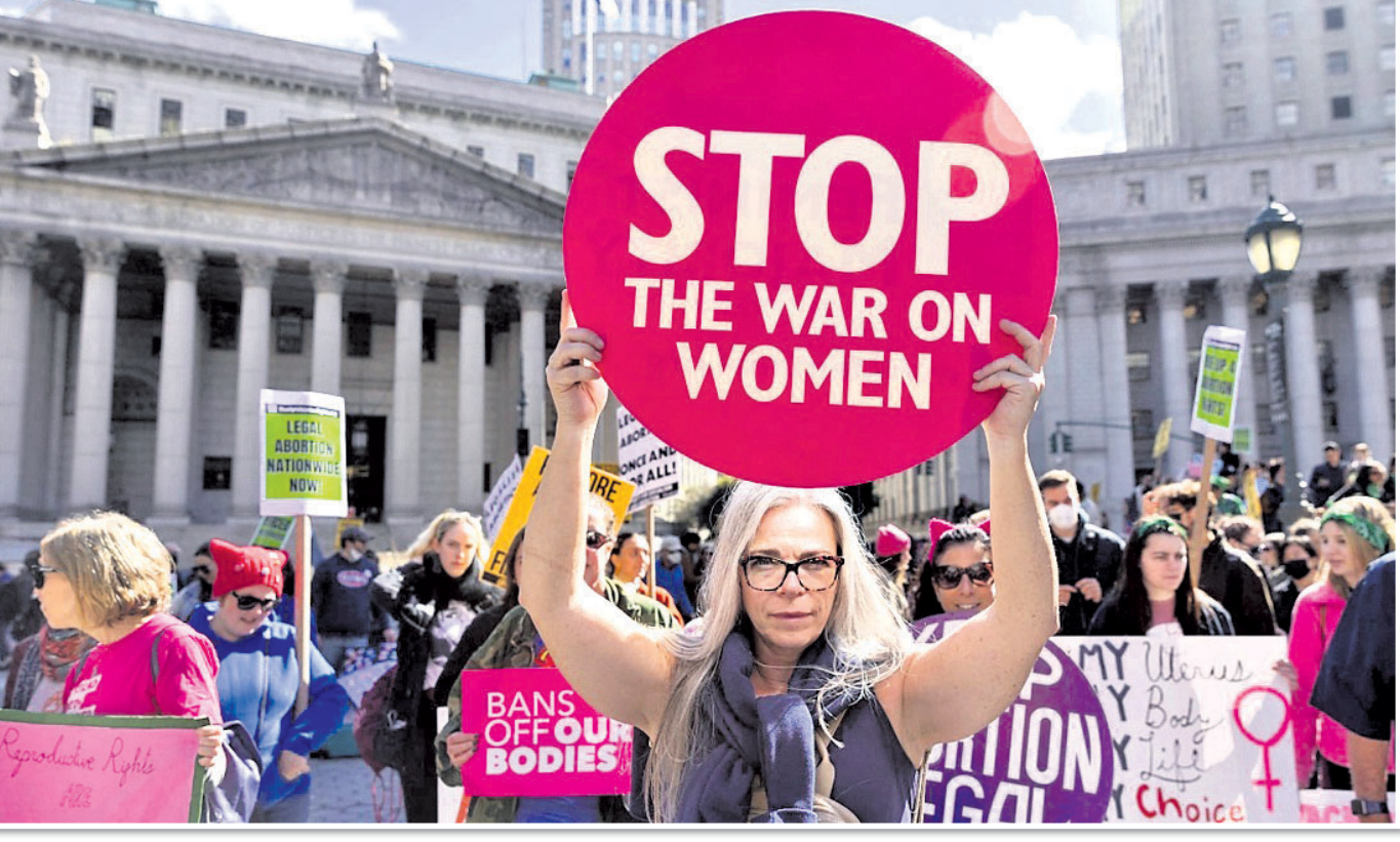
ରୁଷ୍ଟିକ ସିଟିର ଫୋଲୋ ଷ୍ଟୋରରେ ମହିଳାଙ୍କ ଗର୍ଭପାତ ଅଧିକାର ସପକ୍ଷରେ ବିଶାଳ ଶୋଭାଯାତ୍ରା।