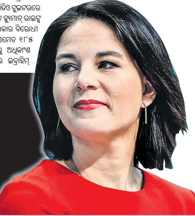
ଜର୍ମାନ ବହିର୍ବ୍ୟାପାର ମନ୍ତ୍ରୀ ଆନାଲେନା ବେରବୋକ୍

ରକ୍ଷା ସରକାର ଏହି ବିକ୍ଷୋଭକୁ ଆମେରିକା ସମେତ ଅନ୍ୟ ଶତ୍ରୁରାଷ୍ଟ୍ରଗୁଡ଼ିକର ସହଯୋଗ ବୋଲି ଅଭିହିତ କରିଛନ୍ତି। ପ୍ରକାଶ ଯେ, ଉଚିତ ଜଙ୍ଗଲ ହିକାଏ ପିନ୍ଧି ନ ଥିବା ଦର୍ଶାଇ ଇରାନର ଧର୍ମାନ୍ଦ ବ୍ୟାପାର ପୋଲିସ ୨୨ ବର୍ଷୀୟା ମହସା ଅମିନୀଙ୍କୁ ପିଟି ହତ୍ୟା କରିବା ପରଠାରୁ ମୁଣ୍ଡ ବେକିଥିବା ଆନ୍ଦୋଳନ ଏବେ ବିଭିନ୍ନ ଦେଶକୁ ବ୍ୟାପିଯାଇଛି। ବିକ୍ଷୋଭକାରୀମାନେ ମନ୍ତ୍ରୀ ଆନାଲେନା ବେରବୋକ୍ ନିନ୍ଦା କରିଛନ୍ତି।