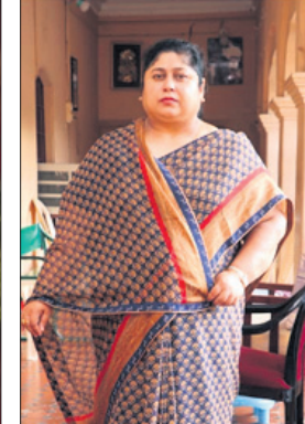
ଧରାକୋଟ ରାଣୀ ନନ୍ଦିନୀ ଦେବୀ ।