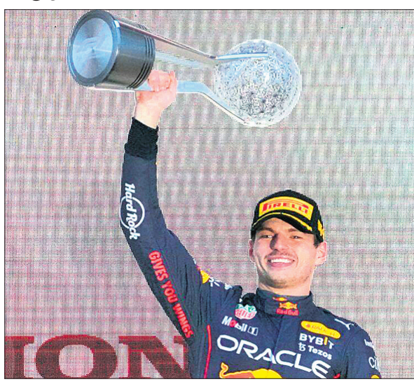
କାପାଳିକ ଫର୍ମୁଲା ଓ୍ୱାନ୍ ଗ୍ରାପ୍ରି ଚୁପି ସହ ମାକ୍ସ ଭର୍ଷ୍ଟାପେନ୍।

ରେଡ୍‌ବୁଲ୍ ଟ୍ରାଇଭର ମାକ୍ସ ଭର୍ଷ୍ଟାପେନ୍ ସୁନ୍ଦରୀରେ ରବିବାର ଅନୁଷ୍ଠିତ କାପାଳିକ ଫର୍ମୁଲା ଓ୍ୱାନ୍ ଗ୍ରାପ୍ରିରେ ବିଜୟ ଲାଭ କରିଛନ୍ତି। ଏଥିସହିତ ସେ କ୍ରମାଗତ ଦ୍ୱିତୀୟ ଥର ଟ୍ରାଇଭର ଚାଉଟଳ ହାସଲ କରିଛନ୍ତି। ଚଳିତ ସିକନରେ ପ୍ରାଧାନ୍ୟ ବିସ୍ତାର କରି ଆସିଥିବା ଭର୍ଷ୍ଟାପେନ୍ ଟିଏ ରେସ୍ ହେବାକୁ ବାକିଆଇ ଚାଉଟଳ ଛିଡ଼ା କରିଛନ୍ତି। ତତ୍ ପ୍ରାଇଭର ପୋଲ୍‌ରୁ ରେସ୍ ଆରମ୍ଭ କରିଥିଲେ। ବର୍ଷା ଯୋଗୁ ନିୟନ୍ତ୍ରଣ ହରାଇ ଏକାଧିକ କାର୍ ବୁର୍ଯ୍ୟଗୋର ସମ୍ପୃକ୍ତ ହେବାକୁ ଦୁଇ ଲାପ୍ ପରେ ରେସ୍‌କୁ ଛାଡ଼ି ରଖାଯାଇଥିଲା। ଦୁଇ ଘଣ୍ଟା ପରେ ରେସ୍ ଆରମ୍ଭ କରାଯାଇଥିଲା। ୫୩ଟି ଲାପ୍ ମଧ୍ୟରୁ ୨୮ଟି ଶେଷ କରାଯାଇଥିଲା। ଭର୍ଷ୍ଟାପେନ୍ ସବୁଠାରୁ ଆଗରେ ରହିଥିଲେ। ତାଙ୍କ ପଛକୁ ପଛ ଦ୍ୱିତୀୟ ଓ ତୃତୀୟ ସ୍ଥାନରେ ରହିଥିଲେ ଟିଏମେଟ ସର୍ଭିସ ପେରେଜ ଓ ଫୋରାରି ଟ୍ରାଇଭର ଚାକ୍ସି ଲେକ୍‌ରେକ୍। ଏହି ଦୁଇ ଟ୍ରାଇଭର ଭର୍ଷ୍ଟାପେନ୍‌ଙ୍କୁ ଅତିକ୍ରମ କରି ଚାଉଟଳ ଛିଡ଼ାପାରିଥିଲେ। ମାତ୍ର ଏଠାରେ ରେସ୍ ଛିଡ଼ା ହେବା ବାବଦ ଭର୍ଷ୍ଟାପେନ୍ ୩୬୭ ପଏଣ୍ଟ ସହ ଟେବୁଲରେ ତାଙ୍କ ନିକଟତମ ପ୍ରତିଦ୍ୱନ୍ଦ୍ୱୀଙ୍କଠାରୁ ଯଥେଷ୍ଟ ଅଗ୍ରଣୀ