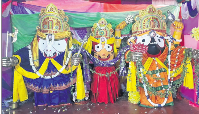
ଗଜମା ଜିଲା ଧରାକୋଟରେ ପୂଜା ପାଉଥିବା ଶ୍ରୀମନ୍ଦିର ।