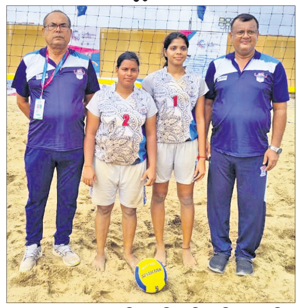
କୋଚ୍ ସହ ବ୍ରୋଞ୍ଜ ପଦକ ବିଜୟୀ ଓଡ଼ିଶା ମହିଳା ଭଲିବଲ ଖେଳାଳି।

ସୁରଟର ଛୁମାସ୍ ବିବେଚିତ ଅନୁଷ୍ଠିତ ୩୨ତମ ଜାତୀୟ କ୍ରୀଡ଼ା ବିତ୍ ଭଲିବଲ (ପୁରୁଷ ଏବଂ ମହିଳା) ଇଭେଣ୍ଟରେ ଓଡ଼ିଶା ମହିଳା ଦଳ ବ୍ରୋଞ୍ଜ ପଦକ ହାସଲ କରିଛି। ଓଡ଼ିଶା ଭଲିବଲ ଇତିହାସରେ ପ୍ରଥମଥର ପାଇଁ ମହିଳା ଦଳକୁ ଜାତୀୟ କ୍ରୀଡ଼ାରେ ପଦକ ମିଳିଛି। ଓଡ଼ିଶା ଦଳ ତେଲଙ୍ଗାନାକୁ ୨-୦ (୨୧-୧୯ ଏବଂ ୨୨-୨୦), କେରଳକୁ ୨-୦ (୨୧-୧୬ ଏବଂ ୨୧-୧୧) ସେଟ୍‌ରେ ହରାଇ କ୍ୱାର୍ଟର ଫାଇନାଲରେ ପହଞ୍ଚିଥିଲା। କ୍ୱାର୍ଟରରେ ପୁଡୁଚେରୀ-୨କୁ ପରାସ୍ତ କରି ସେମିଫାଇନାଲରେ ପ୍ରବେଶ କରିଥିଲା। ସେମିଫାଇନାଲରେ ଏକଦା ଅଗ୍ରଣୀ ରହିଥିଲେ ହେଁ ପ୍ରତିକୂଳ ପାର ସହ ଖାପ ଖୁଆଇ ନ ପାରି ପୁଡୁଚେରୀ-୧ ନିକଟରୁ ହାରି ଯାଇଥିଲା। ଏହାପରେ ଏକପାଖିଆ ମ୍ୟାଚରେ ତେଲଙ୍ଗାନାକୁ ୨-୦ ରେ ପରାସ୍ତ କରି ବ୍ରୋଞ୍ଜ ପଦକ