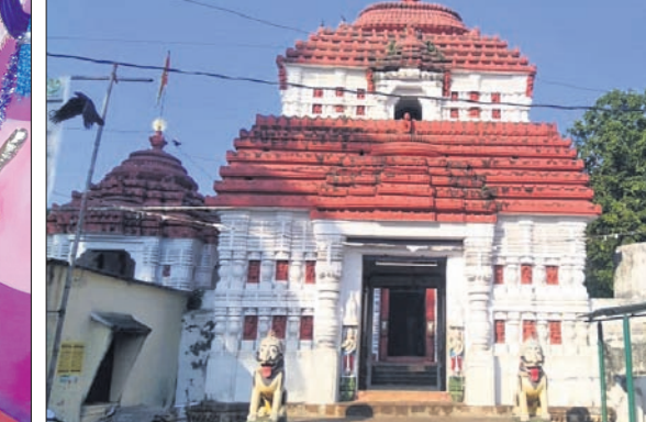
ଜଗନ୍ନାଥ ମନ୍ଦିର ମୁଖ୍ୟ ଦ୍ୱାର ।