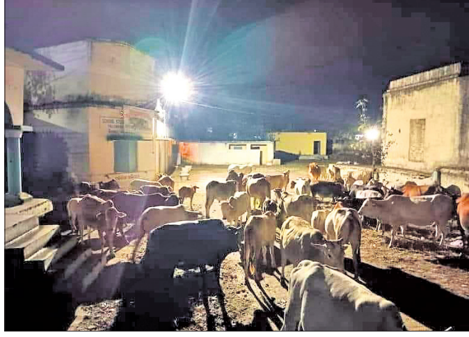
ନବରଜ୍‌ପୁରରେ ଖୋଲିଥିବା ଅସ୍ଥାୟୀ ଗୋଶାଳା ।