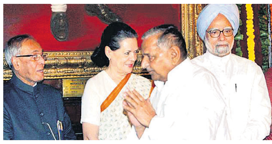
୨୦୧୨ ଜୁନରେ ତତ୍କାଳୀନ ଅର୍ଥମନ୍ତ୍ରୀ ପ୍ରଶାନ୍ତ ମୁଖାର୍ଜୀ, ଉପାଧ୍ୟକ୍ଷା ସୋନିଆ ଗାନ୍ଧୀ ଓ ପୂର୍ବତନ ପ୍ରଧାନମନ୍ତ୍ରୀ ମନମୋହନ ସିଂଙ୍କ ସହ ପୁଲାଇମ।

ପ୍ରଧାନମନ୍ତ୍ରୀ ହେବା ପାଇଁ ମନା କରିଦେବା ପରେ ବାମଦଳ ନେତା ହରକିଷ୍ଠନ ସିଂ ସୁଜିତ ଏସପି ନେତା ପୁଲାଇମଙ୍କ ନାମ ଉଠାଇଥିଲେ। ତେବେ ଲାଲୁ ଓ ଶରଦ ଯାଦବ ଦୁହେଁ ବିରୋଧ କରିବାରୁ ସେ ପ୍ରଧାନମନ୍ତ୍ରୀ ଦିନରେ ଭାଙ୍ଗିଯାଇଥିଲା। ଏହା ପରେ ଅନ୍ୟ ଦଳଗୁଡ଼ିକ ସହ ମିଶି ସରକାର ଗଢ଼ିବାକୁ କଂଗ୍ରେସ ମନା କରିଦେବା ପରେ ପୂର୍ବତନ ପ୍ରଧାନମନ୍ତ୍ରୀ ଭି.ପି. ସିଂ ଏବଂ ତତ୍କାଳୀନ ପଶ୍ଚିମବଙ୍ଗ ମୁଖ୍ୟମନ୍ତ୍ରୀ ଜ୍ୟୋତିବସୁଙ୍କ ନେତୃତ୍ୱରେ ସରକାର ଗଠନ କଥା ଉଠିଥିଲା। ସେମାନେ