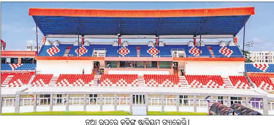
ନୂଆ ରୂପରେ କଳିଙ୍ଗ ଷ୍ଟାଡ଼ିୟମ ଗଢାଲେଇ।

କୁବନେଶ୍ଵର, ୧୦୧୧୦ (ଗ୍ରାମା ପ୍ରତିନିଧି) ପ୍ରତୀକ୍ଷାର ଅବସାନ ଘଟିବାକୁ ଯାଉଛି। ଭାରତ ସମେତ ଓଡ଼ିଶାରେ ପ୍ରଥମଥର ପାଇଁ ହେବାକୁ ଯାଉଛି ୧୭ ବର୍ଷରୁ କମ୍ ମହିଳା ଫିଫା ବିଶ୍ଵକପ। ଆଇକନିକ୍ କଳିଙ୍ଗ ଷ୍ଟାଡ଼ିୟମରେ ପୂର୍ବରୁ ମହିଳା ଗୋଲ୍ଡକପ୍ ଫୁଟବଲ ଏବଂ ୨୦ ବର୍ଷରୁ କମ୍ ସାଫ୍ (ସାଉଥ ଏସିଆନ୍ ଫୁଟବଲ ଫେଡେରେଶନ) ଚାମ୍ପିୟନଶିପ୍ ଅନୁଷ୍ଠିତ ହୋଇଥିବାବେଳେ ଏବେ ଏଥିରେ ଯୋଡ଼ିହେବାକୁ ଯାଉଛି ଫିଫା ମହିଳା ବିଶ୍ଵକପର ଛୁନିୟର ପ୍ରତିଯୋଗିତା। ହକି ବିଶ୍ଵକପ୍ ସମେତ ଡକ୍ଟରଲୁ ଉର୍ଦ୍ଧ୍ଵ ଅନ୍ତର୍ଜାତୀୟ ପ୍ରତିଯୋଗିତା ଆୟୋଜନର ମୁକ୍ତସାକ୍ଷୀ ରହିସାରିଥିବା କଳିଙ୍ଗରେ ଏଥର ବେଶ୍ଵାକୁ ନିଜ ବନ୍ଧୁ ଭବ୍ୟାମାନ ମହିଳା ଫୁଟବଲ ଚାରକାକ ଆକ୍ରମଣ ରୋମାଞ୍ଚ। ଗୁପ୍ତ ଏବେ ସ୍ଥାନ ପାଇଥିବା ଭାରତ ଏହାର ସମସ୍ତ ମ୍ୟାଚ୍ କଳିଙ୍ଗରେ ଖେଳିବ। ମଙ୍ଗଳବାର