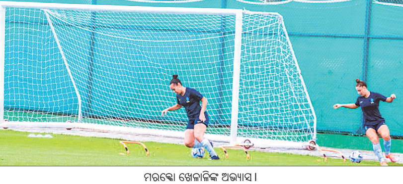
ମରୋକ୍କୋ ଖେଳାଳିଙ୍କ ଅଭ୍ୟାସ।