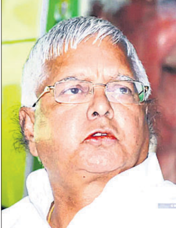
ଲାଲୁ ପ୍ରସାଦ ଯାଦବ

ରାଷ୍ଟ୍ରୀୟ ଜନତା ଦଳ (ଆରଜେଡି) ଅଧ୍ୟକ୍ଷ ଲାଲୁ ପ୍ରସାଦ ଯାଦବ ଯୋଗଦାନ ପୂର୍ଣ୍ଣିୟରେ ପୁରୁଣା 'ମଣ୍ଡଳ ବନାମ କମିଶନ' ବିଚାର ଉଠାଇବାକୁ ଆହ୍ୱାନ ଦେଇଛନ୍ତି। ଭାଜପା ସମାଜରେ ସାମ୍ପ୍ରଦାୟିକ ବିବେଚନା ବଦଳାଇ ଦୁର୍ବଳ ବର୍ଗର ଲୋକଙ୍କ ବିରୋଧରେ ଯାଉଛି। ଏହି ଦଳ ସାମାଜିକ ନ୍ୟାୟର ବିଚାରରଣା କରୁଛି ବୋଲି ଲାଲୁ ସମାଲୋଚନା କରିଛନ୍ତି। ସେ ବିରୋଧୀ ଦଳଗୁଡ଼ିକୁ ଏକତ୍ରିତ କରୁଥିବାକୁ କେନ୍ଦ୍ର ସରକାର ତାଙ୍କ ପକ୍ଷରେ କେନ୍ଦ୍ରୀୟ ଚପଟ ରୁଖିବେ (ସିଦ୍ଧିଆଇ) ଏବଂ ପ୍ରଚଳନ ନିର୍ଦ୍ଦେଶାଳୟ (ଇତି) ଭଳି ଏକେଡ୍ରିଗୁଡ଼ିକୁ ଲଗାଉଛି। ଏଥିରେ ସେ ଆଦୌ ଭୟଭୀତ ହୁଅନ୍ତି ବୋଲି ଲାଲୁ ରୋକ୍ଷୋକ ଶୁଣାଇଛନ୍ତି। ନୂଆଦିଲ୍ଲୀର ତାଲକଗୋରା ଷ୍ଟାଡ଼ିୟମରେ ଆରଜେଡି ପ୍ରତିଷ୍ଠା ଦିବସ ଅବସରରେ ବ୍ରାହ୍ମଣ ଥର ଅଧ୍ୟକ୍ଷ ମନୋନାତି ହେବା ପରେ