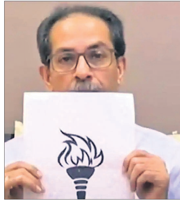
ଉଦ୍ଧବ ଠାକୁରଙ୍କୁ 'ମଶାଲ' ଚିହ୍ନ ଦେଖାଉଛନ୍ତି।

ଶିବସେନାର ଉଦ୍ଧବ ଠାକୁରଙ୍କୁ ନିର୍ବାଚନ କମିଶନ(ଇସି) ଯୋଗଦାନ କରିଛନ୍ତି। ଉଦ୍ଧବ ଚିହ୍ନ ପ୍ରଦାନ କରିଛନ୍ତି। ଉଦ୍ଧବ ଚିହ୍ନ ପ୍ରଦାନ କରିଛନ୍ତି। ଉଦ୍ଧବ ଚିହ୍ନ ପ୍ରଦାନ କରିଛନ୍ତି।