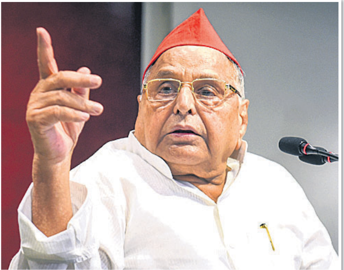
ପୁଲାଇମ ସିଂ ଯାଦବ ୨୨.୧୧.୧୯୩୯ - ୧୦.୧୦.୨୦୧୨

ବେଶ୍ ପ୍ରଭାବିତ କରିଥିଲା। ସେ ଉତ୍ତରପ୍ରଦେଶ ରାଜନୀତିରେ ଭୂମିପୁତ୍ର ଓ ନେତାଜୀ ଭାବେ ପରିଚିତ ହୋଇଥିଲେ। ପୁଲାଇମ ୧୦ ଥର ଯୁପି ବିଧାନସଭା ଏବଂ ୭ ଥର ଲୋକ ସଭାକୁ ନିର୍ବାଚିତ ହୋଇଥିଲେ। ୧୯୬୭ରେ ସେ ପ୍ରଥମେ ବିଧାୟକ ହୋଇଥିଲେ। ୧୯୭୪ରେ ପୁନଃନିର୍ବାଚିତ ହୋଇଥିଲେ ହେଁ ତତ୍କାଳୀନ ପ୍ରଧାନମନ୍ତ୍ରୀ ଇନ୍ଦିରା ଗାନ୍ଧୀ ଜାତୀୟ ଜରୁରୀ ସ୍ଥିତି ଲାଗୁ କରିବାରୁ ୧୯୭୪ରେ ସେ ଚିରନିଦ୍ରା ହୋଇ ୧୯ ମାସ ଜେଲରେ ରହିଥିଲେ। ୧୯୭୭ରେ ମୁକ୍ତିଲାଭ ପରେ ସେ ପୁଣିଥରେ ବିଧାନସଭାକୁ ନିର୍ବାଚିତ ହୋଇଥିଲେ। ୧୯୭୭ରେ ପୁଲାଇମ ଉତ୍ତରପ୍ରଦେଶରେ ଲୋକଦଳର ସଭାପତି ହୋଇଥିଲେ। ସେହିବର୍ଷ ଲୋକଦଳ ଦୁଇଭାଗ ହୋଇଯିବାରୁ ସେ ଲୋକଦଳ-ବି ଗୋଷ୍ଠୀର ନେତୃତ୍ୱ ନେଇଥିଲେ। ୧୯୮୦ରେ ସେ ଜନତା ଦଳର ରାଜ୍ୟ ସଭାପତି ନିର୍ବାଚିତ ହୋଇଥିଲେ। ୧୯୮୨ରେ ରାଜ୍ୟ ବିଧାନ ପରିଷଦକୁ ନିର୍ବାଚିତ ହୋଇ ବିରୋଧୀ ଦଳ ନେତା ପଦରେ ୧୯୮୫ ପର୍ଯ୍ୟନ୍ତ ରହିଥିଲେ।