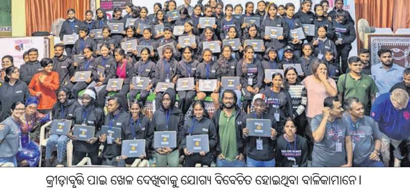
କ୍ରୀଡ଼ାବୃତ୍ତି ପାଇଁ ଖେଳ ଦେଖିବାକୁ ଯୋଗ୍ୟ ବିବେଚିତ ହୋଇଥିବା ବାଳିକାମାନେ।

ଭୁବନେଶ୍ୱର, ୧୦।୧୦ (ଶ୍ରୋତୃମୁଖର) ଅନ୍ତର୍ଜାତୀୟ ବାଳିକା ଦିବସ ପାଳନ ଅବସରରେ ଭାରତ ଏବଂ ଆଫ୍ରିକାର ୪୦ ଜଣ ବାଳିକାଙ୍କୁ କ୍ରୀଡ଼ାବୃତ୍ତି ମାଧ୍ୟମରେ ଫିଫା ବିଶ୍ୱକପ ଦେଖିବାର ସୁଯୋଗ ଦେଉଛି ସ୍ୱେଚ୍ଛାସେବୀ ସଙ୍ଗଠନ କିମ୍ ଅର୍ପଣ ସମ୍ମୁଖନ। କ୍ରୀଡ଼ା ବ୍ରାହ୍ମା ବିକାଶ ଏହି ସଙ୍ଗଠନର ପୁଣ୍ୟ ଲକ୍ଷ୍ୟ ହୋଇଥିବା ବେଳେ ପଛୁଆ ବର୍ଗର ବାଳିକା ମାନଙ୍କୁ କ୍ରୀଡ଼ାବୃତ୍ତି କରିଆରେ