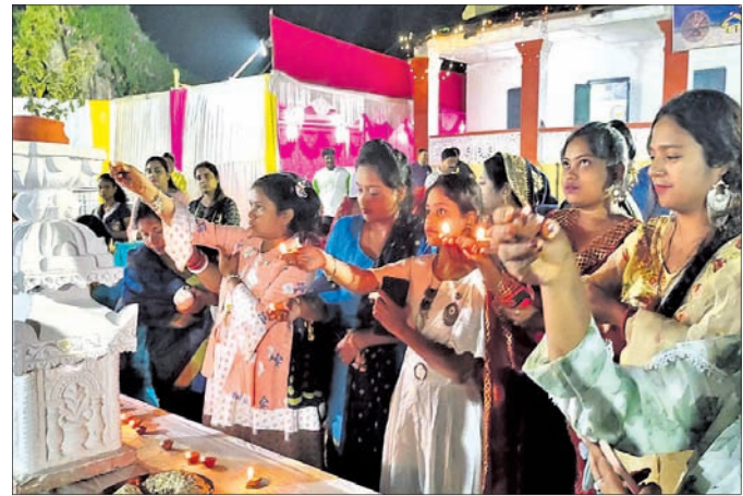
କୁମାରୀ ଓ ମହିଳାମାନେ ସମୂହ ଚନ୍ଦ୍ର ବନ୍ଦାପନା କରୁଛନ୍ତି।