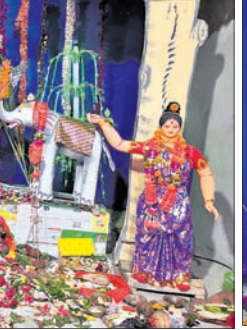
ମୟୂରଭଞ୍ଜ ଜିଲ୍ଲା ଗୋପବନ୍ଧୁ ନଗର ବ୍ଲକ୍ ପାଳଶାରେ ଗଜଲକ୍ଷ୍ମୀ ପୂଜା।