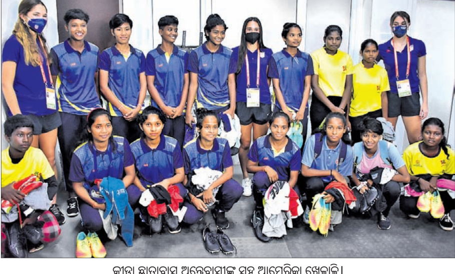
କ୍ରୀଡ଼ା ଛାତ୍ରାବାସ ଅନ୍ତେବାସୀଙ୍କ ସହ ଆମେରିକା ଖେଳାଳି।

ଭୁବନେଶ୍ୱର, ୧୦।୧୦ (ଗ୍ରୀଷ୍ମ ପ୍ରତିନିଧି) କଳିଙ୍ଗ ଷ୍ଟାଡ଼ିୟମରେ ୧୭ ବର୍ଷରୁ କମ୍ ମହିଳା ଫିଫା ବିଶ୍ୱକପ ପୂର୍ବରୁ ନିଆରା ଅନୁଭୂତି ଲାଭ କରିଛନ୍ତି କ୍ରୀଡ଼ା ଛାତ୍ରାବାସର ଅନ୍ତେବାସୀ। ଯୋଗଦାନ ଷ୍ଟାଡ଼ିୟମ ପରିସରରେ ଅନୁଷ୍ଠିତ ଖବରଦାତା ସମ୍ମିଳନୀ ଅବସରରେ ଆମେରିକା ଖେଳାଳିଙ୍କ ସହ ମିଶିବାର ସୁଯୋଗ ପାଇଥିଲେ କ୍ରୀଡ଼ା ଛାତ୍ରାବାସର ଖେଳାଳିମାନେ। ଏହି ଅବସରରେ ଆମେରିକା ଦଳ ପକ୍ଷରୁ ଛାତ୍ରାବାସର ଖେଳାଳିଙ୍କୁ ପୁରସ୍କାର କିମ୍ବଦନ୍ତୀ ପ୍ରଦାନ କରାଯାଇଥିଲା। ଏହା ବ୍ୟତୀତ ପୁରସ୍କାର ସମ୍ପର୍କିତ କେତେକ ଟିପ୍ସ ଦେଇ ଆମେରିକା ଖେଳାଳିମାନେ ପିଲାମାନଙ୍କୁ ଉତ୍ସାହିତ କରିଥିଲେ। ଏପରି ଏକ ଅନୁଭୂତିରେ ଦେଖି