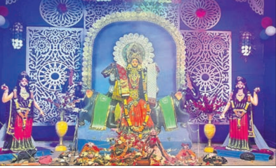
ବାଙ୍କିରିପୋଷିଠାରେ ଗଜଲକ୍ଷ୍ମୀଙ୍କ ମୁଣ୍ଡା ପୂର୍ଣ୍ଣ।