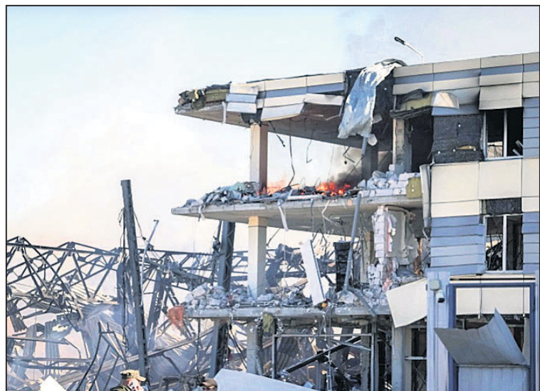
ରୁଷିଆର ମିଶାଇଲ ମାଡ଼ରେ କିଭର ଏକ ଗୋଦାମ ଘର ନଷ୍ଟ ହୋଇଯାଇଛି।

କିଭ, ୧୦୧୦ ରୁଷିଆ ସହଯୋଗୀ ରାଷ୍ଟ୍ର ବେଲାଭୁଷ ରାଷ୍ଟ୍ରପତି ଆଲେକ୍ସାଣ୍ଡର ଲୁକାଶେଙ୍କୋ ସାମାଜିକ ନିକ ସୈନ୍ୟଙ୍କୁ ୟୁକ୍ଲେନ ସୀମା ନିକଟରେ ପୁରୁଷ ପାଇଁ ନିର୍ଦ୍ଦେଶ ଦେଇଛନ୍ତି। କିଭ ଏବଂ ଏହାର ସହଯୋଗୀ ତଥା ପାଣ୍ଡାତ୍ୟ ବେଶ୍‌ଗୁଡ଼ିକ ପକ୍ଷରୁ ବେଲାଭୁଷ ପାଇଁ ବିପଦ ବହୁଥିବାରୁ ୟୁକ୍ଲେନ ସୀମା ନିକଟରେ ସୈନ୍ୟ ପୁରୁଷ ନିଷ୍ଠିତ ନିଆଯାଇଥିବା ଲୁକାଶେଙ୍କୋ