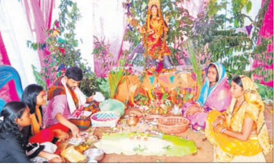
ବେତନଟା ବ୍ଲକ୍ ଖଡ଼ିଗୋଳାଠାରେ ଶ୍ରଦ୍ଧାକୁମାନେ ଗଜଲକ୍ଷ୍ମୀ ପୂଜା କରୁଛନ୍ତି।