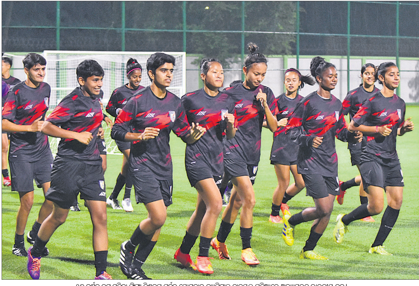
୧୭ ବର୍ଷରୁ କମ୍ ମହିଳା ଫିସା ବିଶ୍ୱକପ ପୂର୍ବରୁ ଯୋଗଦାନ କାପିଟାଲ ହାଲସ୍କୁଲ ପଢ଼ିଆରେ ଅଭ୍ୟାସରତ ଭାରତୀୟ ଦଳ।

ଧରଣୀର ଚା.୪.୧୦.୨୦୨୨ ସଂସ୍କରଣରେ ପ୍ରକାଶିତ 'ପୁରୁଣାକୁ ପୁଣି ସୁଯୋଗ' ଖବର ଉପରେ ଅର୍ଥ ବିଭାଗ ପକ୍ଷରୁ ପତ୍ର ସଂଖ୍ୟା ୨୪୯୩୭/୨୧୦୧୨୦୨୨ରେ ଏକ ସ୍ୱାସ୍ଥ୍ୟକରଣ ଦିଆଯାଇଛି। ଏଥିରେ ଉଲ୍ଲେଖ କରାଯାଇଛି, ଅର୍ଥ ବିଭାଗର ପତ୍ର ସଂଖ୍ୟା.୨୪୫୩୩/ଏଫ.ଡି.୨୯୮.୨୯୮୧୨୨ରେ ଅବସର ପରେ ନିଯୁକ୍ତି ପାଇଥିବା ସରକାରୀ କର୍ମଚାରୀଙ୍କ ପରିଶ୍ରମିକ ପୁନଃ ନିର୍ଦ୍ଧାରଣ କରାଯାଇଛି।