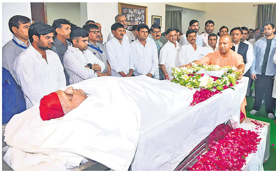
ସୈଫାଲ ଗ୍ରାମରେ ପୁଲାଇମଙ୍କ ମରଣର ପଞ୍ଚମ ଦିନରେ ଯୁପି ମୁଖ୍ୟମନ୍ତ୍ରୀ ଯୋଗୀ ଆଦିତ୍ୟନାଥ ଶ୍ରଦ୍ଧାଞ୍ଜଳି ଦେଉଛନ୍ତି।