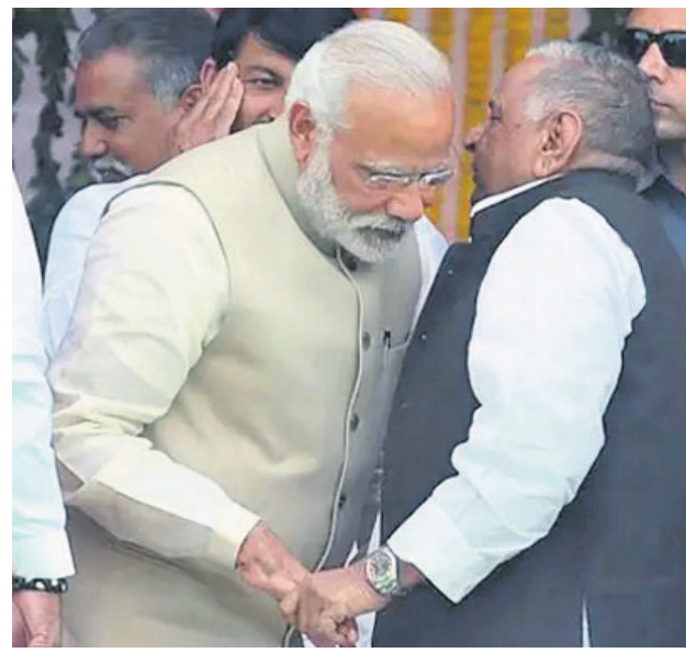
୨୦୧୭ ମାର୍ଚ୍ଚ ୧୯ରେ ମୁଖ୍ୟମନ୍ତ୍ରୀ ଯୋଗୀ ଆଦିତ୍ୟନାଥଙ୍କ ଶପଥ ଗ୍ରହଣ ଉତ୍ସବରେ ପ୍ରଧାନମନ୍ତ୍ରୀ ନରେନ୍ଦ୍ର ମୋଦିଙ୍କ ସହ ପୁଲାଇମ ସିଂ ଯାଦବଙ୍କ ବହୁଚର୍ଚ୍ଚିତ ଫଟୋ।

ବର୍ଷାଋତୁ ନେତା ପୁଲାଇମ ସିଂ ଯାଦବଙ୍କ ପରଲୋକ ଦେଶ ପାଇଁ ବଡ଼ କ୍ଷତି ପ୍ରଧାନମନ୍ତ୍ରୀ ନରେନ୍ଦ୍ର ମୋଦି ତାଙ୍କ ଶୋକବାଚୀରେ କହିଛନ୍ତି। ଦୀର୍ଘ ରାଜନୈତିକ କ୍ୟାରିୟରରେ ସେ ଭାରତ ପାଇଁ କିଛି କିଛି କଣିକା ଥିଲେ ମଧ୍ୟ ମୋଦିଙ୍କ ସହ ତାଙ୍କର ସ୍ୱତନ୍ତ୍ର ସମ୍ପର୍କ ରହିଥିଲା। ଉଭୟ ଏକ ସମୟରେ ମୁଖ୍ୟମନ୍ତ୍ରୀ ଥିବାବେଳେ ପରସ୍ପର ସହ ଭଲ ସମ୍ପର୍କ ରହିଥିଲା। ୨୦୧୪ରେ ମୋଦି ପ୍ରଧାନମନ୍ତ୍ରୀ ହେବା ବେଳେ ସମାଜବାଦୀ ପ୍ରତିଷ୍ଠାତା ତାଙ୍କୁ ଆଶୀର୍ବାଦ କରିଥିଲେ। ତାଙ୍କର ଆଶୀର୍ବାଦ ଓ ଉପଦେଶକୁ ମନେ ରଖିଥିବା ମୋଦି କହିଛନ୍ତି। ୨୦୧୯ରେ ମୋଦି ପୁଣି କ୍ଷମତାକୁ ଫେରିବେ ବୋଲି ପୁଲାଇମ କାମନା କରିଥିଲେ।