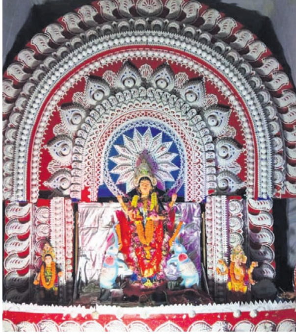
ବାଲୁଗାଁ ବଜାର ଫଳ ବ୍ୟବସାୟୀ ସଂଘ।