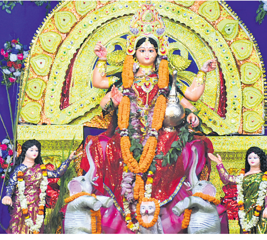
ଧୁବି-୧ ମା' ମଙ୍ଗଳା ଗଜଲକ୍ଷ୍ମୀ ପୂଜା କମିଟି।