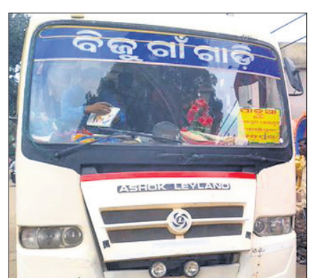
ଏପରିକି ୨ୟ ପର୍ଯ୍ୟାୟରେ ମାଠିବାଦୀ ପ୍ରଭାବିତ ଅଞ୍ଚଳର ୫ଟି ଲୋକ ବେବଗଡ଼, ଗଜପତି, ନୂଆପଡ଼ା, ସୁନ୍ଦରଗଡ଼ ଓ ସମଲପୁରର ଆଉ ୨୮ଟି ବ୍ଲକରେ ୩୦ଟି ବସ ରାଜ୍ୟ ସଡ଼କ ପରିବହନ ବିଭାଗରୁ ଯୋଗାଇ ଦିଆଯାଇଥିଲା ।

ରାଜ୍ୟର ଗ୍ରାମାଞ୍ଚଳ ଏବଂ ଦୁର୍ଗମ ଅଞ୍ଚଳରେ ରହୁଥିବା ଲୋକଙ୍କ ପାଇଁ ଗମନାଗମନ ସୁବିଧା କରାଇବା ଉଦ୍ଦେଶ୍ୟରେ ରାଜ୍ୟ ସରକାର ୨୦୧୪ ଫେବୃଆରୀରେ ବିଜୁ ଗାଁ ଗାଡ଼ି ଯୋଜନା ଆରମ୍ଭ କରିଥିଲେ । ବିଶେଷକରି ରାଜ୍ୟର ଉପାଡ଼ ଅଞ୍ଚଳର ଅର୍ଥନୈତିକ ଉନ୍ନତି କରିବା ସହ ଗ୍ରାମାଞ୍ଚଳରେ ବାସ କରୁଥିବା ଯୁବକଙ୍କର କିପରି ସହର ସହିତ ଯୋଡ଼ି ହୋଇପାରିବେ ସେହି ଲକ୍ଷ୍ୟରେ ଆରମ୍ଭ ହୋଇଥିବା ବିଜୁ ଗାଁ ଗାଡ଼ି ଅନେକ ସ୍ଥାନରେ ଏବେ ଦେଖିବାକୁ ମିଳୁଛି । ଅପରପକ୍ଷରେ କରୋନା ଯୋଗୁଁ ବିଜୁ ଗାଁ ଗାଡ଼ି ଚଳାଉଥିବା ମାଲିକମାନେ ନେଇଥିବା ଗଣତନ୍ତ୍ର ଉଦ୍ଦେଶ୍ୟ ଏବଂ ଖୋଜି ଦେଇ ନ ପାରିବାରୁ ଗାଡ଼ିକୁ ନିଜ ହୋଇଯାଇଥିବା ବିଭାଗୀୟ ଅଧିକାରୀ କହୁଛନ୍ତି ।