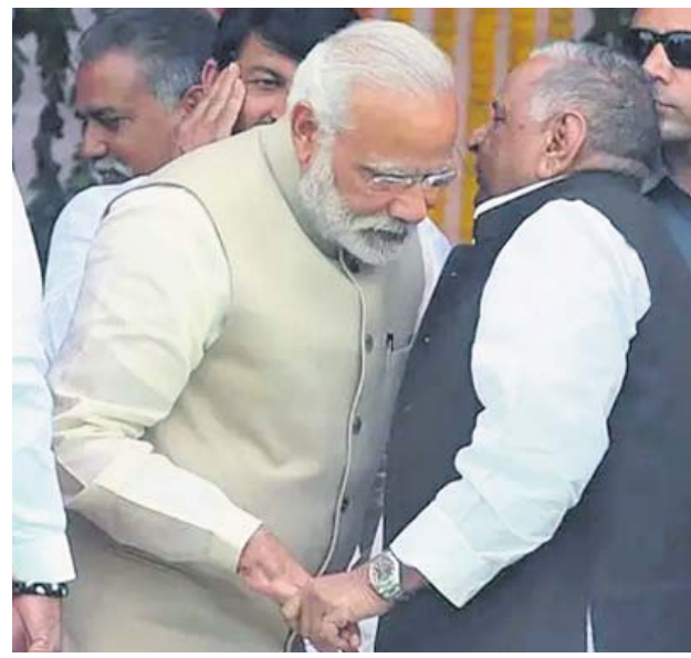
୨୦୧୭ ମାର୍ଚ୍ଚ ୧୯ରେ ମୁଖ୍ୟମନ୍ତ୍ରୀ ଯୋଗୀ ଆଦିତ୍ୟନାଥଙ୍କ ଶପଥ ଗ୍ରହଣ ଉତ୍ସବରେ ପ୍ରଧାନମନ୍ତ୍ରୀ ନରେନ୍ଦ୍ର ମୋଦିଙ୍କ ସହ ମୁଲାୟମ ସିଂ ଯାଦବଙ୍କ ବହୁଚର୍ଚ୍ଚିତ ଫଟୋ।

ବର୍ଷାଯାନ ନେତା ମୁଲାୟମ ସିଂ ଯାଦବଙ୍କ ପରଲୋକ ଦେଶ ପାଇଁ ବଡ଼ କ୍ଷତି ବୋଲି ପ୍ରଧାନମନ୍ତ୍ରୀ ନରେନ୍ଦ୍ର ମୋଦି ତାଙ୍କ ଶୋକବାଚାରେ କହିଛନ୍ତି। ଦୀର୍ଘ ରାଜନୈତିକ କ୍ୟାରିୟରରେ ସେ ଭାଜପା ବିରୋଧୀ ଭାବେ ଜଣାଶୁଣା ଥିଲେ ମଧ୍ୟ ମୋଦିଙ୍କ ସହ ତାଙ୍କର ସ୍ୱତନ୍ତ୍ର ସମ୍ପର୍କ ରହିଥିଲା। ଉଭୟ ଏକ ସମୟରେ ମୁଖ୍ୟମନ୍ତ୍ରୀ ଥିବାବେଳେ ପରସ୍ପର ସହ ଭଲ ସମ୍ପର୍କ ରହିଥିଲା। ୨୦୧୪ରେ ମୋଦି ପ୍ରଧାନମନ୍ତ୍ରୀ ହେବା ବେଳେ ସମାଜବାଦୀ ପ୍ରତିଷ୍ଠାତା ତାଙ୍କୁ ଆଶୀର୍ବାଦ କରିଥିଲେ। ତାଙ୍କର ଆଶୀର୍ବାଦ ଓ ଉପଦେଶକୁ ମନେ ରଖିଥିବା ମୋଦି କହିଛନ୍ତି। ୨୦୧୯ରେ ମୋଦି ପୁଣି କ୍ଷମତାକୁ ଫେରିବେ ବୋଲି ମୁଲାୟମ କାମନା କରିଥିଲେ।