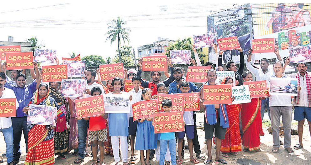
ପକାଣ୍ଡଶା ବିକ୍ରେତୁ ରସୁଲଗଡ଼ ଓ ଭରତବିକ୍ରମ ପର୍ଯ୍ୟନ୍ତ କାମାନ୍ତ ରାଜପଥରେ ସୃଷ୍ଟି ହୋଇଥିବା ଗ୍ରାମିକ କାମ । କାମାନ୍ତ ରାଜପଥର ପକାଣ୍ଡଶା ଛକ ନିକଟରେ ବାରମ୍ବାର ଦୁର୍ଘଟଣା ଘଟି ବହୁ ଧନକାନ୍ଦନ ହାତ ହେଉଥିବାରୁ ସେଠାରେ ଏକ ଫୁଟ ଓଭରବ୍ରିଜ୍ ଦାବିରେ ସ୍ଥାନୀୟ ଲୋକେ ଦୁର୍ଗାମଣ୍ଡପ ସମ୍ମୁଖରେ ପ୍ରଦର୍ଶନ କରିଛନ୍ତି ।