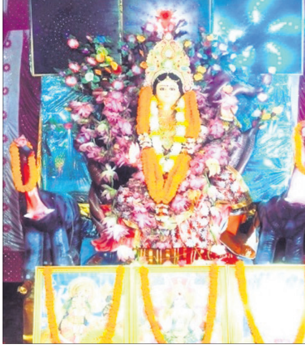
ବାଲୁଗାଁ ଗୋପିନାଥପୁର ଛକ ସ୍ଥିତ ମା' ଗଜଲକ୍ଷ୍ମୀ ପୂଜା କମିଟି।