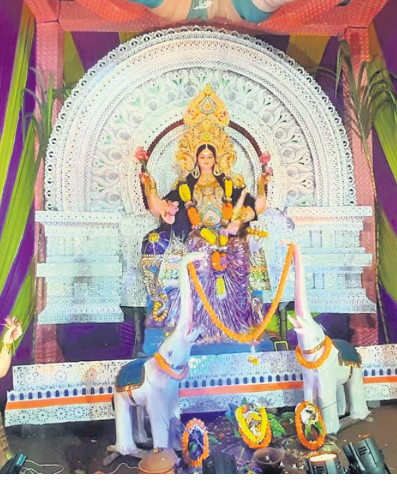
ଖୋର୍ଦ୍ଧା ପୁରୁଣା ମେଡିକାଲ ରୋଡ଼।