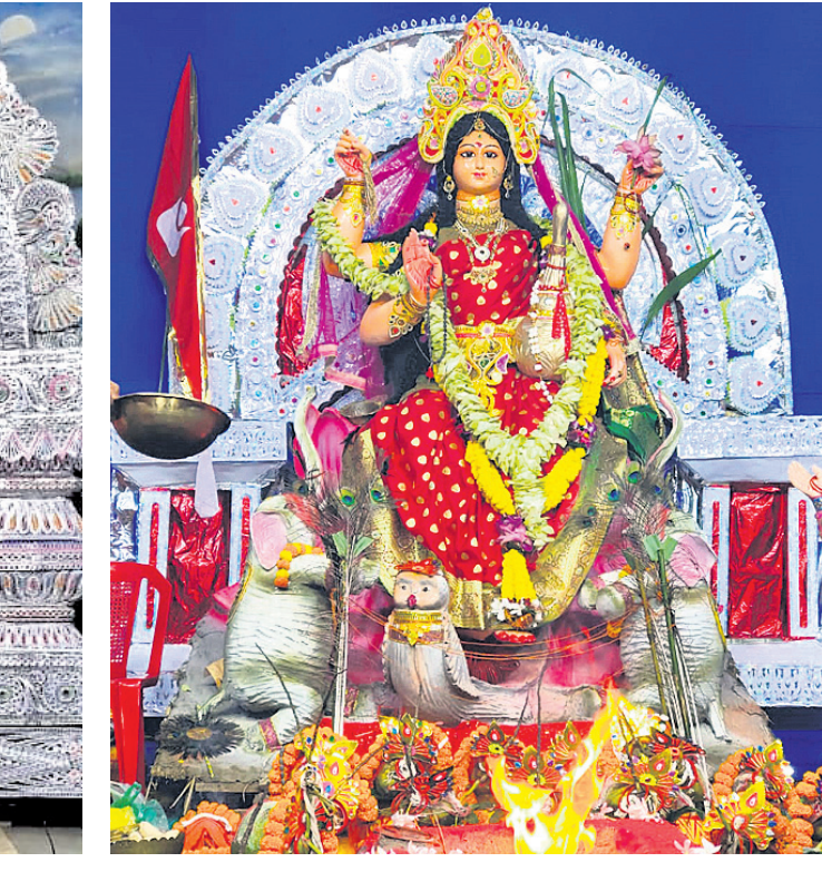
ବାଙ୍କୁଆଳ ଗଜଲକ୍ଷ୍ମୀ ପୂଜା କମିଟି।