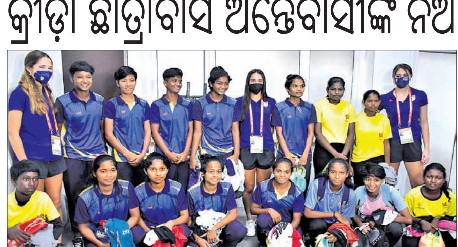
କ୍ରୀଡ଼ା ଛାତ୍ରାବାସ ଅନ୍ତେବାସୀଙ୍କ ସହ ଆମେରିକା ଖେଳାଳି ।

(ମଙ୍ଗଳବାର ମ୍ୟାଚ) ମରୋକ୍କୋ ବନାମ ବ୍ରାଜିଲ ଘାଣ୍ଟାୟ: ଭୁବନେଶ୍ୱର, ସମୟ: ଅପରାହ୍ନ ୪ଟା ୩୦ ଭାରତ ବନାମ ଆମେରିକା ଘାଣ୍ଟାୟ: ଭୁବନେଶ୍ୱର, ସମୟ: ରାତି ୮ଟା ଚିଲି ବନାମ ଚିଲିକାଣ୍ଡ ଘାଣ୍ଟାୟ: ମାର୍ଗାଓ, ସମୟ: ଅପରାହ୍ନ ୪ଟା ୩୦ ଜର୍ମାନୀ ବନାମ ନାଇଜେରିଆ ଘାଣ୍ଟାୟ: ମାର୍ଗାଓ, ସମୟ: ରାତି ୮ଟା