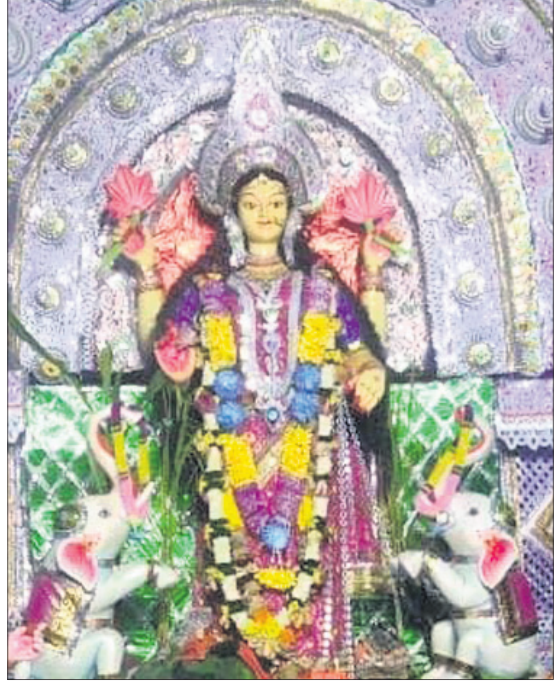
ବୋଲଗଡ଼ ବୁକ୍ ଧନାପଥର ଲକ୍ଷ୍ମୀବଜାର ଗଜଲକ୍ଷ୍ମୀ ପୂଜା କମିଟି।