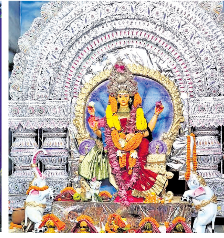
ପୋଖରୀପୁର ଭୂଆପୁଣୀ ମୁଖ୍ୟ କ୍ଷେତ୍ର।