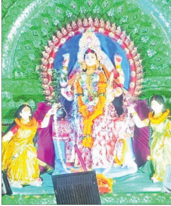
ବାଲୁଗାଁ ପାଟଣା ସାହି।