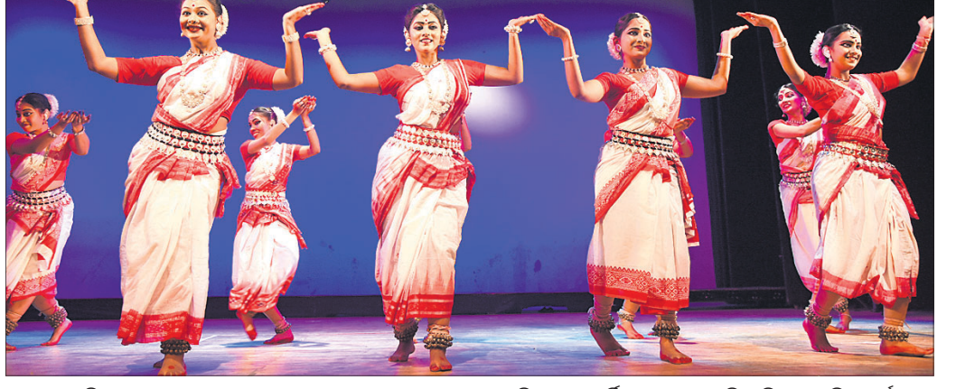
କପୁରବା ନାରିମହଲ ପକ୍ଷରୁ ଭୁବନେଶ୍ୱର ରବୀନ୍ଦ୍ର ମଣ୍ଡପରେ ସୋମବାର ଆୟୋଜିତ କୁମାରପୂର୍ଣ୍ଣିମା ଉତ୍ସବରେ ପରିବେଷିତ ସାଂସ୍କୃତିକ କାର୍ଯ୍ୟକ୍ରମ ।