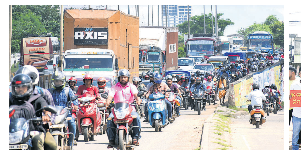
ପକାଣ୍ଡଶା ବିକ୍ରେତୁ ରସୁଲଗଡ଼ ଓ ଭରତବିକ୍ରମ ପର୍ଯ୍ୟନ୍ତ କାମାନ୍ତ ରାଜପଥରେ ସୃଷ୍ଟି ହୋଇଥିବା ଗ୍ରାମିକ କାମ । କାମାନ୍ତ ରାଜପଥର ପକାଣ୍ଡଶା ଛକ ନିକଟରେ ବାରମ୍ବାର ଦୁର୍ଘଟଣା ଘଟି ବହୁ ଧନକାନ୍ଦନ ହାତ ହେଉଥିବାରୁ ସେଠାରେ ଏକ ଫୁଟ ଓଭରବ୍ରିଜ୍ ଦାବିରେ ସ୍ଥାନୀୟ ଲୋକେ ଦୁର୍ଗାମଣ୍ଡପ ସମ୍ମୁଖରେ ପ୍ରଦର୍ଶନ କରିଛନ୍ତି ।