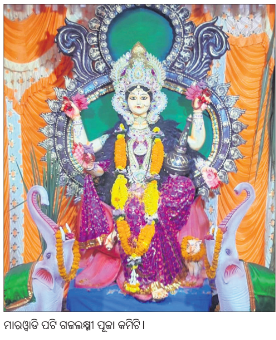
ମାରଖତି ପତି ଗଜଲକ୍ଷ୍ମୀ ପୂଜା କମିଟି।