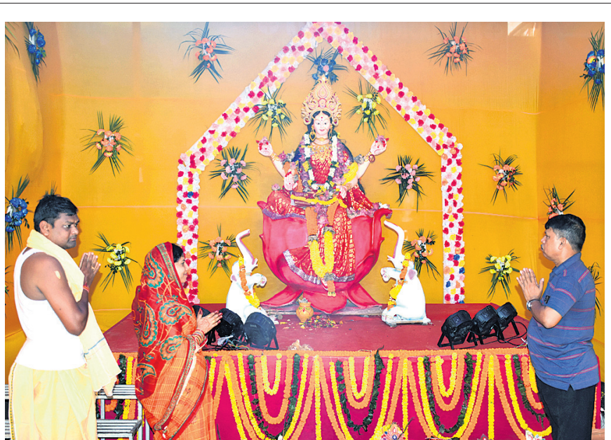
ଭୁବନେଶ୍ୱର ଜଗନ୍ନାଥ ନଗର ମେନ୍‌ ରୋଡ଼ ସାମନ୍ତରାୟ ମାର୍କେଟ୍‌ କମ୍ପ୍ଲେକ୍ସରେ ପୂଜା ପାଉଥିବା ମା' ଗଜଲକ୍ଷ୍ମୀ।