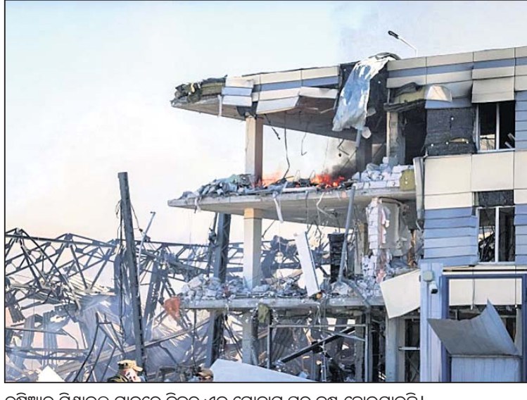
ରୁଷିଆର ମିଶାଇଲ ମାଡ଼ରେ କିଭର ଏକ ଗୋଦାମ ଘର ନଷ୍ଟ ହୋଇଯାଇଛି।

କିଭ, ୧୦୧୦ କହିଛନ୍ତି। ବେଲାଋଷ ସୀମାରେ ଆକ୍ରମଣ ପାଇଁ ୟୁକ୍ରେନ ଯୋଜନା କରୁଛି। କିଭ ମିନିଷ୍ଟ୍ରୁ ମୁକ୍ତ ଭିତରକୁ ଚାଲି ବୋଲି ତଥାକଥିବା ୟୁକ୍ରେନ ପ୍ରଫୁଟି କରିଛି। ଆମେ ଦଶନ୍ଧି ଧରି ଏଥିପାଇଁ ପ୍ରସ୍ତୁତ କରିଛୁ। ଆବଶ୍ୟକ ପଡ଼ିଲେ ବେଲାଋଷ ମଧ୍ୟ ଜବାବ ଦେବ ବୋଲି ଲୁକାଶେଙ୍କୋ କହିଛନ୍ତି। ବେଲାଋଷ ସୈନ୍ୟ ରୁଷିଆ ସଶସ୍ତ୍ର ବଳ ସହ ମିଶି ଉତ୍ତର ୟୁକ୍ରେନରେ ସାମରିକ କାର୍ଯ୍ୟକଳାପ କରିବା ଦ୍ୱାରା ଉତ୍ତରଜନା ଆହୁରି ବୃଦ୍ଧି ପାଇବା ଆଶଙ୍କା ରହିଛି।