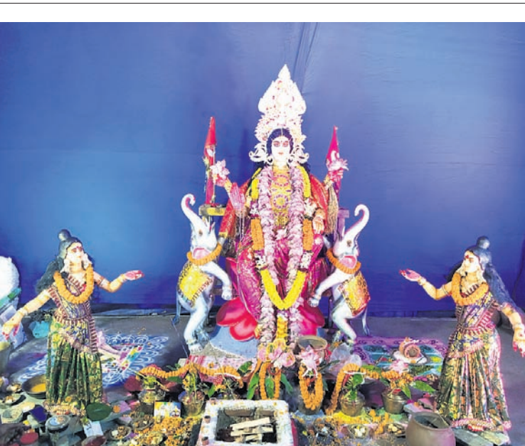
ବଡ଼ଗଡ଼ ବ୍ରିକ୍‌ କଲୋନୀ ଜ୍ୟୋତି କ୍ଷେତ୍ର।