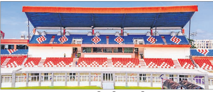
ନୂଆ ରୂପରେ କଳିଙ୍ଗ ଷ୍ଟାଡ଼ିୟମ ଗଢାଲେବି।

ଭୁବନେଶ୍ୱର, ୧୦୧୦ (ଗ୍ରାମା ପ୍ରତିନିଧି) ପ୍ରତୀକ୍ଷାର ଅବସାନ ଘଟିବାକୁ ଯାଉଛି। ଭାରତ ସମେତ ଓଡ଼ିଶାରେ ପ୍ରଥମଥର ପାଇଁ ହେବାକୁ ଯାଉଛି ୧୭ ବର୍ଷରୁ କମ୍ ମହିଳା ଫିଫା ବିଶ୍ୱକପ। ଆଇକନିକ୍ କଳିଙ୍ଗ ଷ୍ଟାଡ଼ିୟମରେ ପୂର୍ବରୁ ମହିଳା ଗୋଲ୍ଡକପ୍ ପୁରସ୍କାର ଏବଂ ୨୦ ବର୍ଷରୁ କମ୍ ସାଥ୍ (ସାଉଥ୍ ଏସିଆନ୍ ପୁରସ୍କାର ଫେଡେରେଶନ) ଚାମ୍ପିୟନଶିପ୍ ଅନୁଷ୍ଠିତ ହୋଇଥିବାବେଳେ ଏବେ ଏଥିରେ ଯୋଡ଼ିହେବାକୁ ଯାଉଛି ଫିଫା ମହିଳା ବିଶ୍ୱକପରୁ ଭୁବନେଶ୍ୱର ପ୍ରତିଯୋଗିତା। ହକି ବିଶ୍ୱକପ୍ ସମେତ ଡକ୍ଟରମଣି ରାଜ୍ ଅନ୍ତର୍ଜାତୀୟ ପ୍ରତିଯୋଗିତା ଆୟୋଜନର ମୁକ୍ତସାକ୍ଷୀ ରହିସାରିଥିବା କଳିଙ୍ଗରେ ଏଥର ଦେଖିବାକୁ ମିଳିବ ବିଶ୍ୱର ଉଦ୍ୟମାନ ମହିଳା ପୁରସ୍କାର ଚାରକାଳ ଆକ୍ରମଣ ରୋମାଞ୍ଚ। ପ୍ରଥମ ଶ୍ରମିକ ସଂଘର ସମାପନ ପାଇଁ ଆଉ ଭାରତ ଏହାର ସମସ୍ତ ମ୍ୟାଚ୍ କଳିଙ୍ଗରେ ଖେଳିବ। ମଙ୍ଗଳବାର