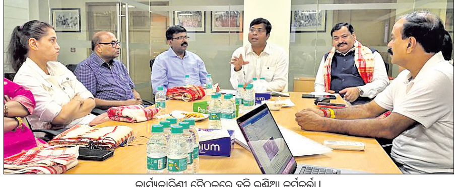
କାର୍ଯ୍ୟକାରୀ ଗୋଟିଏରେ ହକି ଇଣ୍ଡିଆ କର୍ମକର୍ତ୍ତା।