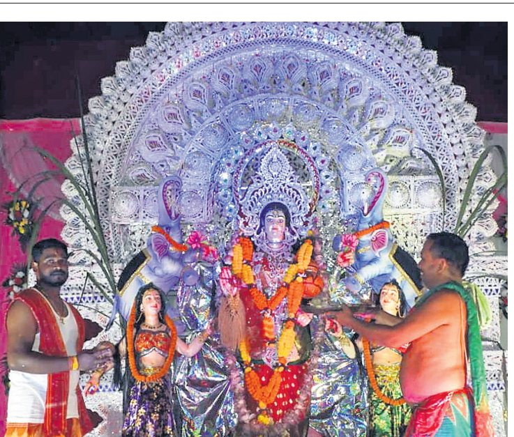
ରଘୁନାଥପୁର ଗ୍ରାମପଞ୍ଚାୟତ ପକ୍ଷରୁ ମା' ଗଜଲକ୍ଷ୍ମୀଙ୍କ ପୂଜା।