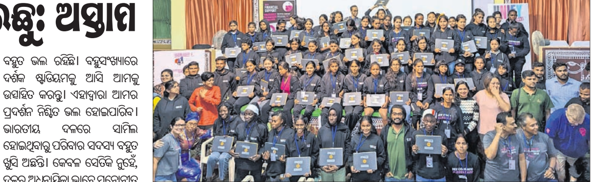
କ୍ରୀଡ଼ାବୃତ୍ତି ପାଇଁ ଖେଳ ଦେଖିବାକୁ ଯୋଗ୍ୟ ବିବେଚିତ ହୋଇଥିବା ବାଳିକାମାନେ ।

ବହୁତ ଭଲ ରହିଛି। ବହୁସଂଖ୍ୟାରେ ଦର୍ଶକ ଷ୍ଟାଡ଼ିୟମକୁ ଆସି ଆମକୁ ଉତ୍ସାହିତ କରନ୍ତୁ। ଏହାଦ୍ୱାରା ଆମର ପ୍ରଦର୍ଶନ ନିଶ୍ଚିତ ଭଲ ହୋଇପାରିବ। ଭାରତୀୟ ଦଳରେ ସାମିଲ ହୋଇଥିବା ବିପକ୍ଷର ସଦସ୍ୟ ବହୁତ ଖୁସି ଅଛନ୍ତି। କେବଳ ସେତିକି ନୁହେଁ, ଦଳର ଅଧିନାୟିକା ଭାବେ ମନୋନୀତ ହୋଇଥିବା ଆମ ଗାଁ ଲୋକମାନେ ଅତ୍ୟନ୍ତ ଆନନ୍ଦିତ। ସେମାନେ ମ୍ୟାଚ ଦେଖିବା ପାଇଁ ବ୍ୟକ୍ତୀତର ସହ ଅପେକ୍ଷା କରିଛନ୍ତି। ଏଠାରେ ଆମେ ମଧ୍ୟ ଆମେରିକା ବିପକ୍ଷ ମ୍ୟାଚକୁ ଆଗ୍ରହ ସହ ଅପେକ୍ଷା କରିଛୁ। ପ୍ରଥମ ମ୍ୟାଚରେ ଭଲ କରିପାରିଲେ ଆମକୁ ଆଗକୁ ବଢ଼ିବା ସହଜ ହେବ।