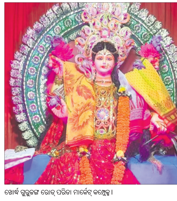
ଖୋର୍ଦ୍ଧା ଗୁରୁଜଙ୍ଗ ରୋଡ଼ ପରିତା ମାର୍କେଟ୍ କମ୍ପ୍ଲେକ୍ସ।