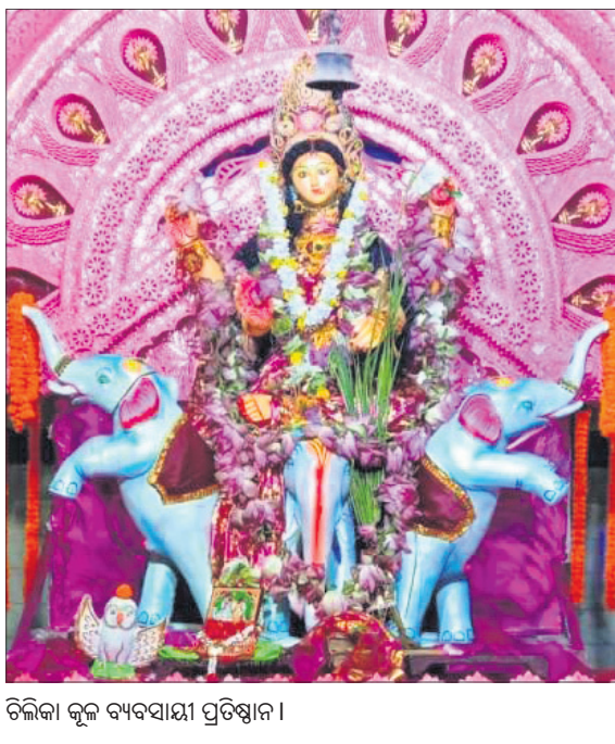
ଚିଲିକା କୁଳ ବ୍ୟବସାୟୀ ପ୍ରତିଷ୍ଠାନ।