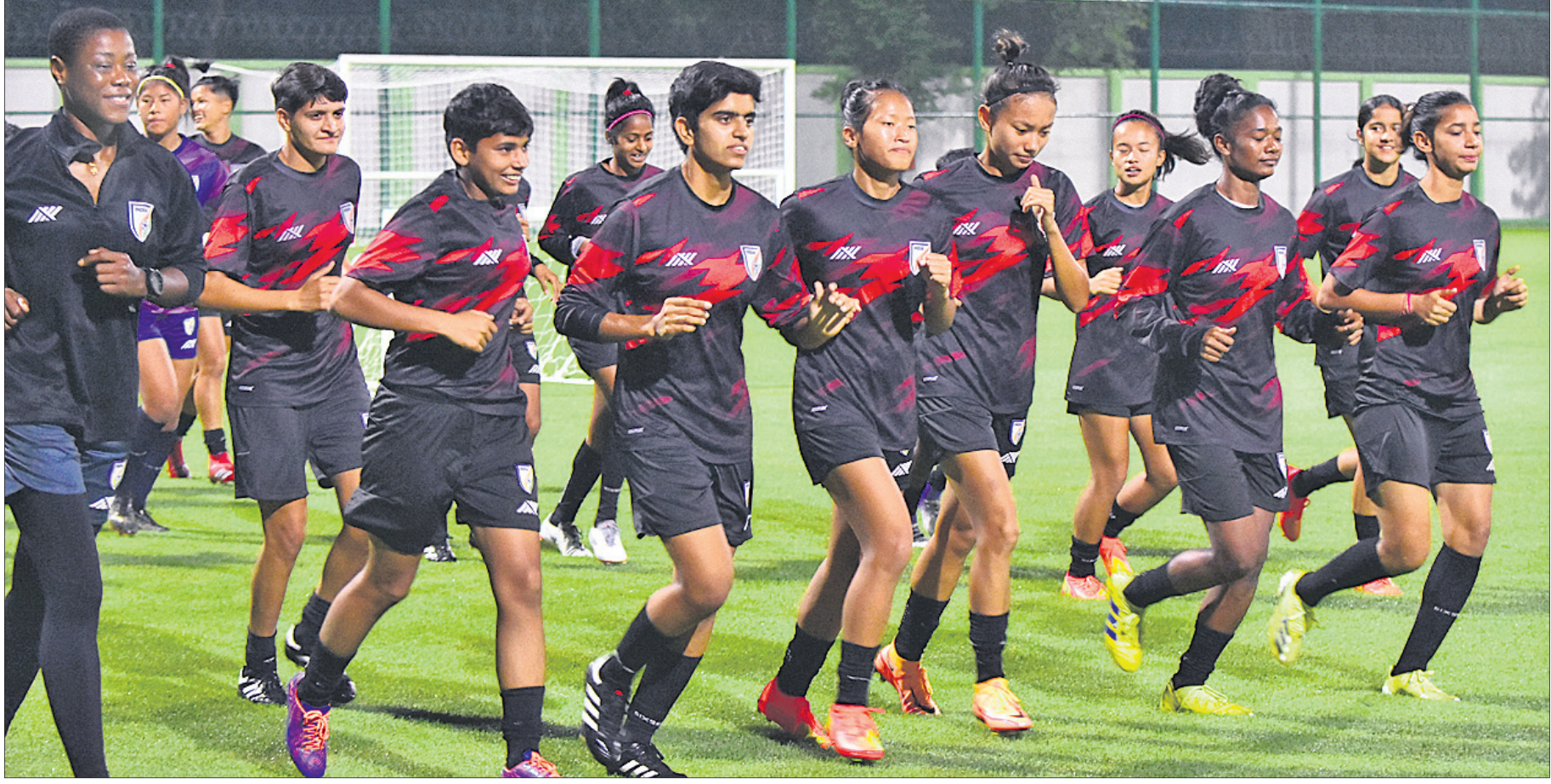
୧୭ ବର୍ଷରୁ କମ୍ ମହିଳା ଫିଫା ବିଶ୍ୱକପ୍ ପୂର୍ବରୁ ସୋମବାର କ୍ୟାମ୍ପରେ ହାଲସ୍ତୁଲ ପଡ଼ିଆରେ ଅଭ୍ୟାସରତ ଭାରତୀୟ ଦଳ ।

ମହିଳା ପୁରସ୍କାର ରାଜ୍ୟ ଷ୍ଟାର୍ସ ମେଳା ପ୍ରତିଯୋଗିତା ଆୟୋଜନ ପାଇଁ କଳିଙ୍ଗ ଷ୍ଟାଡ଼ିୟମ ପ୍ରସ୍ତୁତ। ଏଠାରେ ମଙ୍ଗଳବାରଠାରୁ ଆରମ୍ଭ ହେବାକୁ ଯାଉଛି ୧୭ ବର୍ଷରୁ କମ୍ ମହିଳା ଫିଫା ବିଶ୍ୱକପ୍ ଭାରତ ସମେତ ଆମେରିକା, ମରୋକ୍କୋ, ବ୍ରାଜିଲ, ଚିଲି ଓ ନାଇଜେରିଆ ଦଳ କଳିଙ୍ଗରେ ଖେଳିବେ ।