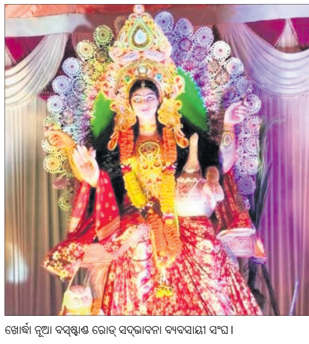
ଖୋର୍ଦ୍ଧା ନୂଆ ବସଷ୍ଟାଣ୍ଡ ରୋଡ଼ ସଦ୍‌ଭାବନା ବ୍ୟବସାୟୀ ସଂଘ।