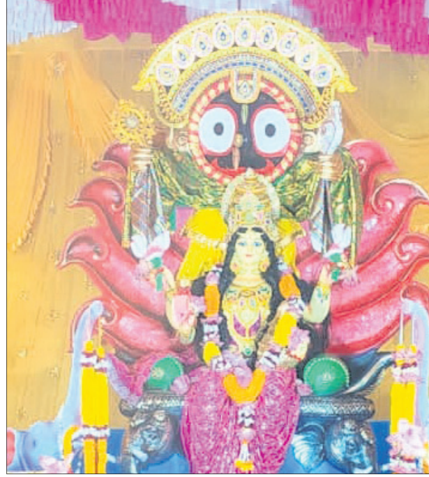
ବେଗୁନିଆ ବଜାର ଗଜଲକ୍ଷ୍ମୀ ପୂଜା କମିଟି।