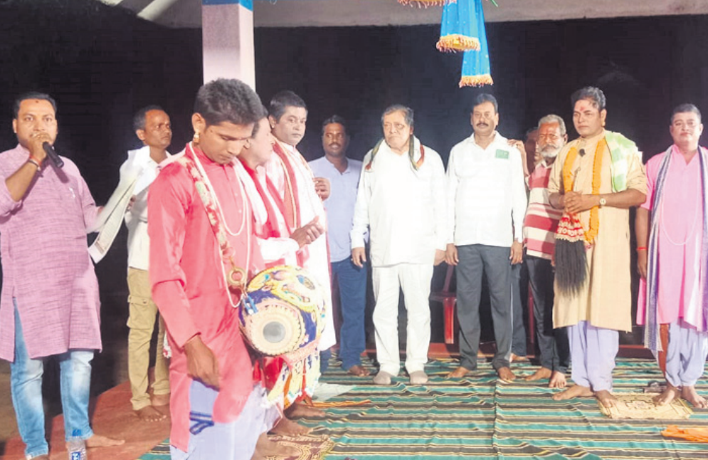
ନିରାକାରପୁର: ବାଲିଗାଡ଼ିଆ ଗ୍ରାମ ସ୍ଥିତ ଲକ୍ଷ୍ମୀନାରାୟଣ ମନ୍ଦିର ପ୍ରାଙ୍ଗଣରେ ସତ୍ୟନାରାୟଣ ଦେବଙ୍କ ପାଇଁ ମହାସାଧବର ଉଦ୍‌ଘାଟନା ଉତ୍ସବରେ ଯୋଗଦେଇଥିବା ଦୁଇ ବିଧାୟକ ଓ ଅନ୍ୟମାନେ।