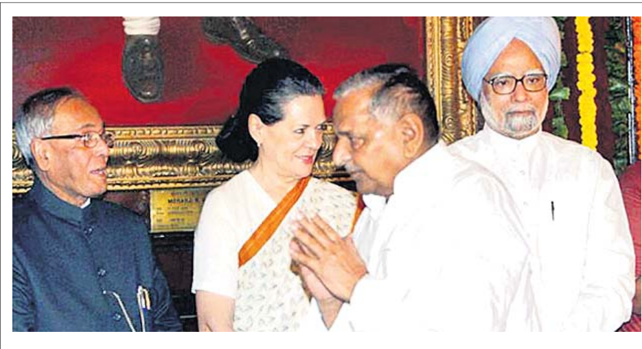
୨୦୧୨ ଜୁନରେ ତତ୍କାଳୀନ ଅର୍ଥମନ୍ତ୍ରୀ ପ୍ରଣବ ମୁଖାର୍ଜୀ, ଉପାଧ୍ୟକ୍ଷା ସୋନିଆ ଗାନ୍ଧୀ ଓ ପୂର୍ବତନ ପ୍ରଧାନମନ୍ତ୍ରୀ ମନମୋହନ ସିଂଙ୍କ ସହ ମୁଲାୟମ।

ଦଳରେ ନେତାଜୀ ଭାବେ ପରିଚିତ ମୁଲାୟମ ସିଂ ଯାଦବଙ୍କ ୫୫ ବର୍ଷର ରାଜନୈତିକ କ୍ୟାରିୟର କେବଳ ରାଜ୍ୟ ରାଜନୀତିରେ ସୀମିତ ନ ଥିଲା। ଏକଦା ଜାତୀୟ ରାଜନୀତିରେ ମଧ୍ୟ ତାଙ୍କର ପ୍ରଭାବ ରହିଥିଲା। ସେ ଦୁଇଥର ପ୍ରଧାନମନ୍ତ୍ରୀ ହେଉ ହେଉ ରହିଯାଇଥିଲେ। ୧୯୯୬ରେ ମିଳିତ ସାମ୍ବନ୍ଧୀୟ ସରକାର ଗଢ଼ିବାକୁ ଥିବାବେଳେ ପ୍ରଧାନମନ୍ତ୍ରୀ ପଦ ଲାଗି ମୁଲାୟମଙ୍କ ନାଁ ଉଠିଥିଲା। ତେବେ ଆରଜେଡି ସୁପ୍ରିମୋ ଲାଲୁପ୍ରସାଦ ଯାଦବ ଏବଂ ଶରଦ