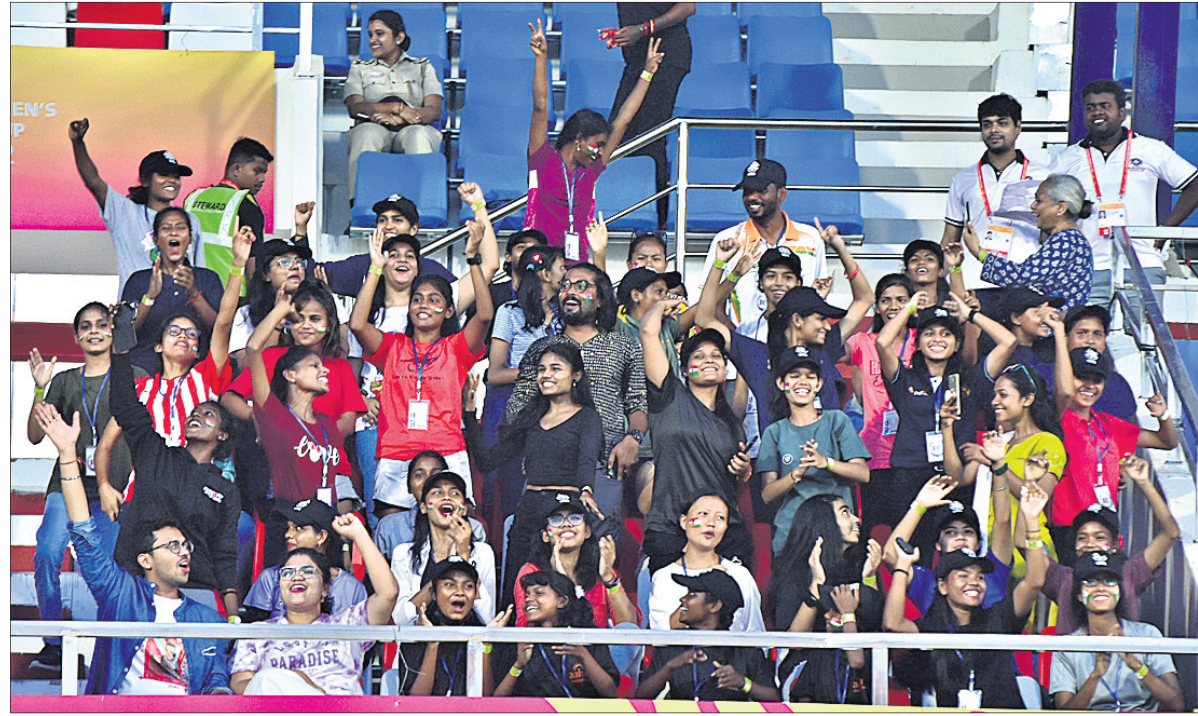
କଳିଙ୍ଗ ଷ୍ଟାଡ଼ିୟମରେ ଫିଫା ୧୭ ବର୍ଷରୁ କମ୍ ମହିଳା ବିଶ୍ୱକପ ଉଦ୍‌ଘାଟନା ଉତ୍ସବର ଆରମ୍ଭରେ କାର୍ଯ୍ୟକ୍ରମ। ମ୍ୟାଚର ମଜା ନେଉଛନ୍ତି ଦର୍ଶକ।