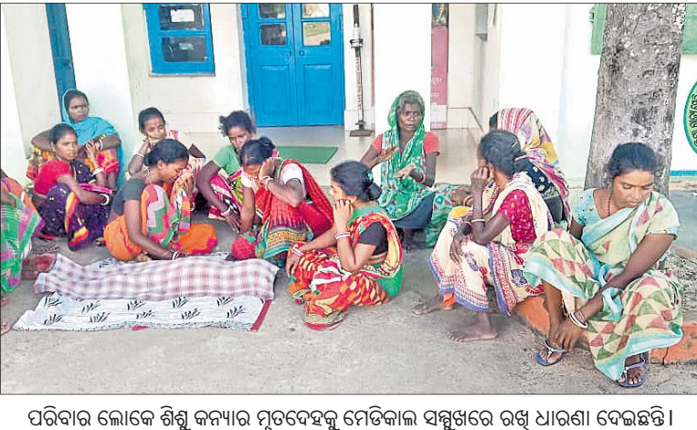
ପରିବାର ଲୋକେ ଶିଶୁ କନ୍ୟାଙ୍କ ମୃତଦେହକୁ ମେଡିକାଲ ସମ୍ବନ୍ଧରେ ରଖି ଧାରଣା ଦେଇଛନ୍ତି।

ବାଲେଶ୍ଵର ଜିଲ୍ଲା ନୀଳଗିରି ଉପଖଣ୍ଡ ଅଧୀନ ବରହମପୁର ଗୋଷ୍ଠୀ ସ୍ଵାସ୍ଥ୍ୟକେନ୍ଦ୍ରରେ ଚିକିତ୍ସା ଅବହେଳାକୁ ଜଣେ ୫ବର୍ଷର ଶିଶୁକନ୍ୟା ମୃତ୍ୟୁ ହୋଇଥିବା ଅଭିଯୋଗ ହୋଇଛି।