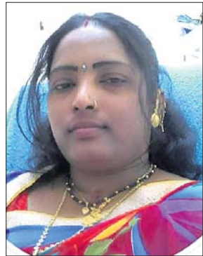
ଗଞ୍ଜାମ, ୧୧/୧୦/୨୧ (ଡି.ଏନ.ଏ.)