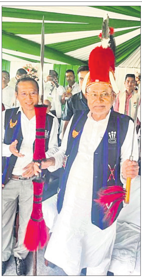
ନାଗାଲାଣ୍ଡ ଛେଡିୟୁ ପକ୍ଷରୁ ଡିମାପୁରଠାରେ ମଙ୍ଗଳବାର ଲୋକନାୟକ କରପ୍ରକାଶ ନାରାୟଣଙ୍କ ଜୟନ୍ତୀ ଉତ୍ସବରେ ଯୋଗଦେଇଛନ୍ତି ବିହାର ମୁଖ୍ୟମନ୍ତ୍ରୀ ନୀତୀଶ କୁମାର।