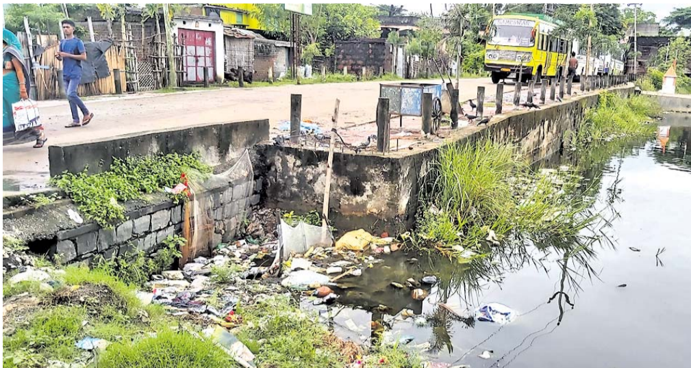
ଏନ୍‌ଏସି ପଛପଟ ପୋଖରୀରେ ପଲିଥିନ ଓ ଆବର୍ଜନା ଭର୍ତ୍ତି ହୋଇଛି।

୨୦୧୪ରେ ପ୍ରଥମ ଥର ପାଇଁ ସ୍ୱଚ୍ଛ ଭାରତ ନିଗମ ପୁରସ୍କାର ପାଇଁ ୭୦ଟି ଅଧିକାରୀ ଏବଂ ଏନ୍‌ଏସି ଅଧ୍ୟକ୍ଷ ପୁରସ୍କାର ଧରି ଫେରିବା ପରେ ବେଲଗୁଣ୍ଡାରେ ଏକ ଶୋଭାଯାତ୍ରା ହୋଇଥିଲା। ବିଶେଷକରି ଶାସକ ଦଳର କର୍ମୀମାନେ ବେଶ୍ ଭୟାବୃତ ହୋଇଥିଲେ। ୨୦୧୪ରୁ ସ୍ୱଚ୍ଛ ଭାରତ ନିଗମ ମାଧ୍ୟମରେ ସହର ସୁତ୍ଥକୁ ବିକଳ ବର୍ଗରେ ପୁରସ୍କୃତ କରାଯାଇଛି। ଯେତିକି ପୁରସ୍କୃତ ହୋଇଥିଲା ସେତିକି ପୁରସ୍କୃତ ହୋଇନାହିଁ। ସହରର ସର୍ବୋତ୍ତମ ସ୍ୱଚ୍ଛତା ପାଇଁ ପୁରସ୍କୃତ ହୋଇଥିଲା। ପ୍ରତିବର୍ଷ ନିର୍ଦ୍ଦିଷ୍ଟ କେତକ ରାସ୍ତା କଡ଼ରେ ଅଧିକାରୀ ଏବଂ ଏନ୍‌ଏସି ଅଧ୍ୟକ୍ଷ ପୁରସ୍କାର ଧରି ଫେରିବା ପରେ ବେଲଗୁଣ୍ଡାରେ ଏକ ଶୋଭାଯାତ୍ରା ହୋଇଥିଲା। ବିଶେଷକରି ଶାସକ ଦଳର କର୍ମୀମାନେ ବେଶ୍ ଭୟାବୃତ ହୋଇଥିଲେ। ୨୦୧୪ରୁ ସ୍ୱଚ୍ଛ ଭାରତ ନିଗମ ମାଧ୍ୟମରେ ସହର ସୁତ୍ଥକୁ ବିକଳ ବର୍ଗରେ ପୁରସ୍କୃତ କରାଯାଇଛି।