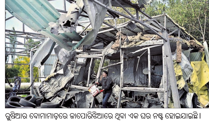
ରୁଷିଆର ବୋମାମାତ୍ରରେ କାପୋରିଡିଆରେ ଥିବା ଏକ ଘର ନଷ୍ଟ ହୋଇଯାଇଛି।

ଗାର୍ଟ କରୁଥିବା ସୁକ୍ରେନ୍ ପ୍ରତିରକ୍ଷା ମନ୍ତ୍ରଣାଳୟ ପକ୍ଷରୁ କୁହାଯାଇଛି। କେବଳ ଲିଭିଉଥିବା ବୁଲିଟି ଏନର୍ଜି ପ୍ରାପ୍ତିଗିରେ ୩ଟି ବିଦ୍ୟୋରଣ ହୋଇଛି। ଯୋମବାର ହୋଇଥିବା କ୍ଷେପଣାସ୍ତ୍ର ମାତ୍ରରେ ମୃତ୍ୟୁସଂଖ୍ୟା ୧୯ରେ ମଧ୍ୟ ଏହି ପୂର୍ବ ସୁରୋପାୟ ଦେଶର ବିଭିନ୍ନ ସହରରେ ବୋମା ବର୍ଷା କରିଛି। ସୁକ୍ରେନ୍ର ଶକ୍ତି ଭିତ୍ତିରୁ ମତ୍ୟୋ