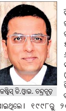
ଜଷ୍ଟିସ୍ ଡି.ଓ.ଇ. ଚନ୍ଦ୍ରବୃତ୍ତ

୨୦୧୬ରେ ଜଷ୍ଟିସ୍ ଚନ୍ଦ୍ରବୃତ୍ତ ସୁପ୍ରିମକୋର୍ଟ ବିଚାରପତି ଭାବେ ନିଯୁକ୍ତି ପାଇଥିଲେ। ଜଷ୍ଟିସ୍ ଲିଲିତଙ୍କ କାର୍ଯ୍ୟକାଳ ଶେଷ ହେବା ପରେ ନଭେମ୍ବର ୯ରେ ସେ ଦେଶର ୫୦ତମ ସିଜେଆଇ ଭାବେ ନିଯୁକ୍ତ ହେବେ। ୬୨ ବର୍ଷୀୟ ଚନ୍ଦ୍ରବୃତ୍ତ ହେଉଛନ୍ତି ଦେଶରେ ସର୍ବାଧିକ ସମୟ ସିଜେଆଇ ରହିଥିବା ଜଷ୍ଟିସ୍ ଡି.ଓ.ଇ. ଚନ୍ଦ୍ରବୃତ୍ତଙ୍କୁ ୧୯୯୮ରେ ଜଷ୍ଟିସ୍ ଡି.ଓ.ଇ. ଚନ୍ଦ୍ରବୃତ୍ତ ବୟେ ହାଇକୋର୍ଟଙ୍କ ଦ୍ୱାରା ବିଶ୍ୱ ଆଡଭୋକେଟ୍ ଭାବେ ପଦୋକ୍ତି ପାଇଥିଲେ। ୧୯୯୮ରୁ ୨୦୦୦ ମସିହା ପର୍ଯ୍ୟନ୍ତ ସେ ଆଡଭୋକେଟ୍ ସିଭିଲ୍ ଡିଭିଜନ୍ ଡିପ୍ୟୁଟି ଡି.ଓ.ଇ. ରହିଥିଲେ।