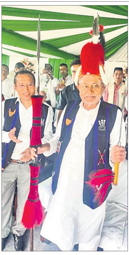
ନାଗାଲାଣ୍ଡ ଜେଡିସି ପକ୍ଷରୁ ଡିମାପୁରଠାରେ ମଙ୍ଗଳାକାର ଲୋକନାୟକ କରପ୍ରକାଶ ନାରାୟଣଙ୍କ କର୍ମଶ୍ରୀ ଉଦ୍‌ଘାଟନ...