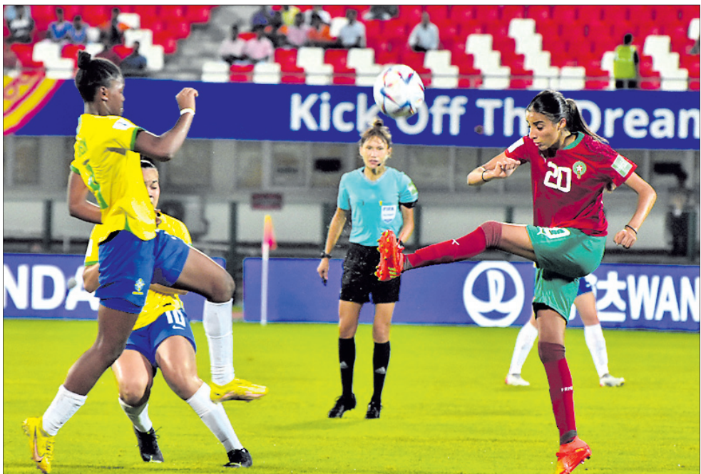
ବ୍ରାଜିଲ ଓ ମରକ୍କୋ ମଧ୍ୟରେ ଅନୁଷ୍ଠିତ ମ୍ୟାଚର ଏକ ସଂଘର୍ଷପୂର୍ଣ୍ଣ ମୁହୂର୍ତ୍ତ ।

ଭାରତ ଓ ଓଡ଼ିଶାରେ ପ୍ରଥମଥର ପାଇଁ ଆରମ୍ଭ ହୋଇଛି ୧୭ ବର୍ଷରୁ କମ୍ ମହିଳା ଫିଫା ବିଶ୍ୱକପ । କଳିଙ୍ଗ ଷ୍ଟାଡ଼ିୟମରେ ମଙ୍ଗଳବାର ଅନୁଷ୍ଠିତ ପ୍ରଥମ ମ୍ୟାଚରେ ମରକ୍କୋକୁ ୧-୦ ଗୋଲରେ ହରାଇ ବିଜୟ ଅଭିଯାନ ଆରମ୍ଭ କରିଛି ଚାଉଟଳ ଫେଡ଼ରାଲଟ ବ୍ରାଜିଲ ।