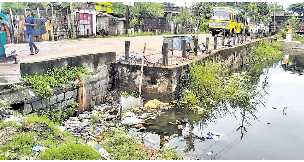
ଏନ୍‌ଏସି ପଛପଟ ପୋଖରୀରେ ପଲିଥିନ ଓ ଆବର୍ଜନା ଭର୍ତ୍ତି ହୋଇଛି।

୨୦୧୪ରେ ପ୍ରଥମ ଥର ପାଇଁ ସ୍ୱଳ୍ପ ସହରୀ ପାଇଁ ପୁରସ୍କୃତ କରିଛନ୍ତି। ନିର୍ବାହୀ ଅଧିକାରୀ ଏବଂ ଏନ୍‌ଏସି ଅଧକ୍ଷ ପୁରସ୍କାର ଧରି ଫେରିବା ପରେ ବେଲଗୁଣ୍ଡାରେ ଏକ ଶୋଭାଯାତ୍ରା ହୋଇଥିଲା। ବିଶେଷକରି ଶାସକ ଦଳର କର୍ମୀମାନେ ବେଶ୍ ଉତ୍ସାହରେ ଯୋଗଦେଇଥିଲେ। ୨୦୧୪ରୁ ସ୍ୱଳ୍ପ ଭାରତ ମିଶନ ମାଧ୍ୟମରେ ସହର ରୂପକୁ ବିଭିନ୍ନ ବର୍ଗରେ ପୁରସ୍କୃତ କରାଯାଇଛି। ସେହିପରି ଦିଆଯାଉଥିଲା ବର୍ତ୍ତମାନ ତାହା ବେଶ୍‌ବାକୁ ମିଳୁନାହିଁ। ସହରର ନିର୍ଦ୍ଦିଷ୍ଟ କେତକ ରାସ୍ତା କଡ଼ରେ ଅଧିକାଂଶ ଏବଂ ଆବର୍ଜନା ପଡ଼ି ରହିଥିବା ଲକ୍ଷ୍ୟ କରାଯାଇଛି। ଏନ୍‌ଏସି ପଛପଟ ପୋଖରୀ, ରାସ୍ତା କଡ଼ରେ କେତକ ସ୍ଥାନରେ ପ୍ଲାଷ୍ଟିକ୍ ପଲିଥିନ ଭରିରହିଛି। ଗୋରୁ ହାଟ ପଡ଼ିଆ ସମ୍ମୁଖରେ ମଇଳା ପାଣି ଠିକ୍ ଭାବେ ନିଆଯାଉନାହିଁ। ମଇଳା ପାଣି ବହୁ ସମୟ ରହିବା ଦ୍ୱାରା ଉଚ୍ଚ ମଇଳା ପାଣି ପ୍ରଦୂଷଣ ହେଉଛି। ହାଟ ସମ୍ମୁଖରେ ବସ୍ତୁସ୍ଥ ଥିବା ଯୋଗୁଁ ସେଠାରେ ଲୋକଙ୍କ ଅଧିକାଂଶ ସମୟ ଭିଡ଼ି ରହିଛି। ଉଚ୍ଚ ଗନ୍ଧ ନେଇ ଲୋକଙ୍କ ମଧ୍ୟରେ ଅସନ୍ତୋଷ ପ୍ରକାଶ ପାଉଛି। ସହରରେ ପ୍ଲାଷ୍ଟିକ୍ ପଲିଥିନ ଭରିରହିଛି। ଗୋରୁ ହାଟ ପଡ଼ିଆ ସମ୍ମୁଖରେ ମଇଳା ପାଣି ଠିକ୍ ଭାବେ ନିଆଯାଉନାହିଁ। ମଇଳା ପାଣି