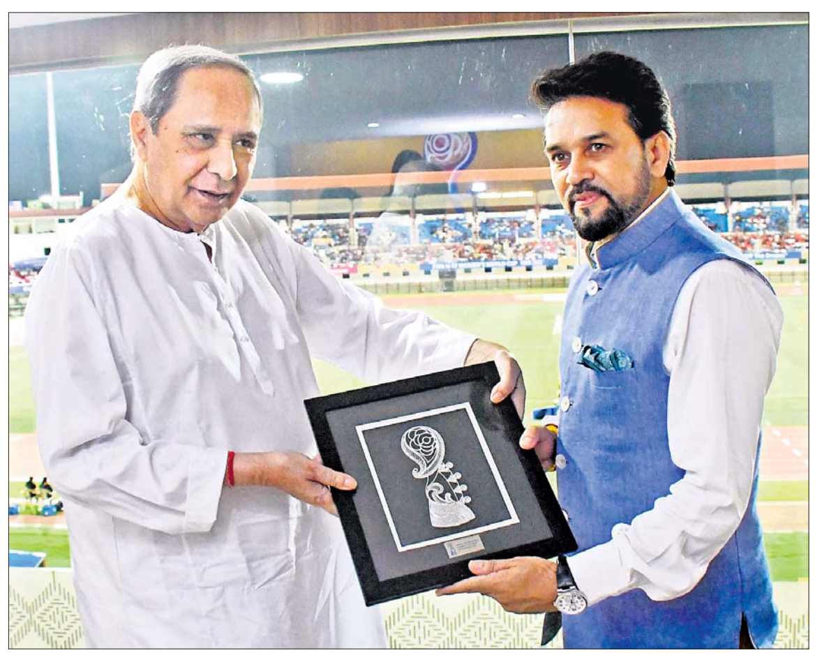
୧୭ ବର୍ଷରୁ କମ୍ ମହିଳା ଫିଫା ବିଶ୍ୱକପ ଉଦ୍‌ଘାଟନା ସମାରୋହରେ ମଙ୍ଗଳବାର ଯୋଗଦେବାକୁ ଆସିଥିବା କେନ୍ଦ୍ର ଶ୍ରୀମତୀ, ସୁନା ଓ ପ୍ରସାରଣ ମନ୍ତ୍ରୀ ଅନୁରାଗ ସିଂ ଠାକୁରଙ୍କୁ ପୁଷ୍ପମାଳା ନବୀନ ପଟ୍ଟନାୟକ ବିଶ୍ୱକପ ସ୍ମାରକୀ ପ୍ରଦାନ କରି ସମର୍ଥନ କରୁଛନ୍ତି।