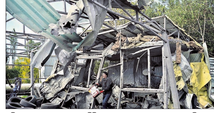
ରୁଷିଆର ବୋମାମାଡ଼ରେ କାପୋରିଟିଆରେ ଥିବା ଏକ ଘର ନଷ୍ଟ ହୋଇଯାଇଛି।