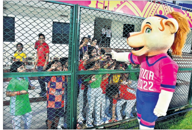
ପିଲାଙ୍କ ସହ ଅତିସାଧାରଣ ମାନ୍ଦ୍ୟ ଲଭା ।

ଓଡ଼ିଶାରେ ପ୍ରଥମଥର ପାଇଁ ହେଉଛି ଏକ ଫିଫା ପ୍ରତିଯୋଗିତା । ସେଥିପାଇଁ କଳିଙ୍ଗ ଷ୍ଟାଡ଼ିୟମରେ ଏବେ ଦେଶ ବିଦେଶର ଗଣମାଧ୍ୟମ ପ୍ରତିନିଧିଙ୍କ ସମାଗମ ଦେଖିବାକୁ ମିଳିଛି । କଳିଙ୍ଗରେ ଭାରତ ସମେତ ବ୍ରାଜିଲ, ଆମେରିକା, ମରକ୍କୋ, ଚିଲି ଓ ନାଇଜେରିଆ ଖେଳିବାର କାର୍ଯ୍ୟକ୍ରମ ରହିଛି । ଫଳରେ ଭାରତର ବିଭିନ୍ନ ରାଜ୍ୟରୁ ଏବଂ ବିଭିନ୍ନ ଦେଶରୁ ଗଣମାଧ୍ୟମ ପ୍ରତିନିଧିମାନେ ମ୍ୟାଚ ରିପୋର୍ଟ ପାଇଁ ଏକତ୍ରିତ ହୋଇଛନ୍ତି ।