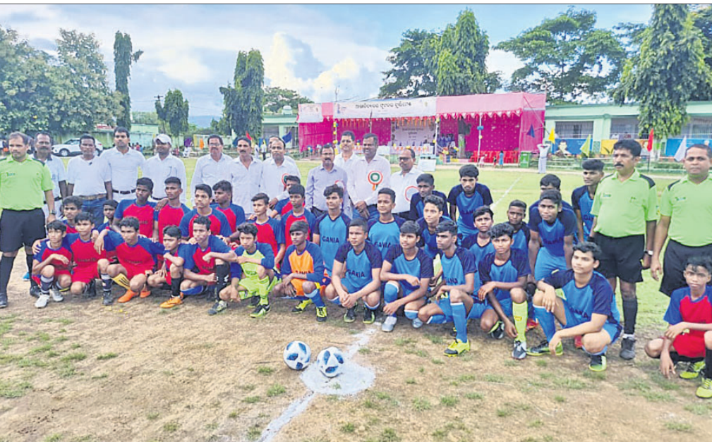
ଅତିଥିଙ୍କ ଗହଣରେ ୨ ବଳର ଖେଳାଳୀ।

ନୟାଗଡ଼ ଜିଲ୍ଲାପ୍ରାୟ ଆନ୍ତଃବିଦ୍ୟାଳୟ ପୁରସ୍କୃତ ଚୂର୍ଣ୍ଣାମେଣ୍ଟ ଗ୍ରାମୀଣ ଲଗାମାଟି ବାମନ ଅବକାଶ ସରକାରୀ ଉଚ୍ଚ ବିଦ୍ୟାଳୟ ଖେଳପଡ଼ିଆରେ ମଙ୍ଗଳବାର ଉଦ୍‌ଘାଟିତ ହୋଇଛି।