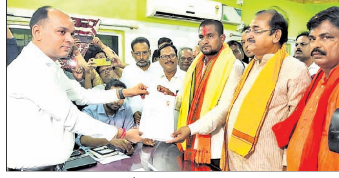
ଭଦ୍ରକ ବ୍ଲକ କାର୍ଯ୍ୟାଳୟରେ ଭାଜପା ନେତାଙ୍କ ଗହଣରେ ପୂର୍ଣ୍ଣବର୍ଣ୍ଣୀ ସୁରଜ ନାମାଙ୍କନପତ୍ର ଦାଖଲ କରୁଛନ୍ତି।