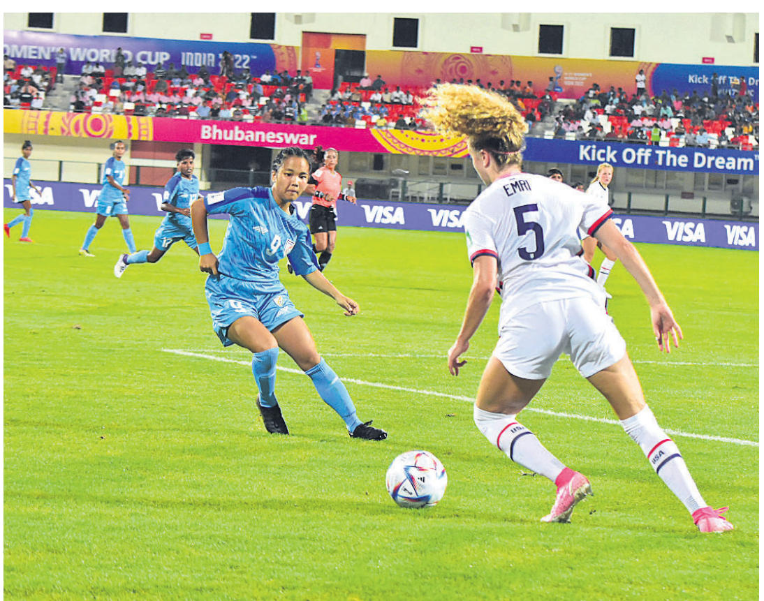
୧୬ ବର୍ଷରୁ କମ୍ ମହିଳା ଫିଫା ବିଶ୍ୱକପରେ ମଙ୍ଗଳବାର ଭାରତ-ଆମେରିକା ମ୍ୟାଚର ଏକ ସଂଘର୍ଷପୂର୍ଣ୍ଣ ମୁହୂର୍ତ୍ତ।