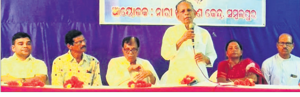
କାର୍ଯ୍ୟକ୍ରମରେ ମଞ୍ଚାସୀନ ଅତିଥି।