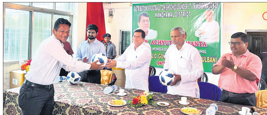
ଫିଫା ପୁରୁବଲ ଫର୍ ସ୍କୁଲ୍ କାର୍ଯ୍ୟକ୍ରମରେ ବିଭିନ୍ନ ସ୍କୁଲ କର୍ମଚାରୀଙ୍କୁ ପୁରୁବଲ ବର୍ଷନ କରାଯାଇଛି।

ଭୁବନେଶ୍ୱର, ୧୨।୧୦ (କ୍ରୀଡ଼ା ପ୍ରତିନିଧି) ଫିଫା ପୁରୁବଲ ଫର୍ ସ୍କୁଲ୍ କାର୍ଯ୍ୟକ୍ରମ ଆରମ୍ଭ ହୋଇଛି। ଗତ ୧୦ ତାରିଖରେ ପୁଷ୍ୟମନ୍ତ୍ରୀ ନବୀନ ପଟ୍ଟନାୟକ ଏହାକୁ ଉଦ୍‌ଘାଟନ କରିଥିଲେ। ଏହି କାର୍ଯ୍ୟକ୍ରମର ଅଂଶବିଶେଷ ଭାବେ ଏମ୍‌ପି ଅନୁସୂଚିତ ସାମନ୍ତ କନ୍ଧମାଳ ଓ ବୌଦ୍ଧ ଜିଲ୍ଲାର ୧୦୦ ସ୍କୁଲକୁ ୨୦୦୦ ପୁରୁବଲ ବର୍ଷନ କରିଛି। ଏହି କାର୍ଯ୍ୟକ୍ରମରେ ଜଙ୍ଗଲ ଓ ଉଇକେଟ ହରାଇ ୬୪୧ ଓ ୧୪୩ ରନ ସଂଗ୍ରହ କରି ଥିଲା।