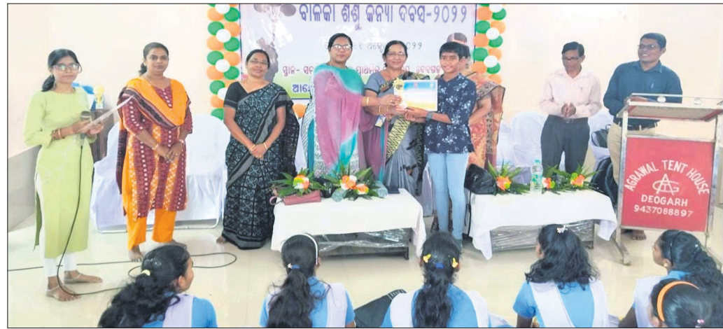
ଅନ୍ତର୍ଜାତୀୟ ଶିଶୁକନ୍ୟା ଦିବସରେ ଉପସ୍ଥିତ ଅତିଥି।