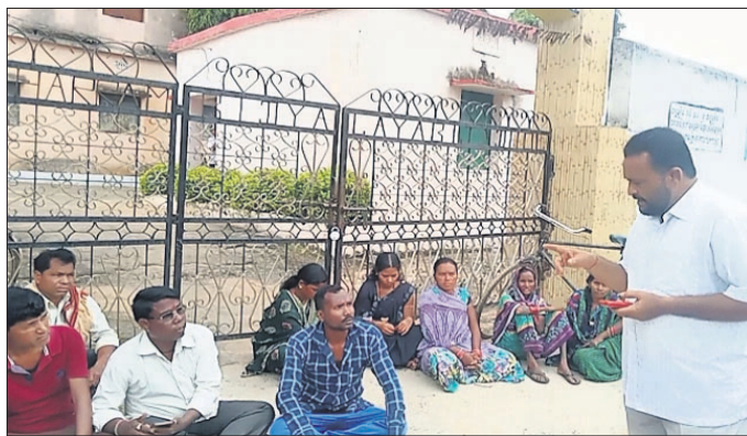
ସ୍କୁଲରେ ତାଲା ପକାଇ ଅଭିଭାବକମାନେ ପ୍ରତିବାଦ କରୁଛନ୍ତି ।