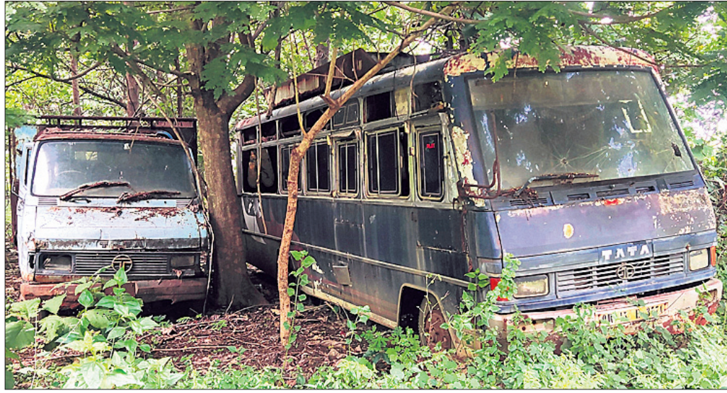
ସମ୍ପତ୍ତିର ଅର୍ଥ ପରିସରରେ ଜବତ ଗାଡ଼ି ନଷ୍ଟ ହେବାକୁ ବସିଛି ।