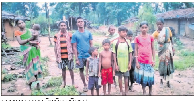
ଚନ୍ଦନାମାଳ ଗ୍ରାମର ବିସ୍ମାଦିତ ପରିବାର।

ଜିଲା ପ୍ରଶାସନର ବିଚିତ୍ର ନାତି। ବୁଝାମଣା କରାଇ ଲୋକଙ୍କୁ ବିସ୍ମାଦନ କରିଦେଲା। ହେଲେ ବିସ୍ମାଦନ ସମୟରେ ଦେଇଥିବା ପ୍ରତିଶ୍ରୁତି ପାଳନ କଲାନାହିଁ। ବର୍ଷେ ହେଲା ଅନ୍ଧାରରେ ଜୀବନ ବିତାଉଛନ୍ତି ୧୦୦୦ ଅଧିକ ପରିବାର। ଏଭଳି ଘଟଣା ଘଟିଛି ସମ୍ବଲପୁର ଜିଲା ମୁମୁମୁରା ବ୍ଲକ ଚନ୍ଦନାମାଳ ଗ୍ରାମରେ। ଏହି ଗ୍ରାମରେ ଏକଲବ୍ୟ ସ୍କୁଲ ନିର୍ମାଣ କରାଯାଇଛି। ଏଠାରେ ରହୁଥିବା ପ୍ରାୟ ୧୦୦୦ ଅଧିକ ପରିବାରଙ୍କୁ ୨୦୧୧ ଅକ୍ଟୋବର ମାସରୁ ବିସ୍ମାଦନ କରାଯାଇଥିଲା। ସେ ସମୟରେ ବିକ୍ରି, ପାଣି, ରାସ୍ତା, ଘର ଯୋଗାଇଦେବାକୁ ଜିଲା ପ୍ରଶାସନ, ବ୍ଲକ ପ୍ରଶାସନ ପକ୍ଷରୁ ପ୍ରତିଶ୍ରୁତି ଦିଆଯାଇଥିଲା। ରାସ୍ତା ଅପରପାର୍ଶ୍ୱରେ ସମସ୍ତଙ୍କୁ ଜମି ମଧ୍ୟ ପ୍ରଦାନ କରିଥିଲେ। ବିସ୍ମାଦନପରେ ନିଜସ୍ୱ