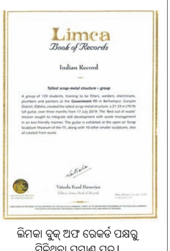
ଲିମ୍ବା ବୁକ୍ ଅଫ୍ ରେକର୍ଡ ପକ୍ଷରୁ ମିଳିଥିବା ପ୍ରମାଣ ପତ୍ର ।

ଆଇଟିଆଇ ପକ୍ଷରୁ ଆବେଦନ କରାଯାଇଥିଲା । ଏ ବାବଦରେ ମଙ୍ଗଳବାର ଲିମ୍ବା ବୁକ୍ ଅଫ୍ ରେକର୍ଡ ପକ୍ଷରୁ ସୂଚନା ମିଳିଥିଲା । ବୁକ୍ ଅଫ୍ ରେକର୍ଡ ପକ୍ଷରୁ ପ୍ରମାଣ ପତ୍ର ଆଇଟିଆଇକୁ ମିଳିଛି । ଏ ନେଇ ଆଇଟିଆଇ ଅଧ୍ୟକ୍ଷ ଡ.ରଜତ କୁମାର ପାଣିଗ୍ରାହୀ ଛାଡ଼ାଛାଡ଼ି ଓ କୃତଜ୍ଞତା ଜଣାଇଛନ୍ତି ।