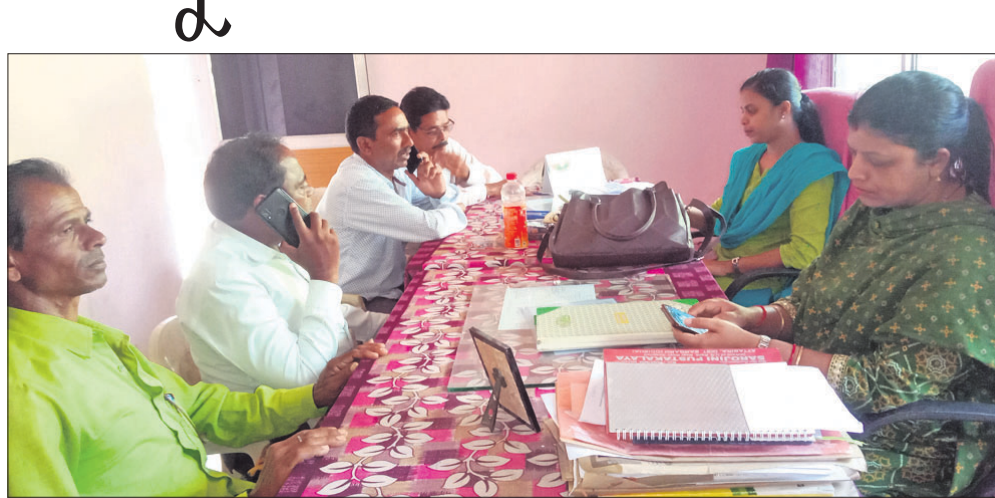
କୃଷି ଅଧିକାରୀଙ୍କ ସହ ଚାଷୀମାନେ ଆଲୋଚନା କରୁଛନ୍ତି ।

ବରଗଡ଼ ଜିଲା ଅତୀତରୁ ବୃକ୍ଷର ଏବେ ଧାନ ପସଲରେ ରୋଗପ୍ରାକ୍ତ ପ୍ରାପ୍ତ ହେବା ସହିତ ନିର୍ବାସକ, ମାଟିଆଗୁଡ଼ିକ ପୋକ ସାଜକୁ ପ୍ରତ୍ୟେକ ରୋଗ ଫସଲକୁ କ୍ଷତି ପହଞ୍ଚାଇବାରେ ଲାଗିଛି । ଏହି ସମୟରେ ହଜାର ହଜାର ଚଳା ଖର୍ଚ୍ଚ କରି ଚାଷ କରିଥିବା ଚାଷୀ କିଛି ରୋଗପୋକରୁ ଫସଲକୁ ବଞ୍ଚାଇବ ତିରାରେ ପଡ଼ିଯାଇଛି । ଯେତେ କାଟନାଗକ ସିଧନ କଲେ ବି ସୁଫଳ ମିଳୁନାହିଁ । ଏପରିକି ସେମାନଙ୍କୁ ପରାମର୍ଶ ଦେବାପାଇଁ କେହି ନାହାନ୍ତି । ବୃକ୍ଷରେ ୨୦୦ଟି ଗ୍ରାମ କୃଷି କର୍ମଚାରୀ କାର୍ଯ୍ୟରେ ଅଛନ୍ତି ।