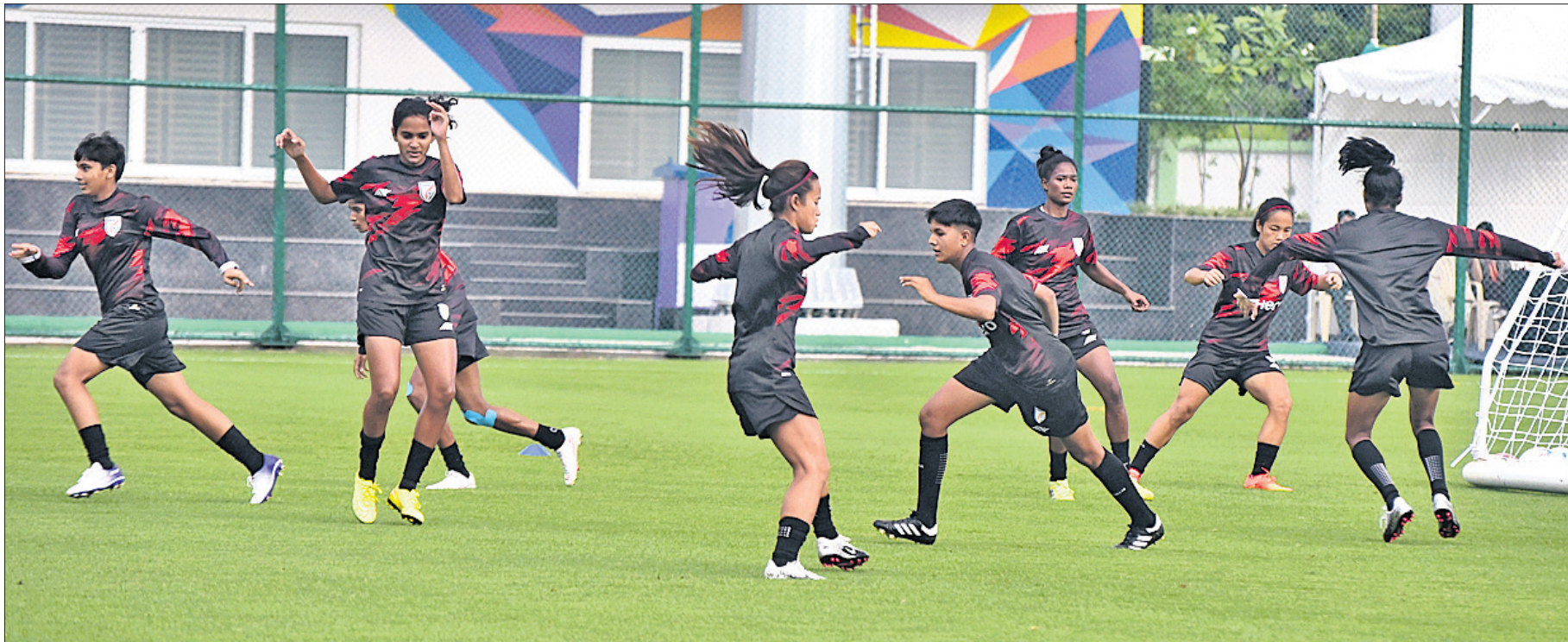
୧୭ ବର୍ଷରୁ କମ୍ ମହିଳା ଫିଫା ବିଶ୍ୱକପର ମରଲୋ ବିପକ୍ଷ ମ୍ୟାଚ ପୂର୍ବରୁ ରୂପକାର କ୍ୟାପିଟାଲ ହାଇସ୍କୁଲ ପଡ଼ିଆରେ ଭାରତୀୟ ଦଳର ଅଭ୍ୟାସ।

ରାଜ୍ୟ ସରକାରଙ୍କ କ୍ରୀଡ଼ା ବିଭାଗ ଓ ଏମ୍‌ଜିଆର୍ ମିନେରାଲ୍ସ ସହଯୋଗ ଯୋଗୁ ରାଜ୍ୟ ଦଳକୁ ଏପରି ସଫଳତା ମିଳିପାରିଥିବାରୁ ଓଡ଼ିଶା ଅଲିମ୍ପିକ୍ ଆସୋସିଏସନ ପକ୍ଷରୁ କୃତଜ୍ଞତା ଜ୍ଞାପନ କରାଯାଇଛି।