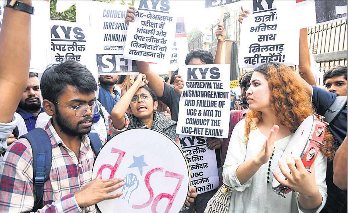
ଏକ ପ୍ରକାର ପରୀକ୍ଷା ପରିଚାଳନାରେ ବିଶ୍ୱବିଦ୍ୟାଳୟ ଅନୁଷ୍ଠାନ ଆନ୍ଦୋଳନ (କୃତ୍ରିମ) କାନ୍ଦିବାନୀ ପ୍ରତିବାଦରେ ବୁଧବାର ଛାତ୍ରଛାତ୍ରୀମାନେ ଏହାର ବିକା କାର୍ଯ୍ୟକ୍ରମ ଆରମ୍ଭ କରିଛନ୍ତି।