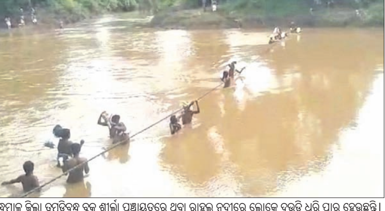
କନ୍ଦମାଳ ଜିଲ୍ଲା ବୁଢ଼ୁଡ଼ିବନ୍ଧ ବୁଲ୍ଲ ଶାଳା ପଞ୍ଚାୟତରେ ଥିବା ରାହୁଲ ନଦୀରେ ଲୋକେ ଦଉଡ଼ି ଧରି ପାର ହେଉଛନ୍ତି ।

କୋଟଗଡ଼, ୧୩।୧୦(ଡି.ଏନ.ଏ.): କନ୍ଦମାଳ ଜିଲ୍ଲାରେ ଏଭଳି କେତେକ ସ୍ଥାନ ଅଛି ଯେଉଁଠି କି ବର୍ତ୍ତମାନ ପର୍ଯ୍ୟନ୍ତ ପୋଲ କିମ୍ବା ଭଲ ରାସ୍ତାଖଣ୍ଡେ ନାହିଁ । ଫଳରେ ଲୋକେ ଯାତାୟତରେ ବହୁ ଅସୁବିଧାର ସମ୍ମୁଖୀନ ହେଉଛନ୍ତି । ଲୋକେ ଅଭିଯୋଗ କଲେ ମଧ୍ୟ ପ୍ରଶାସନ କିମ୍ବା ରାଜନେତା ସମୟା ଜାଣି ମଧ୍ୟ ନୀରବ ରହୁଛନ୍ତି । ଏମିତି ଦେଖିବାକୁ