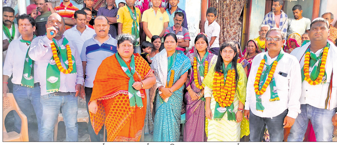
କନସର୍ଜ ପଦଯାତ୍ରାରେ ପୂର୍ବତନ ଏମ୍ପିଏ ସହ ଅନ୍ୟ ନେତା ଓ କର୍ମୀମାନେ।