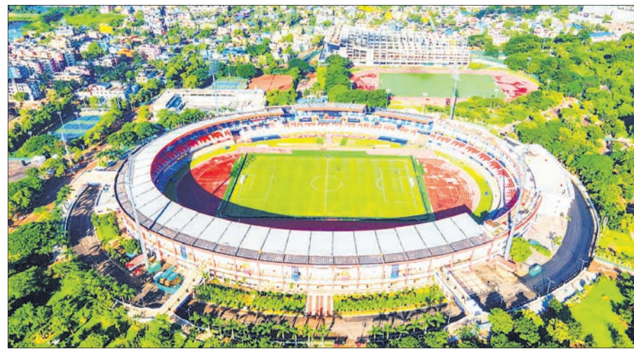
ଭୁବନେଶ୍ୱର, ୧୩।୧୦ (କ୍ରୀଡ଼ା ପ୍ରତିନିଧି)