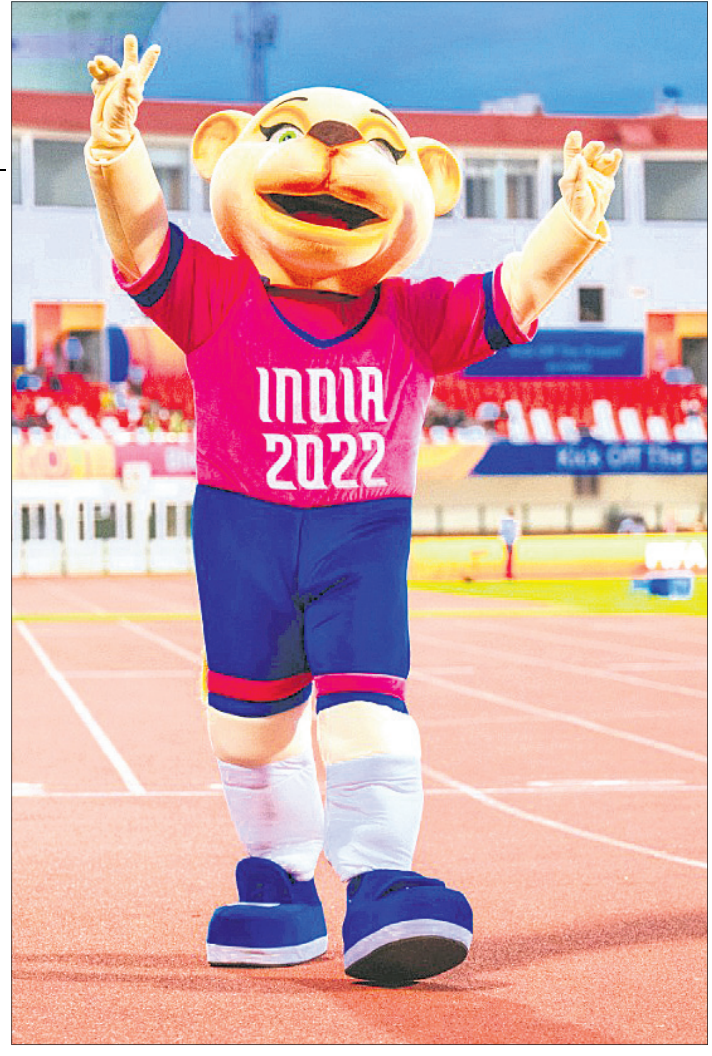
୧୭ ବର୍ଷରୁ କମ୍ ଫିଫା ବିଶ୍ୱକପ ମାସ୍କଟ୍ ଜଣା ।

ଜାଣିବାକୁ ପଡ଼ିବ ବୋଲି ପ୍ରଭାକରନ କହିଛନ୍ତି । ଖବର ଅନୁସାରେ କେତେଜଣଙ୍କର ଜୋଡା ନମ୍ବର ଠିକ୍ ନ ଥିଲା । ଫଳତଃ ସେମାନେ ଗତ ମାସରେ ନୂଆ ଜୋଡା ଯୋଗାଇ ଦେବାପାଇଁ ଅନୁରୋଧ କରିଥିଲେ । କିନ୍ତୁ ସଡ଼କ ପରିବହନ କଟିଆରେ ଆସିଥିବାରୁ ଜୋଡା ପହଞ୍ଚିବାରେ ପ୍ରଥମ ଦିବସରେ ସହଜ ଅନୁଭବ କରି ନ ଥାନ୍ତି । ନୂଆ ରୁଚ୍ ସହ ଅଭ୍ୟାସ ହେବାକୁ କିଛି ସମୟ ଲାଗିଥାଏ । ଭାରତ ମଙ୍ଗଳବାର ଓପନିଂ ମ୍ୟାଚରେ ମୁକ୍ତରାଷ୍ଟ୍ର ଆମେରିକା (ୟୁଏସ୍ଏ)ଠାରୁ ୦-୮ ଗୋଲରେ ପରାସ୍ତ ହୋଇଛି ।