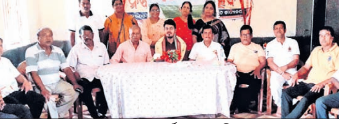
ମେଧାବୀ ଛାତ୍ରଙ୍କୁ ସମର୍ଥନ କରାଯାଇଛି।