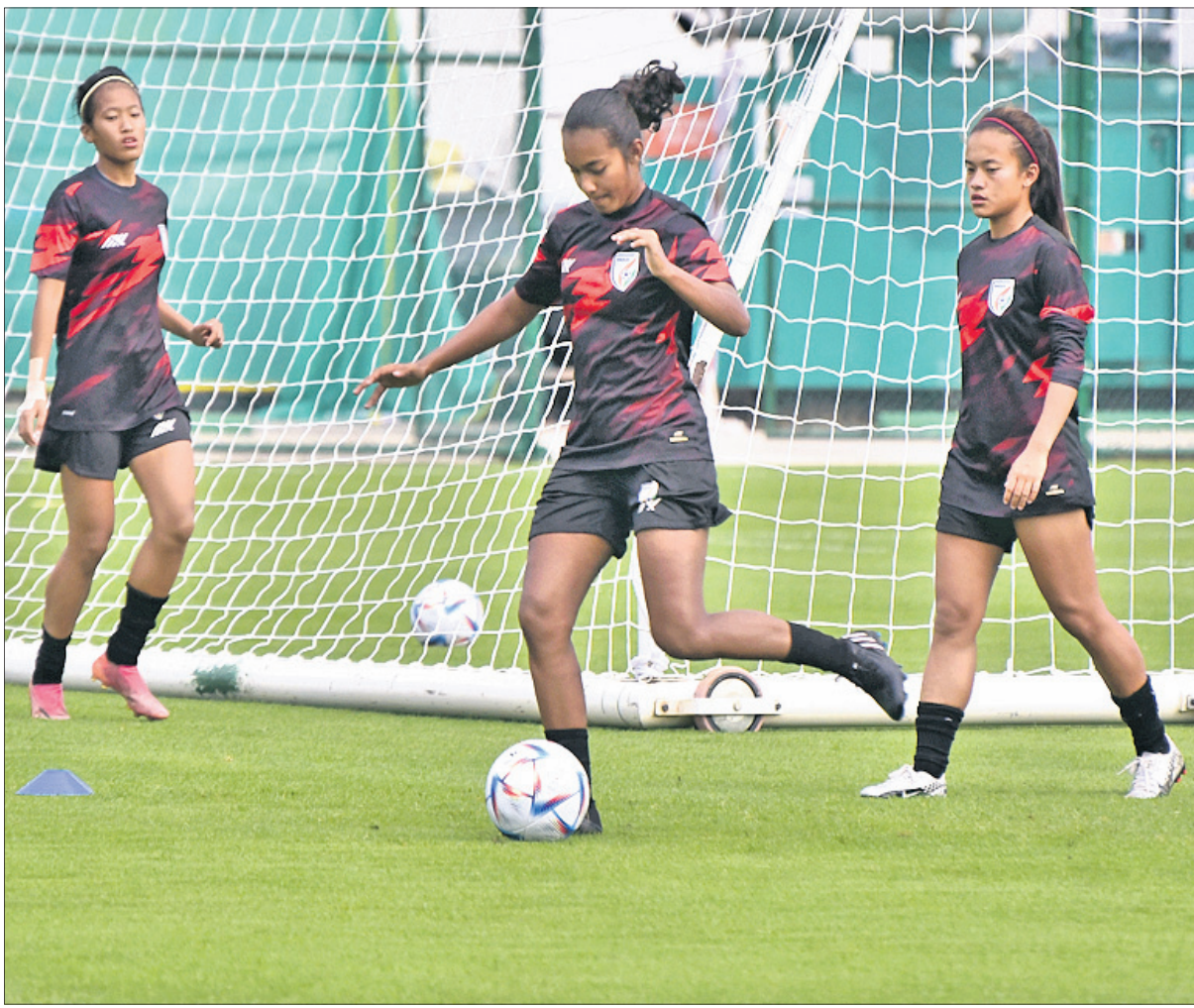
ସପ୍ତମ ବାଟାଲିୟନ ପଡ଼ିଆରେ ଗୁରୁବାର ଭାରତୀୟ ଖେଳାଳିଙ୍କ ଅଭ୍ୟାସ ।