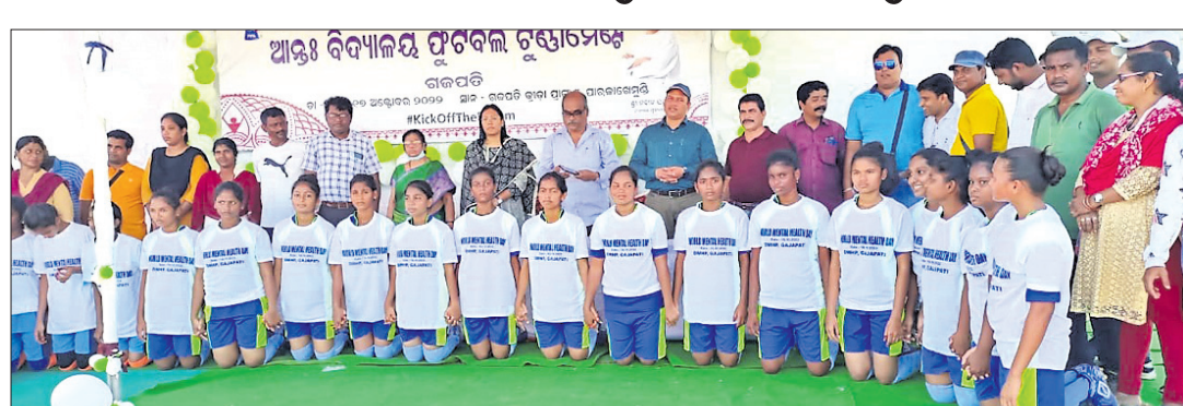
ଅତିଥି ଓ ପ୍ରତିଯୋଗୀମାନେ।

ଗଜପତି ଜିଲ୍ଲାସ୍ତରୀୟ ଆନ୍ତଃବିଦ୍ୟାଳୟ ୧୭ ବର୍ଷରୁ କମ ବାଲିକା ବାଳକ ଫୁଟବଲ ଟୁର୍ଣ୍ଣାମେଣ୍ଟ ଟୁଟାୟା ଦିବସରେ ପହଞ୍ଚିଛି।