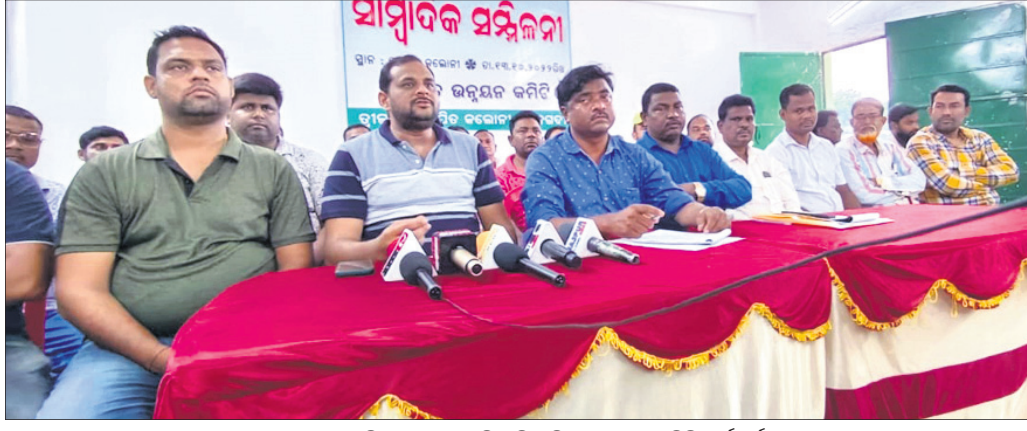
ଖବରଦାତା ସମ୍ମିଳନୀରେ ଉପସ୍ଥିତ ବିସ୍ମାପିତ ଭରଣନ କମିଟି କର୍ମକର୍ତ୍ତା ।

କଳିଙ୍ଗନଗର ଶିଳ୍ପାଞ୍ଚଳ ଟ୍ରିକଲୀ ବିସ୍ମାପିତ କଲୋନୀର ବିଭିନ୍ନ ସମସ୍ୟା ନେଇ ଆନ୍ଦୋଳନକୁ ଓହ୍ଲାଇବ ବିସ୍ମାପିତ ଭରଣନ କମିଟି । କମିଟି ପକ୍ଷରୁ ୯ ଦିନୀ ସମ୍ବଳିତ ଏକ ଦାବିପତ୍ର ନିକଟରେ ଗ୍ରାମ୍ୟ ଭରଣନ ମନ୍ତ୍ରୀ, କେନ୍ଦ୍ରାଞ୍ଚଳ ଆର୍ଡିଏସ, ଇଡକୋ ସିଏମ୍ପି, ହାଉସି କମିଟି ଅଧ୍ୟକ୍ଷ, ଯାଜପୁର ଜିଲ୍ଲାପାଳ, ଜିଲ୍ଲା ଆରକ୍ଷା ଅଧିକାରୀ, କଳିଙ୍ଗନଗର ଏଡିଏମ, ଅତିରିକ୍ତ ଏସ୍ପି, ଦାନଗଦି ତହସିଲଦାର ଓ ଦାନଗଦି ବିଡ଼ଓଙ୍କୁ ପ୍ରଦାନ କରାଯାଇଛି । ତେବେ ୧୬ ତାରିଖ ମଧ୍ୟରେ ଆଲୋଚନା ମାଧ୍ୟମରେ ଦାବିପତ୍ରକୁ ପୂରଣ ନ ହେଲେ ୧୯ ତାରିଖ ସକାଳୁ ଶିଳ୍ପାଞ୍ଚଳ ମିଳନଗାର ଛକଠାରେ ବିସ୍ମାପିତ ଭରଣନ କମିଟି ରାଜ ରାସ୍ତା ବନ୍ଦ କରିବା ସହ ଧାରଣାରେ ବସି ରହିବ । ଏନେଇ କଲୋନୀର ଆକାଦ ହିନ୍ଦ କୁଠାରେ ଗୁରୁବାର ଆୟୋଜିତ ଏକ ଖବରଦାତା ସମ୍ମିଳନୀରେ ସୂଚନା ଦିଆଯାଇଛି ।