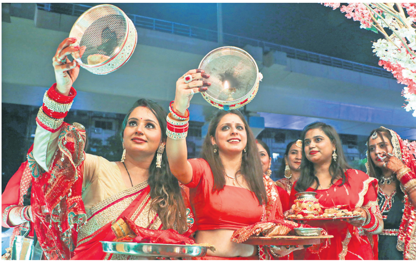
ମହାରାଷ୍ଟ୍ରର ନାଗପୁରରେ ମହିଳାମାନେ ଗୁରୁବାର କରାଯାଉଥିବା ଚୌଥ୍ ପର୍ବ ପାଳନ କରୁଛନ୍ତି।