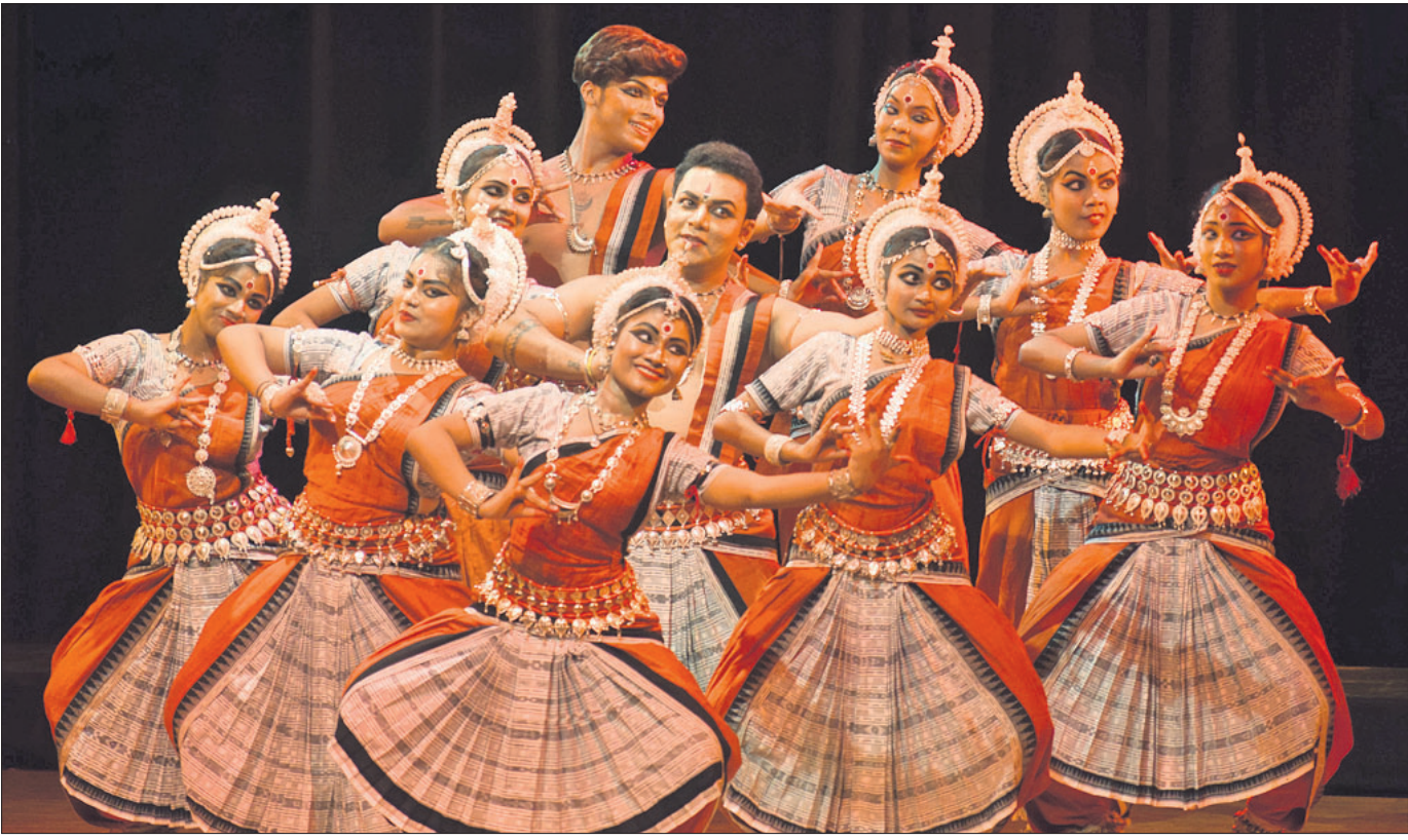
ଭୁବନେଶ୍ୱର ରବାନ୍ଦ୍ରମଣ୍ଡପରେ ଗୁରୁବାର ନୃତ୍ୟ ନିକସ ଓ ନୃତ୍ୟକିତା ଅନୁଷ୍ଠାନର ମିଳିତ ଆରମ୍ଭକର୍ମରେ ଆୟୋଜିତ ବୃତ୍ତୀୟ 'ଗୁରୁ ସମର୍ପଣ ସମାରୋହ'ରେ କଳାକାରଙ୍କ ଦ୍ୱାରା ଓଡ଼ିଶା ନୃତ୍ୟ ପରିବେଷଣ କରାଯାଇଛି।