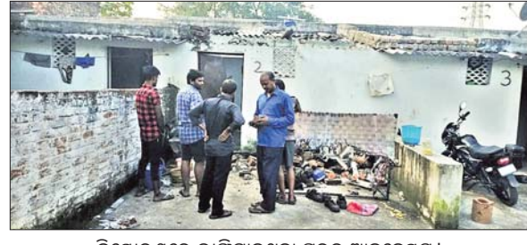
ବିସ୍ଫୋରଣରେ ଭାଙ୍ଗିଯାଇଥିବା ଘରର ଆକୃଷ୍ଟବସ୍ତୁ ।

ଗୁଜରାଟର, ୧୩୧୦(ବି.ଏନ.ଏ.) ଫୋଟୋଗ୍ରାଫିକା ଓରିସା ଆନି ଅନ୍ତର୍ଗତ ହନୁମାନ ନଗରରେ ଗୁଜୁରାଟ ସମାଜର ଏକ ଗ୍ୟାସ୍ ଟ୍ୟାଙ୍କ ଫାଟିଯାଇଥିଲା ।