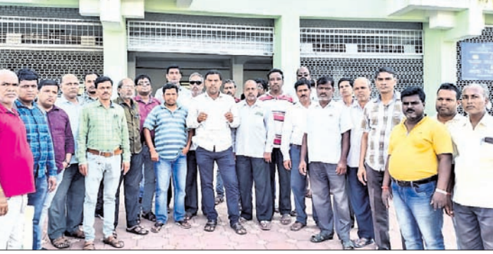
ଜିଲ୍ଲାପାଳଙ୍କ କାର୍ଯ୍ୟାଳୟ ଆଗରେ ଏକତ୍ରିତ ହୋଇଥିବା ସାହାରା ଇଣ୍ଡିଆ ଏଜେଣ୍ଟମାନେ।

ଲକ୍ଷଣ ଜମାକାରୀଙ୍କ ଭାଗ୍ୟ ବର୍ତ୍ତମାନ ଅନିଶ୍ଚିତତା ଭିତରକୁ ଠେଲି ହୋଇଯାଇଛି। ଜମାକାରୀମାନେ ସାହାରା ଏଜେଣ୍ଟଙ୍କ ଟଙ୍କା ଫେରାଇବାକୁ ବାଧ୍ୟ କରିବା ସଙ୍ଗେ ସଙ୍ଗେ ଅଶ୍ୱୀକ ଭାଷାରେ ଗାଳିଗୁଳ କରୁଛନ୍ତି। ଏପରି କି ସାହାରା କଲେକ୍ଟର ଏଜେଣ୍ଟ ଘରୁ ବାହାରିବା କଷ୍ଟକର ହୋଇପଡ଼ିଛି। ତେଣୁ ଏହାର ତୁରନ୍ତ ସମାଧାନ କରିବାକୁ ଯାଜପୁର ଜିଲ୍ଲାରେ କାର୍ଯ୍ୟରତ ସମସ୍ତ ଏଜେଣ୍ଟ ଜିଲ୍ଲାପାଳଙ୍କୁ ଏକ ଦାବିପତ୍ର ଦେଇଛନ୍ତି। ସେମାନେ ଯାଜପୁର ଚାଉଳସିତ ଜିଲ୍ଲାପାଳଙ୍କ କାର୍ଯ୍ୟାଳୟରେ ପହଞ୍ଚି ଦାବିପତ୍ର ଦେବା ସହ କିପରି ଲୋକେ ଜମା କରିଥିବା ଅର୍ଥ ଫେରିପାଇବେ ଏବଂ ସାହାରା କର୍ମଚାରୀ ସେମାନଙ୍କ ନ୍ୟାୟ ଦାବି ପାଇବେ ସେ ଦିଗରେ ବିଚାର କରିବାକୁ ନିବେଦନ କରିଛନ୍ତି।