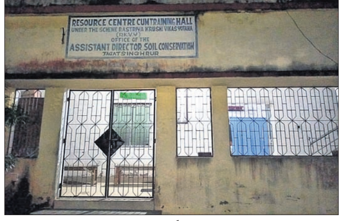
ଆରକେଭିଏଲ ଉଦ୍ଦେଶ୍ୟରେ ଥିବା ରିସୋର୍ସ ସେଣ୍ଟରରେ ଜଗତସିଂହପୁର ମୃତ୍ତିକା ସଂରକ୍ଷଣ କାର୍ଯ୍ୟାଳୟ ଚାଲିଛି।

କରତସିଂହପୁର ଅଫିସ, ୧୩୧୦ ଏବଂ ଇଣ୍ଡିଗ୍ରେଡେଡ୍ ଜଳଛାୟା ଉନ୍ନୟନ କାର୍ଯ୍ୟକ୍ରମ (ଆଇଡିଏସ୍‌ସି) ମାଧ୍ୟମରେ ନିମ୍ନଲିଖିତ ସ୍ତରୀୟ ସୂକ୍ଷ୍ମ ପାଇଁ ଏମ୍‌ପ୍ଲମେଣ୍ଟ ଆୟୁରାଉଟ୍ ଷ୍ଟିମ୍ (ଇଏଏସ୍) କାର୍ଯ୍ୟକାରୀ ହେଲା। ମୋଟାମୋଟି ଭାବରେ ଜଳ ଅମଳ ଉପରେ ଗୁରୁତ୍ୱରୋପ କରାଯାଇଥିଲା। କିନ୍ତୁ ଜଗତସିଂହପୁର ଜିଲ୍ଲାରେ ଏସବୁ କେବଳ ପ୍ରହସନରେ ପରିଣତ ହୋଇଛି। ଜିଲ୍ଲାରେ ବିଭାଗୀୟ କାର୍ଯ୍ୟ କ'ଣ ହେଉଛି ତାହା ସାଧାରଣତଃ ବାରି ହେଉନାହିଁ। କାରଣ ବିଭାଗର ନିଜସ୍ୱ କାର୍ଯ୍ୟାଳୟ ବିଲ୍ଡିଂ ନ ଥିବାବେଳେ ୨୯ ପଦବୀରୁ ୧୨ଟି ଖାଲି ପଡ଼ିଛି। କେବଳ ଏତିକି ନୁହେଁ, ରାଜ୍ୟ ସରକାର ଉନ୍ନୟନ ପ୍ରକଳ୍ପ (ଏନ୍‌ଡିଏସ୍‌ସିଆରଏ) ଏବଂ ଇଣ୍ଡୋ-ଡେନିସ୍ କମ୍ପ୍ରେହେନ୍ସିଭ୍ ଖାତରଶେଡ୍ ଡେଭଲପମେଣ୍ଟ ପ୍ରକଳ୍ପ (ଆଇଡିଏସ୍‌ସିଏସ୍‌ସି)। ଜନିତ ଅବସ୍ଥାରେ ରୋକିବା ସାଙ୍ଗକୁ ପରିବେଶକୁ ଠିକ୍ ରଖିବା ଏହାର ଲକ୍ଷ୍ୟ ଥିଲା। ଏଥିସହ ଆର୍ଦ୍ର ଧରି ରଖିବା କ୍ଷମତା ବୃଦ୍ଧି ସହ ମାଟିର ଉର୍ବରତା ଓ ଉତ୍ପାଦନ କ୍ଷମତା ବଢ଼ାଇବା ଆଦି ଉଦ୍ଦେଶ୍ୟ ଥିଲା। ମୃତ୍ତିକା ସଂରକ୍ଷଣ ଦ୍ୱାରା ଭୂତଳ ଜଳସ୍ତର ନିୟନ୍ତ୍ରଣ କରିବାକୁ ସ୍ଥିର କରାଯାଇଥିଲା। ଏନେଇ ଡ୍ର. ପ୍ରୋଫ୍ ଏରିଆ ପ୍ରୋଗ୍ରାମ (ଡିଏସ୍‌ପି)ରେ