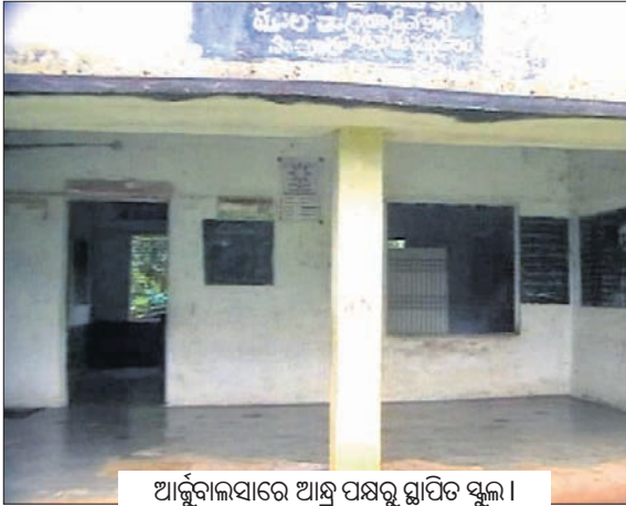
ଆର୍ଜୁନାଲସାରେ ଆଶ୍ରମ ପକ୍ଷରୁ ସ୍ଥାପିତ ସ୍କୁଲ।

ତେଲୁଗୁ ସ୍କୁଲ ପୂର୍ଣ୍ଣ ଚେକିବା ଓଡ଼ିଶା ସରକାର ଏବଂ ସ୍ଥାନୀୟ ପ୍ରଶାସନର ଦୂରଦୃଷ୍ଟିହୀନ ଶିକ୍ଷା ଯୋଜନାକୁ ପଦାକୁ ଆଣିଥିବାବେଳେ ସାମାଜିକରେ ଓଡ଼ିଆ ଭାଷା ପ୍ରତି ଦେଖାଦେଇଥିବା ସକଟ ଆହୁରି ଗମ୍ଭୀର ରୂପ ନେଲାଣି। ସାମାଜିକରେ ନେଇ କାତାଉତ୍ତରରେ 'କୋଟିଆ ଗ୍ରାମପଞ୍ଚାୟତ' ଆଲୋଚନାର ପ୍ରସଙ୍ଗ ରହି ଆସିଥିବାବେଳେ ଏବେ ଭାଷାକୁ କରାଯିବ କରିବା ପାଇଁ ପ୍ରାଥମିକ ସ୍କୁଲକୁ ମାଧ୍ୟମ କରି ଆଶ୍ରମ ପ୍ରଶାସନ। କୋଟିଆ ପଞ୍ଚାୟତର ଆର୍ଜୁନାଲସାରେ ଦେଖିବାକୁ ମିଳିଛି ଏହାର ଏକ ଦୃଷ୍ଟାନ୍ତ। ୨୦୦୮ରେ ଏଠାରେ ରାଜ୍ୟ ସରକାରଙ୍କ ପ୍ରୋତ୍ସାହନରେ ସ୍ଥାପିତ ହୋଇଥିଲା