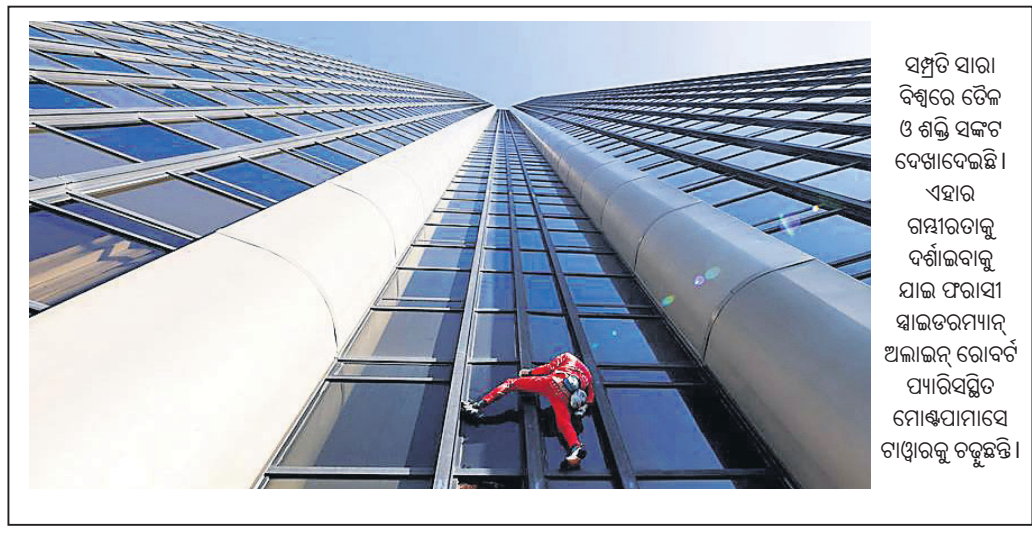
ସମ୍ପୃତି ସାରା ବିଶ୍ୱରେ ଚଳେ ଓ ଶକ୍ତି ସଙ୍କଟ ଦେଖାଦେଇଛି ଏହାର ଗମ୍ୟତାକୁ ଦର୍ଶାଇବାକୁ ଯାଇ ପରାସୀ ସାଇତରମ୍ୟାନ୍ ଅଲାଇନ୍ ରୋବର୍ଟ ପ୍ୟାରିସ୍‌ସ୍ଥିତ ମୋଷ୍ଟୋପାସେ ଗାଡ଼ଓଲ୍‌ ଚଳୁଛନ୍ତି।

ପ୍ରତିକୃତ ପ୍ରଭାବ ଶେୟାର ବଜାର ଉପରେ ପଡ଼ିଥିଲା। ପେନ୍‌ସନ ପାଣିର ସୁରକ୍ଷା ପାଇଁ ବ୍ୟାଙ୍କ ଅଫ୍ ଲାଇଣ୍ଡ୍ସ୍‌ ସହଯୋଗ କରିବାକୁ ପଡ଼ିଥିଲା। ନୂଆ ଅର୍ଥକ ନୀତି ଯୋଗୁ କଞ୍ଚାଚଳକର ଚାହିଦା ପୂର୍ଣ୍ଣ ପ୍ରତି ସମର୍ଥନ ହ୍ରାସ ପାଇଥିବାରୁ ଏହାକୁ ବଦଳାଇବା ପାଇଁ ପ୍ରଧାନମନ୍ତ୍ରୀ ଓ ଅର୍ଥମନ୍ତ୍ରୀଙ୍କ ଉପରେ ଜୋର୍ଦାଏ ଚାପ ପଡ଼ୁଥିଲା। ଏପରିକି ହ୍ରସ୍ତଙ୍କ ବଦଳାଇ ରଖି ସୁନକଙ୍କୁ ପ୍ରଧାନମନ୍ତ୍ରୀ କରିବା ଲାଗି ମଧ୍ୟ ଦଳୀୟ ମହଲରେ ଚର୍ଚ୍ଚା ଆରମ୍ଭ ହୋଇଥିଲା।