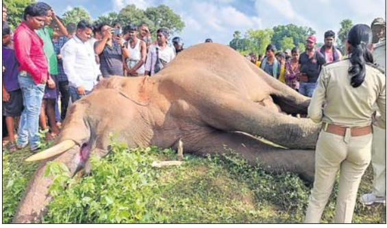
କାମାକ୍ଷାନଗର, ୧୪୧୦ (ଡି.ଏନ୍.ଏ.)