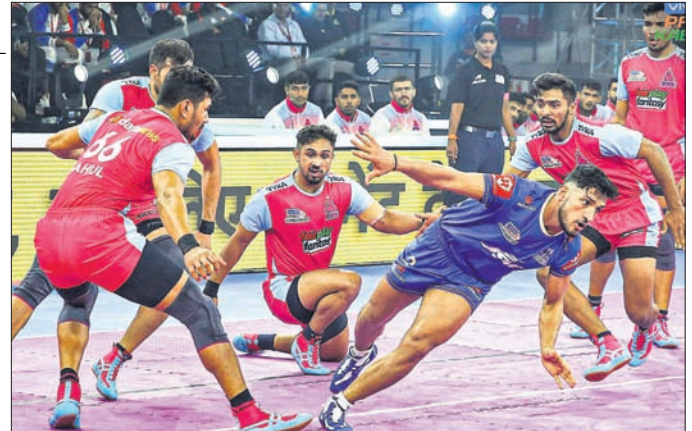
ପ୍ରେମା-କବାଡ଼ି ଲିଗ୍‌ରେ ଶନିବାର ଜୟପୁର ପିଙ୍କ୍ ପାଇଁ ଓ ଗୁଜରାଟ୍ ଡାଏମଣ୍ଡ୍ ମଧ୍ୟରେ ଅନୁଷ୍ଠିତ ମ୍ୟାଚ୍‌ର ଏକ ସଂଘର୍ଷପୂର୍ଣ୍ଣ ମୁହୂର୍ତ୍ତ।

ପ୍ରେମା କବାଡ଼ି ଲିଗ୍‌ରେ ଶନିବାର ଜୟପୁର ପିଙ୍କ୍ ପାଇଁ ସ୍ୱାଗତ୍ୱିକ୍ ବିଜୟ ହୋଇଛି। ବେଙ୍ଗାଲୁରୁ