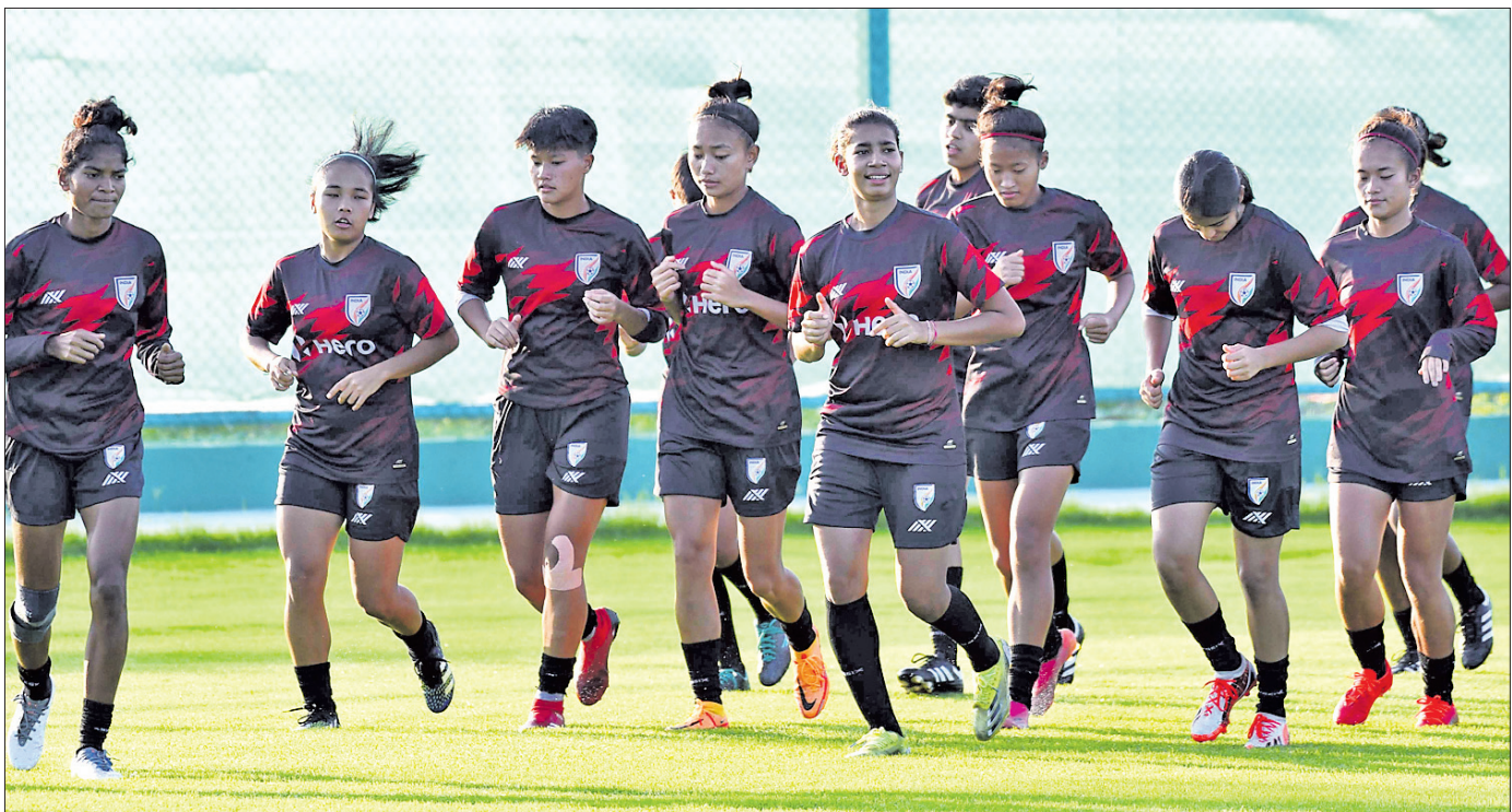
୧୭ ବର୍ଷରୁ କମ୍ ମହିଳା ଫିଫା ବିଶ୍ୱକପ୍‌ରେ ବ୍ରାଜିଲ ବିପକ୍ଷ ମ୍ୟାଚ୍ ପୂର୍ବରୁ ଭୁବନେଶ୍ୱରସ୍ଥିତ ପୋଲିସ୍ ବାଗାଲିୟନ ଗ୍ରାଉଣ୍ଡରେ ଶନିବାର ଅଭ୍ୟାସ ଅବସରରେ ଓ୍ୱାର୍ଡ୍‌ମ୍ୟାନ୍ ହେଉଛି ଭାରତୀୟ ଦଳ।