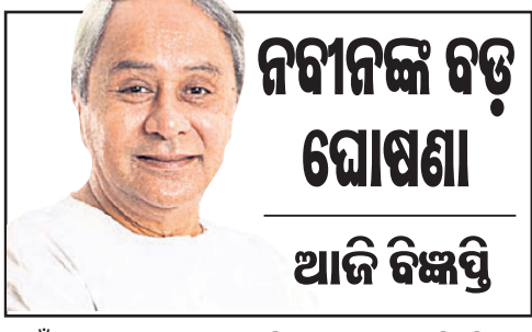
ନବୀନଙ୍କ ବଡ଼ ଘୋଷଣା ଆଜି ବିଜୟ

ରାଜ୍ୟରୁ ବୁଦ୍ଧିଭିତ୍ତିକ ନିୟୁତ୍ତ ବ୍ୟବସ୍ଥା ଉଚ୍ଛେଦ ହୋଇଛି। ଶନିବାର ରାଜ୍ୟ କ୍ୟାବିନେଟର ଏକ ଗୁରୁତ୍ୱପୂର୍ଣ୍ଣ ବୈଠକରେ ଏହି ବ୍ୟବସ୍ଥା ଉଚ୍ଛେଦ ପ୍ରସ୍ତାବକୁ ଅନୁମୋଦନ ଦିଆଯାଇଛି। ଏଥିଯୋଗୁ ରାଜ୍ୟର ୫୭ ହଜାର ସରକାରୀ ବୁଦ୍ଧିଭିତ୍ତିକ କର୍ମଚାରୀ ନିୟମିତ ହେବେ। ଏହି ଘୋଷଣା କରି ପୁଖ୍ୟମନ୍ତ୍ରୀ ନବୀନ ପଟ୍ଟନାୟକ ବୁଦ୍ଧିଭିତ୍ତିକ ନିୟୁତ୍ତ ପାଇଥିବା କର୍ମଚାରୀଙ୍କୁ ଆଶୁଆ ଦାପାବଳି ଭେଟି ଦେଇଛନ୍ତି।