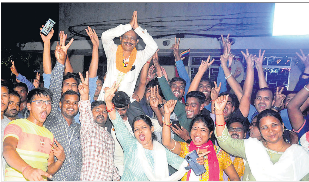
ପୁଖ୍ୟମନ୍ତ୍ରୀ ନବୀନ ପଟ୍ଟନାୟକ ବୁଦ୍ଧିଭିତ୍ତିକ ନିୟୁତ୍ତ ଉଚ୍ଛେଦ ଘୋଷଣା କରିବା ପରେ ଶନିବାର ଭୁବନେଶ୍ୱରର ଟାଲିଆରେ ଠିକା କର୍ମଚାରୀମାନେ ଉତ୍ସବ ମନାଉଛନ୍ତି।

ପାଇଁ ଏହା ଆଶୁଆ ଦାପାବଳି। ପୁଖ୍ୟମନ୍ତ୍ରୀ କହିଛନ୍ତି ଯେ ୨୦୦୦ ମସିହାରେ ଯେ ଓଡ଼ିଶାର ସେବା କରିବାର ସୁଯୋଗ ପାଇବାବେଳେ ମହାବାତ୍ୟା ପରର ଛୁଟି ଓ ଦୁର୍ଭିକ୍ଷ ଆର୍ଥିକ ବ୍ୟବସ୍ଥା ତାଙ୍କ ପାଇଁ ସବୁରୁ ବଡ଼ ଚ୍ୟାଲେଞ୍ଜ ଥିଲା। ରାଜ୍ୟ ଓଡ଼ିଶା ଗ୍ରାମ୍ୟରେ ଚାଲୁଥିଲା। ନିତିଦିନ ଖର୍ଚ୍ଚ ପାଇଁ ସରକାରଙ୍କୁ ବିକଳ ବ୍ୟାଙ୍କ ଉପରେ ନିର୍ଭର କରିବାକୁ ପଡୁଥିଲା। ଏହି ସମୟ ସେତେବେଳେ ଓଡ଼ିଶା ଅର୍ଥନୀତି ପାଇଁ କଳା ସମୟ ଥିଲା। ସୀମିତ ସମ୍ବଳ ଭିତରେ ରାଜ୍ୟର ବିକାଶ କରିବା ସବୁରୁ ବଡ଼ ପ୍ରାଥମିକତା ଥିଲା। ସେତେବେଳେ ନିୟୁତ୍ତ ୧୦୭