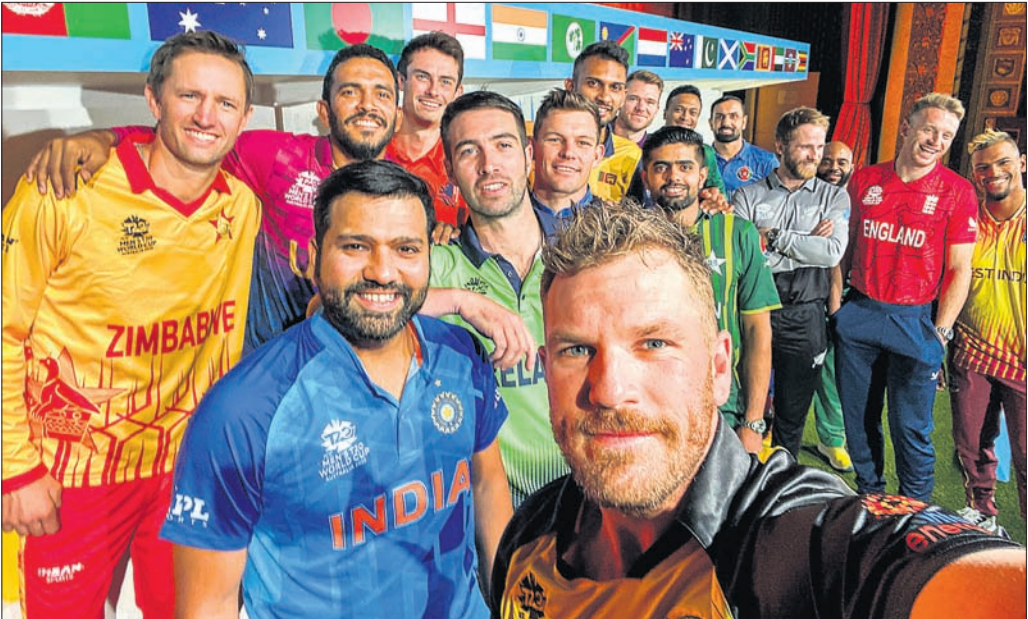
ଅଷ୍ଟ୍ରେଲିଆରେ ଆଇସିସି ପୁରୁଷ ଟି୨୦ ବିଶ୍ୱକପ୍ ୨୦୨୨ ଆରମ୍ଭ ହେବାର ଦିନ ପୂର୍ବରୁ ଆୟୋଜିତ ଏକ ସ୍ମୃତ୍ୟୁ କାର୍ଯ୍ୟକ୍ରମ ଅବସରରେ ଅଷ୍ଟ୍ରେଲିଆ କ୍ରିକେଟ୍ ଦଳ ଅଧିନାୟକ ଆରୋଡ୍ ଫିଫ୍ ଅଂଗ୍ରହଣକାରୀ ଅନ୍ୟ ଦଳଗୁଡ଼ିକର ଅଧିନାୟକଙ୍କ ସହ ସେଲଫି ନେଉଛନ୍ତି।