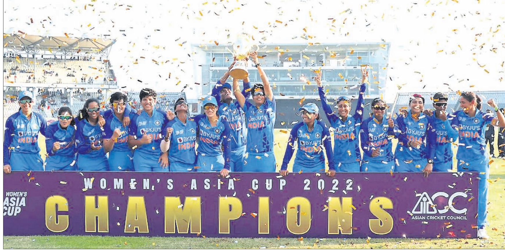
ଚୁପ୍ ସହ ଖୁସି ମୁହୂର୍ତ୍ତରେ ଏସିଆ କପ୍ ବିଜେତା ଭାରତୀୟ ମହିଳା କ୍ରିକେଟ ଦଳ।

ଅଷ୍ଟ୍ରେଲିଆର ଷ୍ଟାର୍ ଓପନର ଚେଭିର୍ ଡ୍ୱାର୍ଟନ ଯଥାଶୀଘ୍ର ଡିସେମ୍ବରରେ ବିଗ୍‌ବାଶ୍ ଲିଗ୍ (ବିଏବଲି)ରେ ଅଧିନାୟକ ପଦ ଫେରିପାରନ୍ତି। ଦେଶର କ୍ରିକେଟ ଇତିହାସରେ ଅଷ୍ଟ୍ରେଲିଆର ଅଧିନାୟକ ଭାବେ କାର୍ଯ୍ୟ କରିଥିବା ଡ୍ୱାର୍ଟନ ଏଥିରେ ଦୀର୍ଘମିଆଦୀ ଦଣ୍ଡ ବ୍ୟବସ୍ଥାରେ ଲାଗି ବିଚାର କରୁଥିବା ଜଣାପଡ଼ିବା ପରେ ଏହି ସମ୍ଭାବନା ଦେଖା ଦେଇଛି। ବର୍ତ୍ତମାନ ପ୍ରଚଳିତ ନିୟମାବଳୀରେ କେବଳ ଖେଳାଳି ଦଣ୍ଡବିଧାୟକ ଗ୍ରହଣ କରିନେବା ମାନେ ଏହାକୁ ସମ୍ପୂର୍ଣ୍ଣ ପାଳନ କରିବା ବାଧ୍ୟତାମୂଳକ। ୨୦୧୮ରେ ବଲ୍ ଟାମ୍ପିଙ୍ଗ୍ ଘାଟଣାରେ ସମ୍ପୂର୍ଣ୍ଣ ଥିବା ଅଭିଯୋଗରେ ଡ୍ୱାର୍ଟନ ଅଧିନାୟକତାରୁ ଆକାଶ୍ୟ ବାସ୍ୟ ହୋଇଥିଲେ। ମାତ୍ର କ୍ରିକେଟ ଅଷ୍ଟ୍ରେଲିଆ ଏହାର ଆଚରଣ ବିଧିରେ