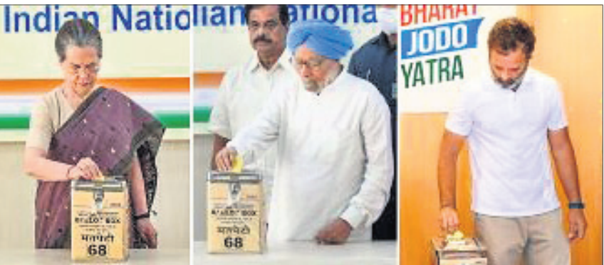
ନୂଆଦିଲ୍ଲୀରୁ ଏଆଇସିଏ କାର୍ଯ୍ୟକ୍ରମରେ କଂଗ୍ରେସ ଅଧ୍ୟକ୍ଷ ସରଳା ସୋନିଆ ଗାନ୍ଧୀ, ପୂର୍ବତନ ପ୍ରଧାନମନ୍ତ୍ରୀ ମନମୋହନ ସିଂ ଏବଂ କର୍ମଚାରୀଙ୍କ ସହିତ ଭୋଟ ଦେବା ପାଇଁ ନୂଆଦିଲ୍ଲୀରୁ ବାହାରିବା ପାଇଁ ରାଜେନ୍ଦ୍ର ସରଳା ସୋନିଆ ଗାନ୍ଧୀ