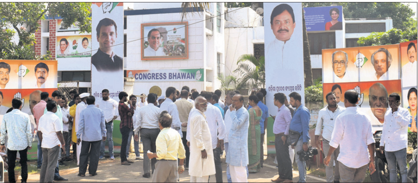
ଭୁବନେଶ୍ୱର ପିପିସି କାର୍ଯ୍ୟକ୍ରମରେ ଭୋଟ ଦେବା ପାଇଁ କଂଗ୍ରେସ ନେତାଙ୍କ ଭିଡ଼

ନୂଆଦିଲ୍ଲୀ, ୧୭।୧୦ କଂଗ୍ରେସ ଅଧ୍ୟକ୍ଷ ନିର୍ବାଚନ ଯୋଗ୍ୟ ଅବସର ୪୮ ବର୍ଷରେ ସରଳା ସୋନିଆ ବରିଷ୍ଠ ନେତା ମିଳିତ ଭାବେ କଂଗ୍ରେସ ଜୋଡ଼ା ଯାତ୍ରା ପ୍ରତିଯୁକ୍ତ ହୋଇଥିବାବେଳେ କାହା ହାତରେ ଦଳର ନେତୃତ୍ୱ ରହିବ ତାହା ୧୯ ତାରିଖ ଭୋଟ ଗଣତି ପରେ ଜଣାପଡ଼ିବ। ପ୍ରାୟ ୯,୪୦୦ ପ୍ରତିନିଧି ସୋନିଆ ମତ ସାଧ୍ୟତା କରିଥିବା ଦଳର କେନ୍ଦ୍ରୀୟ ନିର୍ବାଚନ କମିଟିର ଅଧ୍ୟକ୍ଷ ନିର୍ବାଚନ ସମ୍ପର୍କରେ କହିଛନ୍ତି। କଂଗ୍ରେସର ଅନ୍ତରାଣ୍ୟ ଅଧ୍ୟକ୍ଷ ସୋନିଆ ଗାନ୍ଧୀ ଏଆଇସିଏ କାର୍ଯ୍ୟକ୍ରମରେ ଭୋଟ ଦେଇଥିଲେ। ମୋଟାମୋଟି ଭୋଟ ହାର ୯୬ ପ୍ରତିଶତ ରହିଛି।