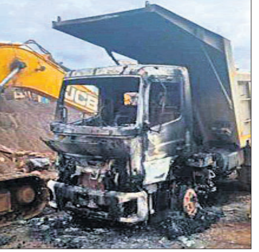
ମାଓବାଦୀ ଜାଲିଦେଇଥିବା ଗାଡ଼ି।