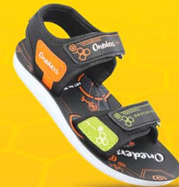
[ Art No : WK636 ]