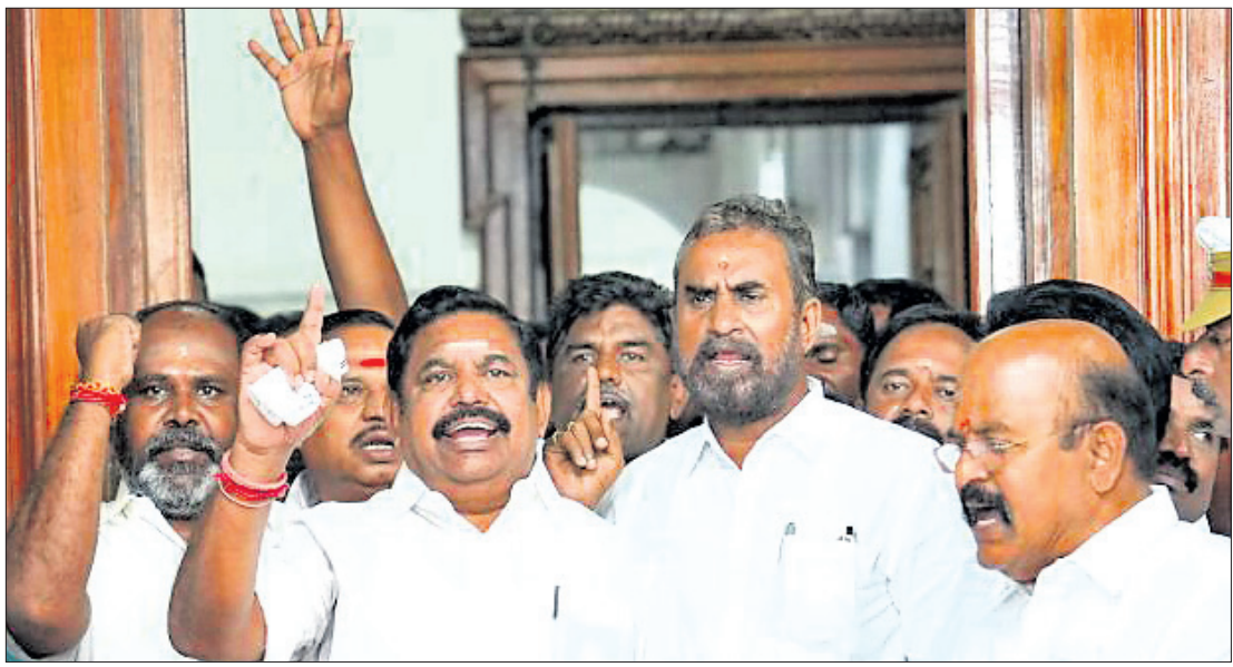
ତାମିଲନାଡୁ ବିଧାନସଭାରେ ମଙ୍ଗଳବାର ବିଶ୍ୱାସୀନତା ଆନ୍ଦୋଳନ ପାଇଁ ବିରୋଧୀ ଦଳ ନେତା କେ. ପଲାନିସାମୀ ଓ ତାଙ୍କ ଏଆଇଏସ୍‌ଏମ୍‌ସିଏସ୍ ବିଧାୟକମାନଙ୍କୁ ଗୃହସ୍ଥ ବାହାର କରିଦିଆଯାଇଛି। ବିରୋଧୀ ଦଳ ସଦସ୍ୟମାନେ ହତଗୋଳ କରି ଗୃହ ଚଳାଇ ନ ଦେବାକୁ ବାଟସୂଚି ଏମ୍. ଅପାଭୁଙ୍କ ନିର୍ଦ୍ଦେଶକ୍ରମେ ମାଣିଲମାନେ ସେମାନଙ୍କୁ ଗୃହସ୍ଥ ବାହାର କରିଦେଇଥିଲେ।