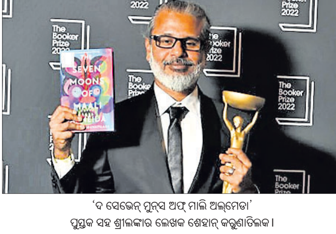
'ଦ ସେଭେନ୍ ମୁନ୍ସ ଅଫ୍ ମାଲି ଅଲ୍‌ମୋଡା' ପୁସ୍ତକ ସହ ଶ୍ରୀଲଙ୍କାର ଲେଖକ ଶେହାନ୍ କରୁଣାତିଳକ।