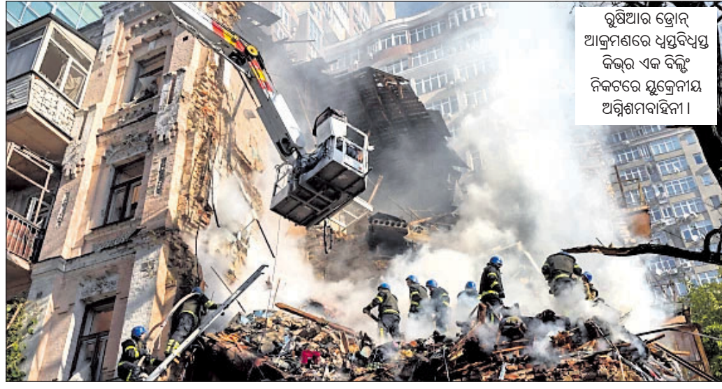
ରୁଷିଆର ହୋଇଛି ଆକ୍ରମଣରେ ଧ୍ଵସ୍ତବିଧିସ୍ତ କିଭର ଏକ ବିକ୍ରି ନିକଟରେ ସୁକ୍ରେନ୍‌ର ଅଗ୍ନିଶମବାହନ।

ସୁକ୍ରେନ୍ ଆକାଶରେ ଉଡ଼ୁଛି ଆତ୍ମାତୀତା ହୋଇଛି। ରୁଷିଆ ଦ୍ଵାରା ବ୍ୟବହୃତ ଏହି ଅତ୍ୟାଧୁନିକ ବିଦେଶୀ ଅସ୍ତ୍ର ସୁକ୍ରେନ୍‌ର ଉତ୍ପାଦନ ଶକ୍ତି ଓ ଜଳ ଭିତ୍ତିଭୂମିକୁ ନଷ୍ଟ କରିବା ପାଇଁ ଯତ୍ନେଶୁ। ମସ୍କୋ ଏଥିରେ ଅନେକାଂଶରେ ସଫଳ ହୋଇଛି। ଶୀତଳରୁ ଆରମ୍ଭ ହେବାକୁ ଆକାଶମାର୍ଗକୁ ରୁଷିଆ ସୈନ୍ୟଙ୍କ ସଦ୍ୟ ଘାତକ ଆକ୍ରମଣରେ ସୁକ୍ରେନ୍‌ର ପ୍ରାୟ ଏକତୃତୀୟାଂଶ ପାଉଁର ଖଣ୍ଡିତ ହୋଇଛି। ଫଳରେ ସୁକ୍ରେନ୍‌ର ଅନେକ ସହରକୁ ବିଦ୍ୟୁତ୍ ସରବରାହ ବନ୍ଦ ହୋଇଛି। ଏଥିରେ ଲାକ୍ଷାଧିକ ସୁକ୍ରେନ୍‌ରାସୀ ପ୍ରଭାବିତ ହୋଇଛି। ଏହା ପରେ ରୁଷିଆ ରାଷ୍ଟ୍ରପତି କ୍ଲିମିନ୍ ଫିଲିପ୍‌ଙ୍କ ସହ ଆଲୋଚନା ସବୁ ବାଟ ବନ୍ଦ ହୋଇଯାଇଛି ବୋଲି ମଙ୍ଗଳବାର ସୁକ୍ରେନ୍ ରାଷ୍ଟ୍ରପତି ଭୋଲୋଡିମିର ପୁଟିନ୍‌ଙ୍କୁ କହିଛନ୍ତି। ରୁଷିଆ-ସୁକ୍ରେନ୍ ଯୁଦ୍ଧର ୮ ମାସ ମଧ୍ୟରେ ଏତଳି ଅବସ୍ଥା କେବେ ଦେଖିବାକୁ ମିଳି ନ ଥିଲା। ସୁକ୍ରେନ୍ ସମେତ ସୁରୋପାୟ ରାଷ୍ଟ୍ରକୁଟିକରେ ଶୀତରତ୍ନ ଆସିଯାଇଛି।