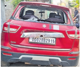
ବୋମାମାଡ଼ରେ ଗାଡ଼ିର କାଚ ଚୁରମାଡ଼।