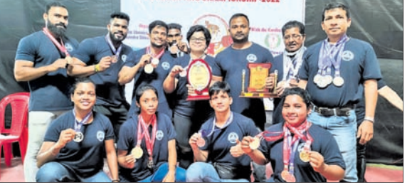
ପଦକ ବିଜୟୀ ଓଡ଼ିଶା ପ୍ରତିଯୋଗୀ।