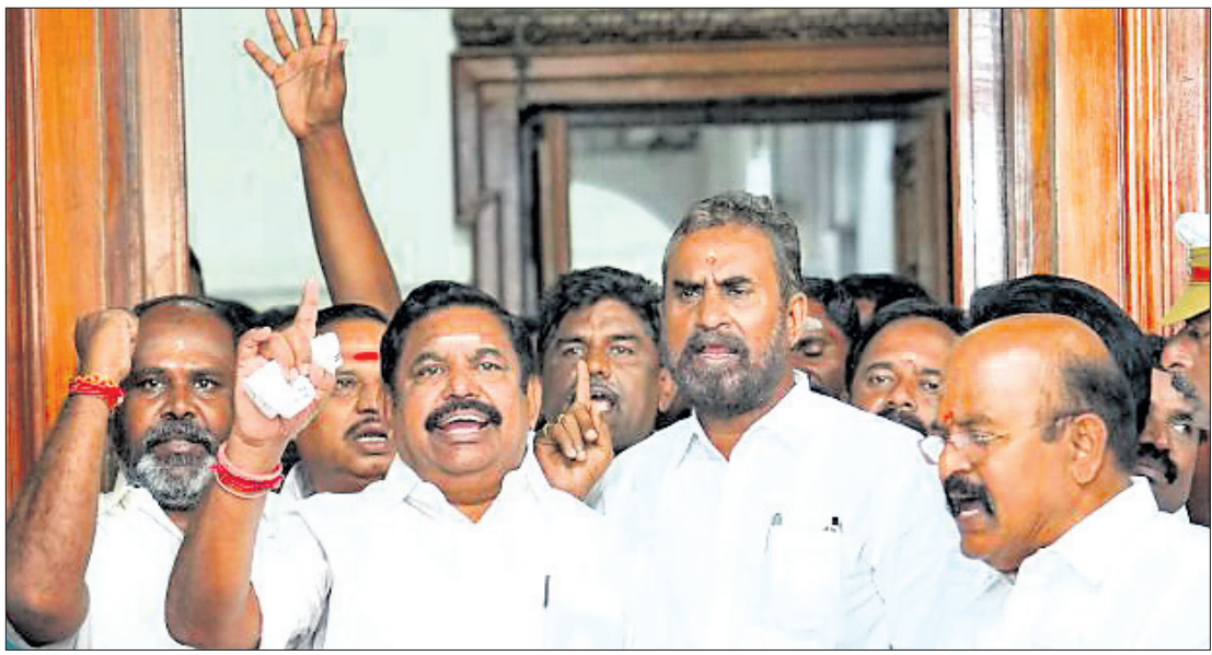
ତାମିଲନାଡୁ ବିଧାନସଭାରେ ମଙ୍ଗଳବାର ବିଶ୍ୱଜିତ ଆଚରଣ ପାଇଁ ବିରୋଧୀ ଦଳ ନେତା କେ. ପଲାନିସାମୀ ଓ ତାଙ୍କ ଏଥାଇସ୍‌ସମ୍ପର୍କିତ ବିଧାୟକମାନଙ୍କୁ ଗୃହସ୍ଥ ବାହାର କରିଦିଆଯାଇଛି। ବିରୋଧୀ ଦଳ ସଦସ୍ୟମାନେ ହତଗୋଳ କରି ଗୃହ ତଳାଢ଼ି ନ ଦେବାକୁ ବାଚସ୍ପତି ଏମ୍. ଅପାଭୁଙ୍କ ନିର୍ଦ୍ଦେଶକ୍ରମେ ମାଣିଲମାନେ ସେମାନଙ୍କୁ ଗୃହସ୍ଥ ବାହାର କରିଦେଇଥିଲେ।